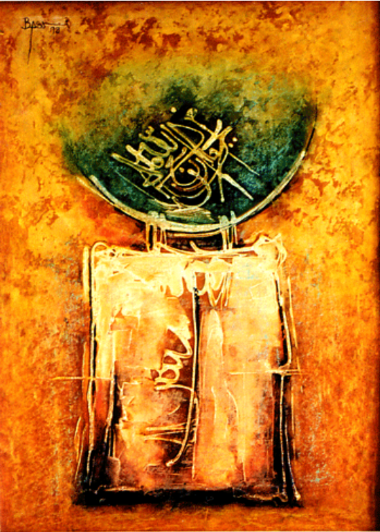
من اعمال الفنان سلمان البصري

قفرّيت من بين اصابعي خبول ظمأى ونساء مسجيات وغايات تلوث محترقة بالأرواح ومدن جدرانها لطخات دماء وانهارها ظمأ وارقتها رايات محترقات ويايتها نشووز إلى الأين ارتبك المعنى بين شفتيّ وانبرى قلبي صارخا: ايها الواقف بين النور والظلام حذار فقد انسلت منها عيون من حجر