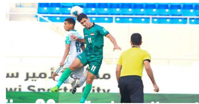
منتخبنا الشبابي في لقاء سابق

25 منه. ففي المجموعة الأولى يلعب منتخبنا أول مبارياته أمام الإمارات في 17 آذار. وفي التاسع عشر منه يلتقي فلسطين. علما أن المجموعة الثانية تضم السعودية والبحرين ولبنان. ويتأهل أول وثاني كل مجموعة للعب في دور التفاضل. بنصف النهائي للبطولة.