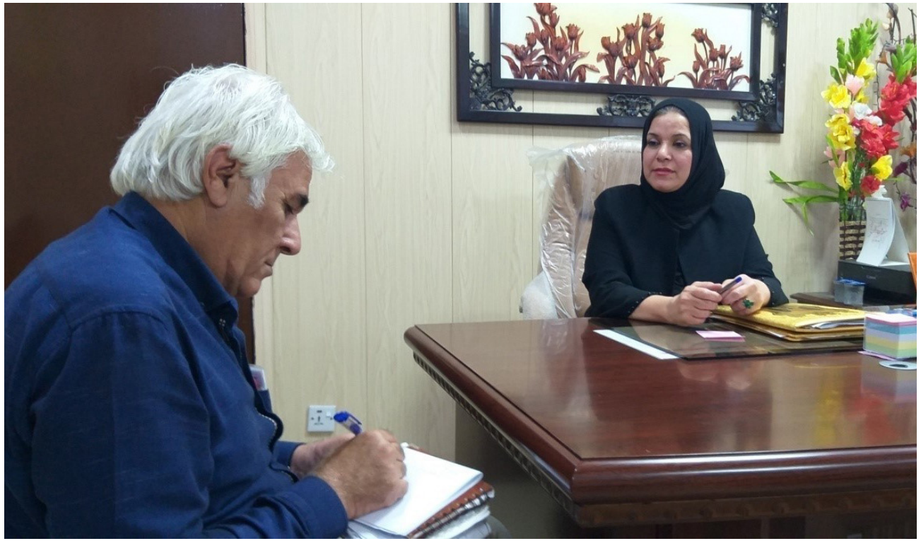
مديرة مستشفى البصرة للنسائية والأطفال في البصرة تتحدث لمراسل (الصبح الجديد)

الطبيعية تمثل خطراً على صحتها وهناك بعض الحالات الأخرى التي يؤخذ فيها قرار نوع الولادة باقترب وقتها. وغالباً ما يكون في الشهر الأخير مثل رأس الجنين لم يتخذ الوضع الطبيعي للولادة مع دخول رأس الجنين في قناة الولادة. إما بسبب وضع الجنين داخل الرحم أو بسبب حجم الجنين ووجود عيب خلقي معين في الرحم يتعارض مع الولادة الطبيعية أو مضاعفاتها المحتملة بعد الولادة. أما في بعض الحالات الأخرى. فيكون قرار الولادة القيصرية غير مخطط له بالبرة. وعادة