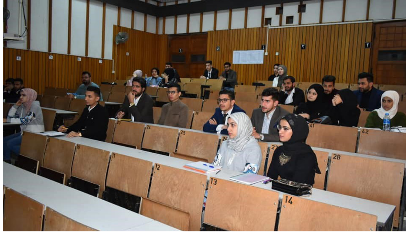
جانب من ندوة جامعة البصرة عن الأنظمة الكهربائية وتطبيقاتها ومخاطرها