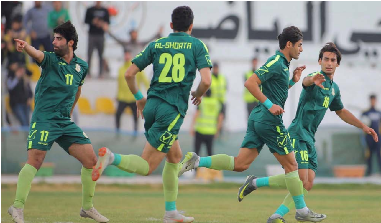
لاعبو الشرطة يحتفلون بهدف في مرمى الكهربياء