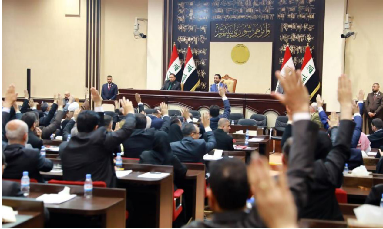
جلسة سابقة لمجلس النواب "ارشيف"

بغداد - الصباح الجديد: عجلت وزارة الصحة أمس الثلاثاء بتحديد ايقاف دخول الوافدين الاجانب من دول عدة تفاديا لفيروس كورونا. وأضافت أن "هناك كتل شعبيّة من قبل المواطنين في المنفذ الحدودية خلال الاربعة عشر يوما الماضية".