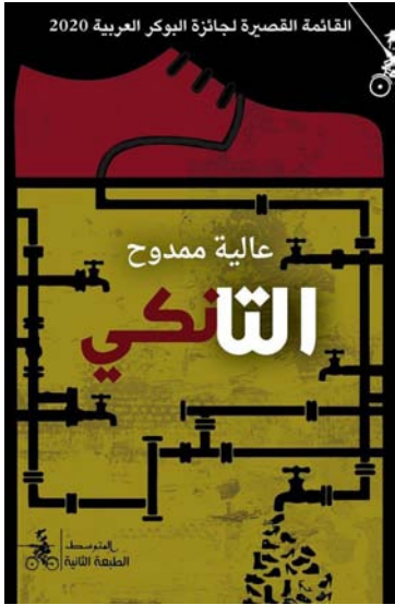
الفنانة القصيرة لجائزة البوكر العربية 2020

عالية ممدوح كاتبة وروائية عراقية. مواليد بغداد ١٩٤٤. خريجة علم النفس من الجامعة المستنصرية عام ١٩٧١، شغلت وظيفة رئيسة تحرير جريدة (الراصد) البغدادية الأسبوعية لأزيد من عشر سنوات. غادرت بغداد منذ ١٩٨٢، وتنقلت بين عواصم ومدرستى. تقيم حالياً في باريس. أصدرت عام ١٩٧٣ مجموعة قصصية بعنوان: «افتتاحية للضحك»، ومنها تولت أعمالها الأدبية: ثمان روايات منها: «ليلي والذئب»، 1980. «الجووبات» الحائزة على جائزة نجيب محفوظ للرواية، 2004. و«الأجنبيه»، سيرة روائية، 2013. ترجمت بعض رواياتها إلى الإنجليزية، والفرنسية، والإيطالية، والإسبانية، أشهرها رواية «الفتالين» التي ترجمت إلى سبع لغات، ودرست لمدة سنتين في جامعة السوربون.