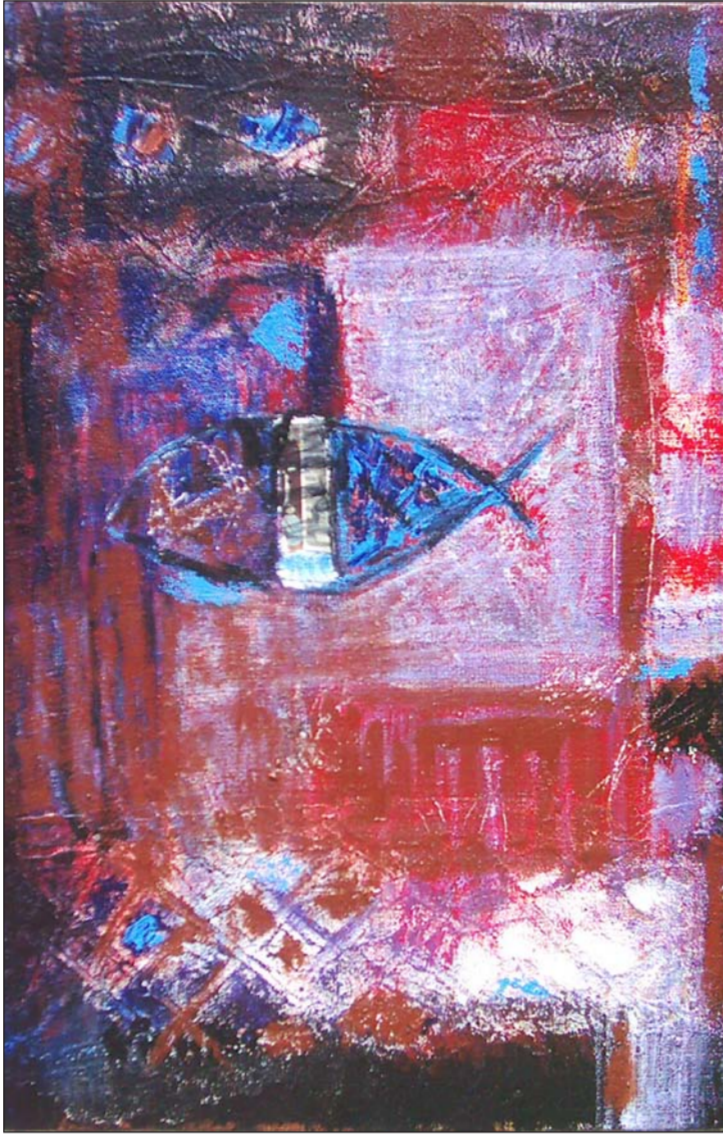
من أعمال الفنان هادي ماهود

أعود إلى مبدأ الحديث، في الشعر والرواية. والخواطر التي سبق وعبرت عنها انطلاقاً من تأمل في مآزقين اثنين، في مآزق الكتابة الشعرية الحديثة، في مراوحتها المثيرة للتعجب في فضاء ما يسمى "الشعر اليومي"، وشيوعه على نحو مسفّ جعل الشعر يخلو غالباً من جوهر فكري أو ميتافيزيقي، وهي قضية مستقلة شغلت جزءاً من مقالتي، ومآزق الكتابة الروائية في ظل تفاقم نوع من السوشال ميديا وميل القراء إلى التعامل أكثر فأكثر مع النصوص القصيرة، والشذرات القصصية، وهو ما يبدو لي تحدياً كبيراً لجنس الرواية التي تقع في عشرات الآلاف من الكلمات، وغالباً ما لا تقل صفحاتها عن 200 صفحة، وهو ما يخلق مشكلة في التلقي تتعلق بالزمن، فقراء اليوم يصرفون أوقانتاً أطول مع السوشال ميديا مما يفعلون مع الكتب الورقية، ولديهم فرص أفضل للتنقل بين النصوص. بما في ذلك الاكتفاء بمقاطع وشذرات من الأعمال الروائية، وقد تنبّه غير كاتب ومفكر في الغرب إلى هذه الحقيقة المستجدة في علاقة القراء بالأدب الروائي.