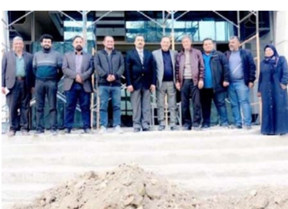
والفنية اضافة الى السرداب الذي خصص للاقسام الادارية والخدمية الاخرى . وتضمن

العمل تغليف البناية بواجهة حديثة مستوحاة من تراث العمارة العراقية الاصيل يتم تشييدهم بحجر باعذرا والزجاج العاكس الحديث وتطبيق الارضيات بالمرمر مع هيكل حديدي وجهاز البناء بالمصاعد الكهربائية ومنظومات التكيف والسيقف الخانوية . هذا واعلان معاون المدير العام خلال اطلاعه على سير العمل في المشروع عن استمرار وتيرة العمل المكثف للوصول الى نتيجة تليق بسمعة الشركة . وان الشركة عازمة على تنفيذ العمل على وفق ماهو مخطط له باحث الموصفات الفنية .