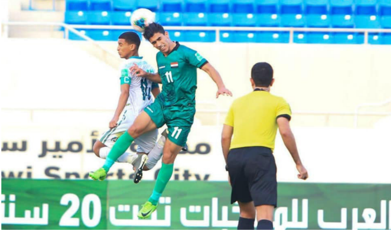
صراع على الكرة في مباراة أمس بين منتخبنا الشبابي وموريتانيا

الجوية لصدارة الدوري. برصيد 6 نقاط. في حين يتخيل الصناعات الكهربائية الجدول دون نقاط. في حين عبّر عباس عطية، مدرب الكهرباء، عن تأثر لاعبي فريقه بدنياً، بمواجهة الزوراء، والقوة الجوية، في جولتين المقبلتين بالدوري العراقي. وقال عطية: «الفريق سيعاني من ضغط المباريات الكبيرة بعيد مباراة بندية أمام الشرطة والتي انتهت بالتعادل (3-3) ستكون مبارياتي الجولة الثالثة والرابعة أمام الزوراء والقوة الجوية». وأضاف «هذه المواجهات سيعرض اللاعبين جهد بدني جبار القربة التي وضعنا بمواجهات متعاقبة مع الأندية الجماهيرية.. وأثنى عطية، على أداء لاعبيه أمام الشرطة، مؤكداً أن الفريق كان يستحق النقاط الثلاث، لكننا خرجنا بنقطة التعادل رغم تقدمنا في 3 مرات.