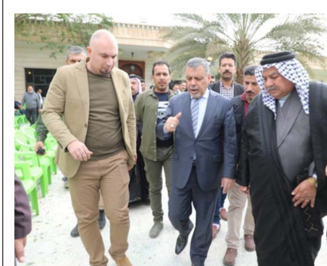
وتصحيح وضع مناسب للماء في الشبكة المحلية . وكان هناك مقترح لربط المنطقة بالطريق الجنوبي بغداد برفقة عضو مجلس النواب حسن شويرد الحمادني والتقى بعدد من وجهاء الناحية مستمعاً لأبرز احتياجاتهم . وأشار العطا . الى ان "ناحية الرشيد عانت الإهمال في الفترة الماضية رغم تقديمها للتضحيات واستيعابها التازحين". مؤكدا "تمت مناقشة مشكلات الكهرباء في الناحية واتخذنا إجراء بها . اضافة الى موضوع فرز الاراضي من اجل توزيعها وكذلك الباشرة بمشاريع اكساء الشوارع بعد اكتمال شبكة المجاري بنسبة 98% وبناء مدرسة في كويريش

بغداد - الصباح الجديد : تفقد محافظ بغداد المهندس محمد العطا ناحية الرشيد جنوبي بغداد برفقة عضو مجلس النواب حسن شويرد الحمادني والتقى بعدد من وجهاء الناحية مستمعاً لأبرز احتياجاتهم . وأشار العطا . الى ان "ناحية الرشيد عانت الإهمال في الفترة الماضية رغم تقديمها للتضحيات واستيعابها التازحين". مؤكدا "تمت مناقشة مشكلات الكهرباء في الناحية واتخذنا إجراء بها . اضافة الى موضوع فرز الاراضي من اجل توزيعها وكذلك الباشرة بمشاريع اكساء الشوارع بعد اكتمال شبكة المجاري بنسبة 98% وبناء مدرسة في كويريش