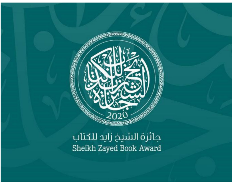
جائزة الشيخ زايد للكتاب Sheikh Zayed Book Award

يذكر أنّ فرع المؤلف الشاب استقبل 498 مشاركة هذا العام، وفرع الأدب استقبل 438 عملاً بينما استقبل فرع