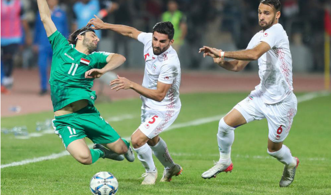
منتخبنا الوطني في مباراة سابقة

أربيل والحدود في ملعب فرانسوا حريري في الساعة الثانية والنصف من بعد الظهر. إلى ذلك، أعلنت لجنة المسابقات في الاتحاد المركزي لكرة القدم