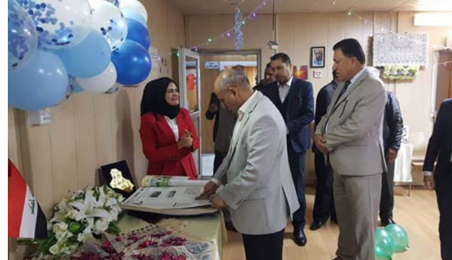
الأقاليم خُفِّل بأرشفة منجزاتها

المجلات الارشيفية التي تمثل تاريخاً حافلاً للدائرة وجهود العاملين فيها.