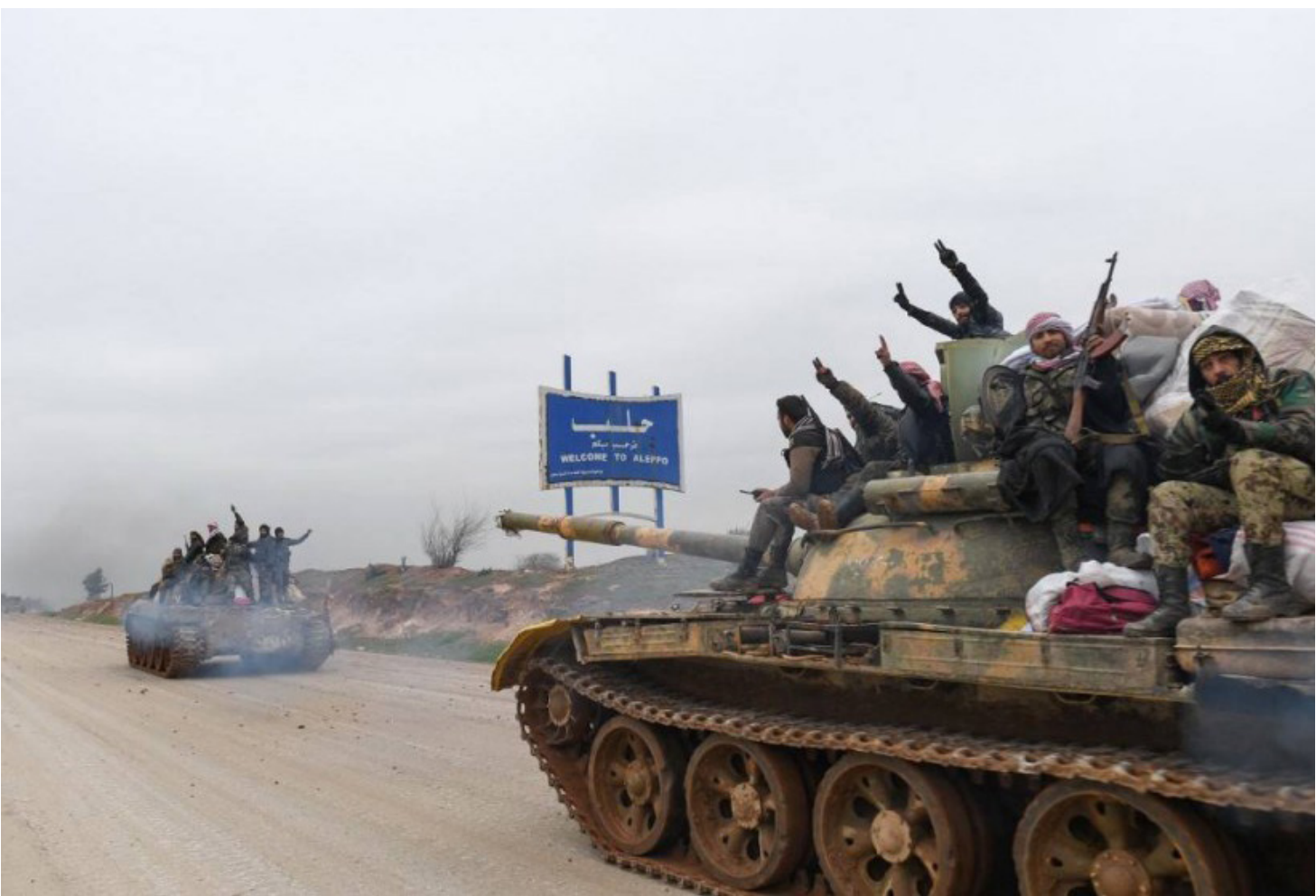
القوات السورية تستعيد معظم حلب قبل يوم من محادثات جديدة بين تركيا وروسيا

ونقلت وكالة الأنباء العربية السورية عن الأسد قوله خلال لقاء مع رئيس البرلمان الإيراني علي لاريجاني «المنعذب السوري مصمم على خيبر كامل الأراضي السورية من الإرهاب».