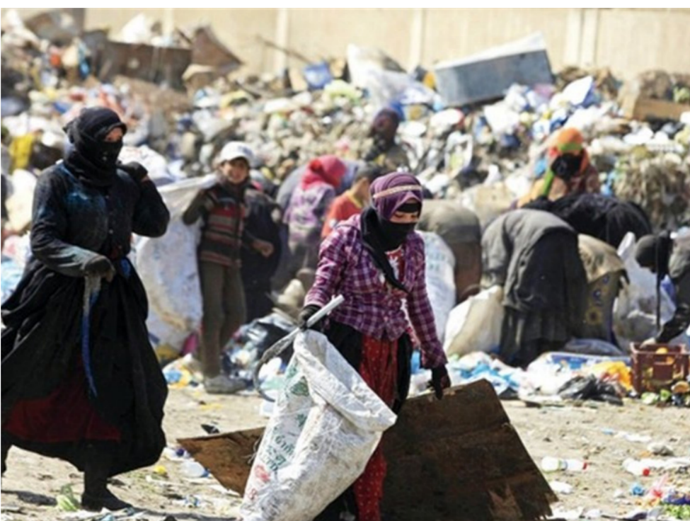
وفي تشرين الثاني الماضي أصدرت وزارة التخطيط بياناً بمناسبة اليوم العالمي للقضاء على الفقر، صادر عن الإدارة التنفيذية لستراتيجية التخطيط من الفقر في الوزارة، وكانت مؤشرات الفقر شهدت تراجعاً في معدلاتها خلال العام الماضي 2018 وذلك وفقاً للمسح الذي نفذته وزارة التخطيط لرصد وتقويم الفقر في العراق الذي شمل جميع

محافظات العراق بما فيها محافظات إقليم كردستان، إذ سجل مؤشر الفقر انخفاضاً من 22.5% عام 2014 إلى 20% عام 2018، في حين لا تزال محافظة المنى محافظة الأكثر فقراً بين المحافظات بنسبة وصلت إلى 52%. ويبلغ متوسط انفاق الاسرة خلال السنة الماضية (1503) مليون دينار شهرياً وارتفع معدل التحاق الصافي في المرحلة الابتدائية إلى 93%، وفي الدراسة المتوسطة إلى 75%، كما ارتفعت نسبة الاسر المرتبطة بشبكة الماء الصافي إلى 92% عام 2018. وأظهرت نتائج المسح ان نسبة البطالة سجلت 13.8%، طبقاً لمعايير منظمة العمل الدولية، وترتفع نسبة البطالة بين الشباب إلى 19%، وكانت مؤشرات البطالة قد قاربت 30% عام 2005 وانخفضت إلى 11% عام 2013 إلى انها عادت الارتفاع عام 2014 بسبب الازمة الاقتصادية والاقتصادية التي تعرض لها العراق.