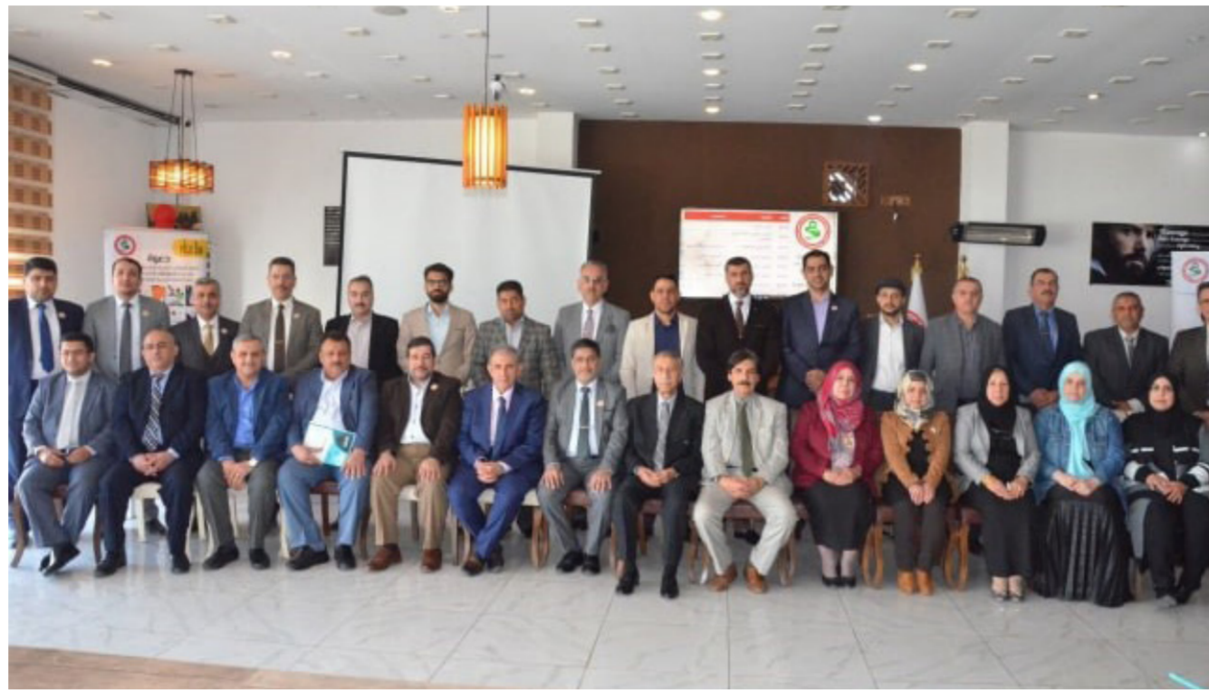
جانب من اجتماع الهيئة العامة للجمعية العراقية للبحوث والدراسات الطبية