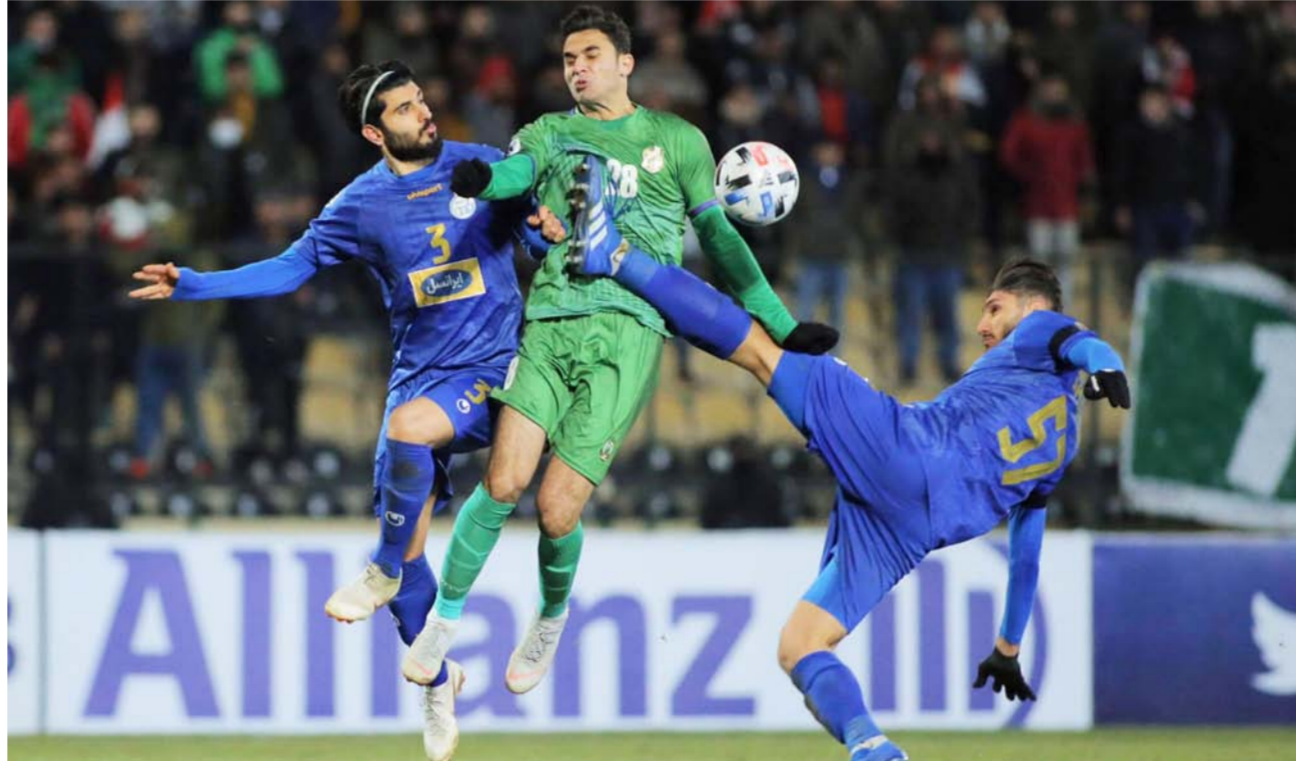
لقطة من مباراة الشرطة واستقلال في الجولة الأولى