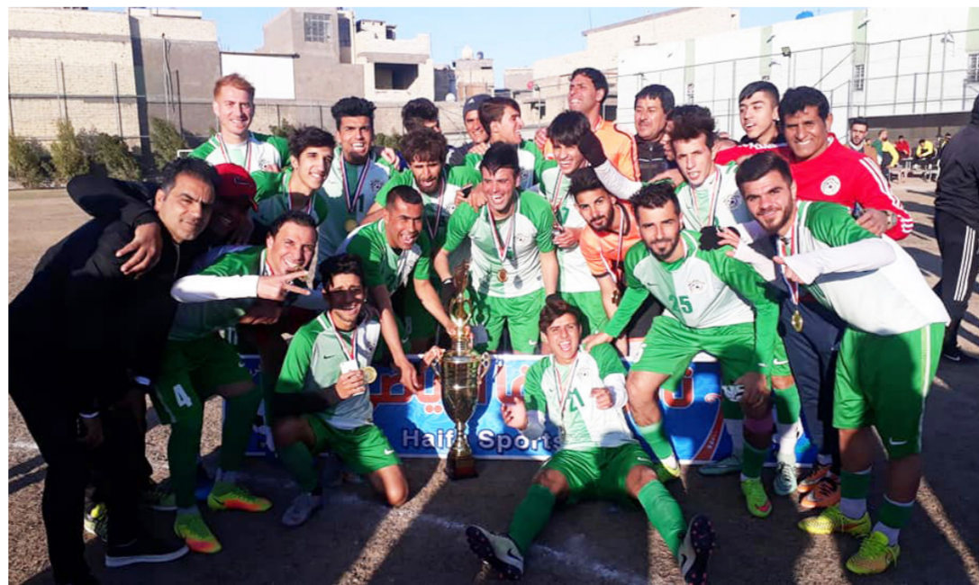
فريق آليات الشرطة يحتفل باحراز كأس البطولة