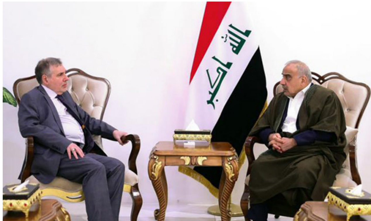
عبد المهدي وعلاوي

بغداد - وعد الشمري: حملت خالف النصر بزعامة حيدر العبادي، أمس الأحد، الكتل السياسية المتبينة لترشيح رئيس الوزراء المكلف محمد توفيق علاوي مسؤولية التخلي عنه، داعياً الحكومة المقبلة إلى الكشف عن قتل المتظاهرين واعداد موازنة "عادلة"، مشدداً على إجراء انتخابات مبكرة بأشراف أمي. وقالت المتحدث باسم التحالف مروة الظفر، في حديث إلى "الصباح الجديد"، إن "تكليف محمد علاوي بتسييل الحكومة أصبح امراً واقعاً ولا يمكن الاعتراض عليه في الوقت الراهن". وتابعت الظفر، أن "معايير تم وضعها بشأن الكابينة الوزارية التي ينبغي على رئيس الحكومة المكلف تشكيلها وفي ضوء ذلك سيتم اتخاذ الموقف بشأن منح الثقة في مجلس النواب من عدمها". وأشارت، إلى ان "المشكلة التي تواجهها هي عدم وجود كتلة