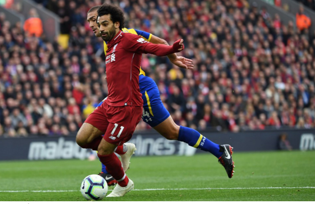
صلاح يواصل تألقه في إنجلترا

في المركز الثالث، برصيد 49 نقطة، متقدماً بفارق 8 نقاط على تشيلسي، صاحب المركز الرابع. وحسم ريال مدريد زعامة العاصمة بفوزه على أتلتيكو مدريد بهدفين من دون رد أول أمس ضمن الأسبوع الثاني والعشرين من مسابقة الدوري الإسباني لكرة القدم.. وكسر الفرنسي كرم بنزعة عقده بتسجيله الهدف الأول له في مباراة 16 أمام أتلتيكو على أرض ملعب سانتياغو برنابيو مستفيداً من تمريرة مواطنه ميندي (56).. وسيطر ريال مدريد بالجملة على اللقاء وكان الطيرف الأخطر، فيما تكفل البلجيكي تيبو كورتوا بإبطال مفعول بعض مرذات أتلتيكو مدريد.. وصار رصيد ريال مدريد 49 نقطة بالصدارة. وفي الدوري الألماني، واصل بايرن ميونخ انتصاراته المتتالية وفاز خارج أرضه على حساب ماينز (3-1)، في إطار الجولة 20. أهداف بايرن جاءت عن طريق روبرت ليفاندوفسكي، توماس مولر وتياجو ألكانتارا في الدقائق 8، 14 و26، في حين أحرز جيرميه جستي هدف ماينز الوحيد في الدقيقة 45.