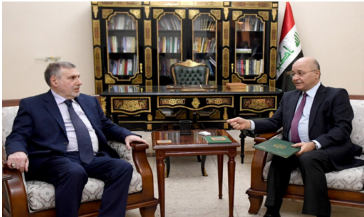
برهم صالح يكلف محمد توفيق علوي

تحدثوا عن حوارات معمّقة سبقت ترشيحه لرئاسة الحكومة برعاية رئيس الجمهورية نواب: أغلب الكتل السياسية دعمت تكليف علوي بعد اتفاق مكونات البيت الشيعي السياسي عليه