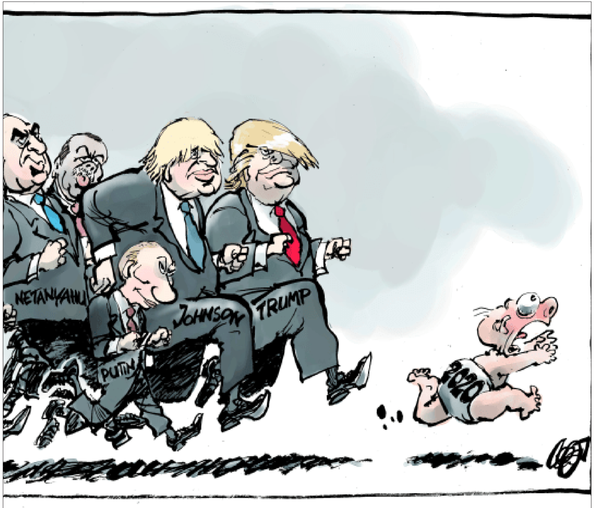
عن موقع «كارتون سياسي»