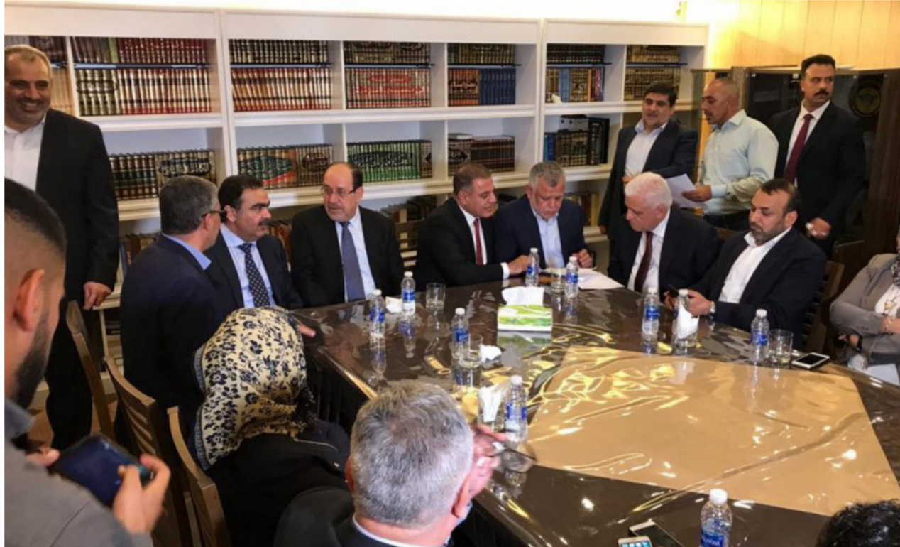
اجتماع سابق لقيادة كتلة البناء "رشيف"