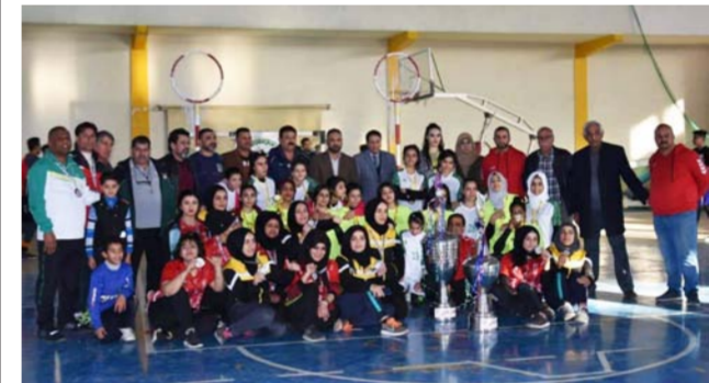
لقطة تذكارية في ختام البطولة