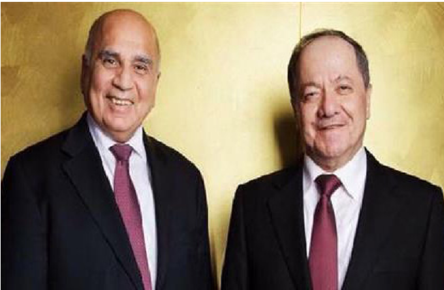
مسعود بارزاني وفؤاد حسين

واضاف ان زعماء خالف البناء خبروا صالح بين قبول مرشحهم لرئاسة الوزراء او تقديم استقالته من منصبه. وانشأ السلي الى ان برهم صالح قال بانته يفضل الاستقالة على القبول بتلك الاملاءات. واكد ان عودة برهم صالح الى السليمانية الخميس جاءت عقب اتصال هاتفى اجراه مع جلّ الرئيس مام جلال بافل طالبانى. الذي دعاه الى العودة الى السليمانية حفاظا على امته وسلامته. مفضلاً بقاء صالح في منصبه وعدم تقديم الاستقالة. مبدياً استعدادة للحفاظ على امته وسلامته. مؤكداً ان السفارة الاميركية في بغداد اشرفت على عودة برهم صالح الى السليمانية وامنت له سلامة وصوله الى المطار. واشار المصدر. الى ان صالح جوفقه الراض لتسمية مرشح كتلة البناء اسعد العيداني رمى الكرة مجدداً في ساحة مجلس النواب والقوى والاحزاب السياسية لتقدم مرشحا يكون مقبولا من قبل الشارع والاطراف السياسية ومجلس النواب.