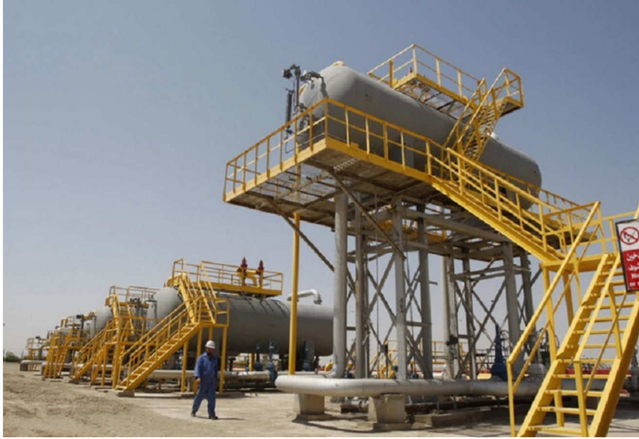
أحد الحقول النفطية

التي كانت لانخفاض قدره 1.7 مليون برميل. وقال جوش جرافيز كبير محللي السوق لدى أريجيه.أو فيوتشرز في شيكاغو، "الخزونات تدفع للمراهنة على ارتفاع الأسعار"، مضيفاً أن قفزة أسعار الأسهم قرب نهاية السنة ساعدت أيضاً في رفع أسعار النفط مع خسن ثقة المستهلكين هذا الشهر. وقالت بيكر هيويز خدمات الطاقة في تقرير مهم لها يوم الجمعة إن شركات الطاقة الأميركية أوقفت عمل ثمانية حضارات نفطية، في أول خفض لعدد الحفارات