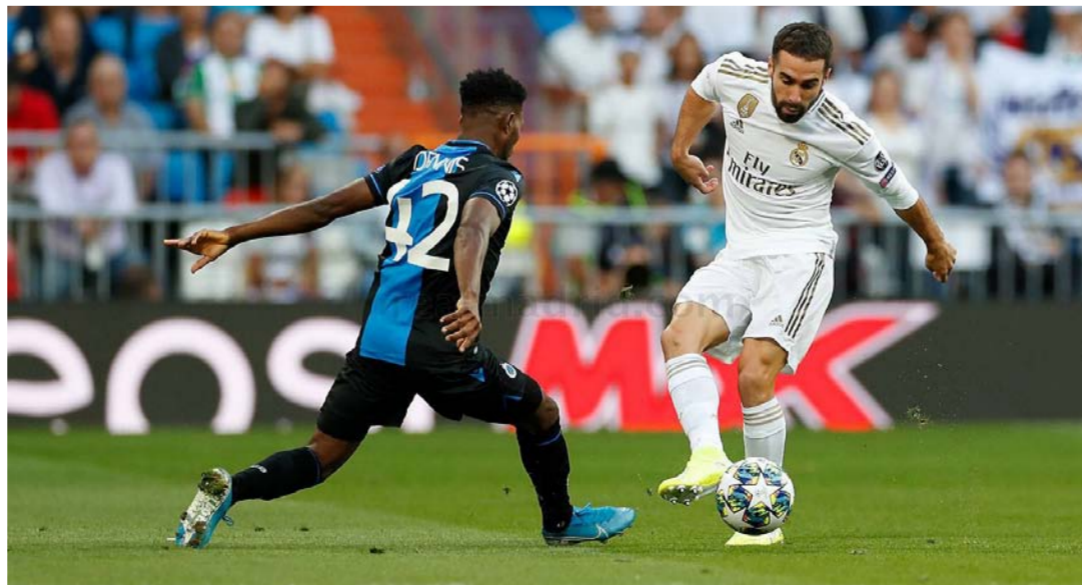
مباراة سابقة لريال مدريد أمام كلوب بروج

سيتي وفشيل شاختار بالفوز على أتلانتا. وينحصر احتمال تأهل أتلانتا بفوزه على شاختار وعدم فوز على ضيفه مانشستر سيتي (11)، بدوره سيتأهل دينامو إذا فاز على