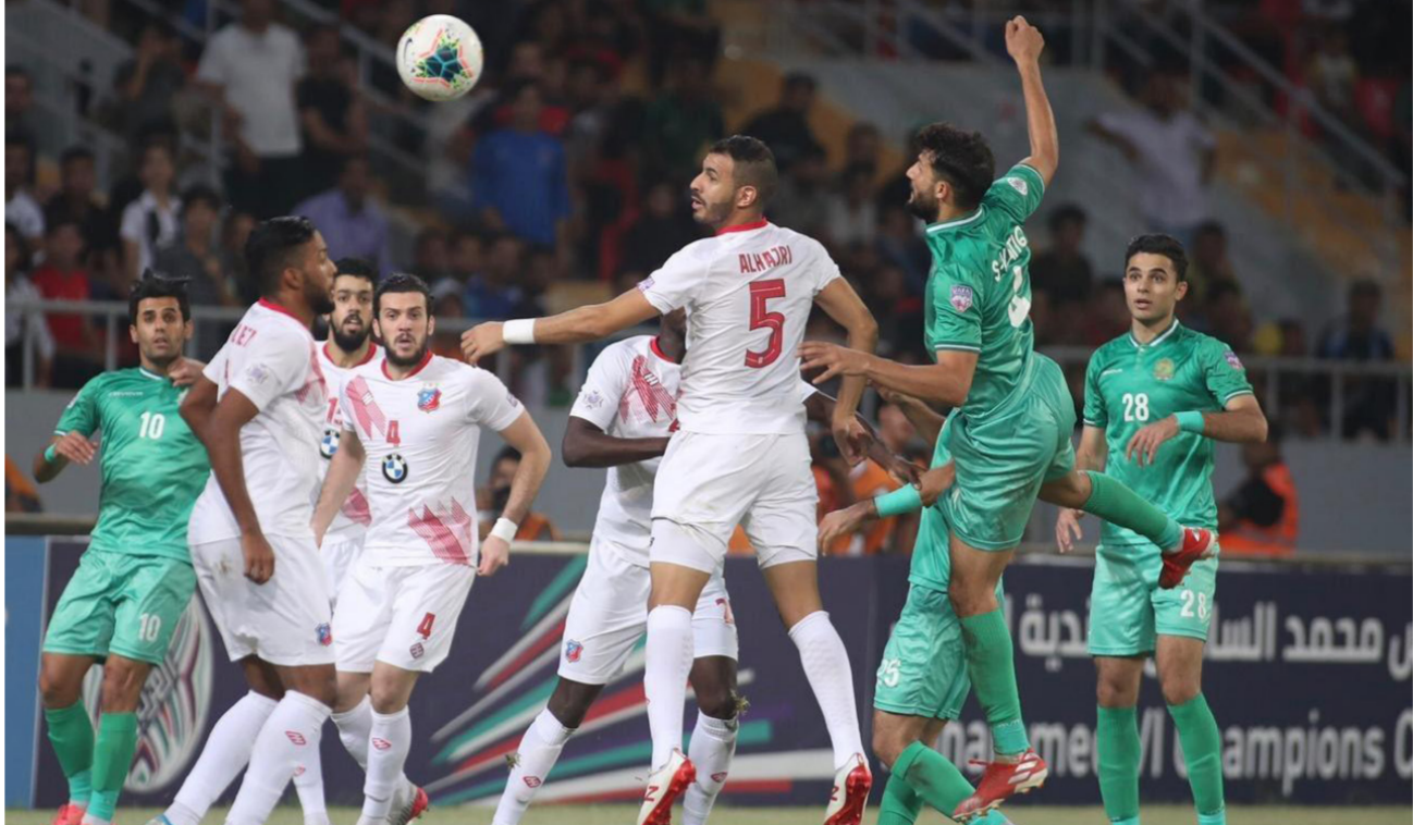
جانب من مباراة سابقة لفريق الشرطة على الصعيد الخارجي

الإماراتي والشرطة العراقي. ملحق الفائز من (الكويت الكويتي، فيصلي الأردني، فريق الريان القطري أو استقلال الإماراتي).