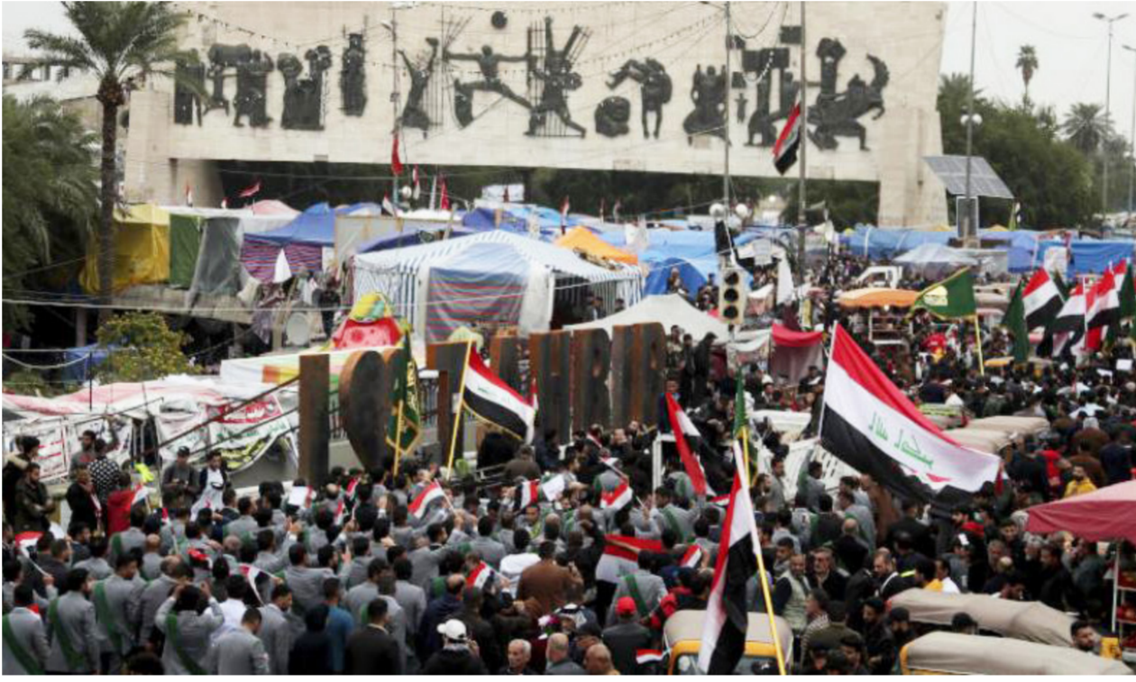
ساحة التحرير امس