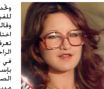
الصالحي 7 آذار المقبل 2020. وكانت عزيزة جلال قد أطلقت على الجمهور في وقت سابق من السنة الجارية

الصبح الجديد - وكالات: يستضيف مهرجان "شنتا طنطورة" السعودي في أواخر الشهر الجاري المطربة المغربية عزيزة جلال في أول حفل لها منذ توقفها عن الغناء قبل ثلاثين عاما. وبحسب صحيفة "عكاظ". فإن عزيزة جلال ستعود إلى الفن من خلال مسرح "مرايا" في السادس والعشرين من الشهر الجاري. ويجري مهرجان "شنتا طنطورة" في محافظة العلا شمال غربي السعودية ويقدم أنشطة فنية وتاريخية وثقافية بين 19 كانون أول