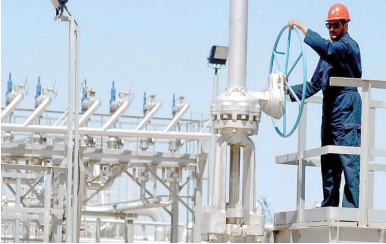
أحد الحقول النفطية

وتعزيز النشاطات النفطية والغازية في هذه المحافظة، ما يساهم في تعزيز الواقع الاقتصادي والتنموي وبالانتاج ولم تنم المصادقة عليه في حينها. وقد تم تغيير صيغة العقد التي عقدت خدمة على غرار عقود جولة التراخيص الرابعة بعد عدة جولات من التفاوض بين الوزارة والشركة. «مدة العقد (34) وتابع جهاد أن «مدة العقد (34) سنة منها (9) سنوات لمرحلة الاستكشاف و(25) سنة لمرحلة التطوير والانتاج وفي حالة تقليص مدة الاستكشاف يضاف ذلك إلى سنوات التطوير والانتاج».