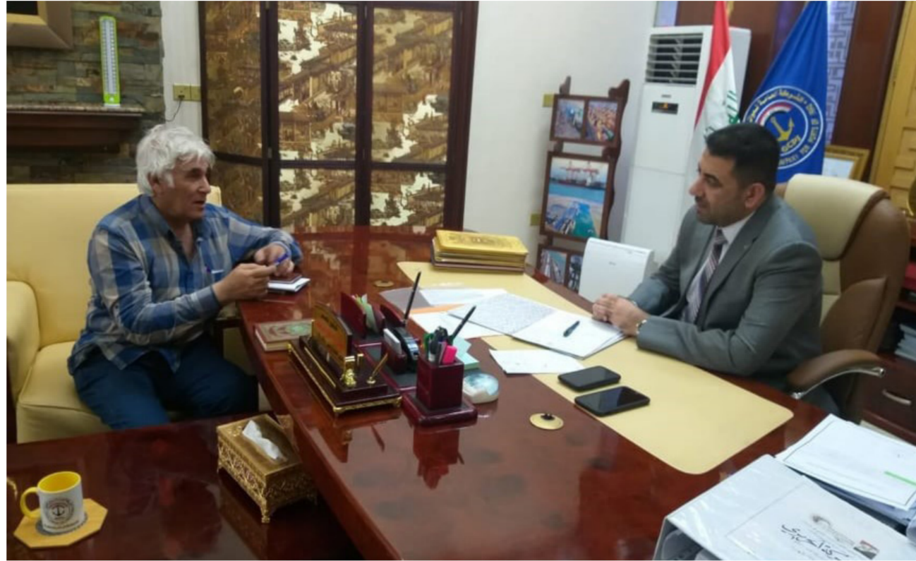
مدير عام شركة موانئ العراق يتحدث لمراسل (الصباح الجديد) في البصرة.