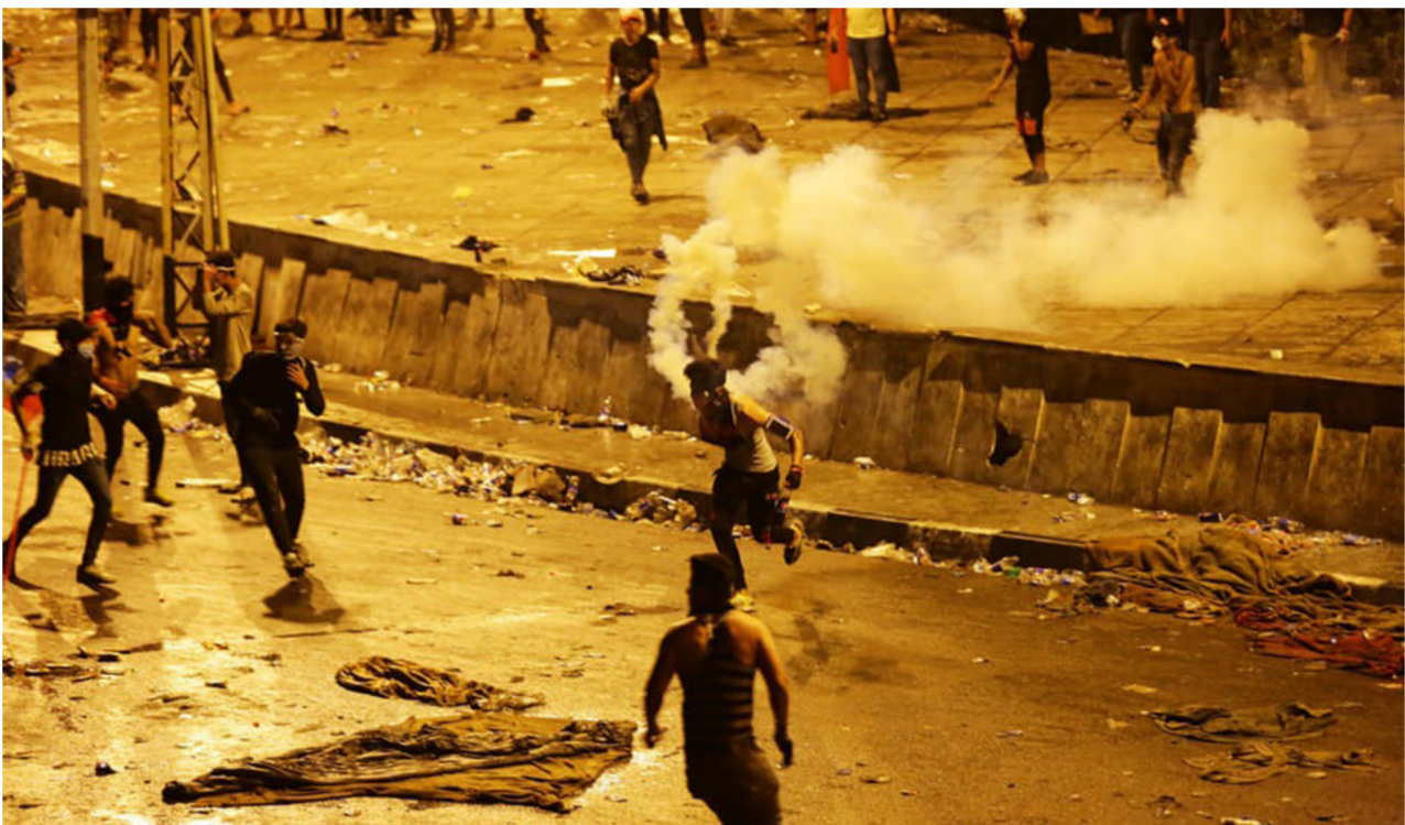
مشهد من ساحة التحرير