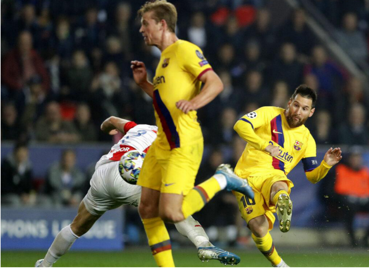
لقطة من مباراة برشلونة وسلافيا

ملعبه هذا الموسم، ليكون أسوأ سجل للفريق في المباريات التي يخوضها خارج الملعب منذ 12 عاما. واحتفى نادي برشلونة، بخمسة الفريقي المرشح للفوز بجائزة الكرة الذهبية، ضمن 20 لاعبة مرشحة لجائزة أفضل لاعبة في العالم.. ونشر الحساب الرسمي لنادي برشلونة، عبر موقع التواصل الاجتماعي «تويتر»، صورة