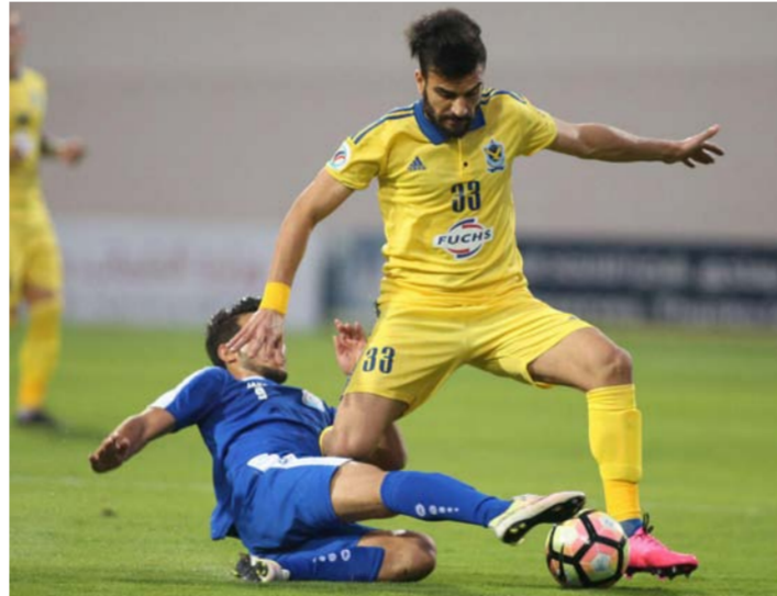
جانب من مباراة سابقة للجوية في البطولة

بغداد - الصباح الجديد: أكد المحترف السوري زاهر ميداني، أن فريقه القوة الجوية مكتمل الصفوف في مباراة يوم الجمعة أمام فريق مولودية الجزائر في ذهاب دور الـ 16 لبطولة كأس محمد السادس للأندية العربية، التي يضيفها ملعب فرانسوا حريزي في أربيل بتواجد جميع اللاعبين وهذا ما سيمنح الجهاز الفني فرصة المناورة بالأوراق التي يمكنها لتحقيق نتيجة الفوز لتسهيل مهمة الوصول إلى ربع النهائي.