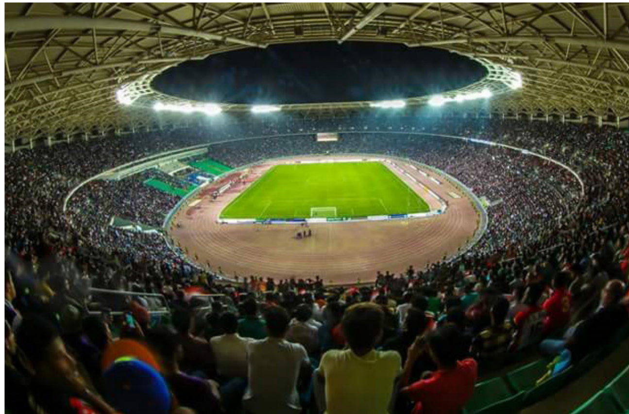
ملعب جذع النخلة

وكذلك المباراة الثانية أمام المنتخب البحريني ضمن التصفيات المزدوجة لنهائيات كأس العالم وأم أسيا». واعتبر خضر هذه الخطوة بأنها «خطوة مهمة ضمن مشروع الحكومة الذي حرص الوزارة بأتمتة ملاعبها وفق ما معمول به في البلدان المتحضرة» متابعاً أن «العسل أشرف عليه مجموعة من مهندسي تكنولوجيا المعلومات في مقر الوزارة ومهندسي ملعب المدينة الرياضية والدائرة الهندسية ضمن التزام شركة أنوار سري المنفذة للمشروع».