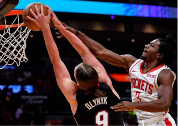
لقطة من المباراة

الموسم، 18 نقطة ومرر تسع كرات حاسمة واستحوذ على سبع كرات مرتدة، كما سجل نديان روبنسون 23 نقطة وأضاف مايز لينارد 21 نقطة. وأبرز جيمس هاردن لاعب روكتس، الذي تصدر قائمه تسجيل النقاط في الدوري في الموسم الماضي، 29 نقطة في 26 دقيقة فقط. واكتفى راسل وستبروك لاعب روكتس، المنضم لفريق كل النجوم ثماني مرات وأفضل لاعب في الدوري عام 2017، بتسجيل عشر نقاط بعد أن شارك لمدة 26 دقيقة فقط.