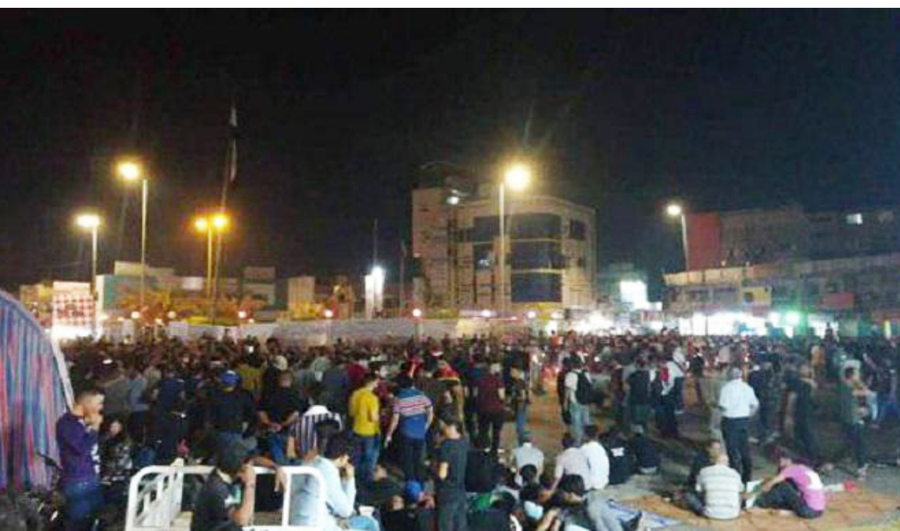
جانب من الاعتصام في احدی المحافظات

بغداد - الصباح الجديد: تداعى منسقون للاحتجاجات الشعبية في العراق امس السبت إلى إقامة اعتصام مفتوح في بغداد ومحافظات الوسط والجنوب. بعد سقوط عشرات القتلى ومئات الجرحى في مظاهرات أمس الأول الجمعة. وإعلان حظر التجول في ثمانية محافظات جنوبي البلاد. وأوردت المفوضية العليا لحقوق الانسان، ان ما لا يقل عن أربعين شخصا قتلوا أمس الأول، عندما تصدت قوات الامن للمتظاهرين الذين خرجوا في احتجاجات جديدة على الفساد وتردي مستوى المعيشة. وذكر سقوط الضحايا بالتظاهرات التي استمرت ما بين الأول والسادس من هذا الشهر. باستشهاد 157 وأكثر من ستة آلاف جريح. وحسب مصدر اتصلت به لصباح الجديد، أن المحتجين نصبوا خياما وسط الساحة، دون أن يقطعوا حركة المرور في الشارع. وكانت الدعوة الى تحويل