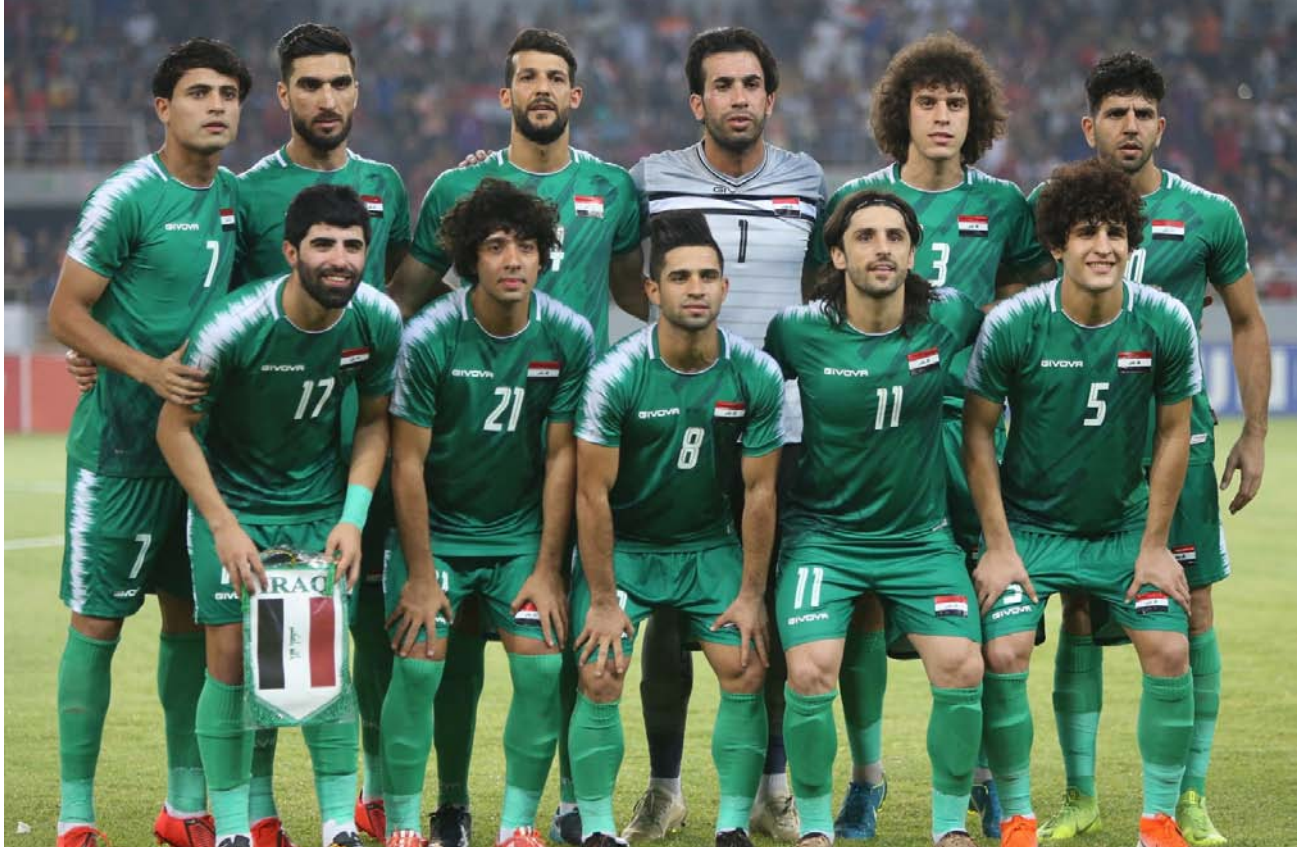
تشكيلة المنتخب الوطني

الأولمبي في المجموعة الأولى التي تضم منتخبات تايلاند والعراق وأستراليا والبحرين. من جانب آخر قررت لجنة المسابقات بإخاد الكرة العراقي تأجيل منافسات الجولة الخامسة من الدوري الممتاز؛ بسبب المظاهرات التي تشهدها البلاد. وينشر اتحاد الكرة. على موقعه الرسمي بياناً أكد من خلاله تأجيل منافسات الجولة الخامسة: لأجل غير مسمى؛ بسبب موجة المظاهرات التي تشهدها عدد من المدن العراقية. التي شهدت صدام أول أمس. يذكر أن الجولات الأربعة من الدوري كذلك شهدت تأجيلاً وإرتباكاً. وهناك أندية لم تخض سوى مباراة واحدة أو اثنتين من الجولات الأربع الماضية. وانتقد مدرب القوة الجوية. أيوب أويشيو. اتحاد الكرة بسبب سوء تنظيم الدوري الممتاز وعدم انتظام المسابقة التي طالبها التأجيل المستمر. وقال أويشيو. في تصريحات صحفية: «الأخاد لم يعمل احترافية إزاء تنظيم الدوري. وهناك مجاملات واضحة في زيادة عدد الأندية. وبالتالي عدم السيطرة على التنظيم». وتابع: «ليس من مصلحة الكرة العراقية هذا العدد المتراكم من الأندية. لو كان العدد أقل سيسهل على الأخاد إقامة دوري نموذجي».