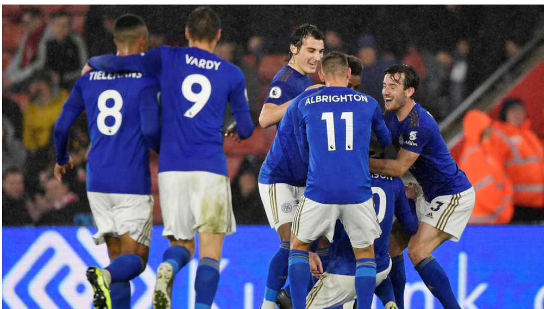
لاعبو ليستر سيتي

واقترح ليستر سيتي تاريخ الدوري الإنجليزي الممتاز من أعظم أوابوه فريفا بتصرف بهذه الطريقة. لم تقائل من أجل أي شيء».