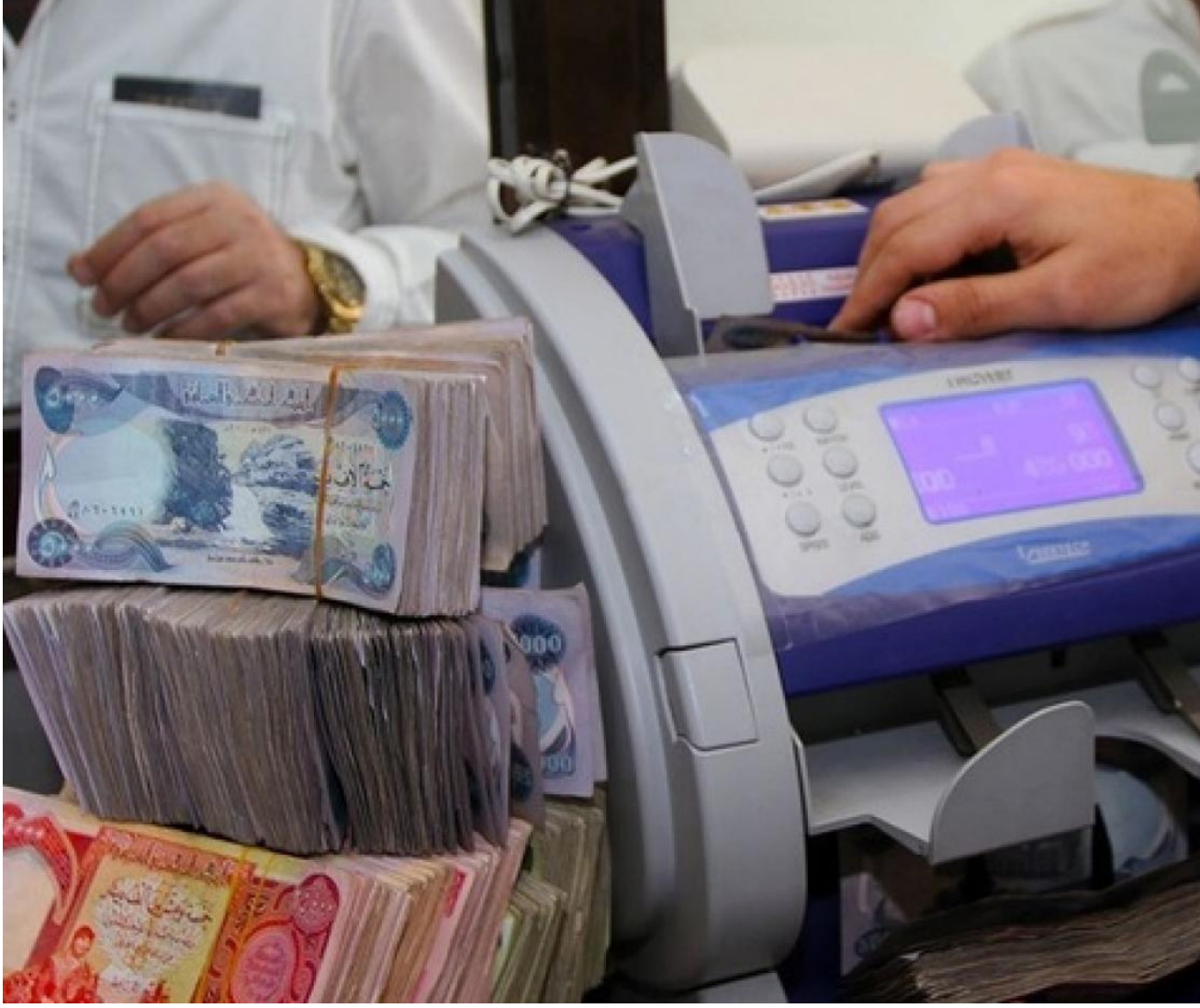
تعاملات مصرفية يومية

في اصل الموازنة، والجزء الاخر تم من خلال النقد المتوفر اصلا في وزارة المالية، في حين سيبقى جزء من العجز حتى نهاية العام الحالي، وسيكون على حساب تقليل النفقات على الجميع، منوها بأن العجز المالي لموازنة العام المقبل غير واضح للعالم حتى الآن.