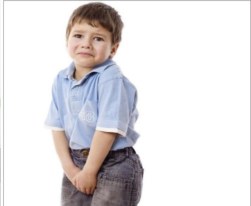
التبول الليلي اللاإرادي عند الأطفال

أسباب التبول اللاإرادي ويقال : يلعب العامل الوراثي دوراً مهماً (قد يكون الأب أو الأم في أثناء طفولتهم كانوا يعانون من هذه المشكلة) كذلك مشكلات في البناء الفسلاحي وتركيبه الجهاز البولي والعصبي للطفل ولكن كل هذه المشكلات غير خطيرة ويجب ان يفهم الابوان