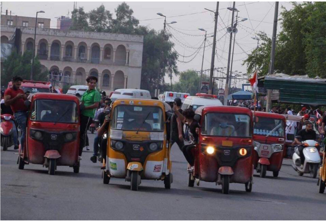
أصحاب التيك تك في المظاهرات

الس إقامة مواكب طبخ لتوزيع الطعام على المظاهرين ونساء قمن بخبز أرغفة لتوزيعها عليهم، إضافة الى العصائر والمعجنات التي قام بعضهم بشرائها من اجلهم. وقت الشدائد، يظهر الانسان أجمل حسيما قال أحد المظاهرين: ان كان ينقل المصابين وفي عيونه شعاع أمل بان التغيير قادم على يد هؤلاء الشباب، وكان الدافع له للقيام بمساعدتهم بهذه الصورة. يوم امس العديد من المواطنين بادر