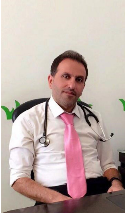
د. محمد شاكراً إختصاص طب اسرة

ان الطفل يتبول على نفسه ليس بسبب تقصير منه أو أنه متعمد و إنما للأسباب التي تم ذكرها فهو مرض. الضغوط النفسية وبينَ : إنَ هذا المرض يؤدي الى