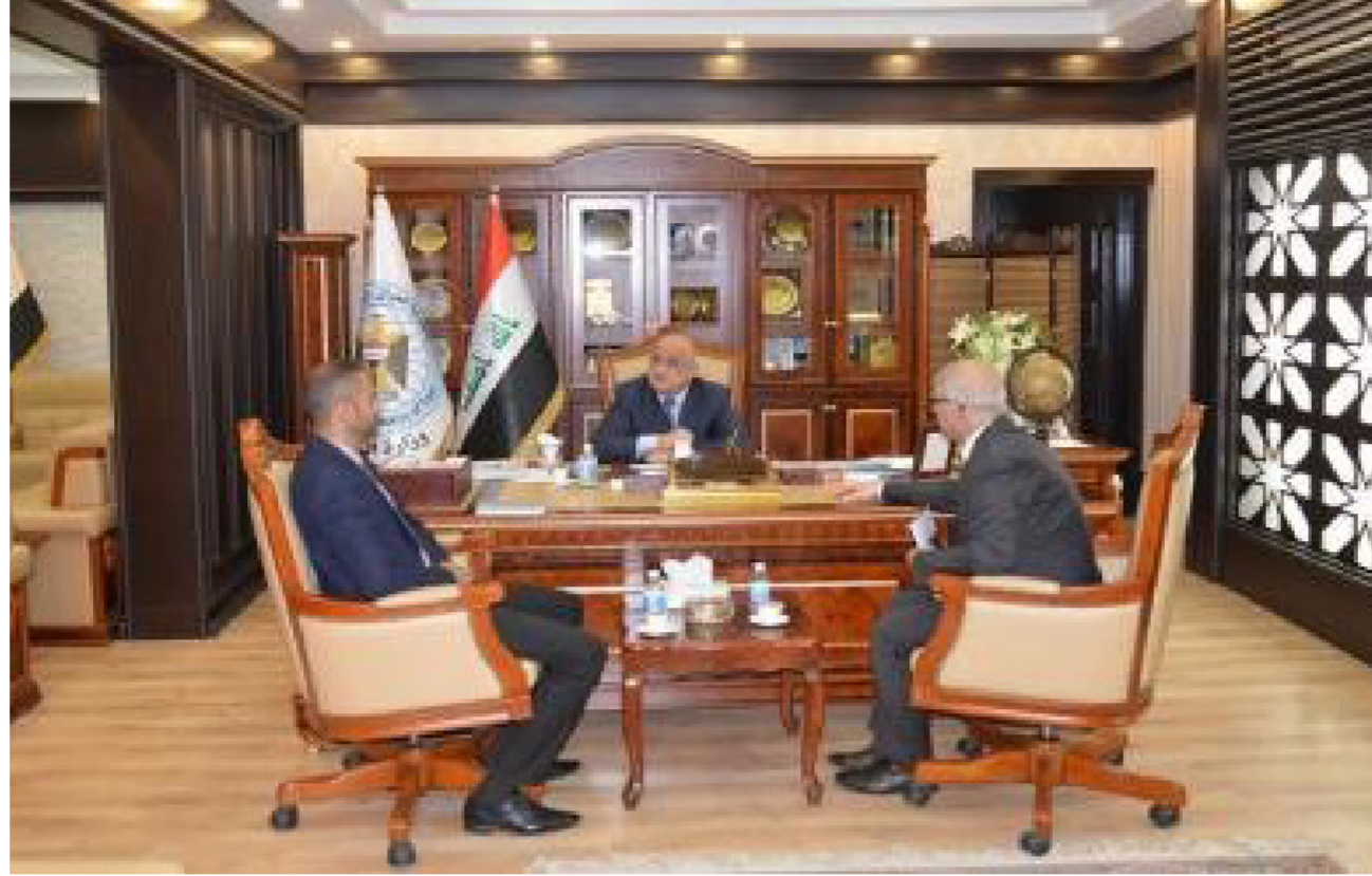
جانب من اجتماع وزير التجارة مع محافظ بابل

دعا وزير التجارة الى بذل جميع الجهود لمعالجة المشكلات التي تواجه الشباب من خلال العمل على تنفيذ حزمة الاصلاحات الخاصة باستيعاب المبادرات الشبابية واقامة المشاريع الصغيرة التي تدعمها الحكومة مادياً ومعنوياً.