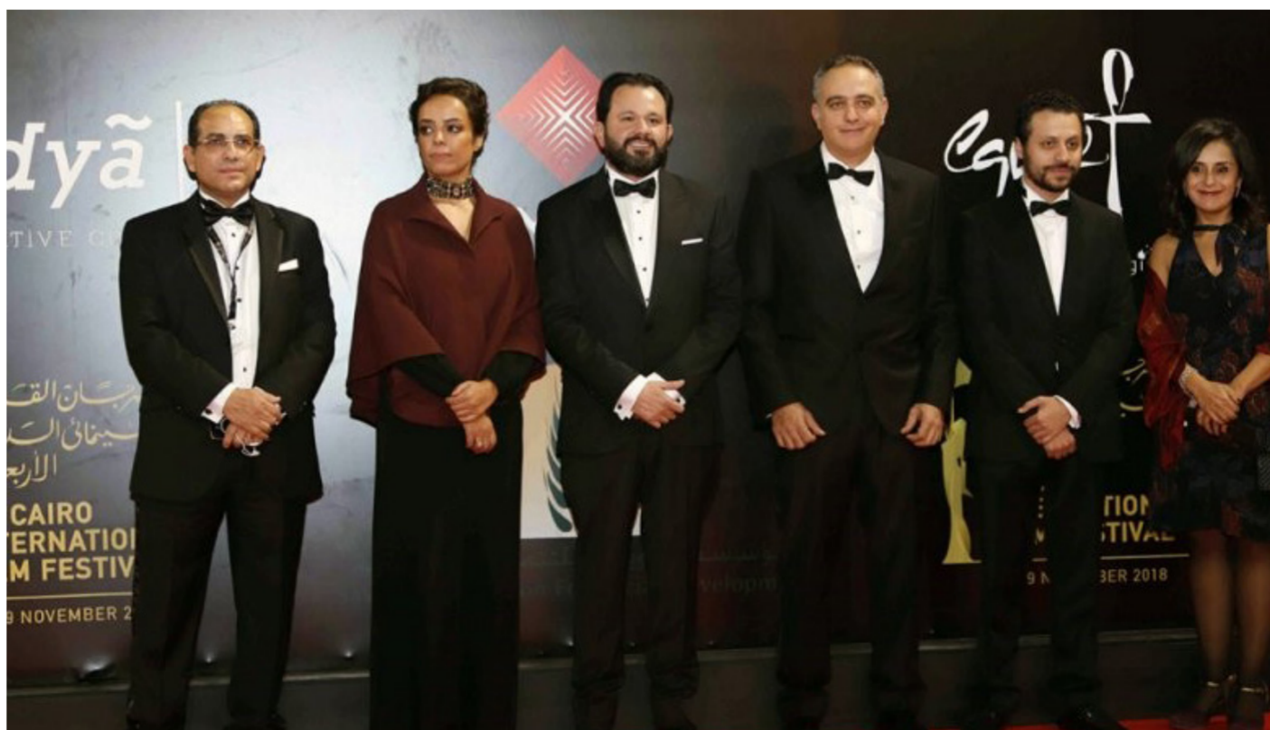
جانب من المهرجان