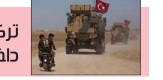
بغداد - الصباح الجديد: افاد مصدر محلي في مجلس محافظة الانبار امس الاربعاء بان مجلس الوزراء اوعز بارسال تعزيزات امنية لضبط الشريط الحدودي مع سوريا غربي المحافظة