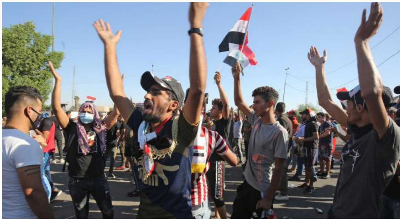
لقطة من التظاهرات الاخيرة التي شهدتها البلاد

الاحزاب استغربت السكوت عن مصير المعتقلين وما حل بهم وخطورة استهداف المؤسسات الإعلامية