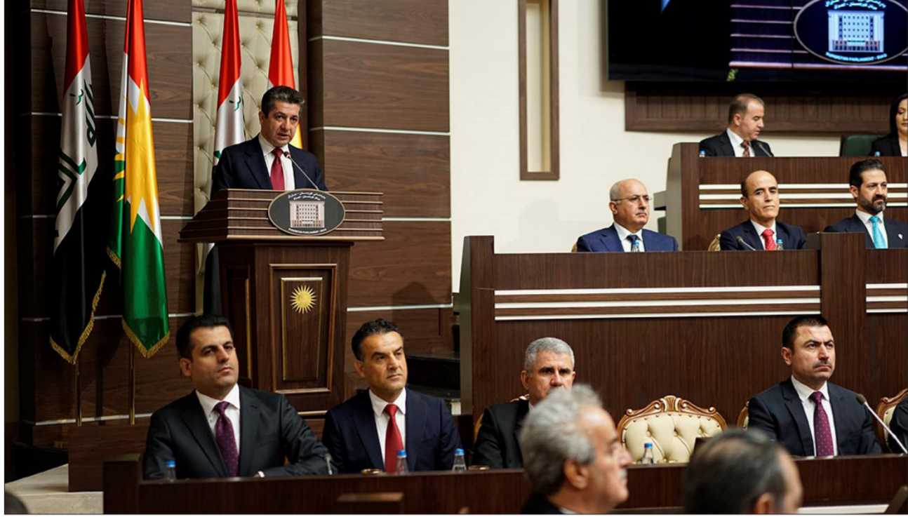
بارزاني في برلمان الاقليم

الجديد. ان ملف النفط في الاقليم خارج عن سيطرة مسرور بارزاني رئيس حكومة الاقليم. لذا فان تصريحاته بما يخص تسليم النفط من عمده الى بغداد تختلف وتفاوتت بين فترة وفترة اخرى. وكان المتحدث باسم حكومة الاقليم ينتج الآن قرابة 400 الى 420 الف برميل يوميا من النفط الخام يذهب 200 الف منها للاستهلاك الداخلي. وحول تقديم حسابات اولية وخامية لحكومة الاقليم للعام الحالي اشار عادل الى ان حكومة الاقليم سيكون لها لهذا العام حسابات خامية تستقدمها الى برلمان كردستان. ففي اطار تشريع قانون الإصلاح وتأسيس مجلس المحمة. لافتا الى اجراءات الإصلاح لا تأتي في ليلة وضحاها وهي تتطلب وقتا وجهودا لتدخل حيز التنفيذ.