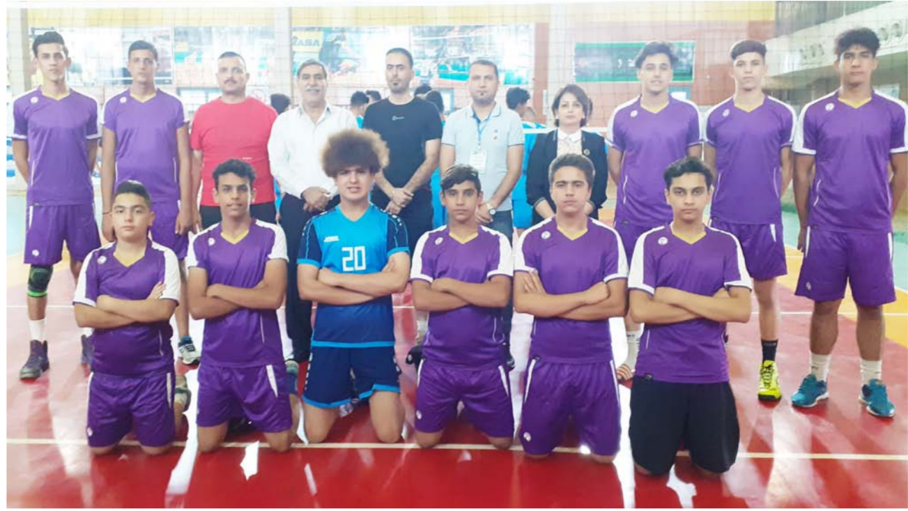
فريق المركز الوطني بغداد لمواهب الكرة الطائرة