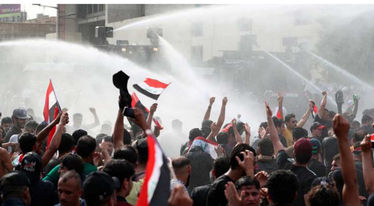
جانب من التظاهرات الأخيرة التي شهدتها البلاد

اللجنة التحقيقية تؤكد صحة التسجيلات الصوتية لمسؤولين حرضوا على فتح النار صوب المتظاهرين