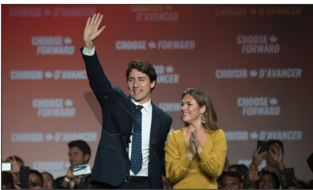
ترودو وزوجته بعد الفوز

وقبل صدور النتائج النهائية، رحّب الرئيس الأمريكي دونالد ترامب في تغريدة بفوز ترودو «الرائع الذي حققه بعد معركة شاقّة». وقال إنه سيواصل تعاون مع ترودو الذي كانت علاقاته به معقدة أحيانا منذ قمة مجموعة السبع عام 2018 في كندا. وفي حين أشارت استطلاعات الرأي إلى تنافس كبير بينهم وبين الليبراليين. فإن المحافظين لم يفوزوا سوى في حوالي 120 دائرة وحل بعدهم حزب «كتلة كيببيك» الاستقلالي (32) والحزب الديمقراطي الجديد (يسار) بحصوله على 24 مقعدا. وتم انتخاب جميع قادة الأحزاب الكبيرة مجددا. وريح ترودو رهانه على ولاية ثانية رغم الفضائح الكثيرة التي اتسمت بها سنواته الأربع في الحكم والهجمات التي غالبا ما كانت عنيفة من جانب المعارضة على إنجازاته. لكنّه خرج من هذا الاقتراع ضعيفا للبقاء في الحكم وينبغي عليه الحصول على دعم حزب صغير. يرحّج أن يكون الحزب الديمقراطي الجديد بزعامة جاجميت سينغ. واعتبارا من الثلاثاء. باستطاعة الزعيم الليبرالي بدء محادثات حساسة بهدف التوصل إلى اتفاقات