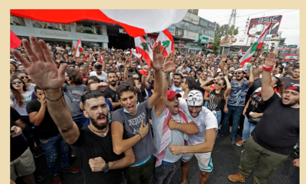
جانب من تظاهرات لبنان

بتهمةا المحتجون بإغراق الاقتصاد في أزمة. ووصل محتجون شبان يحملون أكراس القمامة إلى وسط بيروت صباح أمس لإزالة الخلفات بعد المظاهرات ذات الطابع الاحتفالي قبل يوم وعادت