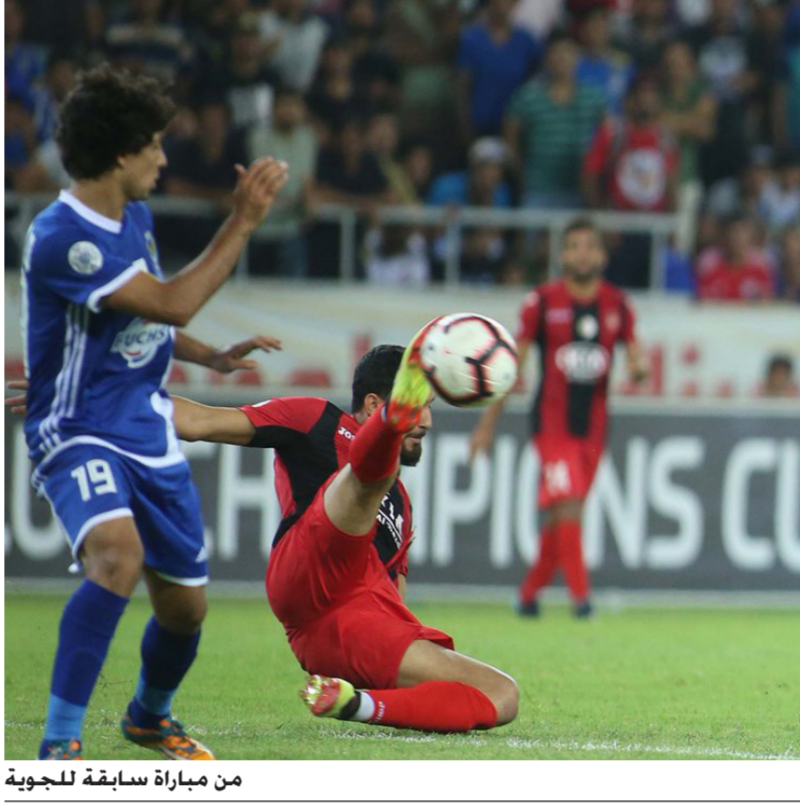
من مباراة سابقة للجوية

الممتاز لكرة القدم. بعد توقف الجولة الماضية بسبب التظاهرات العراقية وكذلك أيام «فيفا دي» واستحقاق المنتخب الوطني في التصفيات المؤهلة لمونديال 2022 وكأس آسيا 2023. وستنطلق منافسات الجولة الرابعة من الدوري الممتاز اليوم الاثنين، بإقامة مواجهتين. حيث سيواجه القوة الجوية مضيفه الكهرواء على ملعب التاجي في تمام الساعة الثالثة مساءً. وفي ذات التوقيت يلعب الكرخ ضيفه أمانة بغداد على ملعب الكرخ. وفي اليوم التالي ستقام 6