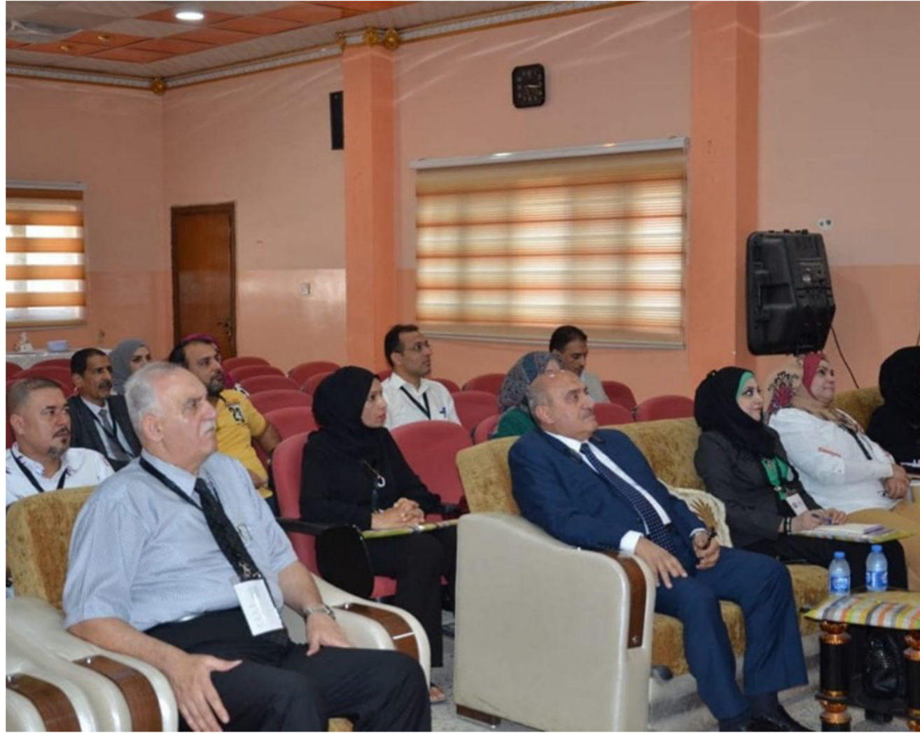
جانب من ورشة الأمن الكيميائي في جامعة البصرة