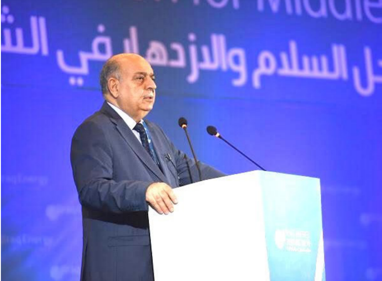
وزير النفط ثامر الغضبان

إضافي في كل سنة وبعض تلك الكمية يتطلب توفيرها من العراق ما يدعو إلى تطوير حقوله النفطية لسد الحاجة العالمية من النفط. يأتي هذا التصريح في الوقت الذي أوقفت فيه شركة «روسنفت» الروسية أعمالها في إقليم كردستان بسبب العمليات العسكرية التركية شمال شرقي سوريا. مع ضغوط توترات المنطقة التي تنعكس بصورة مباشرة على العراق الذي يطمح إلى زيادة إنتاجه النفطي والتميز ثاني أكبر منتج في أوبك بحصته المقررة في اجتماع المنظمة الأخير.