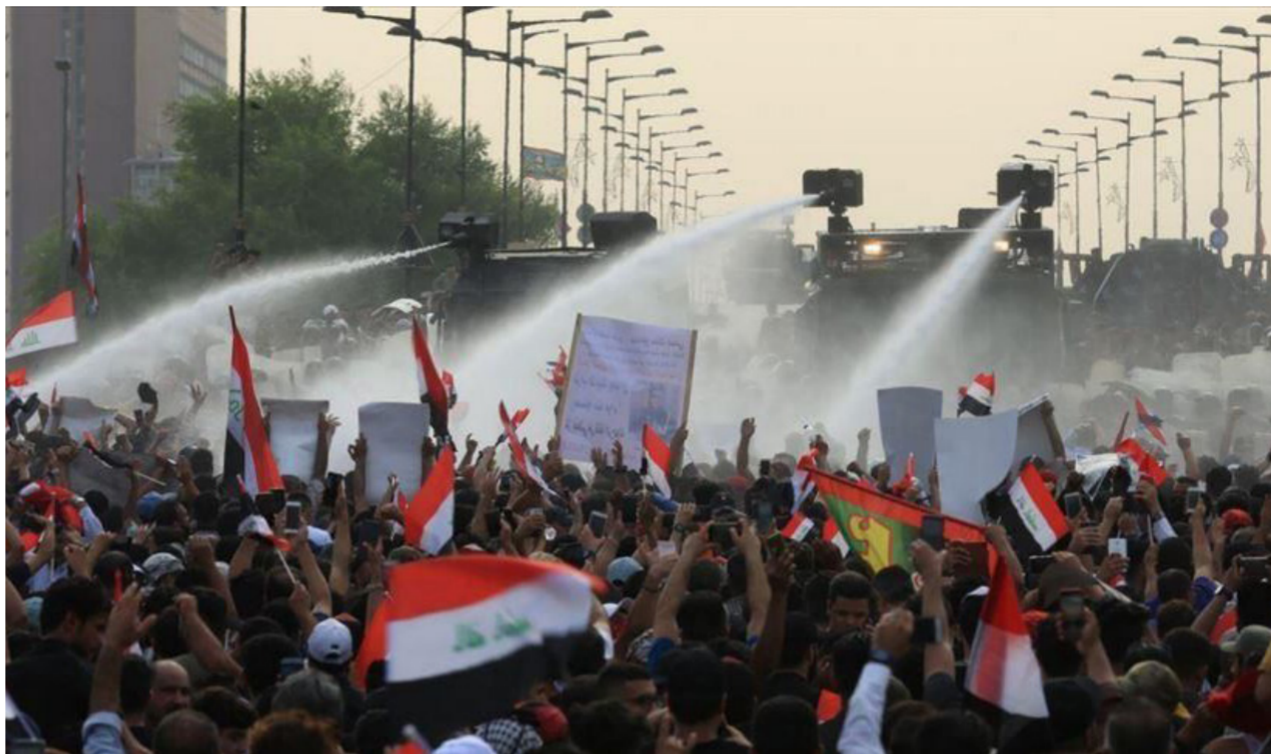
جانب من التظاهرات الاخيرة

الشهر الحالي هم 150 شخصاً أو ما يزيد على ذلك". ونوه الشمري. إلى ان "وثائق ظهرت في وسائل الاعلام