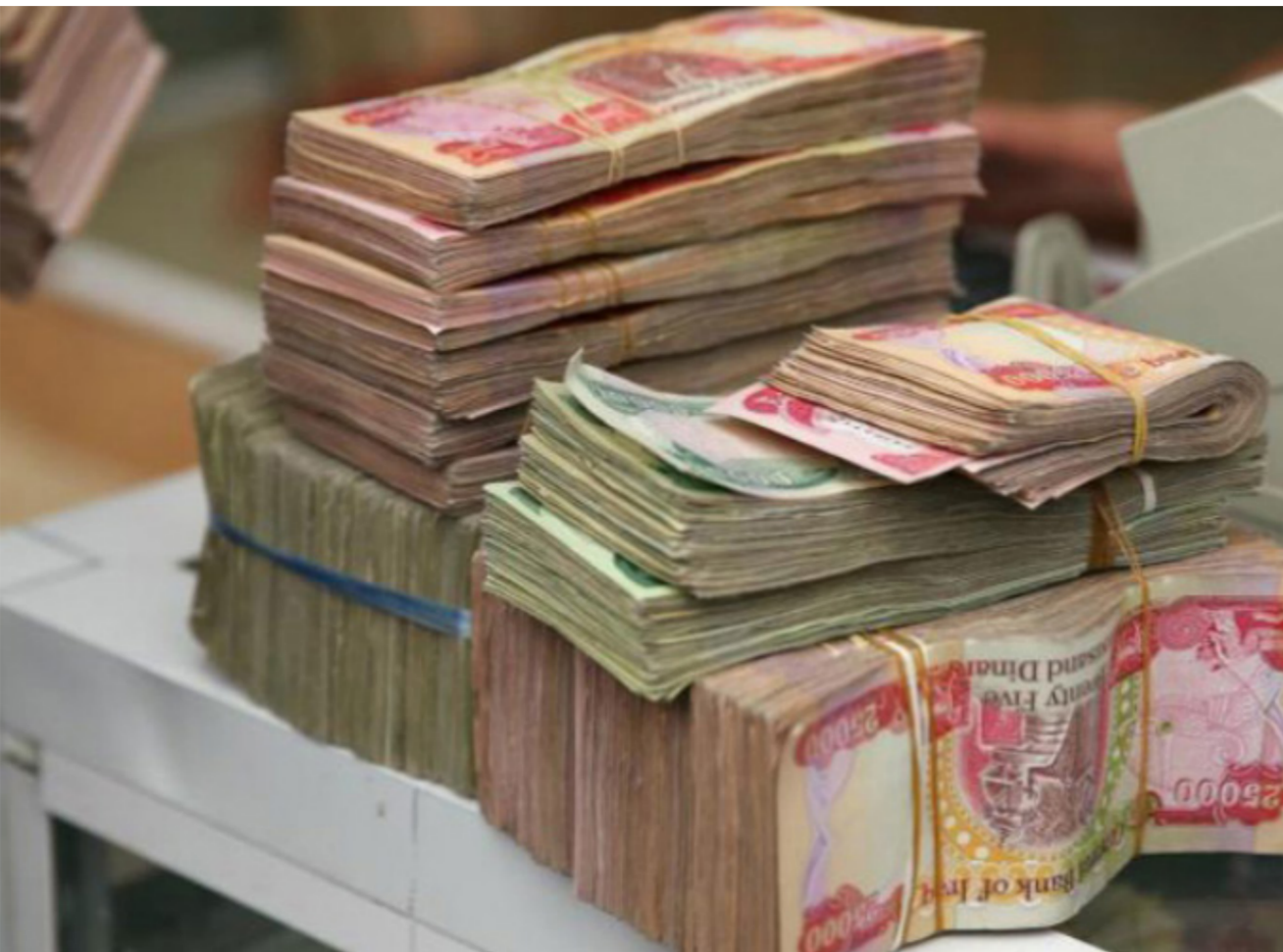
منحة طوارئ العاطلين عن العمل

دينار وحسب الحاجة بضمن العمل ان كانت الارض المقام عليها ملكاً لصاحبه وبضمن كفىل واحد ان كان غير ذلك وباشتر المصرف الصناعي يعقد جلسة طارئة لمجلس ادارته وعمم المبادرة على كل فروعه على ان تنولى تلك الفروع وبعبة الغرف الصناعية في المحافظات اطلاق ذلك القرض لمستحقيه ونشر المعلومات الاولى ان هذا القرض سيوفر ٣٠ الف فرصة عمل تقريباً.