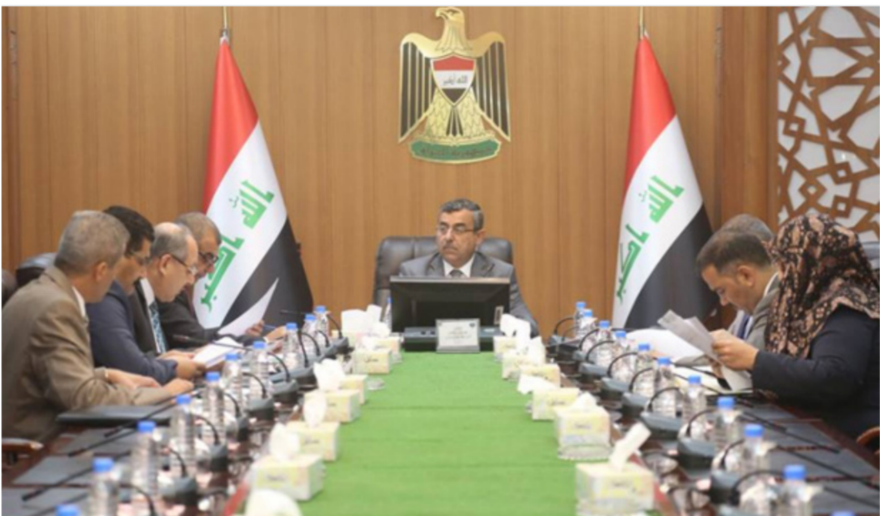
اجتماع سابق لامانة المجلس