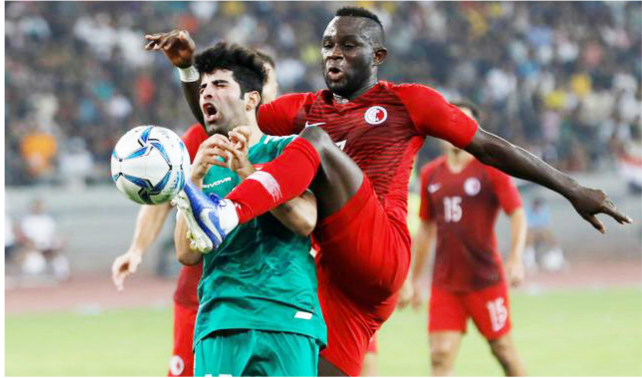
جانب من مباراة منتخبنا الوطني امام هونغ كونغ