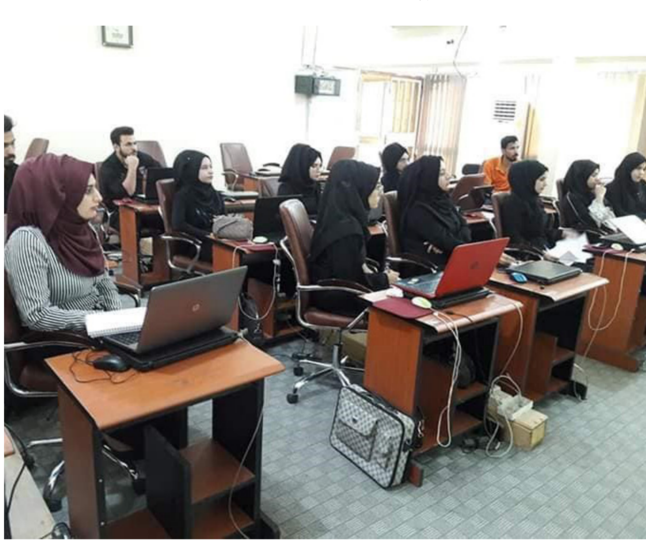
جانب من الدورة الاحترافية في تحليل النظم والشبكات في جامعة البصرة