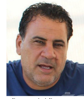
الراحل سعد مالح

بغداد - الصباح الجديد: نعى وزير الشباب والرياضة، أحمد رياض، يزيد من الأسى والخزن بسعد مالح، حيث تقدم الوزير، وفقا لبيان صادر عن اتحاد الكرة، بعبارة «الأسرة الفريدة والأسرة العراقية لكرة القدم»، داعيا الولي عز وجل أن «يقدم الفقيد بواسع رحمته وعظيم مغفرته ويسكنه فسيح جناته، وأن يلهم أهله وذويه الصبر والسلوان...» من جانبه، ذكر اتحاد الكرة في بيان صحفي، «بقلوب حرى واعين باكية وأنفس راضية ببقاء الله وقدره بتقدم