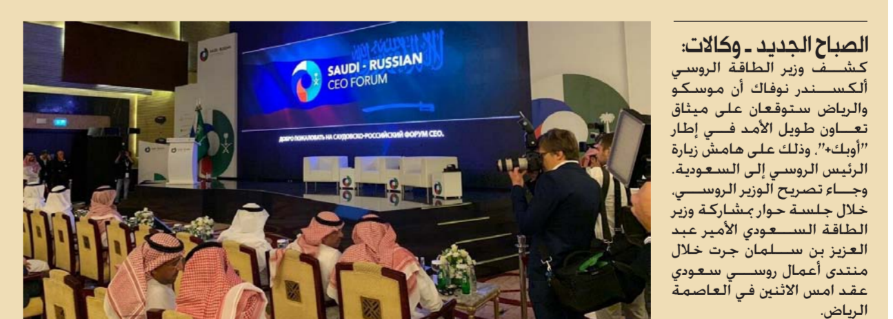
جانب من فعاليات توقيع الاتفاق

للتعاون بين 24 دولة منتجة للنفط من داخل وخارج منظمة "أوبك+" تقودها روسيا والسعودية. وتمت الموافقة حينها على وثائقي. وكانت الدول المشاركة في اتفاق "أوبك+" قد وافقت في تموز الماضي على ميثاق تعاون دائم يعطي صبغة رسمية في هذا المجال. في شكل متعدد