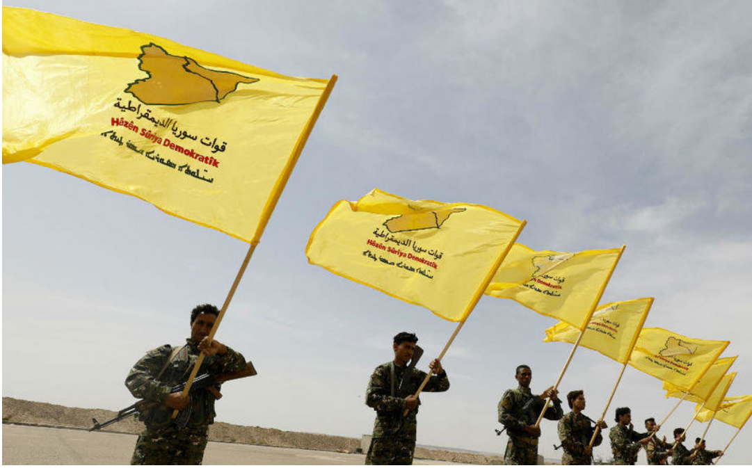
عناصر من قوات سوريا الديمقراطية

داعش. قائلاً: دماء الكرد أغلى بكثير من المال والسلاح. وأضاف بارزاني في معرض رده على ترامب في موقعه على شبكة تويتر: «عزيزي الرئيس ترامب. أرجو أن تعلموا بأن شعب كردستان ناضل دائماً في سبيل حقوقه المشروعة. كما أن البيشمركة هزموا داعش. وهم جزء فعال من التحالف الدولي المناهض للإرهاب. إن دماء الكرد أغلى بكثير من المال والسلاح». وكان الرئيس الأميركي. في أول موقف له بخصوص ما يجري في سوريا وسحب قوات بلاده منها. قد قال: «نحن خارجون من تلك الحرب التي لا معنى لها ولا نهاية. كما أن الكرد لم يقاتلوا بلا مقابل. لقد أعطيناهم الكثير من المال والسلاح». ونقلوا تركيا إنها تريد إنشاء منطقة آمنة في سوريا على الجانب السوري من الحدود لإعادة 3.6 مليون لاجئ سوري. لجأوا إلى تركيا على مدى ثمانين سنوات من الحرب الأهلية السورية. بينما يرى الكرد في سوريا. أن هدف تركيا هو إحداث تغيير ديموغرافي في مناطقهم. لأن أغلب الذين تريد تركيا إسكانهم في تلك المنطقة الآمنة من السنة الموالين لتنظيمات الاسلامية المتشددة.