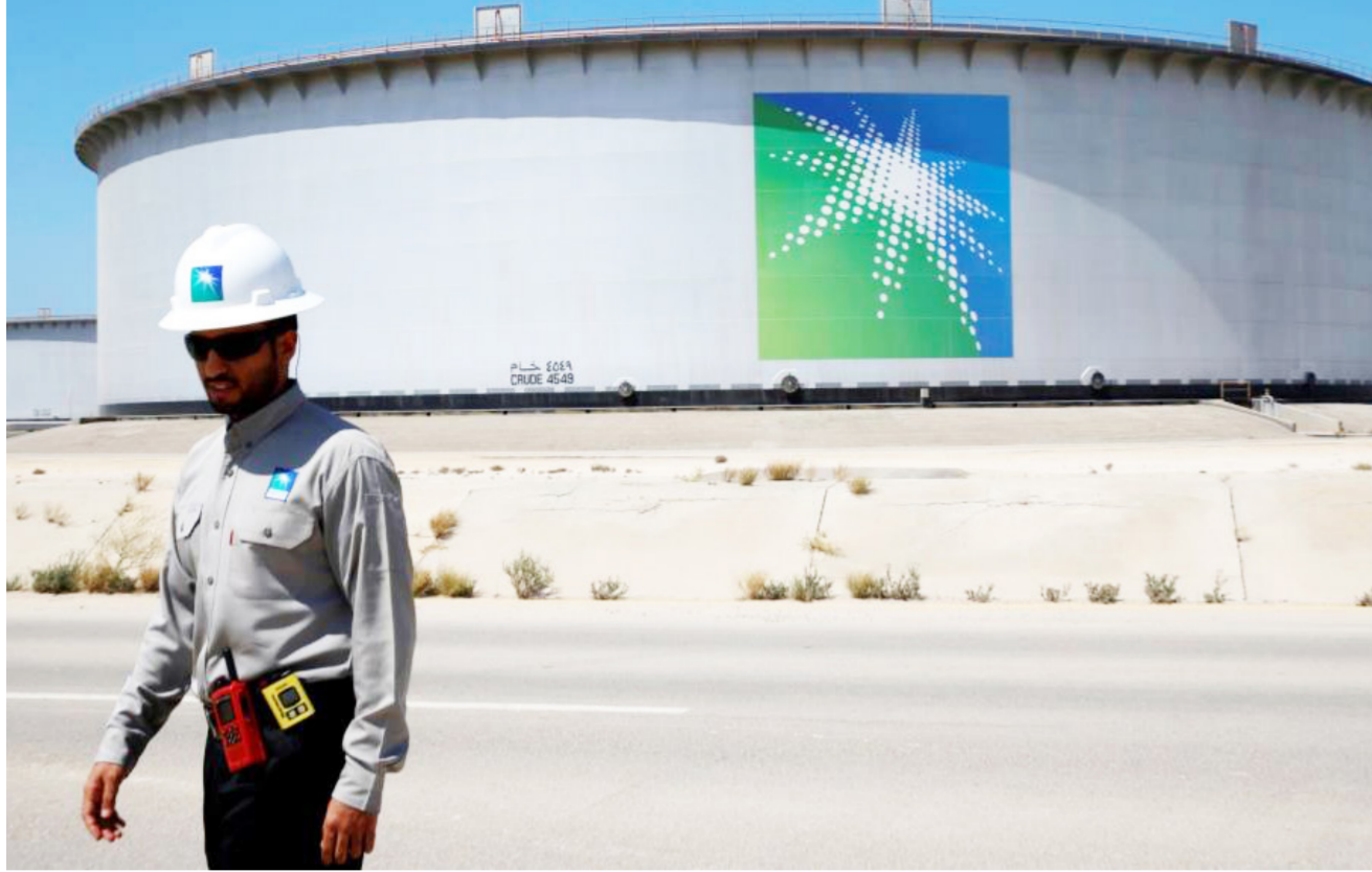
أحد مقرات أرامكو