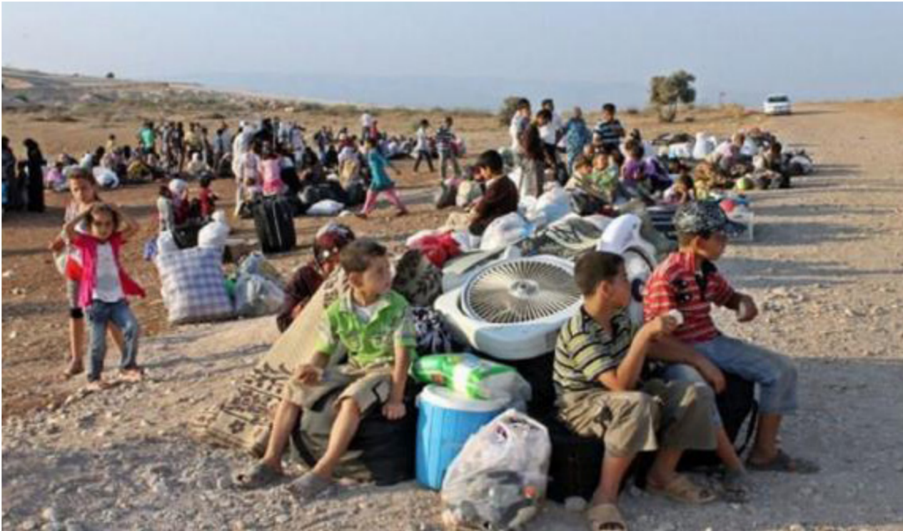
نازحون في العراق بعد غلق مخيماتهم

على موافقة الوزارات المعنية في الحكومة بهذا الشأن. وحذرا من اتخاذ الوسائل الجبرية". وأشار إلى أن "قرارا مفاجئا صدر من قبل الجهات التنفيذية بأن تكون العودة إجبارية. وعندما استفسرنا عن الموضوع فإن كل من الإدارة المحلية في نيوى وزارة الهجرة والمهجرين الاخابية، تلقي باللوم على الأخرى في حمل مسؤولية هذه الخطوة". وعدّ ميسر القرار الذي صدر بحق مخيمات جنوب الموصل بأنه "غير أنساني ولا مسؤول حيث لم يتبق فيها سوى مخيمان، أما البقية فقد تم إغلاقها وتهجير من فيها". وشدد على أن "العديد من ساكني المخيمات المغلقة اضطروا إلى العودة الإجبارية بإجاءه من مناطقهم التي لم تهرب فيها أي ظروف للعيش الكريم". وأكد ميسر أن "الحكومتين الاخابية والمحلية لم تنجحا للغاية الآن في إعادة التيار الكهربائي والمياه الصالحة للشرب إلى المناطق التي شهدت عودة النازحين".