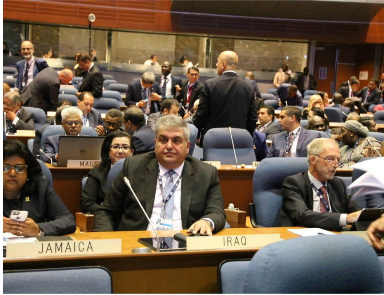
جانب من اجتماعات الجمعية العمومية الـ ٤٠ لمنظمة الطيران المدني الدولي (إيكاف)

كان عدد الطائرات العابرة فوق الاجواء العراقية لا يتجاوز معدل 1000 طائرة شهريا في عام 2014 أصبح معدل عدد الطائرات مع حلول النصف الثاني من عام 2019 إلى 30 الف طائرة شهريا