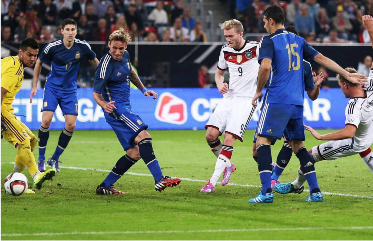
جانب من مباراة سابقة بين الأرجنتين وألمانيا

فإن كوتشبول رفض طلب الاتحاد الأرجنتيني، وسيستمر إيقاف ميسي حتى انتهاء العقوبة. يذكر أنه تم حرمان ميسي بالفعل من مواجهة منتخب تشيلي والمكسيك خلال التوقف الدولي الأخير. إلى ذلك، أعلنت الجمعية العمومية للاتحاد الألماني لكرة القدم في اجتماعها المنعقد أول أمس في فرانكفورت، تولي فريتز كيلر رئاسة الاتحاد. وكانت لجنة استكشافية قد أوصت بأن يتولى كيلر (62 عاما) الرئيس السابق لنادي فرايبورج، رئاسة الاتحاد الألماني خلفا لراينهارد جريندل الذي رحل عن المنصب في نيسان الماضي.. وقد كان كيلر المرشح الوحيد للرئاسة في الجمعية العمومية التي ضمت 257 وفدا.. وسيكون على رأس الهمم التي تنتظر كيلر في المنصب، استعادة النظام بأكبر اتحاد رياضي وطني في العالم، والذي يشهد ثالث رئيس له خلال خمسة أعوام.