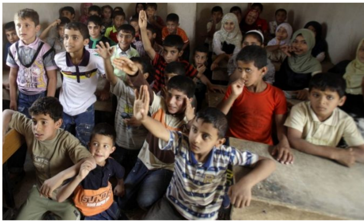
عشرات التلاميذ في صف واحد

10000 تلميذ وطالب من أهالي بوب السنام تكتظ بهم 7 بنايات تضم 14 مدرسة مزدوجة