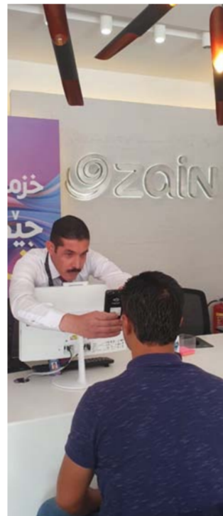
المالي للأشخاص المحتاجين في جميع أنحاء البلاد. كما وتوقع أن تساعدها

في تامين أفضل سبل الحماية للاجئين. تستخدم المفوضية تقنية مسح العين لتسهيل المساعدات في منطقة الشرق الأوسط وشمال إفريقيا - في الأردن ولبنان ومصر كثيرا - وقد أثبتت أنها قناة أكثر فاعلية وكفاءة، حيث تعزز تقنية مسح قزحية العين عدد المستفيدين الذين يضمنون هويتهم. وبالتالي فهي تقنية خالية من احتمالية الاحتيال.