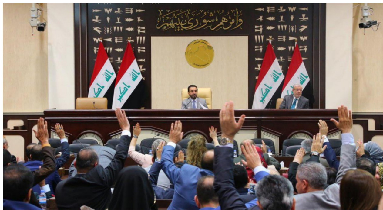
جلسة سابقة لمجلس النواب

نائب يحذر من استغلال رفع الحصانة لتصفية الخلافات الشخصية وآخر: الرئاسة تتكتم على الاسماء