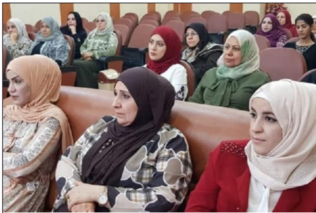
جانب من الحضور في ندوة سرطان الثدي بالبصرة

وأجراء حملات تثقيفية لتوعية المواطنين على ضرورة الفحص الطبي بالتنسيق مع شعبة التفتيش وتعزيز الصحة في قسم الصحة العامة .