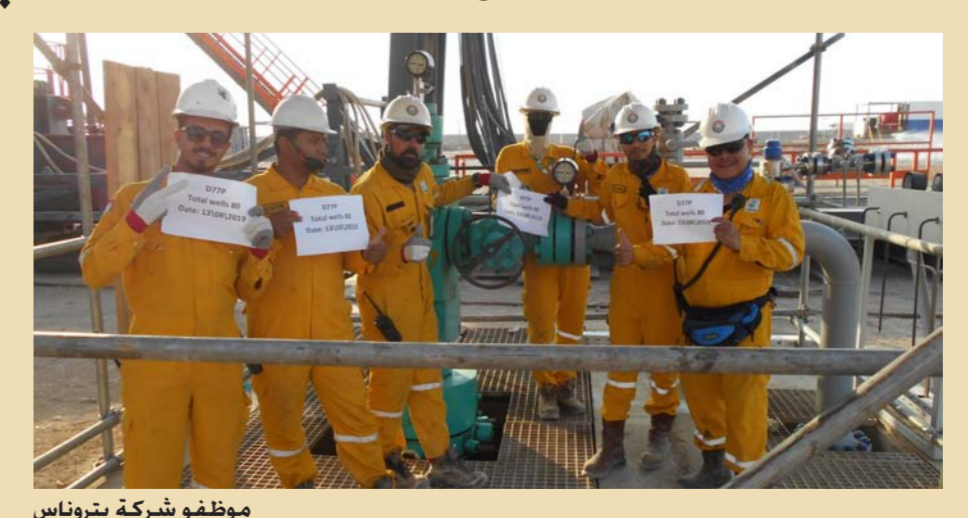
موظفو شركة بترولناس

وما يتوافق مع المتطلبات التنظيمية ومارسات أفضل في المجال الصحي والبيئي. وتعتزم الشركة توسيع انشطة الأعمال التجارية في العراق، والتي تشمل تطوير التكنولوجيا والإنتاج، وتتضمن