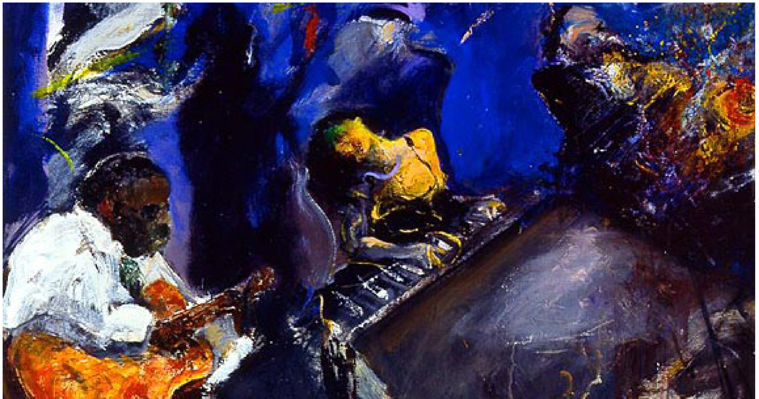
من أعمال الفنان جبر علوان

عندما يحلم الفنان برسم لوحة تشكيلية فهو يحرص على انتقاء الألوان المتناسقة والمنسجمة مع بعضها البعض لتخرج البنا لوحة متكاملة بجماليتها، هكذا هو الفن، لوحة متكاملة بألوانها وتفصيلها الصغيرة والكبيرة والعديدة، بكل أنواعه ومسمياته، ومثلما يرفض الفنان التشكيلي عادة