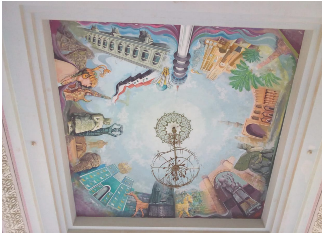
سقف القصر في المدينة الأثرية ببابل

إعمار المعابد ومرقد الامام عمار بن علي المدينة يدخلها وينحو يومي الكثير من عشاق التاريخ، والحكايات، والاساطير، وقصص الحرب، والقوة والثراء، ويذكر الحميري انه براقق اولاده أيام العطل الى العالم الأثري، ويتحدث لهم عن تاريخ المدينة، والقادة، والملوك الذين حكموا فيها. وتاريخ مدينة بابل التي سنتت فيها قوانين حمورابي التي تصل الى مئتين واثنين وثمانين قانونا.