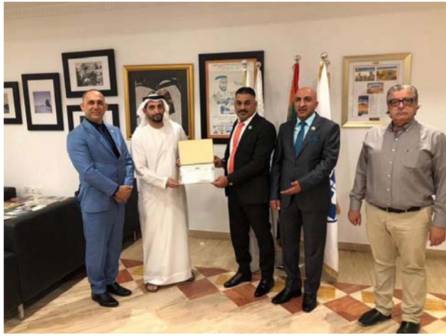
اتحاد الدراجات يلتقي الاصدقاء في الإمارات

للعبة ٢٠٢٠ في العاصمة بغداد. وعدتها خطوة بالأخاه الصحيح. مؤكدا مشاركة الدراجيين الإماراتيين فيها بأكثر عدد ممكن بالمساهمة بشكل فاعل بعودة البطولات الى بلاد ما بين النهرين من جديد لآسيما من بوابة رياضة الحركات.