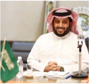
تركي آل الشيخ

قياته التي المركز الثالث في الدوري وراء الأهلي والزمالك بعد منافسته عملاقي القاهرة لفتحات، اثر تدعيم صفوفه بصفقات كبيرة ولاعبين من طراز البرازيلي كينو، السوري عمر خريبين، الحارس أحمد الشناوي ولاعب الوسط عبدالله السعيد.