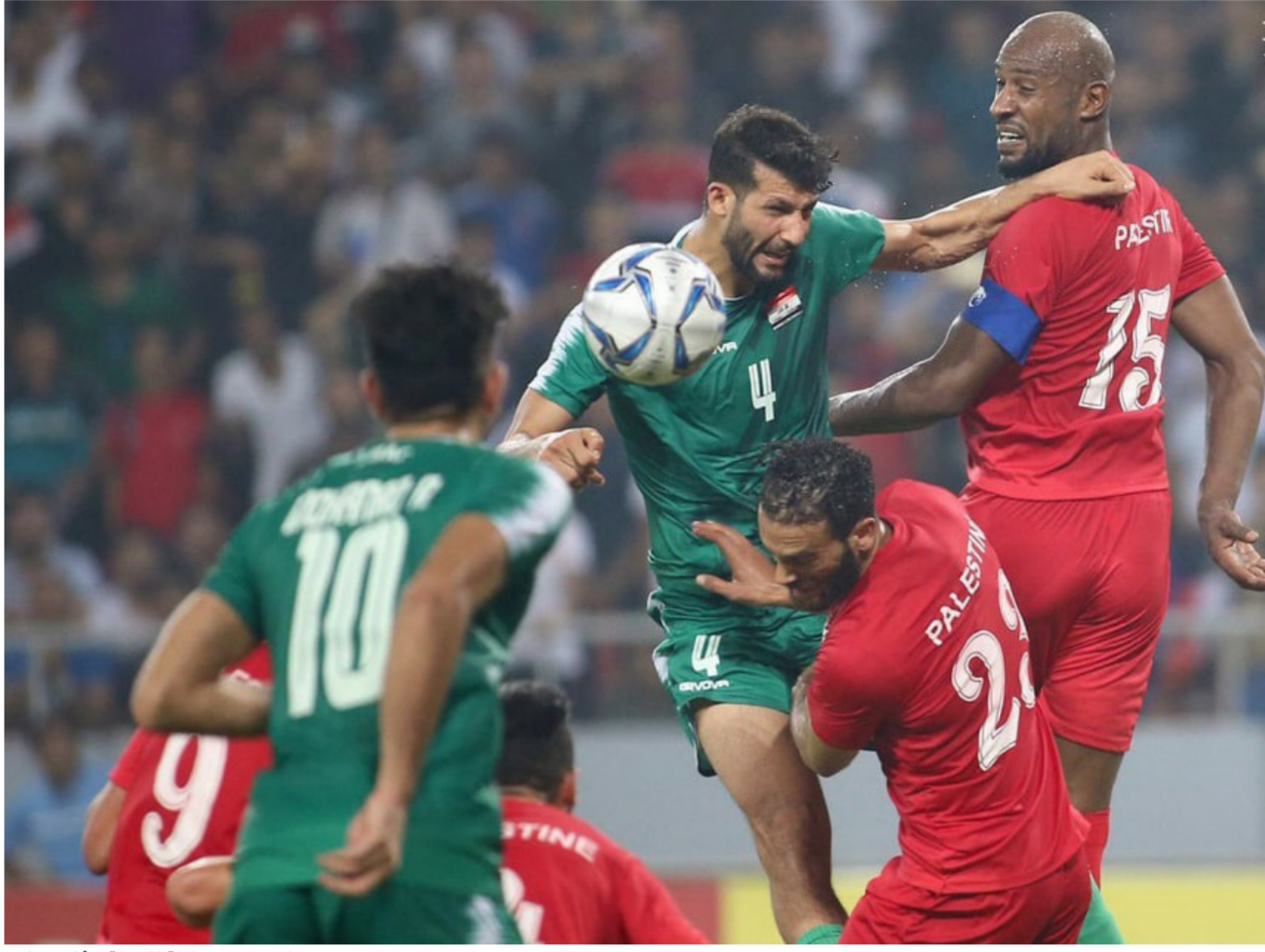
جانب من مباراة العراق وفلسطين

استأثر منتخبنا الوطني بصدارة منتخبات المجموعة الأولى لبطولة آسيا سيل لاتحاد غرب آسيا في أعقاب فوزه الثمين على شقيقه الفلسطيني بهدفين مقابل هدف واحد في المباراة التي احتضنها ملعب كربلاء الدولي مساء أول أمس الجمعة رافعا رصيده إلى ست نقاط قربته من التأهل للمباراة النهائية لآسيما وان المباراة الثانية التي جرت الجمعة قد أسفرت عن خسارة المنتخب السوري المرشح للمنافسة أمام نظيره اللبناني بالنتيجة ذاتها ليضع نسور قاسيون أنفسهم في موقف صعب بوقت مبكر. وعقب أربع مباريات شهدت فيها المجموعة الأولى تبوأ منتخبنا الوطني صدارة جدول ترتيب المنتخبات الخمسة برصيد ست نقاط من مباراتين يليه منتخبنا لبنان وفلسطين برصيد ثلاث نقاط لكل منهما من مباراتين ونفس فارق الأهداف إذ في جعبة كل منهما هدفين وعليه مثلها ثم المنتخب السوري وأخيرا المنتخب اليمني وكلاهما بلا نقاط من مباراة واحدة . وسيشهد يوم غد الاثنين مباراتين غاية في الأهمية يلتقي في أولاهما منتخبنا اليمن وسوريا عند الساعة السابعة والنصف مساء تتبعها مباراة فلسطين ولبنان عند الساعة العاشرة والنصف . مدير منتخبنا الوطني سترينشكو كاتانيتش أعرب عن ارتياحه للنتيجة وبدا راضيا عن أداء لاعبيه كما وصف حركة اللاعبين مع الكرة بعد الهدف الفلسطيني بانها كانت جيدة جدا معترفا بان المباراة كانت صعبة لآسيما وانها جرت في درجة حرارة عالية وان