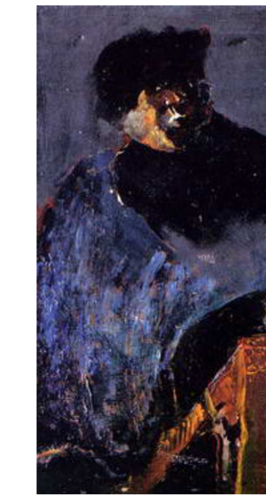
من اعمال الفنان جبر علوان