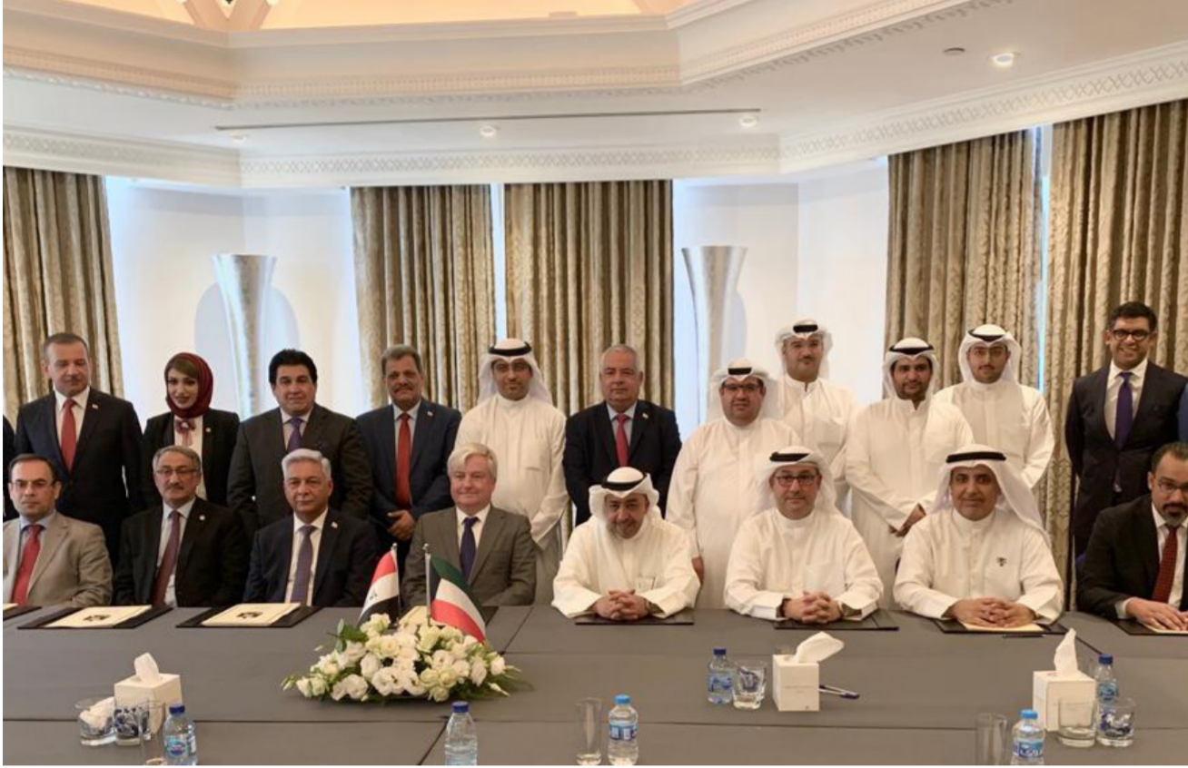
جانب من توقيع العقد

المشتركة وهي حفل (قبة سفوان -العبدلي) وحفل (الرميلة الجنوبي -الرميلة الجنوبي) . تمهيدا لتنظيم واستغلال واستثمار الحقول الحدودية المشتركة بين البلدين وبما يضمن حق كل طرف في هذه الحقول . وتابع المتحدث باسم الوزارة أن هذا الاتفاق يعد الأول في تاريخ الصناعة النفطية والاستغلال الامثل للحقول الحدودية المشتركة مع دول الجوار وفق الصيغ والآليات والاتفاقات الدولية المعتمدة .