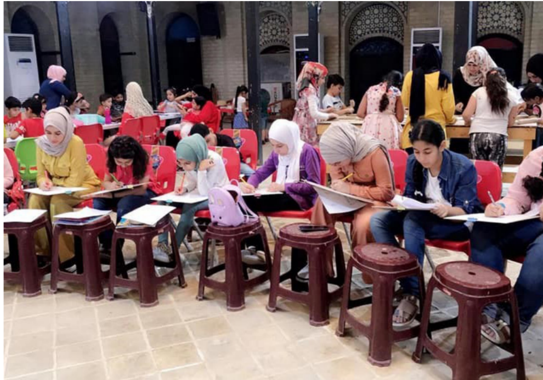
مسابقة لرسم الأطفال