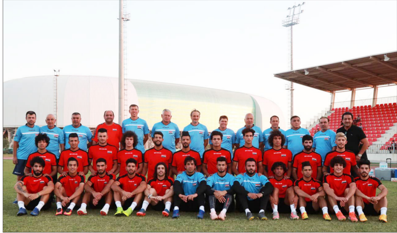
المنتخب الوطني في احدث صورة لملاعب كربلاء خضيرا لغربي آسيا

أكثر ما يعانیه أي مدرب يقود المنتخب العراقي هو تنظيم المباريات التجريبية قبل كل استحقاق دولي، حتى باتت أيام الفيفا تمثل عقدة كبيرة للاخاد العراقي لعدم قدرته على تجاوز المحيط الإقليمي، وتفتقر مع المدربين المحليين سنوات جفاف والسبب يكمن في عدم توفر الأجواء المناسبة لهم، مقارنة مع الأجنبي، وبالتالي فإن المدرب السلوفيني كاتانيتش، يعيش أجواء مثالية قبل بطولة الأخيرة، ووفقا لذلك باتت بطولة غربي آسيا طوق جادة للمدرب قبل المشاركة في تصفيات كأس العالم.