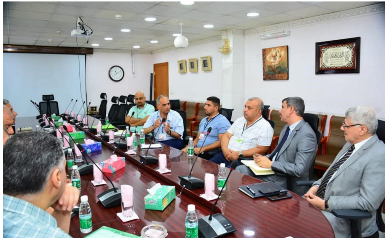
جانب من لقاء ملاكات وزارة الصحة مع شركة نفط الجنوب لتشغيل المستشفى

لمستحقها . وأيضاً زيادة عدد اللجان الطبية الخاصة ببنوي الاعاقه وفتح لجان فرعية في الاقضية لتسهيل الاجراءات أمام المواطنين . وقد أثنى المحافظ الدكتور محمد جميل المياحي وملاكات المحافظة على الجهد المميز للوزير لاهتمامه العالي والمسؤول جَاه المحافظة وابنائها . على صعيد اخر زار محافظ واسط وضمن اهتماماته بقطاع التربية في المحافظة . موضحاً أن حجم العمل كبير وقد بدأ الان الاعلان عن بناء 65 مدرسة بنسبة الاحجام وزعت على النسب السكانية في