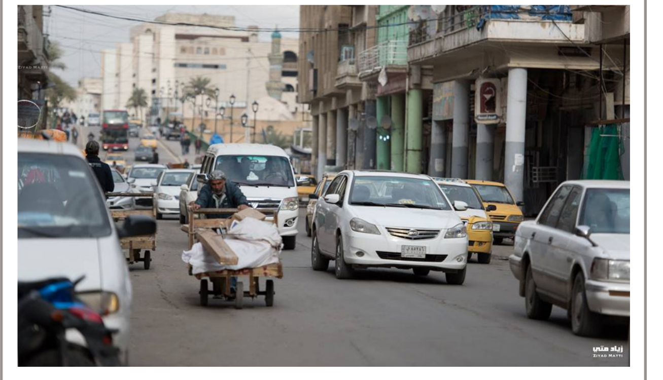
من شوارع بغداد