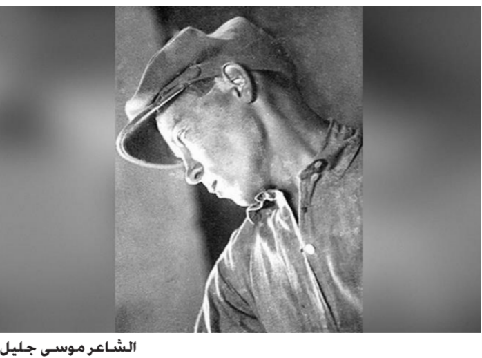
الشاعر موسى جليل