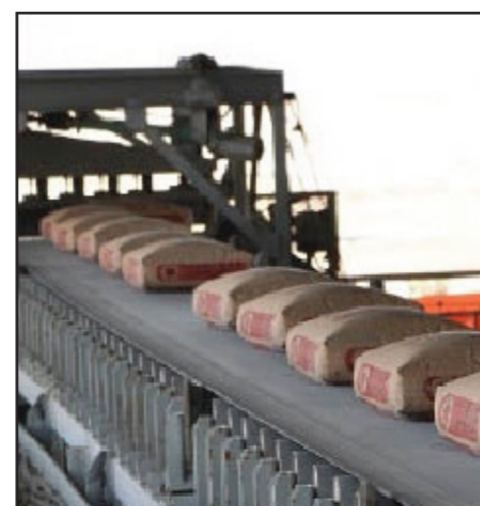
احد معامل الاسمنت العراقية

الأيدي العاملة والوقود) في معامل القطاع الخاص إيماناً من الشركة بضرورة دعم حركة الإعمار والبناء في البلد خصوصاً في المناطق الحرة . وبين أن أسعار السمنت في معامل الشركة بنوعيه العادي والمقاوم الفل منه والمكيس لا يتجاوز (65) ألف دينار للطن الواحد أي أن سعر الكيس الواحد لا يتعدى ثلاثة آلاف دينار للسمنت العادي . أما السمنت المقاوم لا يتجاوز ثلاثة آلاف ومائتان وخمسون دينار مطروح في المعامل . وأضاف أن معامل الشركة المنتجة حالياً والمستعدة للتجهيز موزعة في جميع أنحاء العراق حيث يوجد في البصرة معمل سمنت