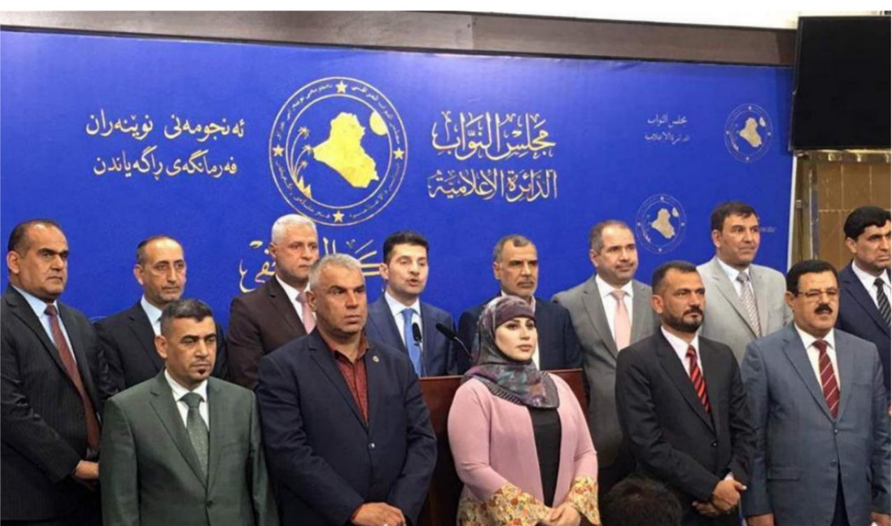
مؤتمر صحفي سابق لكتلة الحكمة "ارشيف"

بغداد - وعد الشمري: أكد تيار الحكمة المعارض، أمس الأحد، أن رئيس مجلس الوزراء عادل عبد المهدي فشل في تحقيق توازن دولي تجاه العراق. مبيّناً ان الحكومة السابقة برئاسة حيدر العبادي هي من صنعت الانفتاح على المحيط الخارجي. فيما حدث عن خلل كبير في منظومة الدولة ينبغي معالجته وفقاً للسياقات الدستورية والقانونية. وقال القيادي في التيار صلاح العزاوي في حديث إلى "الصباح الجديد"، ان "الكتل السياسية بقيت تنتظر كثيراً من الحكومة أن تنفذ برنامجها الوزاري الذي صوت عليه مجلس النواب في شهر تشرين الاول من العام الماضي". وأضاف العزاوي، أن "سبعة اشهر قد مضت من دون تحقيق إنجازات ملموسة، وكنا ندعم رئيس الحكومة عادل عبد المهدي طيلة تلك المدة". وأشار إلى ان "تيار الحكمة لم يتبن ترشيح عبد المهدي