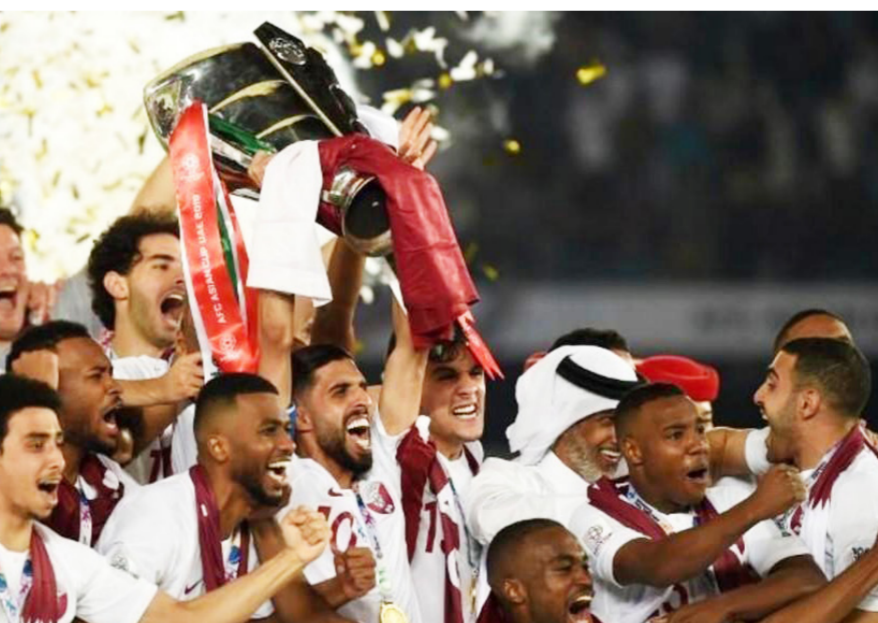
قطر توج بالنسخة السابقة

واستضاف ملعب كربلاء مباراة ودية بين العراق وسوريا عام 2017، انتهت بالتعادل، كما استضاف مباراة الزوراء ونادي العهد اللبناني في كأس الاتحاد الآسيوي عام 2018 وانتهت أيضا بالتعادل، ومباراة الزوراء والنائمة البحريني وفاز الفريق العراقي (2-1)، واستضاف أيضا مباريات القوة الجوية في كأس الاتحاد الآسيوي، التي توج الفريق العراقي بلقبها، كما استقبل مباريات الزوراء في دوري أبطال آسيا.