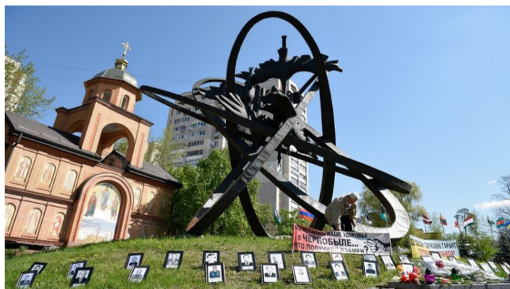
الصباح الجديد - وكالات: انتشر على شبكة الإنترنت إعلان تشويقي للمسلسل التلفزيوني الروسي الجديد "تشرنوبل"، من إنتاج ستوديو "أمالغاما" Amalga Studio السينمائي الروسي، وبات من أكثر المسلسلات السينمائية شعبية بتصنيف بوابة IMDb