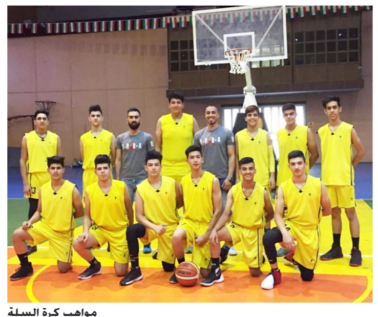
مواهب كرة السلة