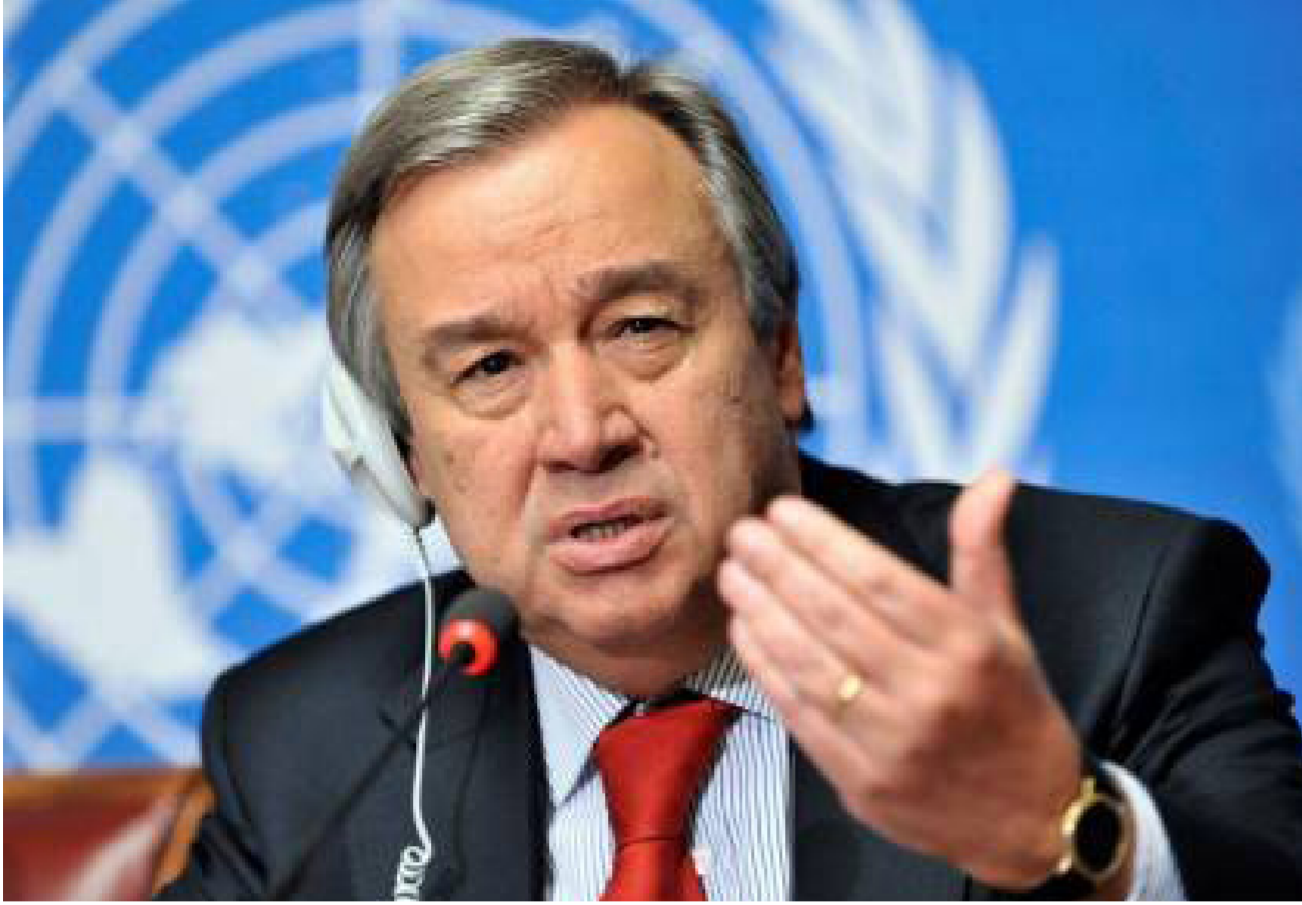
الامين العام للأمم المتحدة أنطونيو غوتيريش

يعترف بالخطوات التي اتخذها التحالف لحماية الأطفال مشفياً إلى أن «حياة جميع الأطفال غالية» ولكنه تسائل أيضاً عن مصادر التقرير ومدى دقته ووصف الأعداد بأنها «مبالغ فيها». وأضاف التحالف للفائمة السوداء لفترة وجيزة في 2016 ثم استبعده بان حين إجراء مراجعة. واتهم بان في ذلك الوقت السعودية بممارسة ضغوط «غير مقبولة» ولا مبرر لها بعد أن قالت مصادر لرويتز إن الرياض هدت بقطع بعض تمويل الأمم المتحدة. ونفت السعودية تهديد بان.