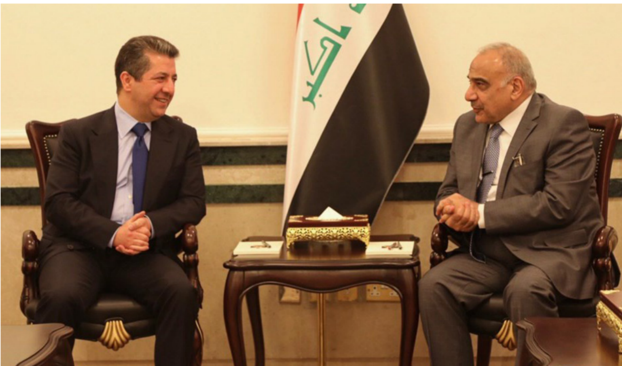
جانب من زيارة مسروق بارزاني الى بغداد

بغداد - وعد الشمري: أكدت لجنة الطاقة في مجلس النواب انطلاق المباحثات الفنية بين الحكومة الاتحادية وإقليم كردستان غداً الإثنين في بغداد، مبيّنة أن عدداً من الملفات الإيجابية يتم مناقشتها أهمها العلاقة النفطية بين الطرفين، وفيما أشارت إلى أجواء إيجابية من شأنها حسم العديد من القضايا العالقة، لوحث باتخاذها الإجراءات الدستورية حيال استمرار عدم الالتزام بقانون الموازنة الاتحادية. وقال عضو اللجنة بهاء الدين النوري في حديث إلى "الصباح الجديد" إن "وقداً تم تشكيله من الحكومة الاتحادية، وذهب إلى إقليم كردستان بهدف الاجتماع لحل بعض القضايا الخلافية". وأضاف النوري أن "إبرز الملفات العالقة مع الإقليم هي المناطق المتنازع عليها، والجوانب المالية المتعلقة بتنفيذ قانون الموازنة الاتحادية، فضلاً عن النفط والغاز". وأشار إلى أن "الجانبين توصلا إلى