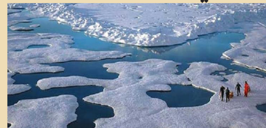
ازدياد معدلات ذوبان الجليد في القطب الشمالي

ومضت "سيستيب ذلك في ارتفاع درجات الحرارة وبالتالي سيزيد من ذوبان الغطاء الجليدي في غرينلاند". وأوضحت أن "الغطاء الجليدي" في غرينلاند يعتبر جزءاً أساسياً في المنظومة المناخية العالمية، خاصة وأن ذوبان الجليد فيها سيؤدي إلى ارتفاع منسوب مياه البحار والمحيطات بصورة كبيرة، بالإضافة إلى اضطرابات بالغة في الطقس. وقالت المسؤولة الأمية إن البيانات الواردة من الدنمارك، تشير إلى أن الأوضاع في غرينلاند "كارثية". وأضافت "لم يكن هناك شيء غريب حتى شهر يونيو/حزيران، الذي بدأ فيه الجليد يذوب بسرعة كبيرة، وتضاعفت تلك السرعة في الأسابيع الماضية".