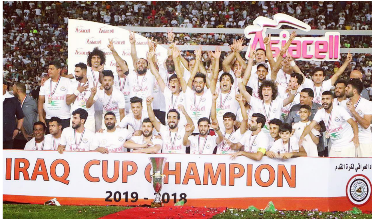
الزوراء يحصد لقبه الـ 16 في كأس العراق