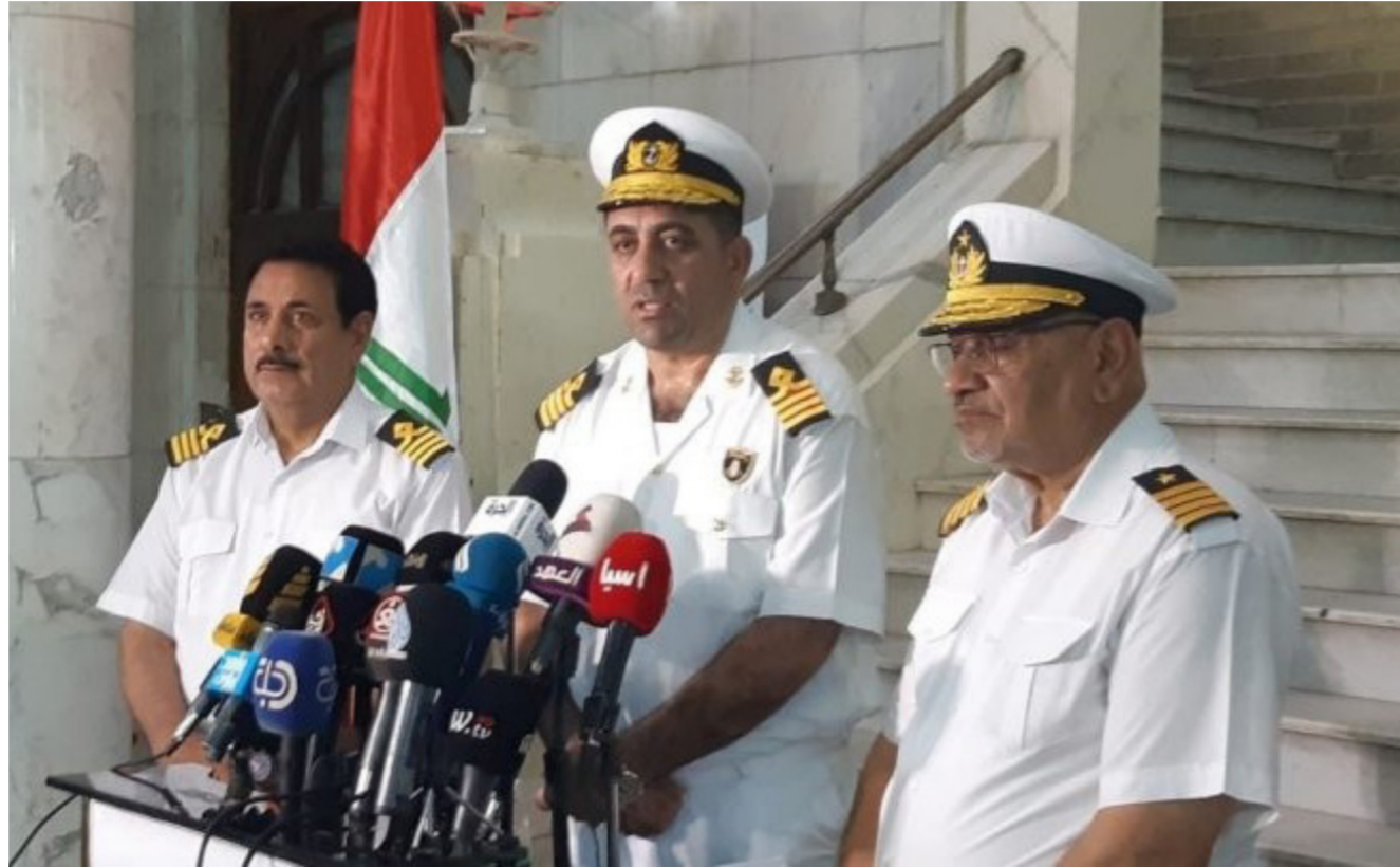
المؤتمر الصحفي لشركة موانئ العراق عن قانون الهيئة البحرية