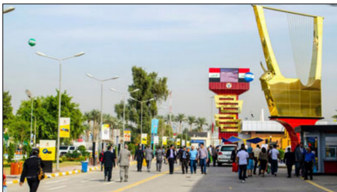
جانب من الدورة السابقة لمعرض بغداد الدولي

نتيجة تبادل المشاركات والزيارات المشتركة . وأشارت الوزارة في بيانها الى ان الدول التي اعلنت مشاركة ميكرة في فعاليات الدورك 46 معرض بغداد الدولي هي فرنسا والمانيا والسعودية وايران وقطر واسبانيا وتونس والهند ومصر ولبنان وفلسطين وانديونيسيا وباكستان ودول اخرى ما زالت تستكمل اجراءات مشاركتها فنيا واداريا كذلك عدد كبير جدا من الشركات الاجنبية وشركات القطاع الخاص ووزارات الدولة التي سيكون حضورها هذا العام مختلف عن الاعوام السابقة». وفي السياق نفسه اعلن مدير عام شركة المعارض العراقية هاشم السوداني عن جملة اجراءات فنية وادارية جديدة لتطوير وتاهيل اروقفة وقاعات معرض بغداد الدولي استعدادا للدورة المقبلة كذلك تأهيل الساحات الخضراء بما يليق والاهتمام الذي تبديه العائلات العراقية والبغدادية على وجه