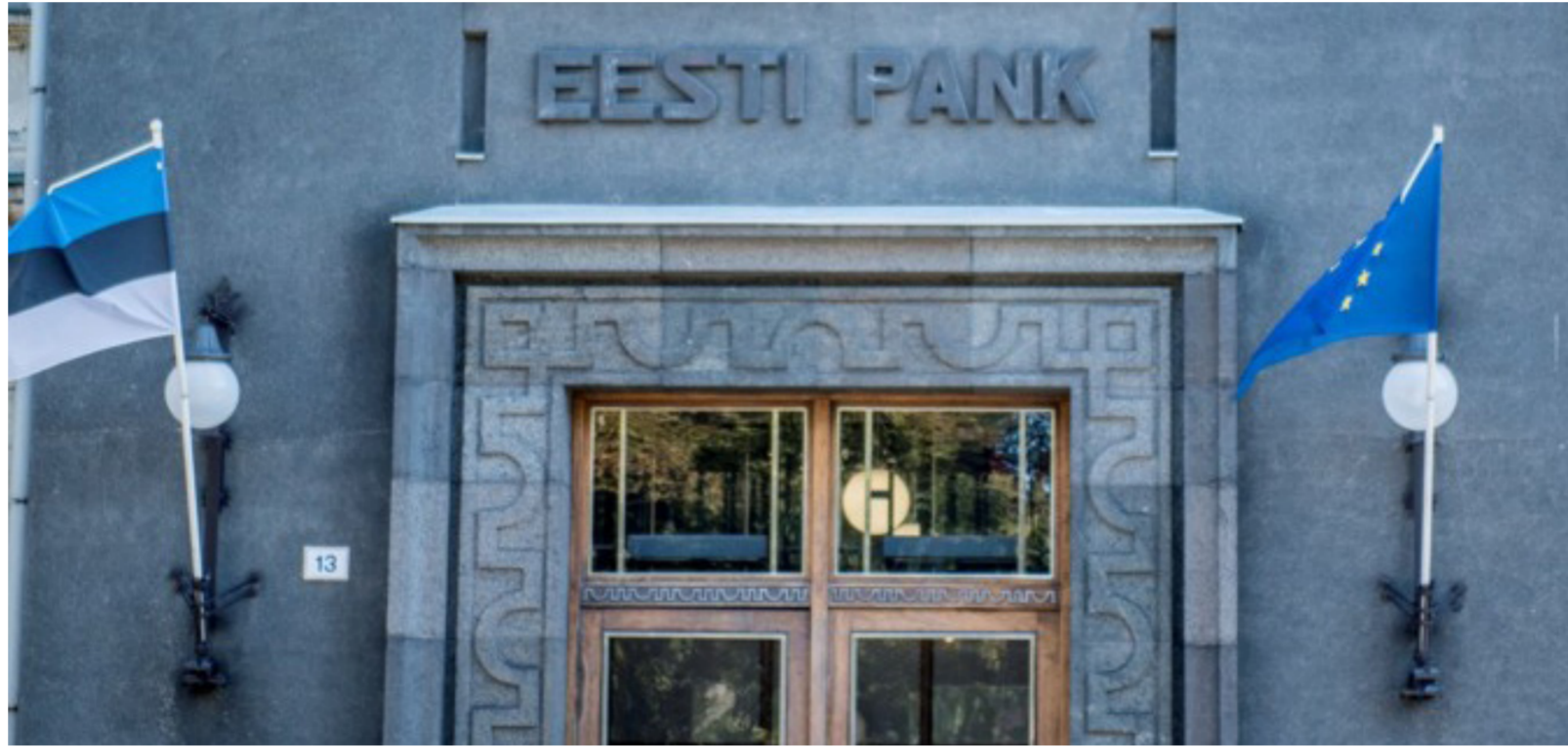
احد بنوك استونيا المتضررة جراء عمليات تبييض أموال

ويضيف الموقع ان المشكلة الاكبر التي تواجه مسؤولين كبار في اقليم كردستان متورطين في عمليات تهريب للنفط والغاز اضافة الى دعمهم مقابل حصة معينة لكثير من التجار العاملين في مختلف التعاملات التجارية بالاقليم، لا تكمن في الاموال الحصول على الاموال وانما في كيفية تبييض الاموال