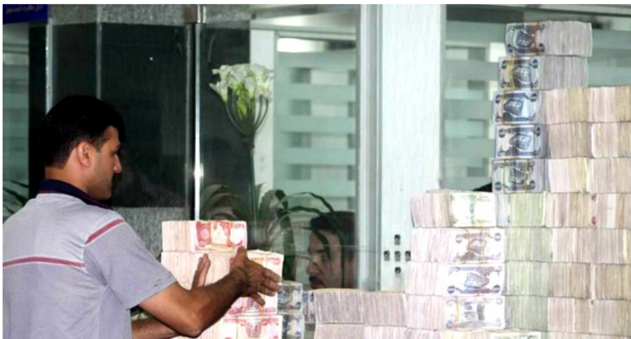
البنك المركزي "ارشيف"

عدد مصارفنا الاهلية يتجاوز مثيلاتها في بريطانيا والإمارات والأردن ولبنان مجتمعة