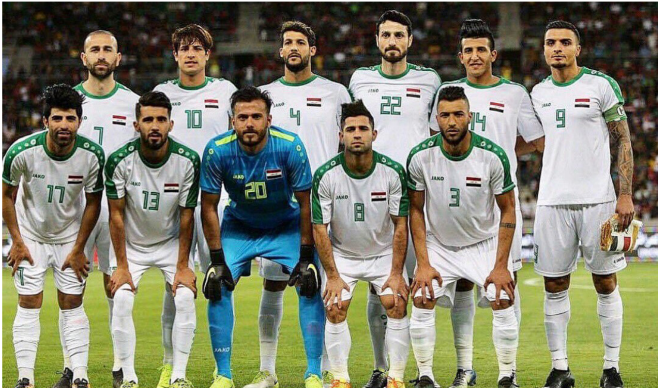
تشكيلة المنتخب الوطني

دعت لجنة الشباب والرياضة الشبابية إلى استثمار استضافة العراق لبطولة غربي آسيا بطريقة احترافية لا بطريقة ( الفعزة) كما يحصل في البطولات المحلية. وقال رئيس اللجنة عباس عليوي في مؤتمر صحفي مشترك: «تفضلنا أيام قلائل عن استضافة العراق بطولة غربي آسيا لكرة القدم. وفي الوقت الذي نعتبر فيه عن سعادتنا لاستضافة انتفاء لنا بإقامة هكذا بطولة رياضية كروية بعد حرمان امدد لعقود طويلة. علينا جميعاً ان نكون حريصين على اخراجها بشكل مقبول يتناسب مع حجم العراق في المنطقة». ودعا كافة المؤسسات الحكومية، وعلى رأسها وزارة الشباب والرياضة، ومؤسسات المجتمع المدني من اليمية والخاديات رياضية، إلى نبذ الخلافات والعمل بروح الفريق الواحد لكون هذه البطولة هي المفتح الحقيقي لبطولات قادمة.. و اضاف عليوي: «إنها الفرصة الحقيقية امامنا لرفع الحظر عن ملامتنا بشكل عام. خصوصاً العاصمة بغداد. ولتدعيم الثقة مع الاخادين الدولي والآسيوي». وطالب باسم اللجنة، الاعلاميين