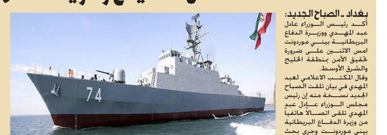
سفينة حربية إيرانية "ارشيف"

فيما لندن تدرس إرسال عواصة ذرية إلى الخليج العراق وبريطانيا يؤكدان ضرورة تحقيق أمن الخليج وحرية الملاحة