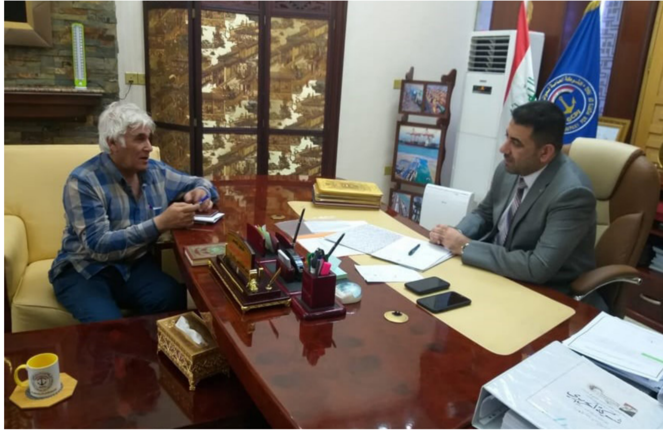
مدير عام الشركة العامة لموانئ العراق يتحدث لمراسل الصباح الجديد