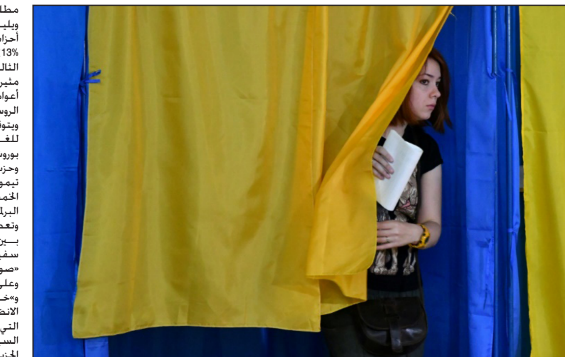
اوكرانية تغادر غرفة الاقتراع

البالغة من العمر 82 عاماً «انتخبناه لكنه غير قادر على فعل شيء لأنهم يضعون العراقيل أمامه». وأضافت «يجب أن يكون لديه غالبية في البرلمان والحكومة». ويحظى حزب «خادم الشعب» الذي سمي تيمناً بمسلسل تلفزيوني له فيه زيلينسكي دور رئيس للجمهورية. بأكثر من نصف نوايا التصويت. ويريد هذا الحزب «تحدي النظام» لإحداث «تغييرات» وتحطير البلاد من الفساد». وتستقطب تلك الوعود ناخبي هذا البلد الذي يعدّ من بين الأكثر فقراً في أوروبا. ويعيش حراً مع الانضغاليين الموالين لروسيا في شرقة أدت حتى الآن إلى مقتل 13 ألف شخص. حقبة سياسية جديدة أكد زيلينسكي الخميس الماضي أنه سيعين بعد الانتخابات «حكومة من المهنيين والخصصين» بهدف تحويل الاقتصاد الأوكراني إلى «أكثر الاقتصادات حيوية في أوروبا». وتغطي استطلاعات الرأي الجزء الذي ينتخب بالاقتراع النسبي من النواب. ولذلك يبقى معرفة ما إذا كان حزب «خادم الشعب» سيحظى بغالبية