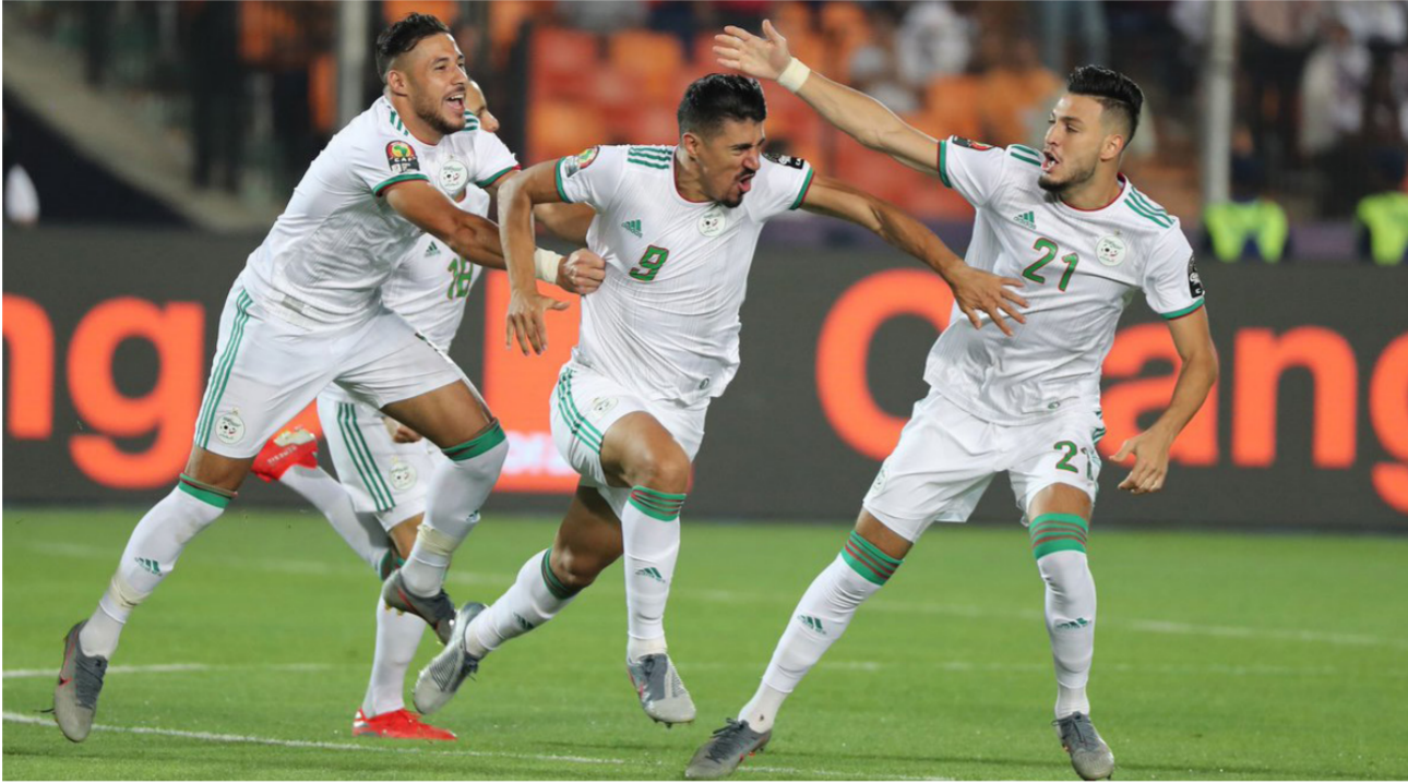
بغداد بو جاح ينطلق فرحا مع زملائه بهدف الفوز باللقب

ميراج (تونس) - كالبديو كوليبالي (السنغال) - لامين جاساما (السنغال) - يوسف سبالي (السنغال). وفي خط الوسط: عدلان قديورة (الجزائر) - إسماعيل بن ناصر (الجزائر) - دريس جايي (السنغال). أما خط الهجوم: أوبيون إيجالو (نيجيريا) - ساديو ماني (السنغال) - رياض محرز (الجزائر). وكان المنتخب الجزائري قد حصد لقب كأس الأمم الأفريقية للمرة الثانية في تاريخه. بعد أن حصل على اللقب عام 1990. من جانبه، حرص النجم الفرنسي ذو الأصول الجزائرية، زين الدين زيدان، المدير الفني لفريق ريال مدريد، على تهنئة منتخب محاربي الصحراء بعد نتيجته بلقب بطولة الأمم الأفريقية مصر 2019.