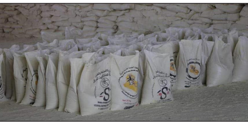
كميات من مادة الشب المكيسه جاهزه للتصدير

مديرية ماء محافظة نينوى بكمية (50) الفاً و750 طناً من مادة الشب المكيس فيما جهزت عدداً من المواطنين بكمية (500) كيلو غرام من مادة الشب المكيس وكمية (2,500) طن من مادة الكبريت الزراعي . واكد المدير العام ان الشركة تمتلك المعمل الوحيد في العراق لانتاج مادة الشب بنوعية عالية ومواصفات مطابقة للمواصفات العراقية ويعمل بطاقات انتاجية عالية بمايلبي الاحتياج المحلي لهذه المادة . من جانبها أجزت شركة ديالى العامة احدى شركات وزارة الصناعة والمعادن عقدها مع