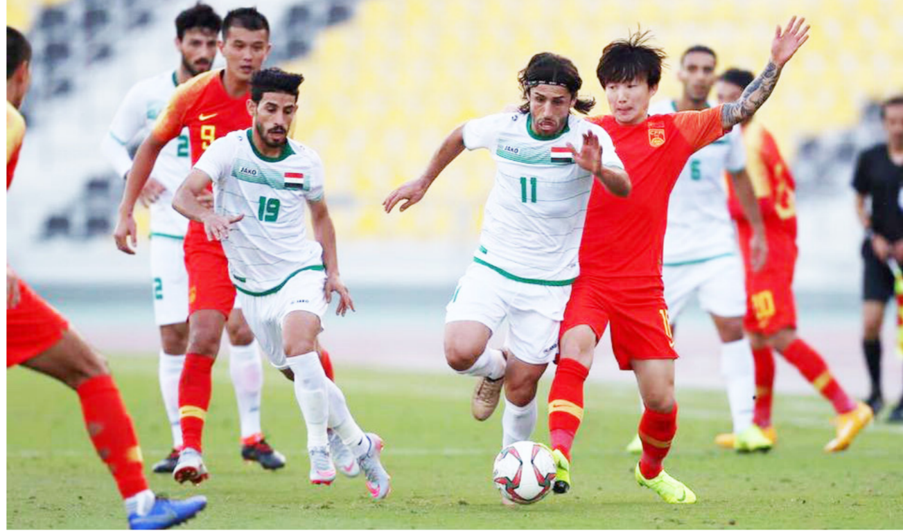
منتخبنا الوطني في مباراة سابقة

وفي العاشر من نفس الشهر تقام 4 مباريات هي: السعودية مع الأردن، البحرين مع الكويت، سوريا مع فلسطين واليمن مع العراق، وتقام المباراة النهائية في الرابع عشر من الشهر المقبل، وجمع بين بطلي المجموعتين الأولى والثانية، وحضر مراسم قرعة البطولة السفير السعودي في العراق عبد العزيز الشمرى، وأكد دعمه للقرعة أن المنتخب السعودي داعم لكل الجهود