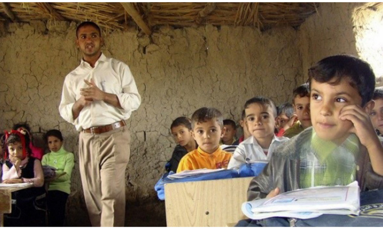
احدى المدارس الوطنية

بغداد - الصباح الجديد: تضمن إلى صالة المسافرين . تضمن تشكيل لجنة حكومية لتسهيل رفع الحواجز الكونكرتية من مداخل مطار بغداد". وأضاف "سيتم خلال ١٠ أيام إيجاد مداخل أخرى بعيدة عنه، مبيّناً أن العمل جار في شارع ابو غريب بالتنسيق مع الدوائر الخدمية لخدمة المواطنين". وكان مكتب رئيس الوزراء عادل عبدالهدي. أصدر مطلق هذا الشهر أمرا ديوانيا خاصا بفتح شارع مطار بغداد الدولي، وصولاً