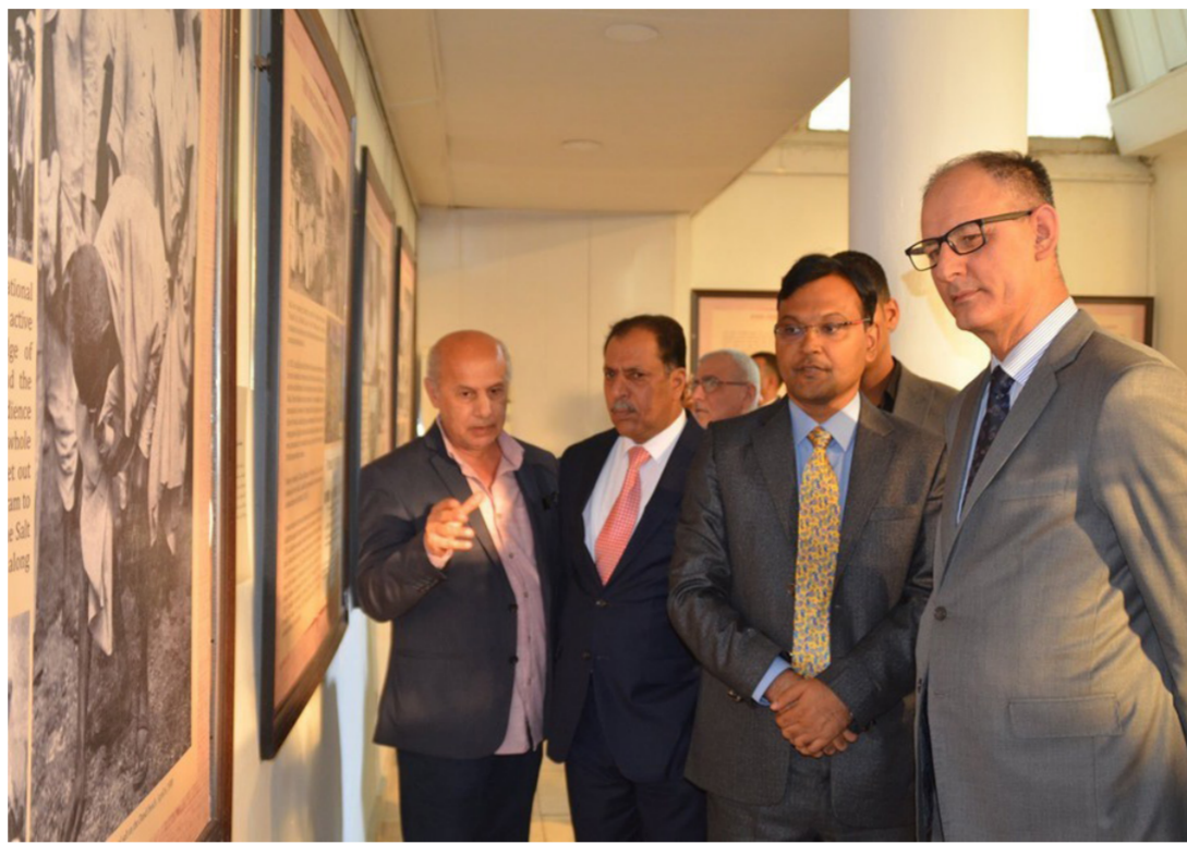
جانب من المعرض