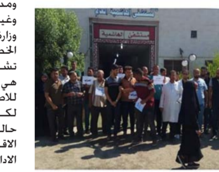
بدءاً من تنظيف الارضيات والمرافق الصحية وقاطعي التذاكر وتنظيم الطلبات للمرضى والاستعلامات والبرمجيات والمهندسين والصيانة ومشغلي الولادات

ومدخلي البيانات وسواق سيارات الاسعاف وغيرها من الاعمال الاخرى . وكانت قامت وزارة الصحة سابقاً بزيادة مخصصات الخطورة للأطباء والمهن الصحية ولم تشمل الاداريين علماً ان العمل والخطورة هي واحدة . وان الملاكات الادارية معرضة للاصابة أكثر من المهن الطبية والصحية لكون ان الطبيب والمرضى يعلم بوجود حالة مصابة فيقوم بتحسين نفسه بلبس الاقنعة والواقيات والتعقيم في حين بينما الاداري لا يعلم اصابة المريض بأي مرض حيث يقوم بتنظيم باص الدخول وتفتيشه ونقل المريض بسيارة الاسعاف . كما ان موظف الخدمة يقوم بتنظيف صالات العمليات والردهات وهو معرض للاصابة بدرجة كبيرة .