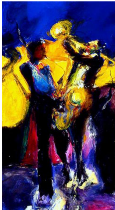
من أعمال الفنان جبر علوان