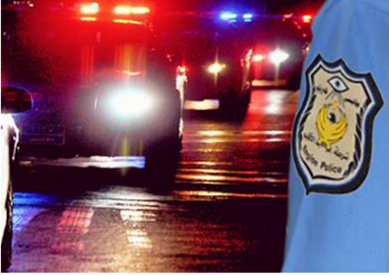
شرطي ينهي حياته بطقعة

المدارس البريطانية الدولية، وفندق ديفان وسلسلة مطاعم هوكا باز داخل العراق ومن خلال مشاركتنا بهذا المعرض توفر فرص العمل للعاطلين والباحثين عن العمل». فيما أكد ممثل منظمة ورك ويل، محمود خليل، «اننا كمنظمة أميركية وبالشراكة مع منظمة المانية لدينا برنامج يخصص بتقديم التدريبات للشباب النازحين العرب واللاجئين والمقيمين في أربيل ليمتد إدخالهم في سوق العمل». الباحثون عن فرص العمل الذين إكتضت بهم قاعات المعرض طالبوا بعدم اعتماد الية تقديم السير بالعدم خلال المطبوع الورقي وتسليمها عبر البريد الإلكتروني لضمان الشفافية مشيدين بهذه الخطوة التي فتحت أفقا واسعة أمامهم.