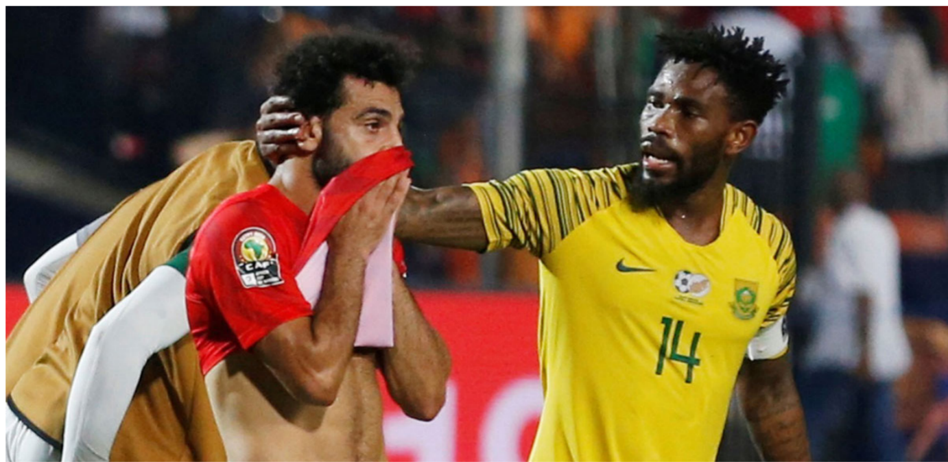
محمد صلاح في مباراة «الخروج»

وتابع نجم الأهلي والزمالك السابق: «سنستغل خلفه ونقومه ونساعده عندما يخطئ. ونندمعه ونشجعه عندما يتطلب الأمر ذلك، هو وكل من يرفع اسم مصر عالياً». وكان المنتخب المصري قد ودع منافسات الكان من ثمن النهائي. عقب الخسارة أمام جنوب إفريقيا بهدف من دون رد. برغم أنه كان من أبرز المرشحين للقب البطولة المقامة في بلاده.