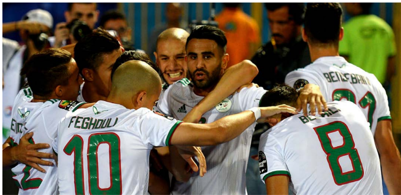
فرحة تسجيل هدف الارتقاء الى النهائي

محرز الفرقة التي اختبرت بنحو حذر للهدف الذي ما زالت الجزائر تؤمن به على أنه تسديد لربع قرن اللعبة على مستوى العالم، يدن محاربو الصحراء: «متى ما نتهي من هذه.. سننتج مكاننا العالي».. نتائج مباريات الجزائر التحضيرية لكأس أمم أفريقيا 2019 شهدت تعادلا أمام غامبيا وبوروندي بنتيجة (1-1) وفوز على تونس بـ (0-1)، ومثله على مالي بنتيجة (2-3)، أما النتائج في التصفيات المؤهلة لأمم أفريقيا 2019 ف جاءت على حساب توجو وبين غامبيا بحصد 10 نقاط تأهل بها إلى البطولة.