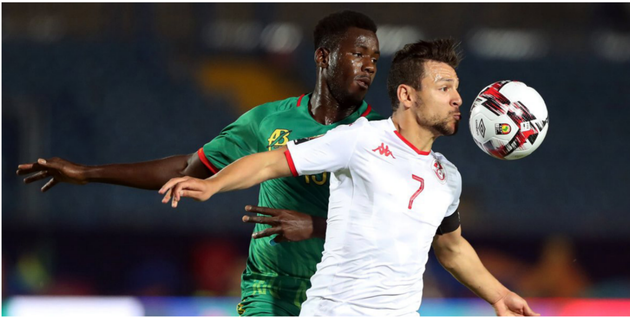
جانب من مباراة تونس والسنغال