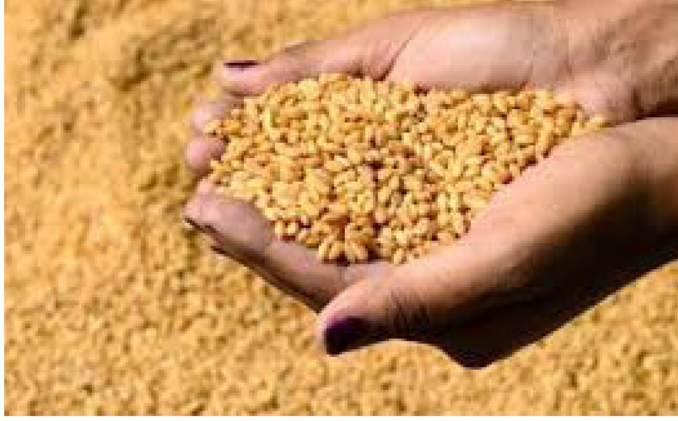
وفرة محصول الحنطة المسوقة في نينوى وكركوك

تسلم محافظة كركوك تجاوزت 387 الف طن من الحنطة المحلية فيما تواصل المراكز التسويقية التابعة لفرع الشركة العامة لتجارة الحبوب في كركوك والطقوز وكلال ونساعة وكركوك لتسلم كميات الحنطة المحلية المسوقة من المزارعين والفلاحين للموسم الحالي 2019 .