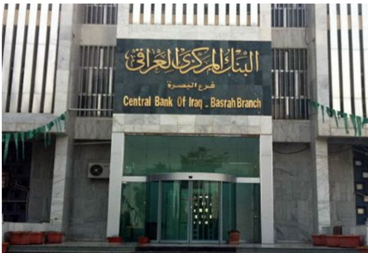
مبنى البنك المركزي العراقي

بغداد - الصباح الجديد: رفع العراق ملكيته من سندات الخزنة الأميركية بنسبة 40.41 بالمائة خلال شهر أيار 2019 على أساس سنوي. بزيادة تعادل 9.9 مليار دولار. ووفقاً لبيانات وزارة الخزنة الأميركية، بلغت حيازة العراق من سندات الخزنة الأميركية 34.4 مليار دولار. مقارنة بـ 24.5 مليار دولار في شهر أيار من عام 2018. وجاء العراق في المرتبة الرابعة على مستوى الدول العربية المالكة للسندات الأميركية، بعد السعودية متصدرة القائمة عربياً بقيمة 179 مليار دولار. والإمارات بـ 53.2 مليار دولار. ثم الكويت بـ 41.4 مليار دولار. وعلى أساس شهري، وصل العراق تخفيض ملكيته من أدوات الدين الأميركية للشهر الثاني على التوالي، بعد تراجعها خلال أيار الماضي مقارنة بقيمة التي كانت تبلغ 35.4 مليار دولار في نيسان 2019 أي بانخفاض قيمته مليار دولار. وينسب تراجع 2.8 بالمائة. وكانت ملكية العراق من السندات الأميركية تبلغ 36.2 مليار دولار خلال شهر آذار 2019. وانخفضت حيازة العراق من أدوات الدين الأميركية بشكل طفيف