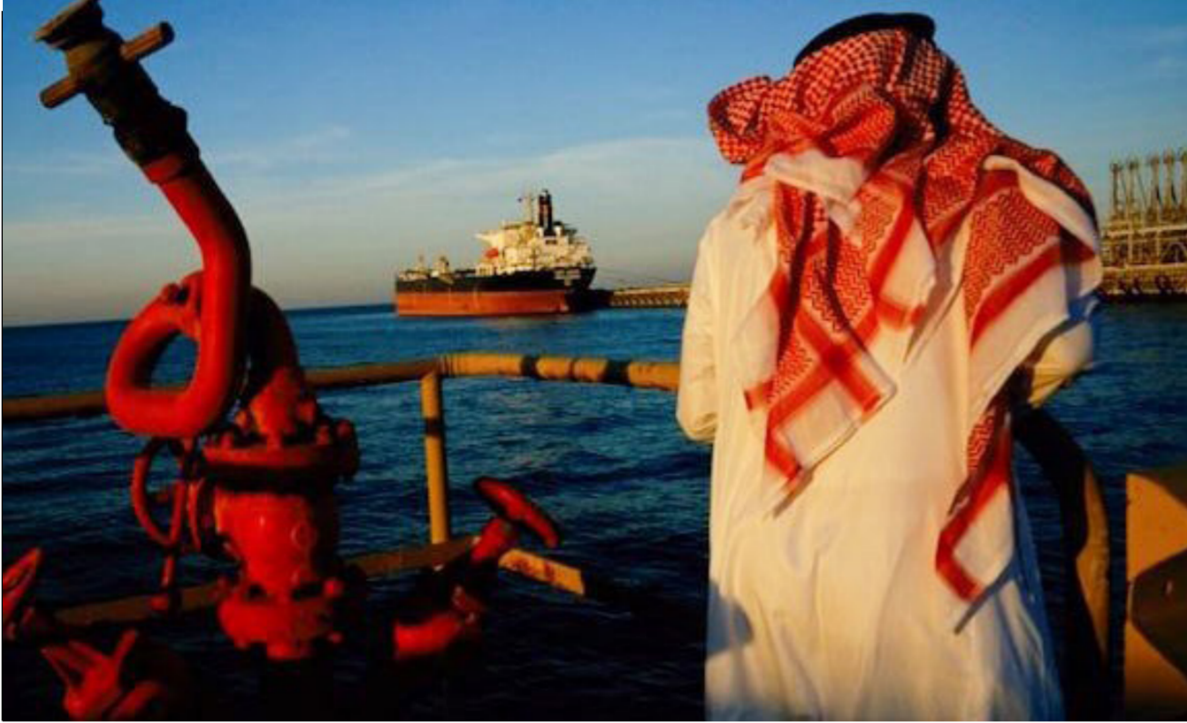
موقع نفطي عند المياه السعودية

مؤكداً أن «ذلك قد يؤثر في حماية القوات». من جهة أخرى، قال المتحدث باسم القيادة المركزية الأمريكية بيل أوربان إن تعليقات غيكا «تتعارض مع التهديدات الموثوق بها والمحددة المتوفرة لدى أجهزة الاستخبارات الأمريكية وحلفائها فيما يتعلق بالقوات المدعومة من إيران في المنطقة». وأشار المتحدث إلى أن مستويات الإنذار في الحقيقة قد تم رفعها بسبب التهديد الإيراني. وأضاف في بيان أن «القيادة المركزية الأمريكية بالتنسيق مع عملية العزم الصلب رفعت مستوى التأهب لجميع العناصر للمحققين لدى عملية العزم الصلب في العراق وسوريا». وتابع «وفي النتيجة فإن عملية العزم الصلب على مستوى عالٍ من الجاهزية في الوقت الذي نستمر فيه بمراقبة التهديدات المحتملة والشبكية على القوات الأمريكية في العراق عن كثب».