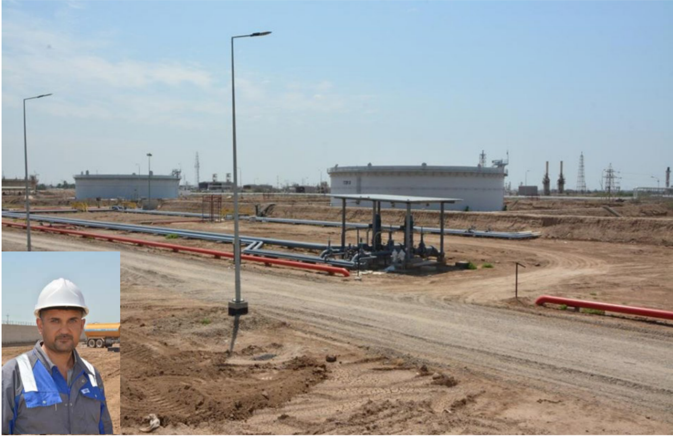
جانب من حقل شرقي بغداد.. وفي الاطار مدير الموقع

اما الاعمال فهي في طور اعداد التصاميم... ونوه بان «جميع الاعمال التي اجرت او هي قيد الاجاز تنفيذ من قبل المالكات الهندسية والفنية وبإيادي عراقية وان والعمل جار بهمة عالية للارتقاء بسمعة شركتنا كي تكون مصفاة الشركات العالمية من ناحية الجودة وسرعة التنفيذ».