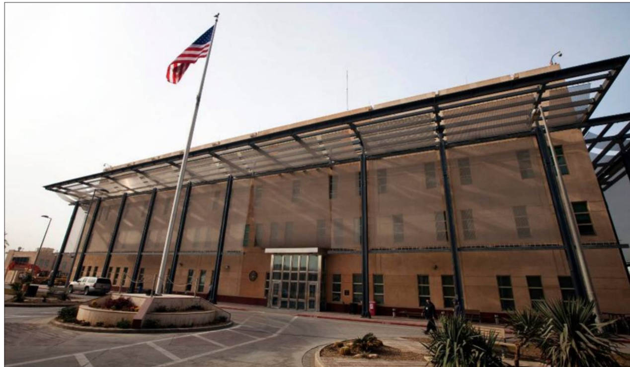
السفارة الأميركية في بغداد