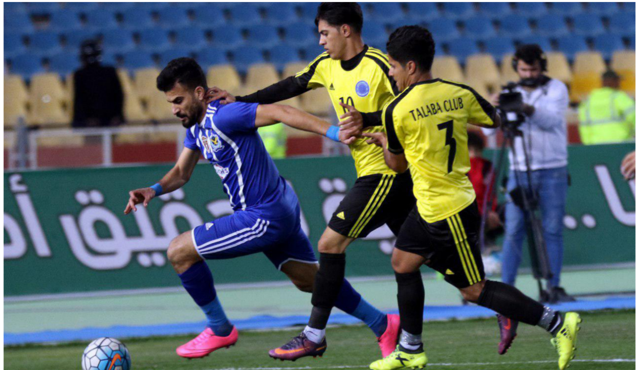
جانب من مباريات دوري الكرة الممتاز