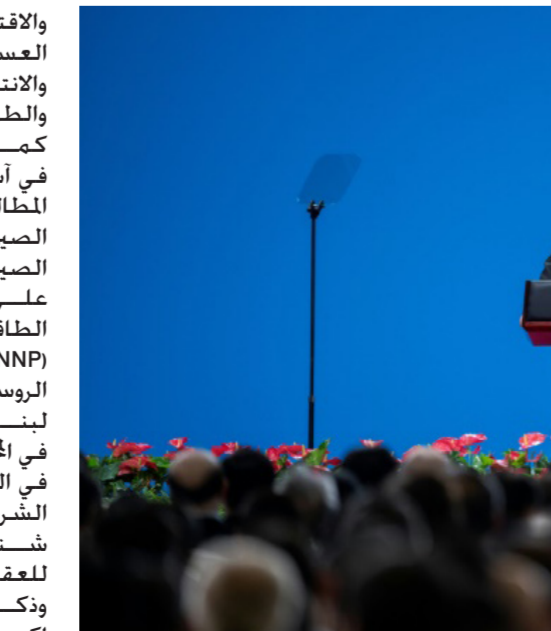
الرئيس الصيني شي جين بينغ

والاقتصادي الذي يشمل المساعدات العسكرية الأمريكية إلى تايوان والانتقادات لمشروع الصين «الحزام والطريق» للبنية التحتية العالمية. كما أثار نفوذ الصين المتزايد قلقاً في آسيا وخصوصاً مع مواصالتها المطالبة بجزر في منطقة بحر الصين الجنوبي المتنازع عليها وبحر الصين الشرقي. على صعيد آخر، وقعت شركة الطاقة النووية الحكومية الصينية (CNNP)، عقداً عاماً مع الشركة الروسية، أتوم ستوري إكسبورت» لبناء وحدتي الطاقة رقم 3 و4، في المحطة الكهروذرية «سيويديابو» التي جاء في بيان صدر عن الشركة الصينية، ونشر في بورصة شنغهاي، أن القيمة الإجمالية للعقد تبلغ 17.02 مليار دولار. وذكر البيان أن «أتوم ستوري إكسبورت» التابعة لشركة «روس أتوم الحكومية الروسية»، ستباشر