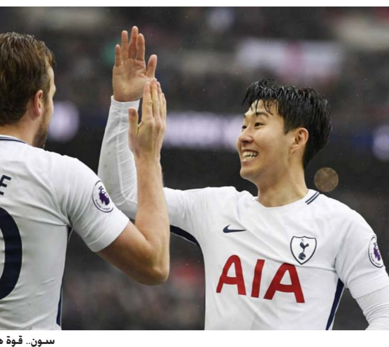
سون.. قوة هجومية في توتنهام الإنجليزي

سكوتاندر «لا أريد التكهن بالفوز أو الخسارة، أمأنا وقت طويل للاستعداد لهذه المباراة المهمة».