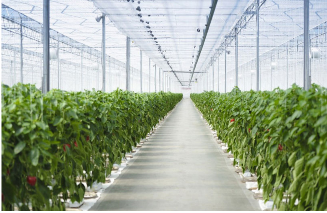
مزارع تحت الأرض

وقد تستعمل «الأملاك الجوفية بكل سهولة لأغراض الزراعة». بحسب ما قال أدميرال خلال زيارة لنفق يوربون المشيد تحت مدينة نابولي ليتيح لفريناندو الثاني ملك الصقليتين الهرب من أعمال الشعب التي وقعت