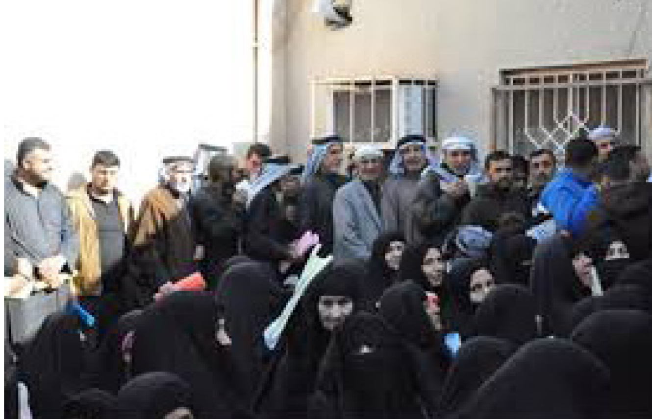
متمشولون بالرعاية الاجتماعية في انتظار صرف البطاقة

البحث الاجتماعي لهم وارسال الاستمارات الخاصة بهم الى وزارة التخطيط موجهها جميع ملاكات الهيئة بنهاية الاجراءات اللوجستية والفنية المعنية بالبحث.