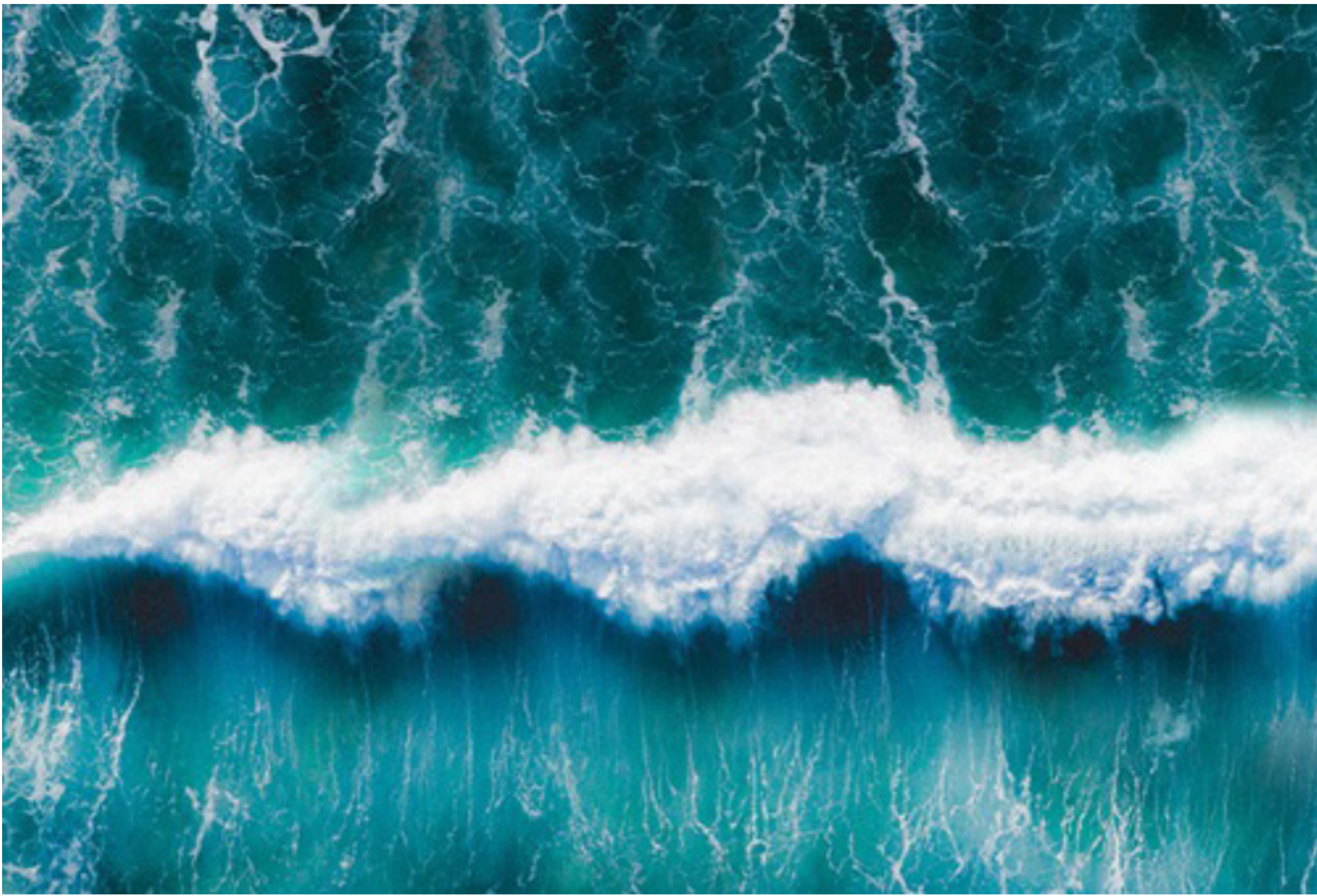
المناخ يؤثر على لون البحر

وفي عالم ارتفعت درجة حرارته بمقدار ثلاث درجات مئوية، وهو ما قد يحدث قبل نهاية القرن بالفعل. وجد أن تغييرات متعددة في لون المحيطات ستحدث، وتشير النماذج الحالية إلى أن المناطق الزرق الحالية من المحيطات التي تحتوي على القليل من العوالق النباتية ستصبح أكثر زرقة، ولكن في بعض المياه، مثل مياه القطب الشمالي، فإن الاحترار سيجعل الظروف أكثر نضجًا للفيتوبلانكتون. وستتحول هذه المناطق إلى اللون الأخضر.