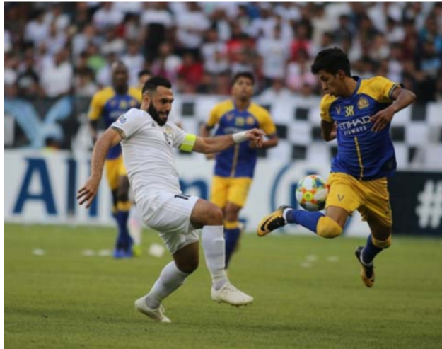
لحظة من مباراة الزوراء والنصر السعودي

مخولين إلى غرفة خلع ملابس اللاعبين خلال مباراة منتخب العراق الأولمبي مع تركمنستان ضمن التصفيات الأولمبية للمجموعة الثالثة والتي أقيمت في طهران.