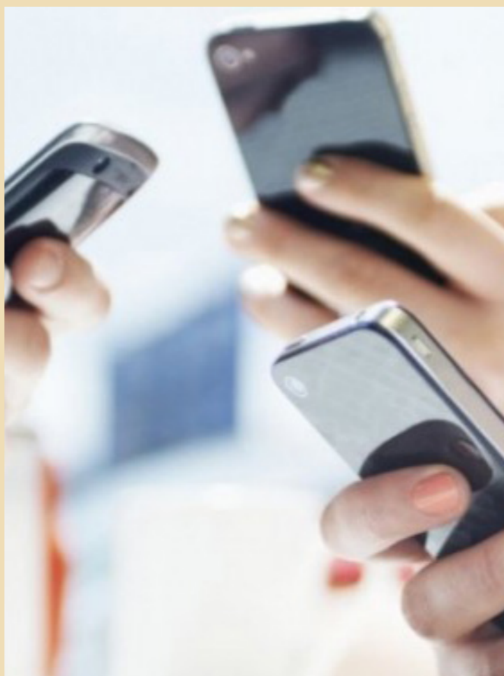
الانسان الحديث وعلاقته بمواقع التواصل

الناس. بحسب همفريز. لطلالما استعمالوا وسائل الإعلام لرؤية انعكاسات لأنفسهم وذلك قبل الهواتف المحمولة بوقت طويل أو حتى التصوير الفوتوغرافي. فالفكرات كان يجري الاحتفاظ بها ليفهم الإنسان عن نفسه وعن العالم الذي يعيش فيه. وفي القرنين ال18 وال19. عندما أصبحت البيومات غير الدينية أكثر شعبية. كتب المنتمون للطبقة الوسطى في نيو إنجلند. لا سيما النساء البيض. عن حيواتهم اليومية والعالم من حولهم. لم تكن هذه البيومات مكاناً يصوبون فيه أفكارهم ورغباتهم العميقة. وإنما كانت مكاناً لتأريخ العالم من حولهم. ما الذي يحدث حول البيت. وما الذي فعلوه اليوم.