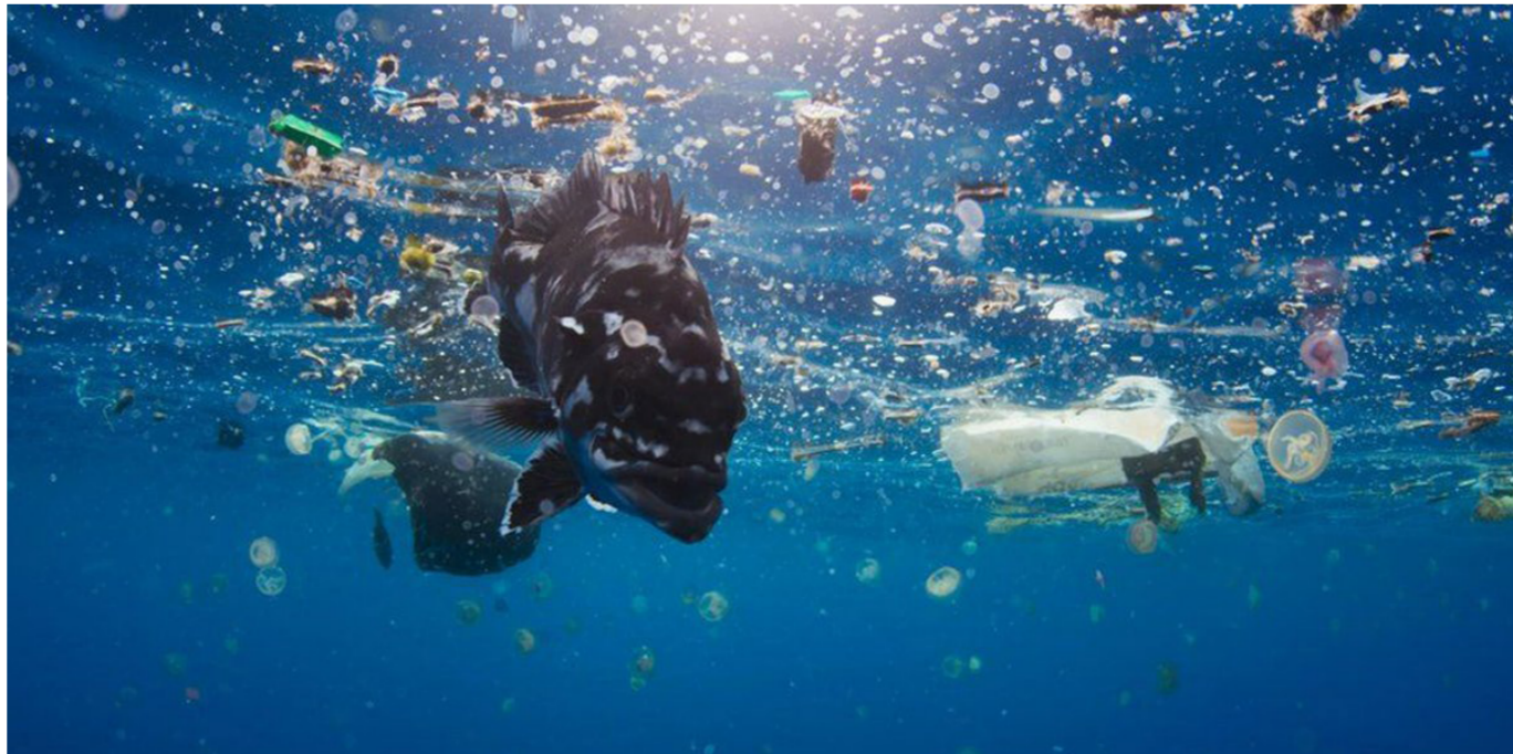
مخلفات بلاستيكية في مياه المحيطات

أن يكون لها تأثير على تلوث المحيطات وضمان ألا ينتهي المطاف بمخلفات البلاستيك في مثل هذه الأماكن.