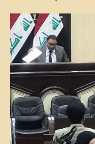
جلسة سابقة لبرلمان

بغداد - وعد الشمري: أكد خالف الاصلاح والاعمار، أمس الأربعاء حراكاً سياسياً واسعاً لإنهاء ملف إدارة الدولة بالوكالة قبل الموعد المحدد نهاية الشهر المقبل فيما أبدى تخوفه من وصول المحاصصة إلى الدرجات الخاصة، مبيناً أن قسماً منها سوف يصوت عليه في مجلس الوزراء والآخر في مجلس النواب وفقاً للاختصاصات الدستورية.