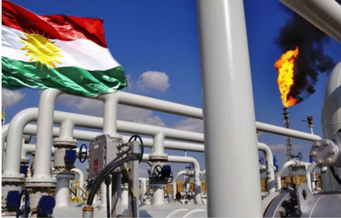
أحد الحقول النفطية شمال العراق

شركات النفط العاملة في جميع المحافظات العراقية، والوزارة خصصت من هذه المبالغ 300 مليار دينار إلى الإقليم أي ما نسبته 2% من المبالغ الإجمالية، وكان وزير النفط ثامر الغضبان، أكد في وقت سابق، ان «اتصالا قريبا سيكون مع الإقليم لاتخاذ الإجراءات المناسبة، وتنفيذ ما تم إقراره في الموازنة»، مبينا أن «الحكومة الاتحادية ملتزمة بالتأشور وليس هناك شيء يتفاوض حوله معهم»، يشار إلى ان قانون الموازنة العامة للعام 2019، يلزم الحكومة الاتحادية بصرف مستحقات ومرتبوات موظفي إقليم كردستان وقوات البيشمركة شهريا، مقابل التزام حكومة كردستان بتصدير 250 ألف برميل من نفطها يوميا عبر شركة «سومو» التابعة إلى وزارة النفط الاتحادية.