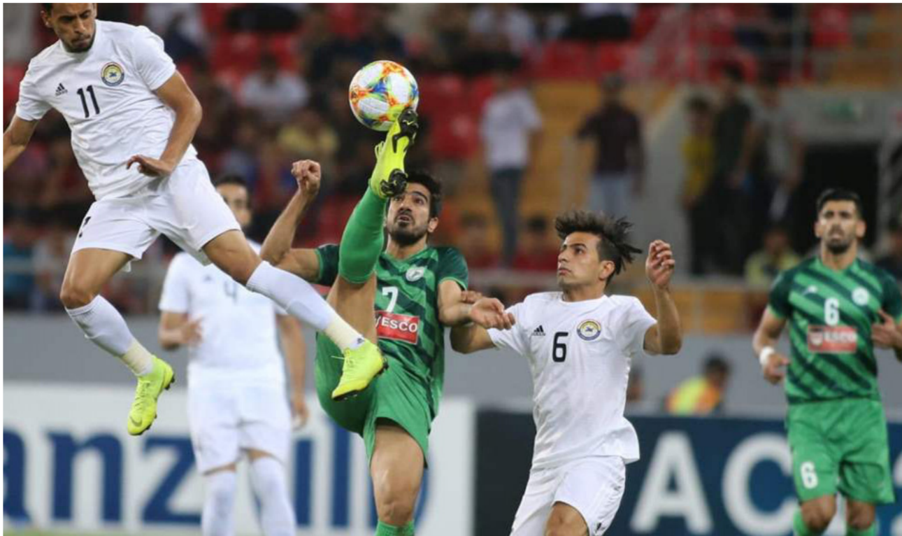
جانب من مباراة الزوراء وذوب آهن