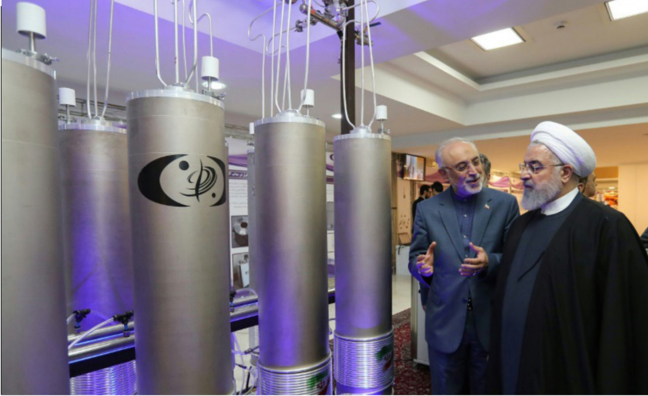
روحاني في منشأة نووية