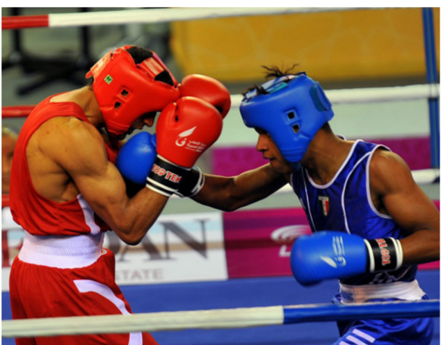
احد نزالات لاعبي الملاكمة "ارشيف"