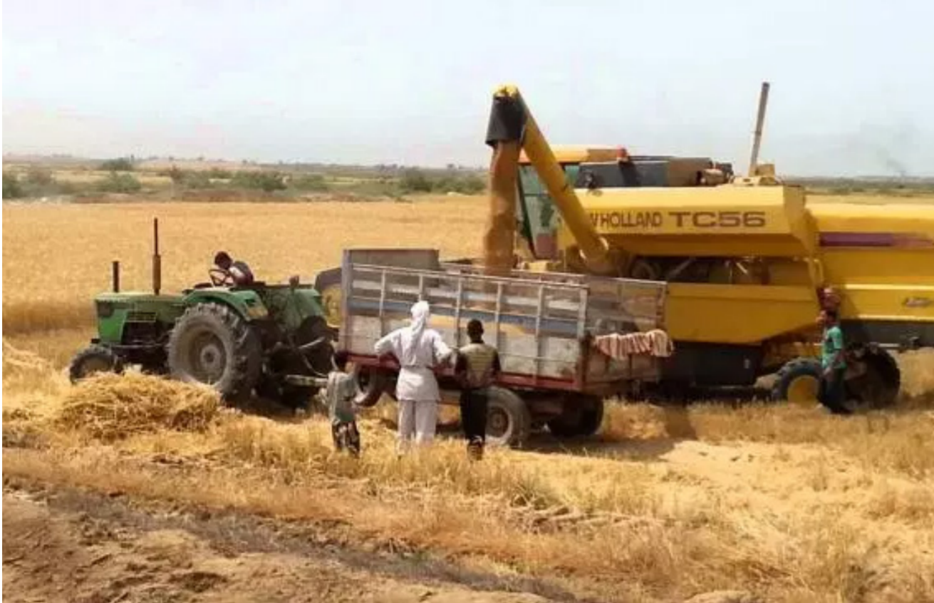
جآوزت الحنطة المسوقة 206 آلاف طن

فأن ما وصل الى واسط من مياه يكفي لانعاش الزراعة وزيادة الانتاج. وأوضح الربدي، ان «الحجّان بدأت باستقبال الحاصل الزراعي التي جرى حصادها منذ اكثر من 10 ايام، ومن المؤمل ان يزداد الحصاد اكثر خلال الايام القليلة المقبلة».