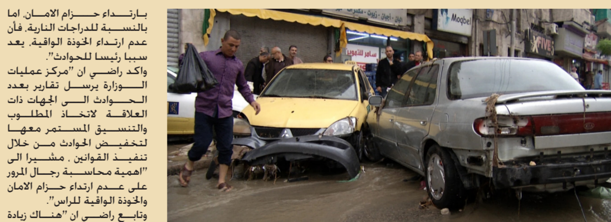
حوادث مروري "ارشيف"