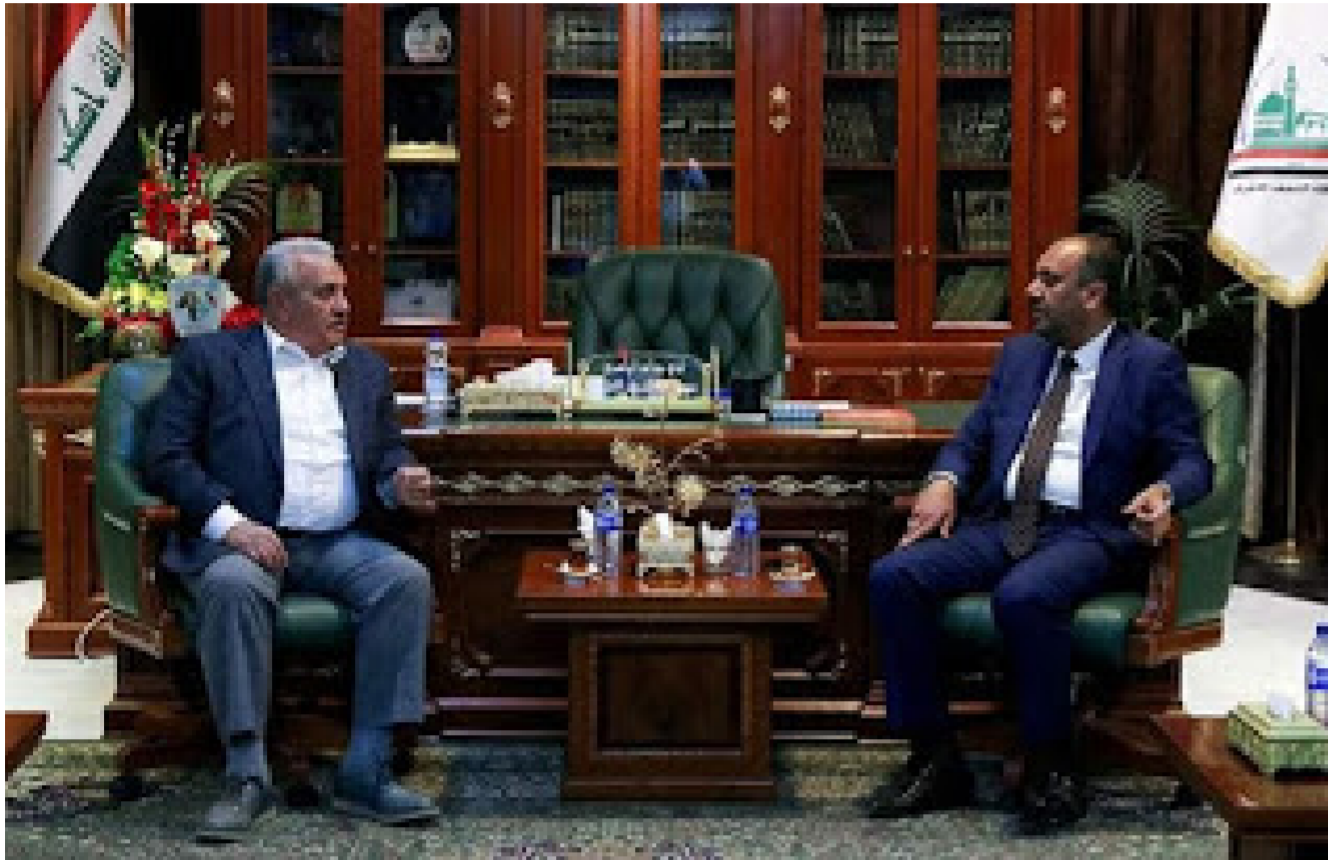
اثناء زيارة الوزير النجف