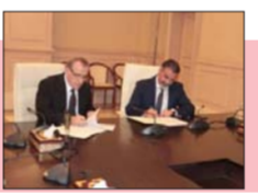
نقل صلاحية مراكز التأهيل الطبي من الصحة رسمياً إلى العمل

استرداد أموال العراق من الخارج اكتمل وسيدخل حيز التنفيذ". من الخارج اكتمل وسيدخل حيز التنفيذ. وقال الخفاجي في تصريح اطلعت عليه الصباح الجديد، إن "قانون