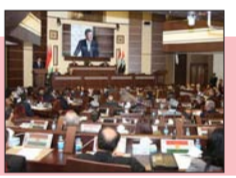
خطوات تشكيل حكومة الاقليم تدخل حيز التنفيذ بعد الاتفاق النهائي للأحزاب الرئيسة

بموجب محدد. وأضاف الخفاجي أن التهم الموجهة للقضاء ومخالفين لشروط "الاستيزار" من أجل اقالتهم، مبينا أن الكتل السياسية بانتظار رد عبد المهدي للخروج