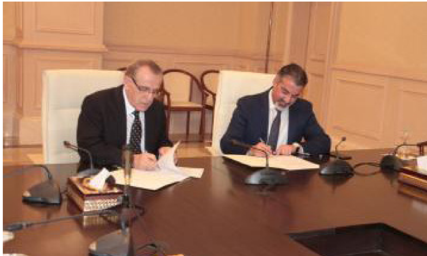
جانب من توقيع الاتفاقية

وفيما يتعلق بزوي الاعاقة، بين الوزير أن الوزارة سارعت إلى ادراج هذا الموضوع في البرنامج الحكومي ووضعت خطة للذين لم يتم شمولهم بخدمات ذوي الاعاقة منذ عام 2016. فيما أشار إلى أن هناك نحو مليون و250 ألف باحث عن العمل مسجلين في قاعدة بيانات الوزارة موزعين بين حاملي شهادات عليا واصحاب خبرة تسعى الوزارة لأيجاد برامج وخطط لتوفير فرص عمل لتلك الفئات.