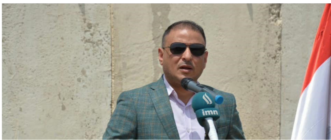
محمد المياحي محافظ واسط

يقول المواطن (شعبية) « وكشفت المحافظ عن «تخصيص مبلغ ملياري دينار من موازنة المحافظة مع مبلغ 500 مليون دينار صوت عليها مجلس المحافظة من خلال صندوق دعم واسط. اذ ستوزع تلك الاموال لشراء محولات حيث هناك حاجة ماسة الى 400 محولة جديدة ومواد صيانة للحاجة مختلفة لتنفيذ برامج الصيانة الدورية والطائرة للشبكات والمحولات والقابلات والهوائية والارضية وغيرها». وأشار المحافظ الى أنه « سيتم توجيه دوائر المحافظة كافة بإطفاء الكهرباء عنها بدءاً من الساعة الثانية عشرة ظهراً ويكون اعتمادها على المولدات الخاصة بها لضمان زيادة ساعات