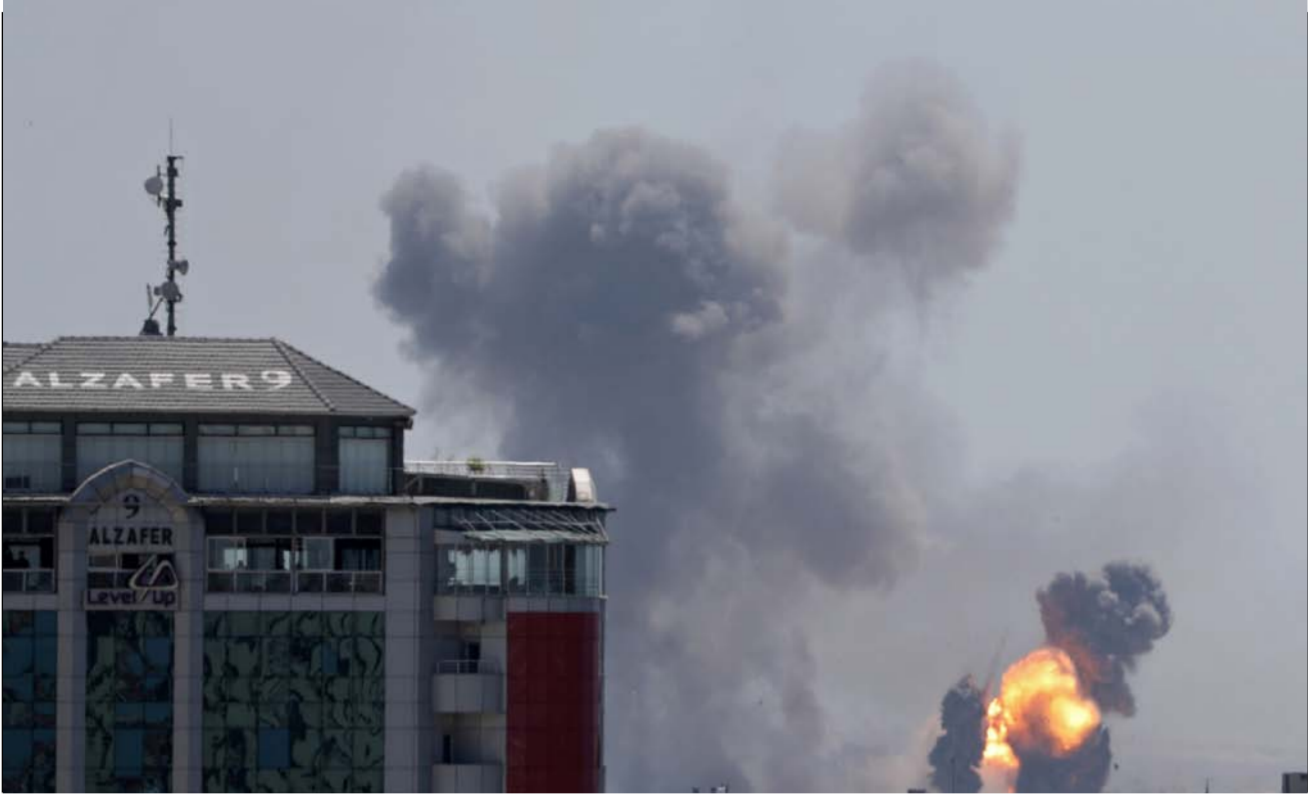
اثر تبادل القصف بين غزة وإسرائيل

ومن جهته أكد الرئيس الأمريكي دونالد ترامب أمس الأول الأحد أن إسرائيل خطى بدعم واشنطن الكامل. وكتب ترامب على تويتر «مرة جديدة، تواجه إسرائيل وابلًا من الهجمات الصاروخية القاتلة من الجانب حركتي حماس والجهد الإسلامي الإرهائيتين. نحن ندعم إسرائيل 100% في دفاعها عن مواطنيها».