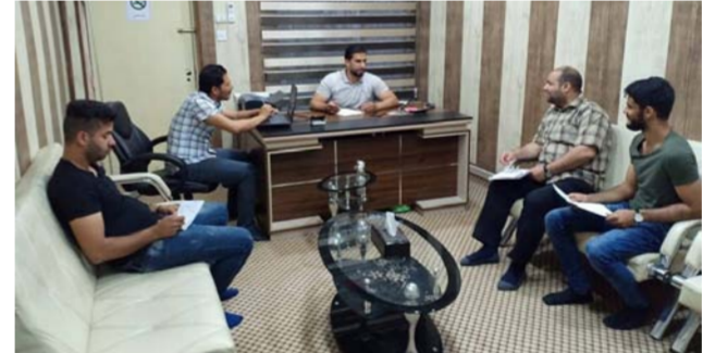
اجتماع آحاد الجيت كون دو