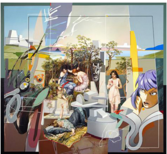
من أعمال الفنان محمد الرواس

فقط. بل هي محاولة لإحياء العمل الفدح داخل العمل الجديد وإيجاد فضاء له ليتنفس داخل اللوحة. تبدو الموديل كأنها صورة فوتوغرافية مرسومة بواقعية ودقة، والخيوط في الوسط توحي بتناغم بينهم، لا يلاحظ المتلقي أحياناً أن هذه الشخصيات تتحدث مع بعضها، حيث لا حوار بينها، فكل شخصية مشغولة بعالمها، ولكن وجودها يتقاطع مع وجود الشخصيات الأخرى، حيث الانسجام والتداخل بين الألوان. يبدو المزج بين الألوان أيضاً مشغولاً بطريقة ذكية ومتناسقة مع رؤية الفنان العمارة، ففي إحدى اللوحات، جُلس الموديل في منتصف اللوحة، بينما لون ثورتها يأتي بنفس لون ثوب الرجل الجالس خلفها، رغم اختلاف شكل الثوب ونوعيته، إنها محاولة لأن تكون هناك وحدة فنية واحدة من خلال اللون، ورغم هذه المحاولة إلا أن الفنان يهدف أيضاً في ترك كل شخصية على سجيته معلنة استقلاليتها وانمائها لزمناها الخاص الذي تتسع له وتتفهمه حدود اللوحة.