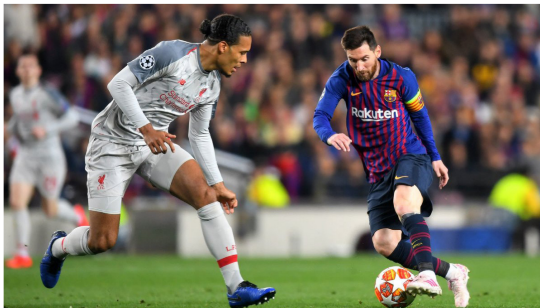
ميسي في محاولة لتخطي فان دايك

وأعلن الآحاد الأوروبي لكرة القدم «يويفا» أن الحكم جونيت تشاكر، سيدير مباراة ليفربول وبرشلونة، في اليوم الثلاثاء على ملعب «أنفيلد»، في إياب نصف نهائي دوري أبطال أوروبا.. وسبق وأدار تشاكر هذا الموسم مباراة