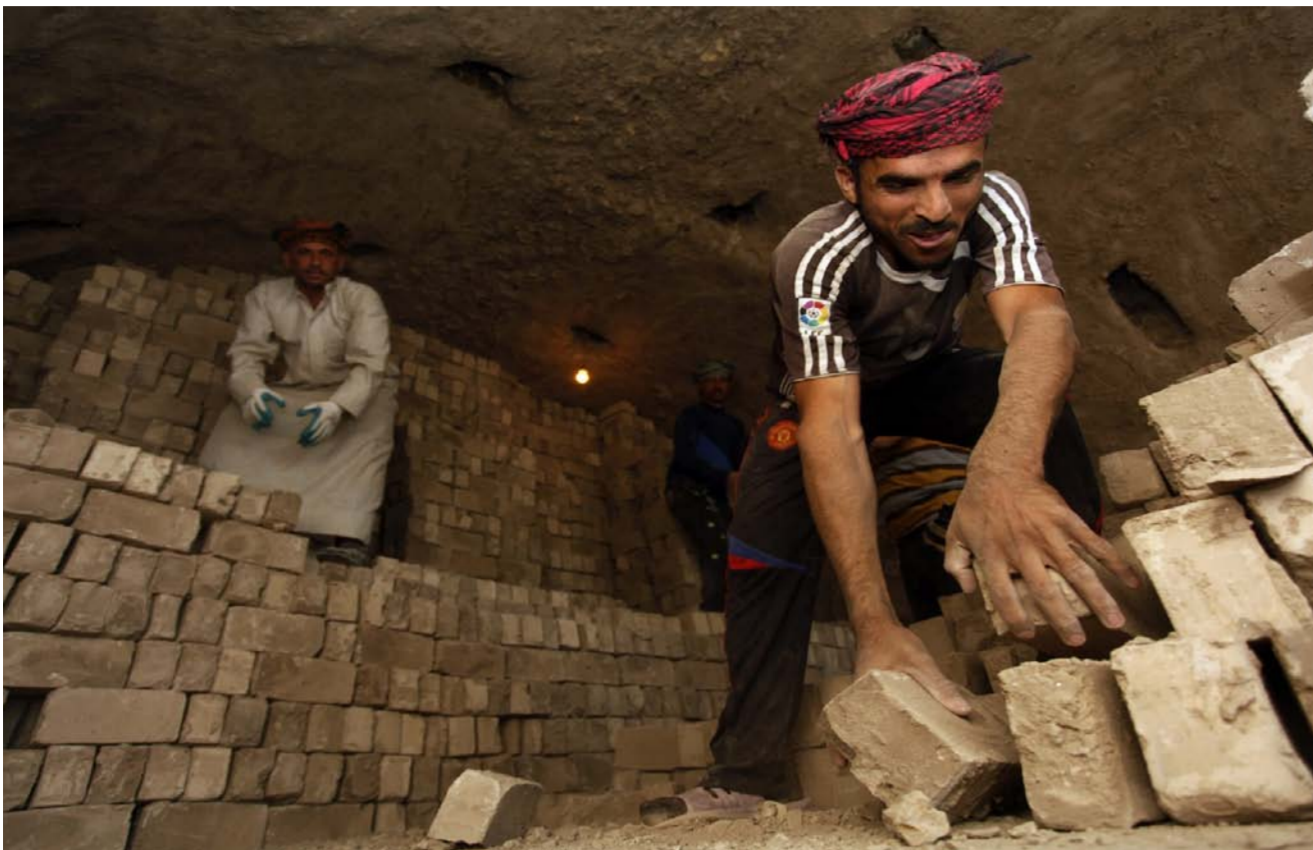
الحاجة تدفع الى العمل المزدوج

الحياة الأساسية يصل إلى 107 دولارات في الشهر. لكن مراقبين قالوا إن ما تضمنه التقرير بشأن معدل إنفاق المواطن العراقي شهرياً غير دقيق، لأن معدلات الإنفاق أعلى بكثير. ويواجه العراق الغني بالنفط أزمتا اقتصادية ومالية خانقة، أدت إلى زيادة العجز بالوازنة. وشهدت العديد من المحافظات في فترات سابقة مظاهرات شعبية ساخطة احتجاجاً على تدهور الخدمات وغلأ المعيشة وتفاقم البطالة.