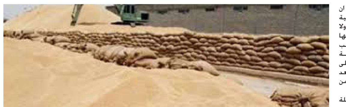
محاصيل الحنطة المسوقة

عالية وبيوتيرة متصاعدة . كما ان الوحدات الحساوية تقوم بعملية كناية وتنظيم الصوك اولا وأول وتسليمها إلى مستحقيها من المسوقين الفلاحين وحسب الضوابط المتبعة . وان عملية التسلم في جميع المواقع جري على وفق الضوابط المتعمدة وذلك بعد إجراء جميع الفحوصات المختبرية من قبل ملاك وحدة المختبر . من جانب اخر اشار جبر الى مواصلة الملاكات الهندسية والفنية في فرع ذي قار اعمالها في انشاء البنكر