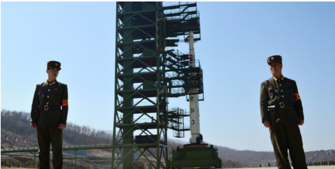
مناًشاً للصواريخ في كوريا

غير أن نظام كوريا الشمالية امتنع حتى الآن عن اختبار صواريخ بالستية أو أسلحة نووية، ما سيعني وقف التصارب الجاري مع سيول واشنطن بصورة نهائية، وتعود آخر عملية