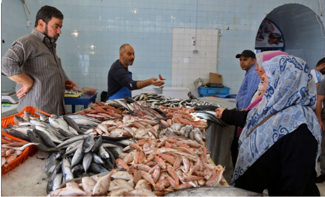
ازمات ليبيا مستمرة

المتحدة المزيد من الوقت لدراسة الوضع. أما فرنسا التي تنهزمها سياسياً فقد نفت ذلك ودعمت إلى «عملية سياسية برعاية الأمم المتحدة». ويقول أرنو دولالاند «مع الجمود التقريبي للجبهات، فالفرق الوحيد يمكن أن يحدثه ضربات جوية». لكن في بلد تنتشر فيه جماعات مسلحة متقلبة الولاء، فإن تبدل التحالفات سريع بقدر ما هو غير متوقع. من المحتمل دائماً أن تفقد طرابلس دعم الزاوية، الواقعة على بعد 50 كلم غرب العاصمة. وفق حرشاوي الذي يصف أن «في هذه المدينة الاستراتيجية، جزء من الجماعات التي تعتمد عليها طرابلس قابلة للرشوة والفساد. مقاومتهم لن تدمر إلى الأبد». واستبعدت حكومة الوفاق الوطني أي مفاوضات مع خليفة حفتر طالما لم يسحب قواته. وبالنسبة لجلال حرشاوي «حتى ولو فرض وقف لإطلاق النار، من غير المرجح أن يتراجع الجيش الوطني الليبي. إنما أمام احتمال حرب طويلة جدا وغير نظيفة».