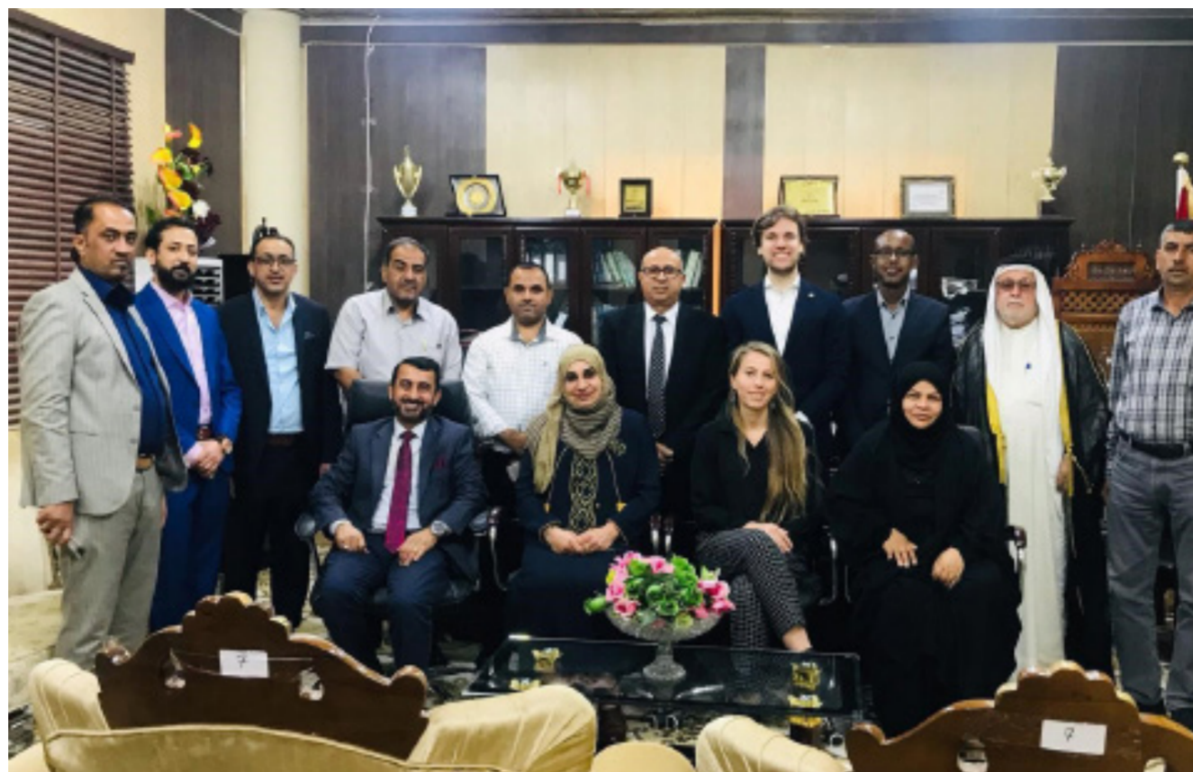
جانب من زيارة الوفد الهولندي لكلية زراعة جامعة البصرة