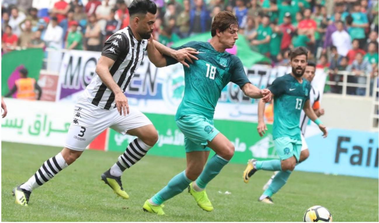
لقطة من مباراة سابقة لدوري الكرة الممتاز