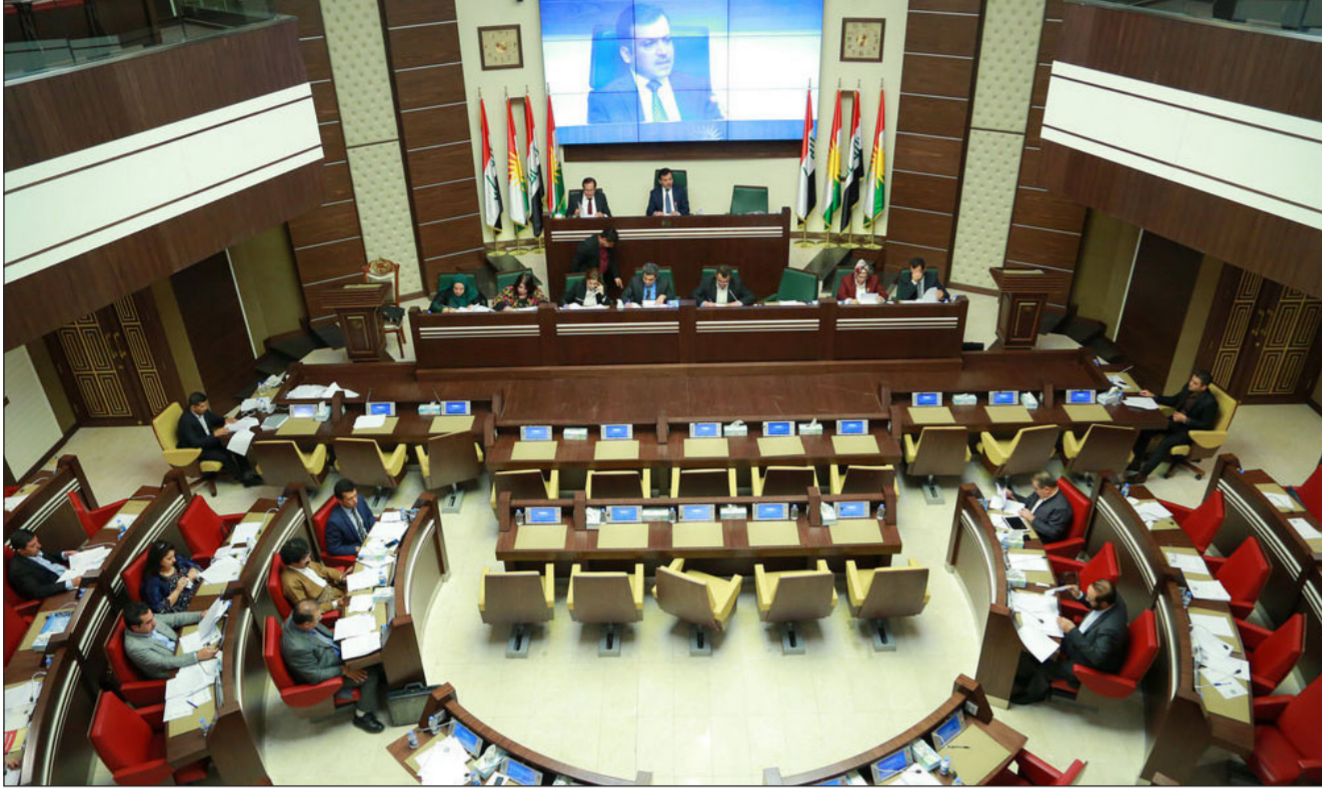
برلمان الاقليم "ارشييف"

الاقليم، الحزب الديمقراطي سيزور اليوم الاحد حركة التغيير في مدينة السليمانية للتباحث حول اخر تطورات تشكيل الحكومة. واضافت فريد ان برلمان كردستان الرئيسية المشاركة في حكومة الاقليم والاتفاق على تشكيل حكومة الاقليم. لان برلمان كردستان وفقا لفريد سيكون جزءا من الحبل وخلق التوافق بين الاطراف ولن يكون عقبة امام تقدم العملية السياسية في كردستان. يشار الى ان الخلافات بين الاطراف والقوى السياسية الكردستانية والناقص داخل الاحزاب نفسها وخصوصا الحزب الديمقراطي اسهم بتأخر تشكيل حكومة. الذي كان يفترض الانتهاء منه خلال شهر من بعد انتهاء الانتخابات في كردستان.