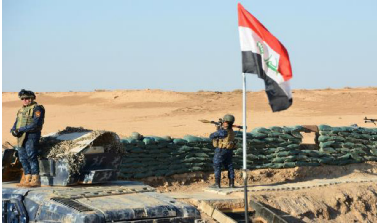
الحدود العراقية السورية "ارشيف"

تكون الأخيرة: كوننا بحاجة إلى استمرارية التفتيش والتمشيط في المناطق الصحراوية ومتابعة أي عملية تسلسل متوقعة