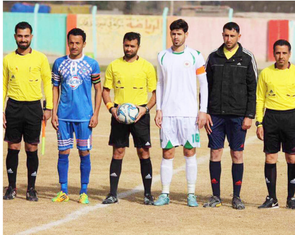
يقود احدي المباريات