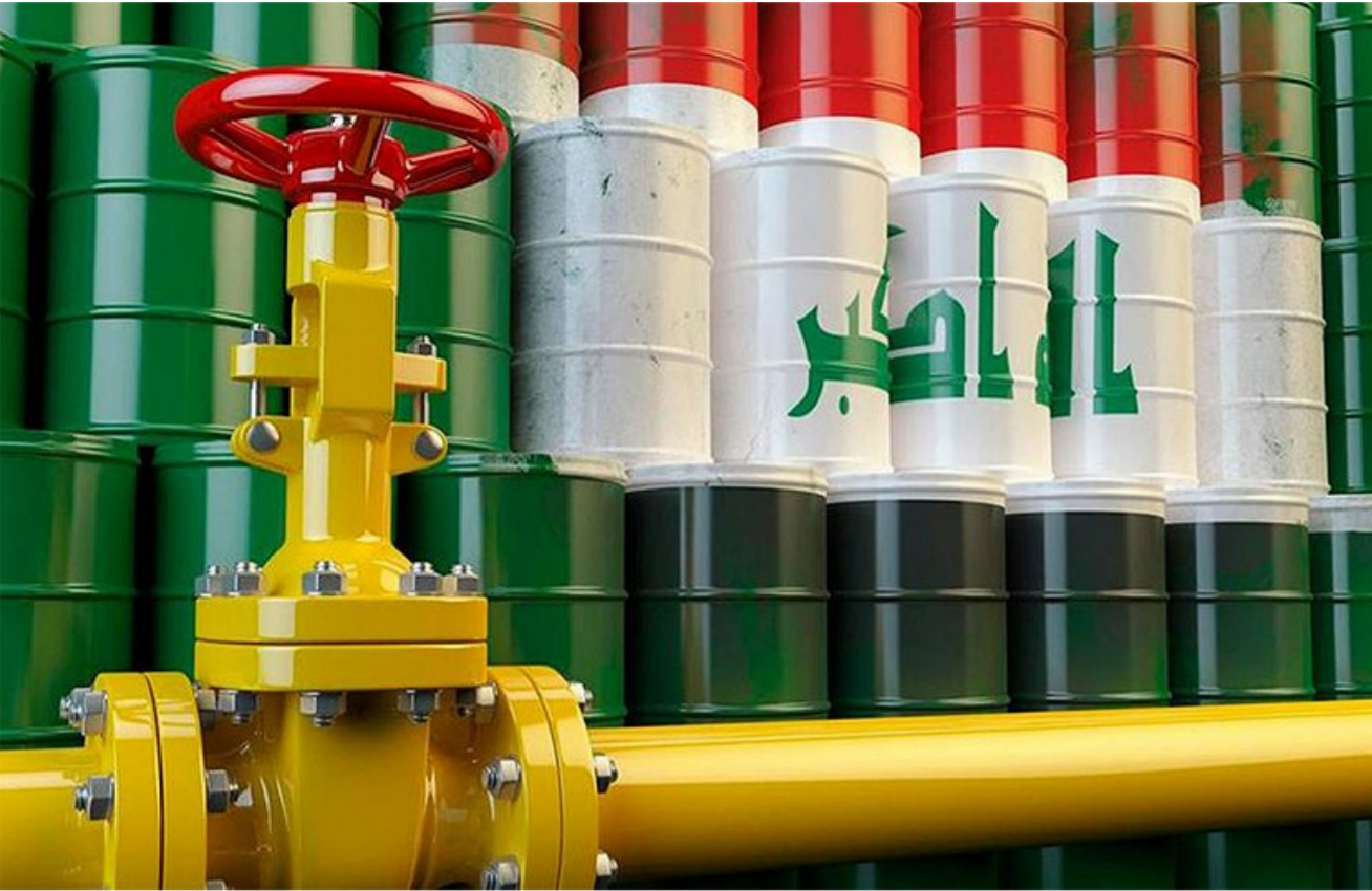
برميل النفط العراقي

الإنتاج هناك أيضا. ويقول متعاملون إن تركيز السوق حول إلى التخفيضات الطوعية للإمدادات التي تقودها أوبك، التي تضم السعودية أكبر مصدر للنفط في العالم، وقال بنك أي.إي جي "نرى أن السعودية ستترفع الإنتاج في أيار، وهو أمر كانوا سيقومون به في كل الأحوال على الأرجح قبل الصيف".