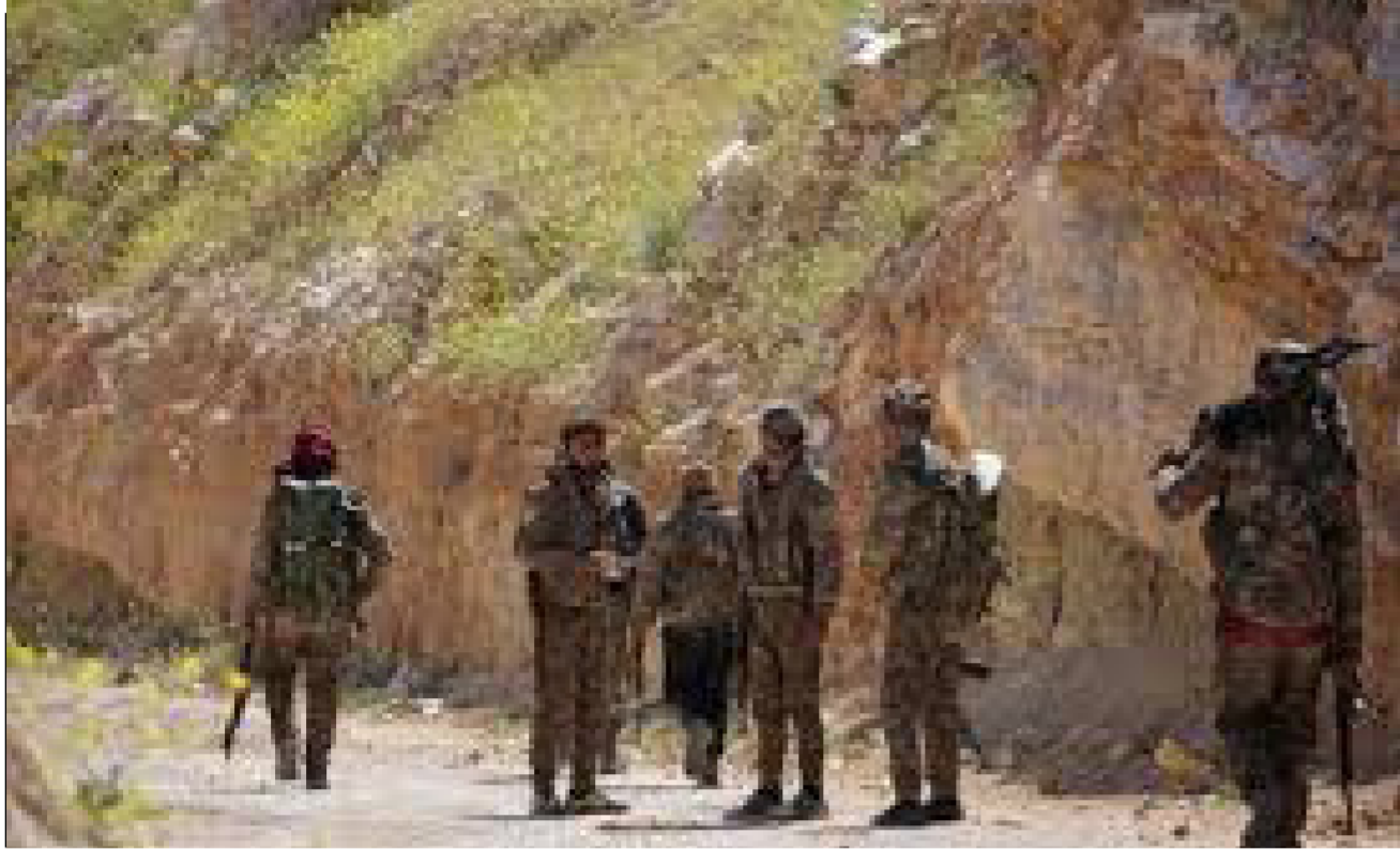
قوات سوريا الديمقراطية في دير الزور

السياسات العربية قومية أكثر عليهم ثقافتهم قبل اندلاع الصراع السوري في عام 2011 ورفع مظاهرون غاضبون ببلدة الطيان لافتة امس الاول الأحد تقول «سجون قوات سوريا الديمقراطية.. العرب 100 بالمنة الأكراد صفر بالمنة. أين العدل». وفي تغطيته للمظاهرات، عرض التلفزيون الرسمي السوري لقطات لشاحنات نفط يتم إيفؤها وخويل مسارها وزعمت أن قوات سوريا الديمقراطية أطلقت الرصاص الحي على المحتجين.