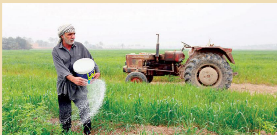
الزراعة تقر خطتها الزراعية للموسم المقبل