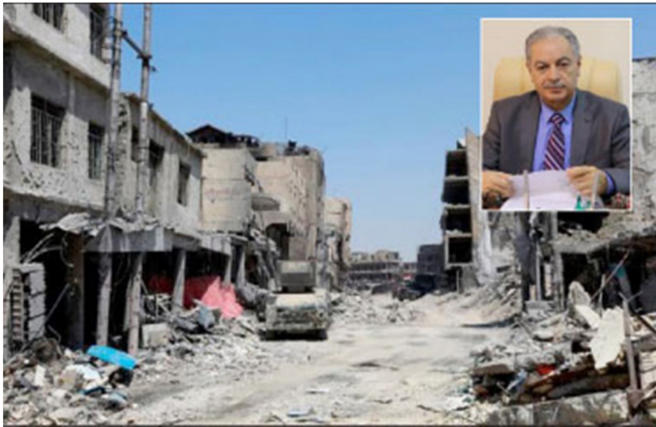
احدى المناطق المحررة واضرارها الكبيرة

وقّع رئيس صندوق إعادة اعمار المناطق المتضررة من الارهاب الدكتور مصطفى الهيتي على محضر تنفيذ منحة جمهورية الصين الشعبية للعراق المتضمنة (118) آلية مع الأدوات الاحتياطية الملحق بها . التي تبلغ قيمتها 11 مليار دينار عراقي . فيما وقعها عن الصين سفيرها في بغداد تشانغ تاو . وتضمنت الآليات 12 شيفلا و6 كيردرات و3 حضارات و16 حفارة متعددة الأغراض ( باكهو ) و3 شاحنات رفع ( هيباب ) و2 صاروخية و30 كابسة نفايات و18 حوضية سعة 10 الاف لتر و8 سيارات سحب مياه ثقيلة و20 قلاب سكس ويل . إضافة الى 105 حاويات من المواد الاحتياطية لتلك الآليات في حالة حدوث عطل أو خلل في عملها . وقد تم صنع هذه الآليات من قبل الشركات الصينية العملاقة مثل ( زوم لاين ) و ( دونغو موتورز ) و ( سينو مساك ) بمواصفات تضاهي - بل وتفوق أحيانا - الماركات العالمية مثل كتريلر واسوزو وغيرها . وقد وزعت بحسب نسبية الضرر والاحتياج الفعلي في المحافظات المحررة بواقع 36 آلية لتينسوي و36 لالانير و15 لصلاح الدين و11 لديالى و9 لكركوك و7 لاطراف بغداد وواحدة لجرف النصر في بابل . كما تضمنت المنحة الصينية تدريب 10 من العاملين على تشغيل هذه الآليات في جمهورية الصين الشعبية لمدة ثلاثة أسابيع . وكانت جمهورية الصين الشعبية أعلنت استعدادها لتشجيع شركات بلدها للمشاركة في إعادة اعمار المناطق المتضررة من الارهاب . وقال السفير الصيني تشانغ تاو خلال توقيع محضر تنفيذ المنحة