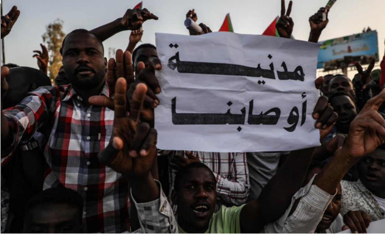
العسكر السوداني يدعن للمدنيين

الحكومة الانتقالية المدنية، وأنها بدأت بالفعل بالتفاوض مع القوى الأخرى في البلاد لتقديم مرشحيهم للحقائب الوزارية. إلا أن العقبة الوحيدة تكمن في الفترة الانتقالية، إذ ترى المعارضة أن «فترة الأربع سنوات كافية لتنفيذ الحكومة برنامجها، فيما يرى المجلس العسكري أن فترة السنتين كافية لإجراء انتخابات يشارك فيها الجميع» وأطاح المجلس العسكري بالرئيس السوداني عمر البشير في 11 من الشهر الجاري. وعزله بعد أشهر من الاحتجاجات، كما وأقال عددا من المسؤولين السابقين واعتقل البعض الآخر وأعلن إجراءات لمكافحة الفساد ووعده بأن يسلم السلطة التنفيذية لحكومة مدنية، لكنه أشار في السابق إلى أن السلطة السيادية ستظل في يده.