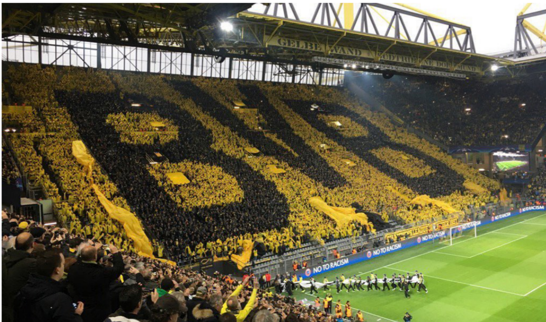
جمهور بروسيا دورتموند الألماني

هذا وسجلت الدراسة تراجعاً لأندية عريقة في معدل الحضور الجماهيري بسبب نتائجها المتواضعة وعجزها عن تحقيق الألقاب الكبيرة خلال هذه الفترة على رأسها نادي ليفربول الإنجليزي الذي شهد معدل حضوره 47 ألفاً فقط على ملعبه بكالاتيفلد رود». وأيضاً أي سبي ميلان الإيطالي