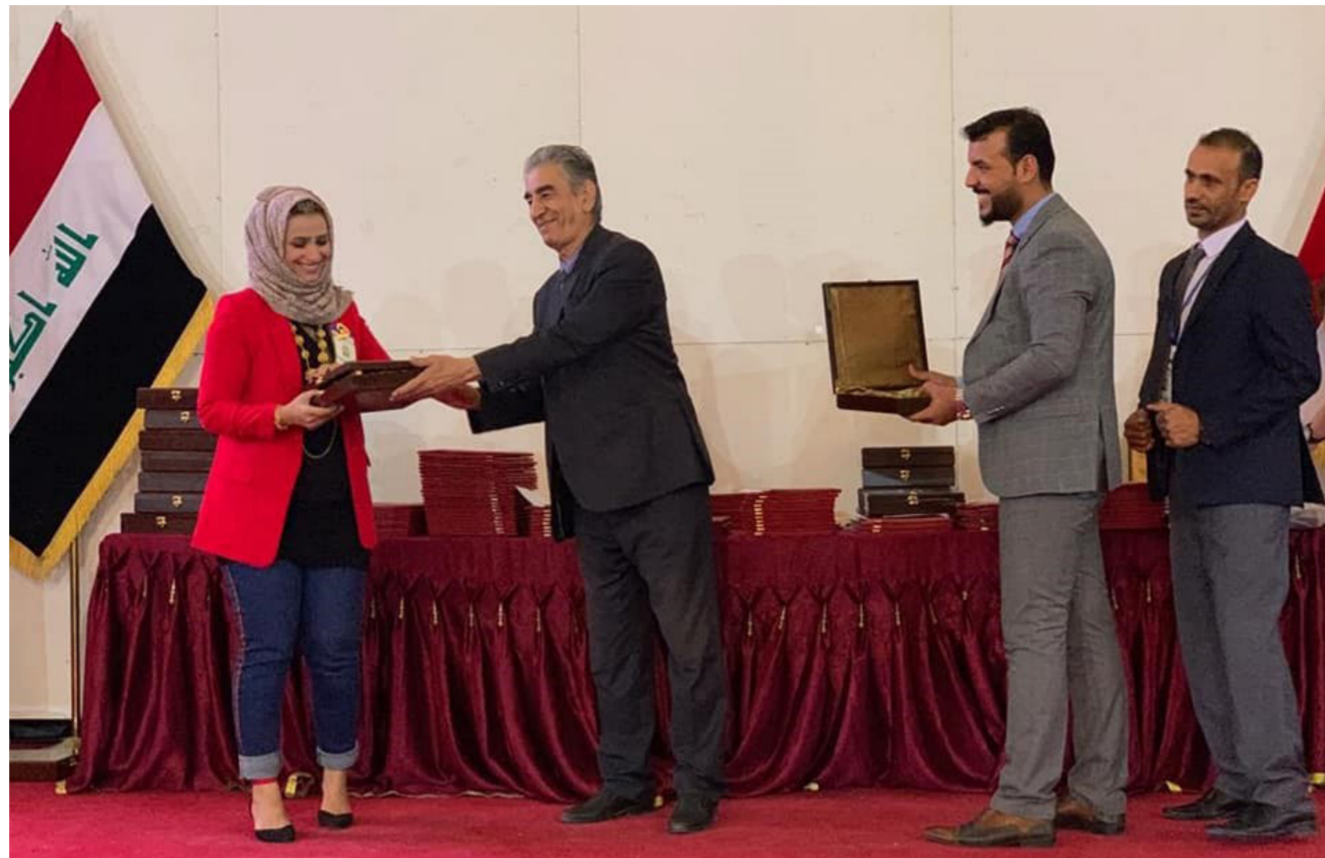
جانب من اختتام اسبوع السلامة في شركة نفط البصرة