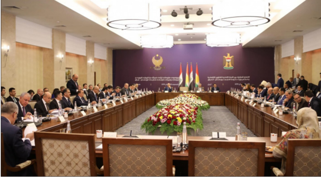
جانب من الاجتماع بين الحكومة الاتحادية وحكومة الاقليم

شاسع بين آلية الدفع من قبل العبادي وعبدالمهدي. وأوضح « يبدو أن السيد عبدالمهدي لديه توجه واضح ورؤية استراتيجية لحل ملف النفط مع إقليم كردستان. ولديه نوايا جديّة لحل هذه المعضلة وما رافقها من مشكلات عالقة منذ سنوات بين الجانبين. وهذه التوجهات الإيجابية تستحق أن ندعمها وننضم معها». ودعا الأشخاص الذين يستهدفون عبدالمهدي لمنحه فرصاً أكثر لحل ما يستطيع حله من المشكلات بين بغداد وأربيل. وخصوصاً فيما يتعلق بالملف النفطي الذي أكد أنه يؤيد أن يتم اعتماد مبدأ الشفافية فيه. وأن يتم بيعه من خلال شركة سومو. والشئ الأهم أن لا يدفع مواطنو الإقليم ضريبة الخلافات كما حصل في عهد العبادي الذي تنصل عن إيجاد حل لهذه المشكلة وبالتالي تمت سرقة نفط الإقليم وبقي الناس بلا رواتب».