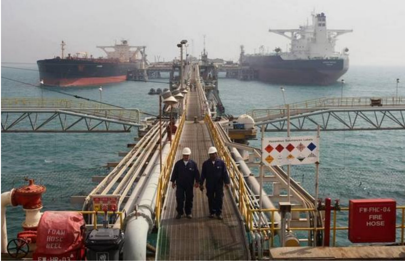
أحد الموانئ النفطية

شباب إلى القوى العاملة. لسوء الحظ، يشعرك الكثيرون في العراق بأن النفط يمكن أن يوفر الوظائف المطلوبة، لكنه لا يمكن أن يوفر سوى 10% مما هو مطلوب». وشهد «هناك حاجة إلى قطاع خاص قوي ومستقر لتنمية الاقتصاد بأكمله، الذي يمكن أن يوفر بدوره فرصاً مستقبلية لجميع الشباب العراقيين الذين يدخلون سوق العمل».