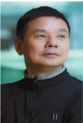
وبدل السماء الزرقاء لجهاز الحاسوب!

وتاهت وجول البحيرة لفت ودارت وعميقاً لك يا حب! إذ بحبتين من التوت الأزرق قد سقطنا في جوف البحيرة فزاد الياقوت الكامن في الأحشاء وعميقاً لبحيرة حب خرساء! في مارس الماء يعلو ويعلو وراحت وتسبح معنا مضى وقت طويل طويل جداً وقد لاحت في الفضاء معلقة لا تحرك محركاً وكأنها إبرة فضية تلتصق خت عيون الشمس المتألفة وعلى صفحة السماء الفيروزية راحت تتحرك حركة غير مرئية كنت على يقين أنها تحضي بسرعة خاطفة هي تحضي وأنا أمضي مثل نوأمان ودوائر من دخان كثيف حامت في الهواء مثل طائر كبير بجناحين يخفق ويحلق وكأنه قطع آلاف الأميال وكان المشهد فوق ظنون البشر ومرمي الخيال وبقاءً تغير المسار من تفرج قاعة على الفأرة لكن.