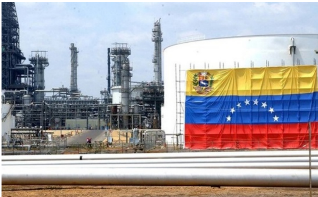
الحظر الأميركي على النفط الفنزويلي

يدخل الحظر الأميركي على النفط الفنزويلي حيز التنفيذ الأحد، في مسعى لدفع الرئيس نيكولاس مادورو نحو الخروج من الحكم عبر استهداف دعامة الاقتصاد الهش. وبدءاً من أمس الأحد، يمنع الحظر على كل شركة أميركية شراء النفط من شركة النفط الوطنية في فنزويلا أو من إحدى الشركات التابعة لها، كما أنه يمنع كل كيان أجنبي من استخدام النظام المصرفي الأميركي للتزوّد بالذهب الفنزويلي الأسود. ويعدّ هذا الإجراء واحداً من التدابير التي أعلنتها الرئيس دونالد ترمب للإطاحة بالحكومة الفنزويلية لصالح المعارض خوان غوايدو الذي أعلن نفسه رئيساً بالوكالة وتعترف به نحو خمسين دولة، بينهم غالبية دول أميركا اللاتينية.