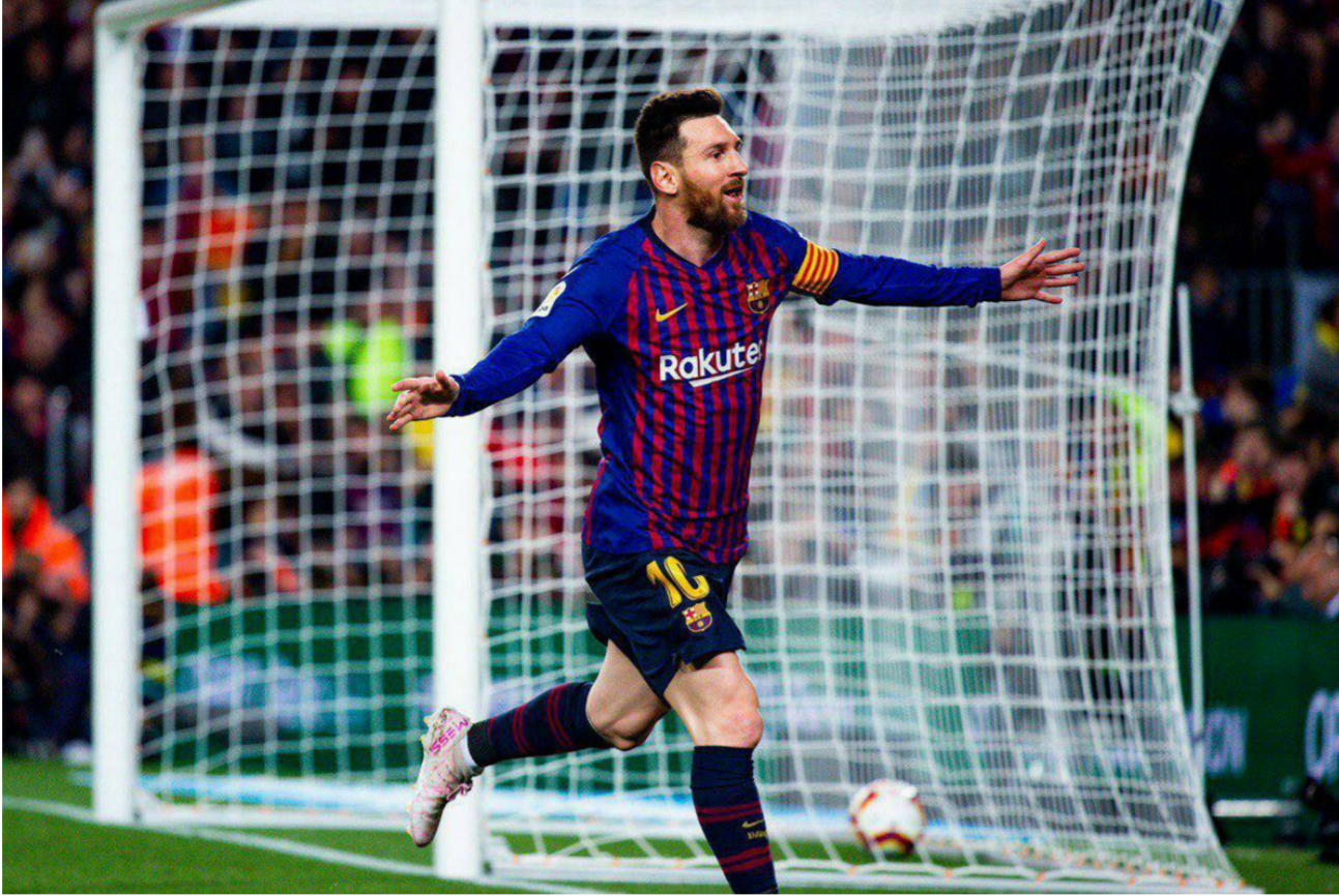
ميسي يتطلق فرحا بهدف الفوز والتتويج بالليجا

ضربة حظ.. وقال سواريز: «إنها إشارة أخرى على مدى صعوبة الفوز بلقب الدوري. لقد خَلينا بالشجاعة وخضنا الكثير من المباريات، وأدبنا بشكل ثابت طوال العام، والتتويج جاء على حساب فريق يعاني من خطر الهبوط وهو ما زاد من صعوبة اللقاء».