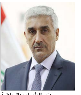
وزير الشباب والرياضة

على قاعة الاجتماعات في الدائرة». وأوضح أنه «سيتم من خلال الاجتماع مناقشة عدة محاور تخص واقع الأندية الرياضية في العراق ومن أهم تلك المحاور تعديل قانون الأندية الرياضية رقم (18) لعام 1986 وتعديله رقم (37) لعام 1988. وعائديه الأراضي الشاغلة لها الأندية الرياضية. والنسج المالية للأندية الرياضية. فضلا عن تعديل ضوابط منح الإجازات الدائمة للأندية».