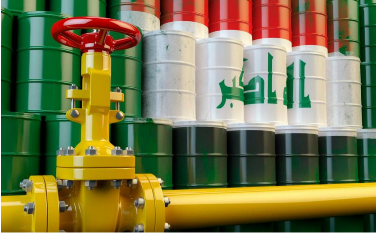
صادرات النفط العراقية 3.377 مليون برميل يوميا في آذار

شركة RBC Capital Markets في كندا، إن «روسيا بانت الآن مثل الطبيب المعالج لـ«أوبك» ويأتي تقرير «وول ستريت جورنال» في وقت تقبل فيه «أوبك» في مايو على اجتماع مهم، سيناقش خلاله المسؤولون مصير اتفاق «أوبك»، الذي أسهم في دعم أسعار النفط عن طريق خفض الدول المشاركة فيه إنتاجها بواقع 1.2 مليون برميل يوميا.