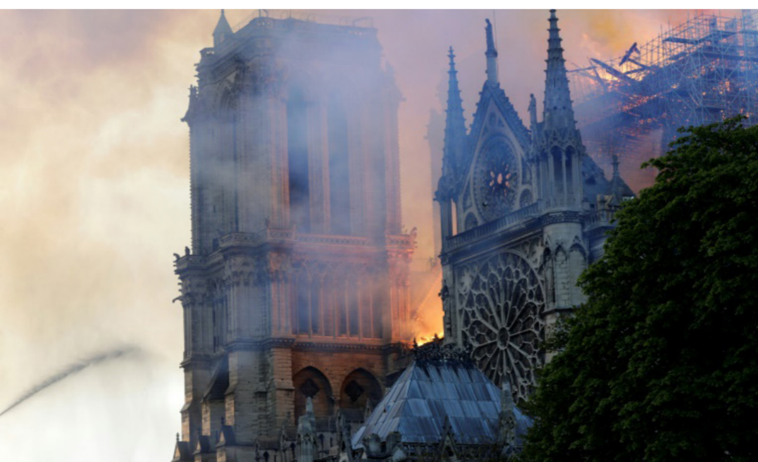
جانب من حريق كاتدرائية نوتردام العالم.

وتعتبر كاتدرائية نوتردام، التي تعني والحريق الضخم الذي لم تعرف أسبابه حتى الساعة اندلع قبيل الساعة السابعة مساءً في الكاتدرائية الباريسية التاريخية وقد أدت النيران إلى انهيار برج الكاتدرائية القوطية التي شيدت بين القرنين الثاني عشر والرابع عشر وبلغ ارتفاعه 93 متراً، وسقطها. وبشارك حوالي 400 إطفائي في