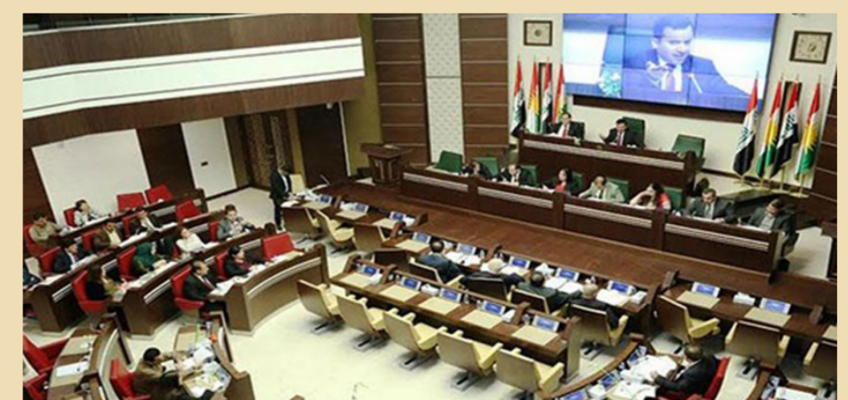
برلمان الاقليم "ارشيف"

في الاقليم واتما يحتوي عدد الشكاوى المقدمة اليها، لان اغلب قضايا الفساد لا تنابع بالشكل المطلوب. ويتضمن تقرير هيئة النزاهة في