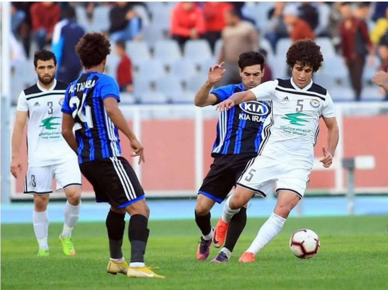
جانب من دوري الكرة الممتاز