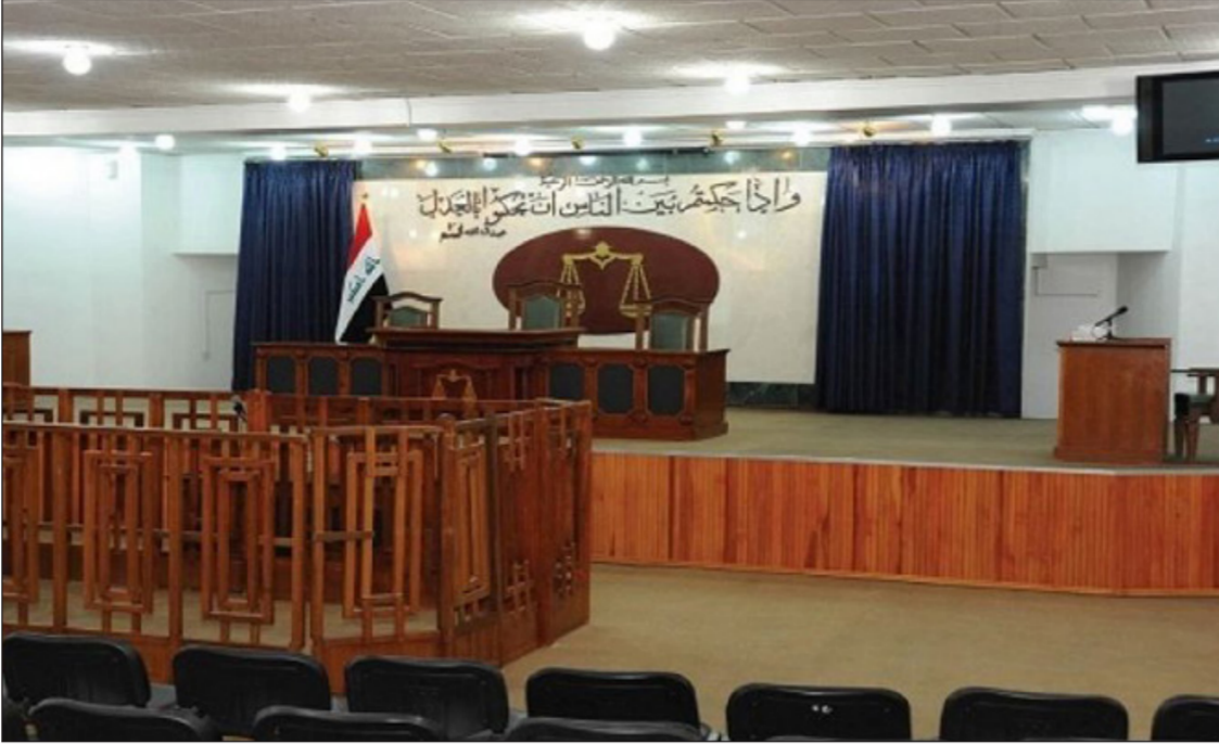
جانب من احدي المحاكم العراقية

أما اذا كان الحكم صادرا ولم تمض عليه ثلاثون يوما فان محكمة التمييز