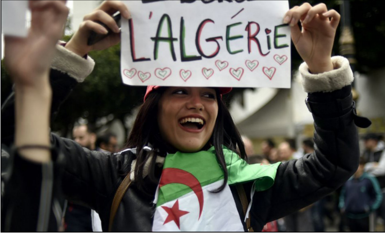
جزائرية تشارك الشعب احتجاجاته

لا يجب تخصيصه للناشطين بل لأناس خطيرين. كالجرمين الذين ينقلون المخدرات أو أشياء أخرى غير مسموحة بها قانونياً. وأضاف: لقد تم استهداف ناشطين من حركتنا قبل بدء التجمع. هدفنا من التجمع بشكل يومي هو التواجد في الأماكن العامة لأن السلطات تريد أن تمنعنا من تنظيم المظاهرات خلال أيام الأسبوع. هم يريدون إهانة ناشطينا وأنا أعتقد أن تصرف الشرطة هدفه إضعاف الحراك الشعبي وكسر ديناميكية الاحتجاجات في الجزائر. ولسم يصدر عن وزارة الداخلية والمديرية العامة للأمن الجزائري أي بيان أو ردة فعل إزاء هذا الحادث.