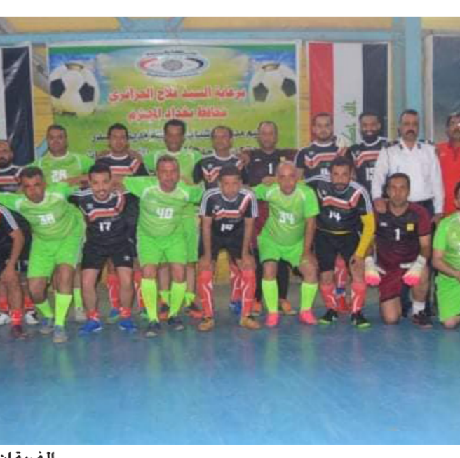
الفريقان المتباريان في الافتتاح