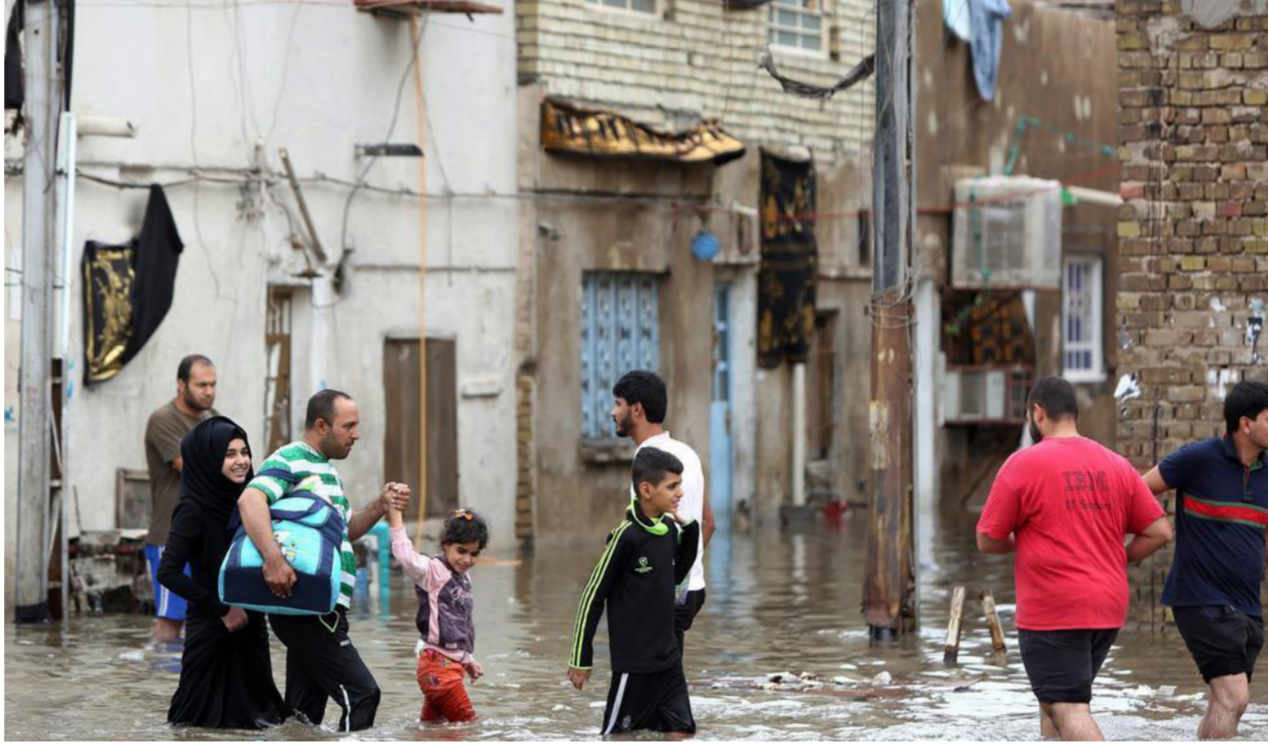
عوائل متضررة جراء السيول

بغداد - الصباح الجديد: أشرت آخر إحصائية للسيول والفيضانات التي اجتاحت البلاد خلال الأيام الماضية، ارتفاع أعداد العوائل المتضررة إلى 4751 عائلة، فيما أوردت اللجنة العليا للدفاع المدني أن الأزمة انتهت تقريباً. مشيرة إلى أن رئيس الوزراء عادل عبد المهدي اتخذ قراراً بتعويض المتضررين من جرائها في جميع المحافظات. وأعلنت جمعية الهلال الأحمر العراقي أمس الثلاثاء ارتفاع أعداد العوائل المتضررة جراء الفيضانات التي اجتاحت عدد من المحافظات الوسطى والجنوبية إلى 4751 عائلة. وقالت الجمعية في بيان تلقت "الصباح الجديد" نسخة منه، إن "الفيضانات الأخيرة التي شهدتها العديد من مناطق وقرى محافظات (بغداد، صلاح الدين، ديالى، واسط، ميسان، ذي قار، البصرة) أحدثت وضعاً انسانيًا حرجاً في ظل انهيار عشرات المنازل"، مشيرة إلى "تضرر (4751) عائلة جراء تلك الأحداث".