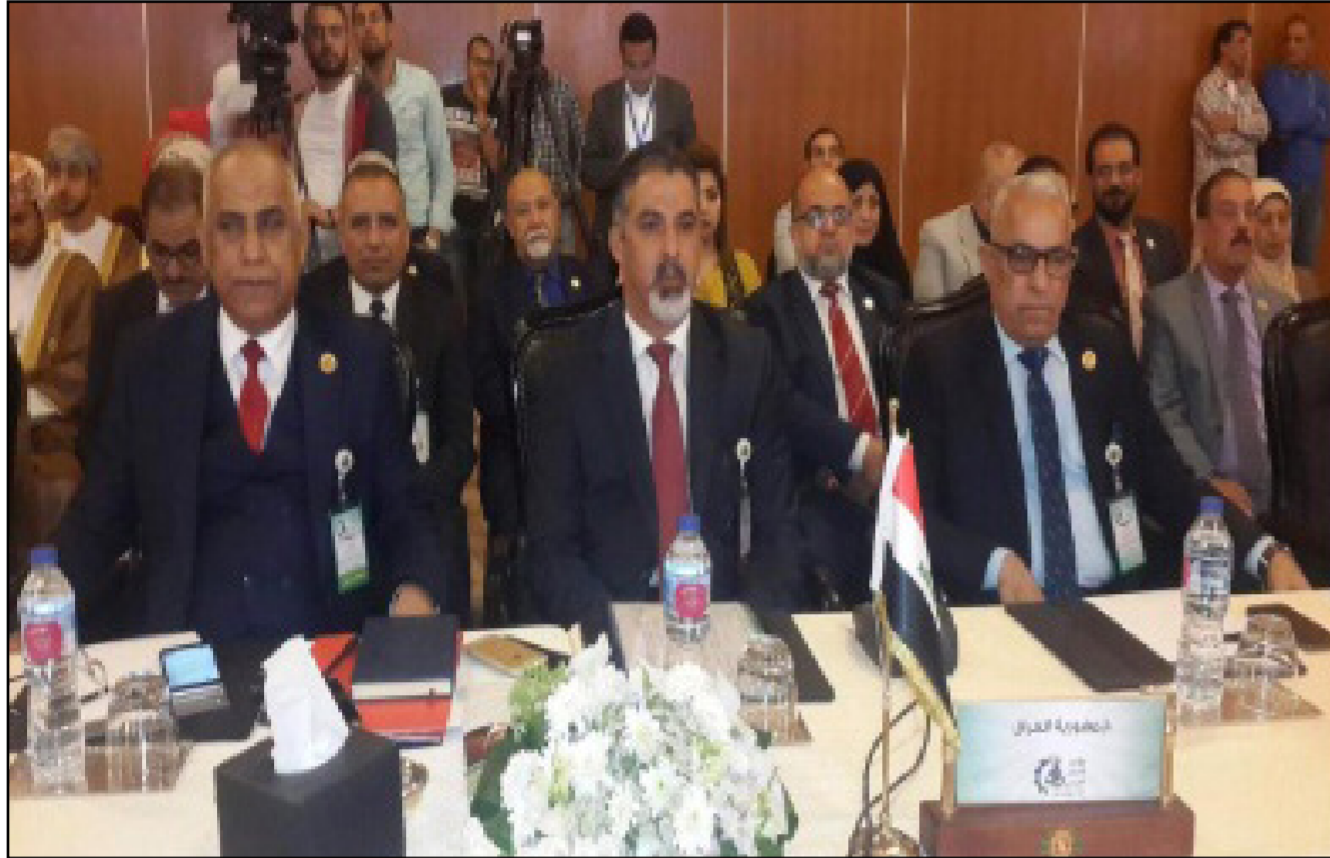
إثناء انعقاد المؤتمر