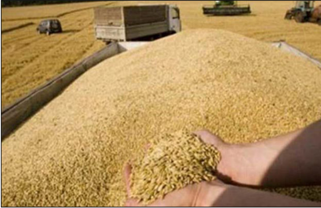
موسم يبشر بخير ووفير

المطالب سيتم دراستها بشكل قانوني من خلال احوالها التي دائرة القانونية في الوزارة اما ما يخص الجوانب الفنية بالإمكان السيطرة عليها وذلك بوضع الحلول الناجعة كونها ترتبط بعمل شركة تصنيع الحبوب . الافتاء إلى أهمية وضع حلول عاجلة لهذه المشكلات من خلال تصحيح العلاقة العقدية بين شركة تصنيع الحبوب وأصحاب تلك المطاحن بما يضمن إنتاج الطحين وفقاً للمواصفات القياسية العراقية المعتمدة . مؤكداً على أهمية