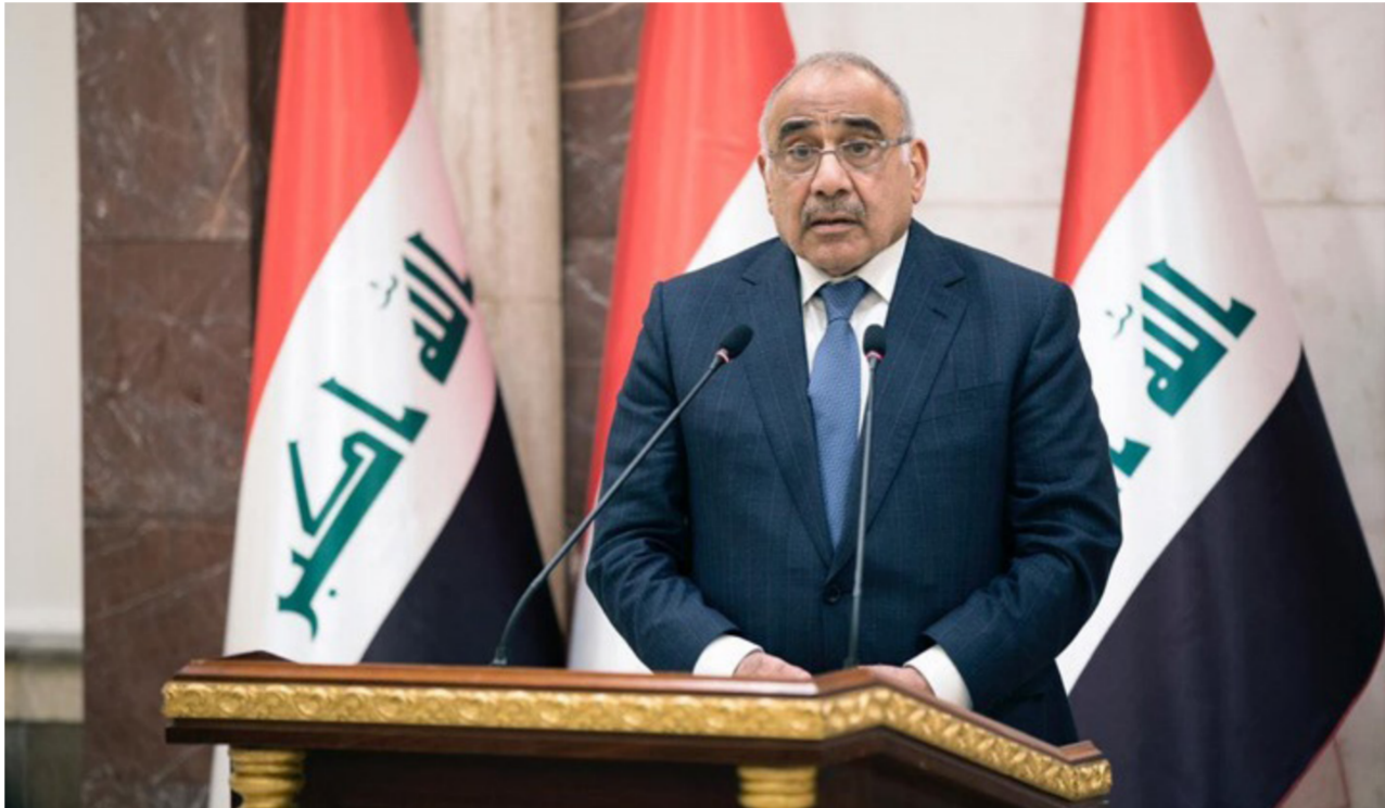
عادل عبد المهدي

لها". وحدث الحلبوسي، عن "مناقشات امس الاثنين، عن حراك يقوده رئيس مجلس النواب محمد الحلبوسي لاجاز ملف الكابينة الحكومية، مشيراً إلى أن رئيس مجلس الوزراء عادل عبد المهدي حذر الكتل السياسية من مخاطر الوضع السياسي الحالي، لافتاً إلى أن الحلفاء ما زالت مستمرة على الحفان الشاعرة لغاية الآن. وقال النائب عن التحالف فالح العيساوي في تصريح إلى "الصباح الجديد"، إن "استكمال الكابينة الوزارية شكل أزمة داخل الكتل السياسية سواء في خالف الاصلاح أم البناء". وأضاف العيساوي، أن "رئيس مجلس الوزراء عادل عبد المهدي طلب من خالف البناء عندما اجتمع بهم مؤخراً بضرورة السعي لسد الوزارات الشاعرة". وأشار إلى أن "عبد المهدي شكاً خلافاً للوزارات التي تدار بالوكالة، وطلب التعجيل في الاتفاق على مرشحيين اصلا