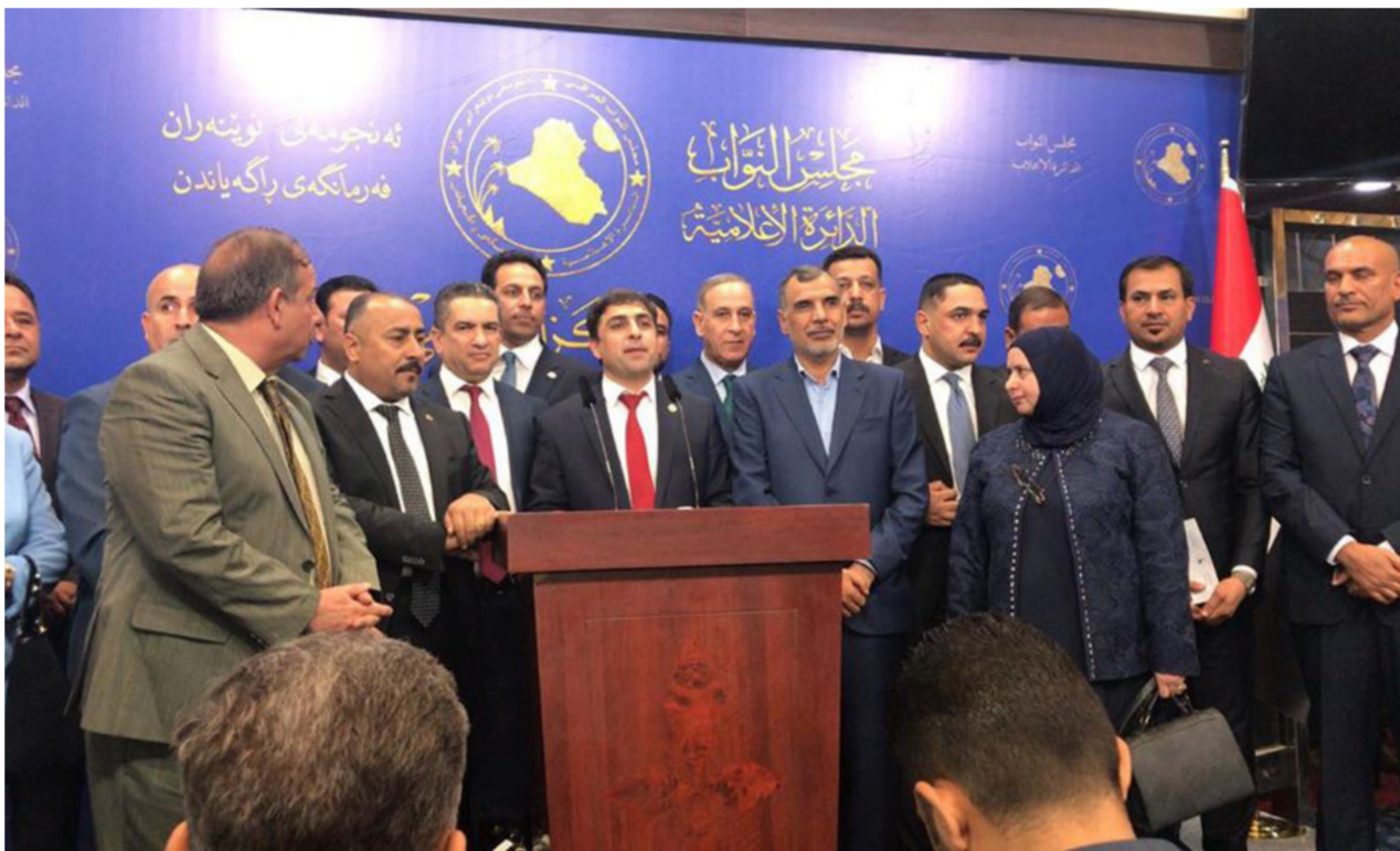
مؤتمر صحفي لكتلة سائرون النيابية "أرشيف"