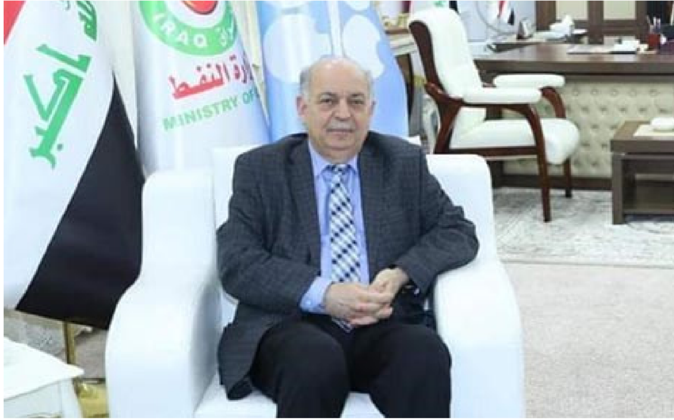
وزير النفط ثامر الغضبان

تنبهها بالاعتماد على المنتجات النفطية». لافتاً إلى «توجيهه شركات الوزارة للتعامل مع هذا الملف الذي يصد استلام عروضه». وأشار إلى أن «الوزارة تدرس حالياً إمكانية الاستفادة من استشاري عالمي بهذا الموضوع لتفعيل الاستفادة من الصناعات التي تعتمد على المنتجات النفطية ومثال ذلك الاستفادة من الدهون والزيوت». وأكد أن «الموضوع الذي لا ينحصر بالضرورة بالقطاع العام إذ سيطرح كمشروع مشترك بين القطاعين العام والخاص».