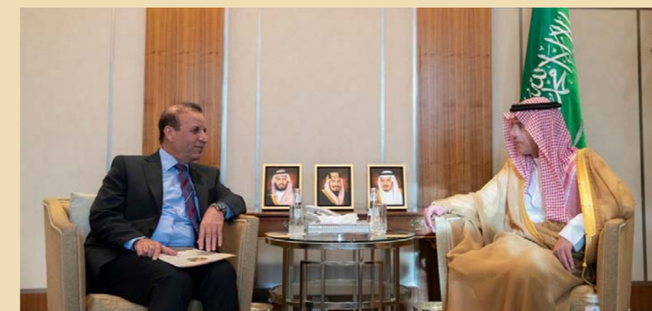
وزير الخارجية السعودية مع السفير العراقي "أرشيف"

ما ستترجم لعمل واقعي على الأرض، وسنرى ثمارها في تطور وتعزيز كافة المجالات بين البلدين الشقيقين". وقال: "نحن متنون جدا لكرم