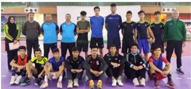
طالبة الدكتوراه مع مواهب كرة اليد

وتقول الطالبة: وجدت الأجواء المناسبة جدا لإجراء الاختبارات القبلية والبعدية ثم بدأت برنامجا خاصا عن مواهب كرة اليد والمستهدفين لأعبي 15و سنة، ويستمر البرنامج لمدة 4 أشهر شهر شباط الماضي لشهرين