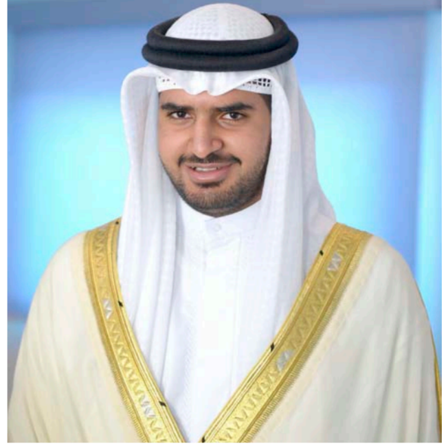
الشيخ عيسى بن علي

وأوضح ان الشيخ عيسى بن علي آل خليفة، يؤسس لعلاقات متميزة جدا مع الدول الشقيقة والصديقة، بينها العراق، حيث قام بتضيف المنتخب الوطني في بطولة رباعية اقيمت في البحرين العام الماضي، حيث شكلت المشاركة العراقية محطة مهمة قبل الدخول في معترك تصفيات آسيا المؤهلة إلى الوندبال. وقال: طموحي النجاح في تأدية