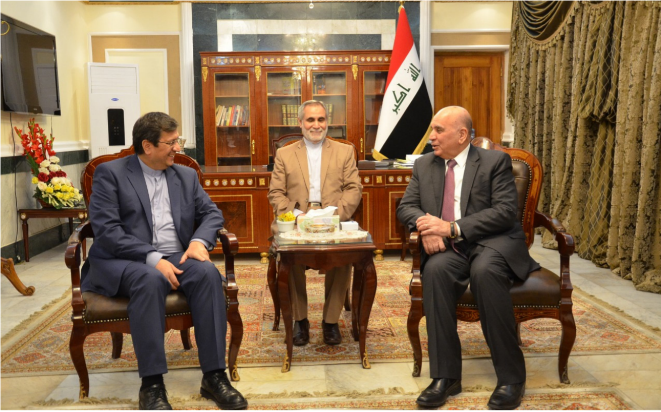
وزير المالية العراقي ومحافظ البنك المركزي الإيراني

السبلع الإيرانية وغرفة التجارة في البصرة. اتفاقاً لتدشين بورصة مشتركة للسبلع بين الجانبين. وتنضمين محاور الاتفاق: إنشاء فرع لبورصة السبلع الإيرانية في بغداد. ومن ثم في إقليم كردستان والنجف. وذلك لتسهيل إيجاد مؤسسات وساطة مالية ذات صلة بأنشطة بورصة السبلع في العراق. ومشاركة البورصة الإيرانية بلا وسيط في المناقصات الحكومية في العراق.