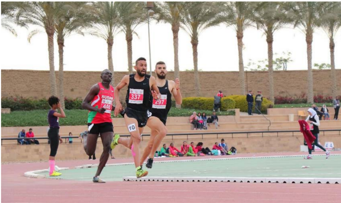
لقطة من السباقات

وطموحي أن أكرر الجأزي وأحقق رقما عراقيا جديدا. وأحتل المنتخب العراقي المركز الرابع فريقيا بمعدل أربعة أوسمة ذهبيتان فضية وبرونزية ليحتل المركز الرابع فريقيا بعد البحرين التي تصدرت الترتيب برصيد 13 وساما ثمانية ذهبيتا وثلاث فضيات وبرونزيتين. تبعتها مصر ثانيا وحصد 16 وساما خمسة منها ذهب وسبعة فضة وأربعة برونز والمغرب ثالثا و 15 وساما منها ثلاثة ذهب وستة فضة ومثلها برونز ثم العراق رابعا وحل الجزائر خامسا وتونس سادسا وجيبوتي سابعا والسعودية ثامنا والسودان ثم الكويت وبعدها الامارات ويقية الدول لم تسجل أي وسام.