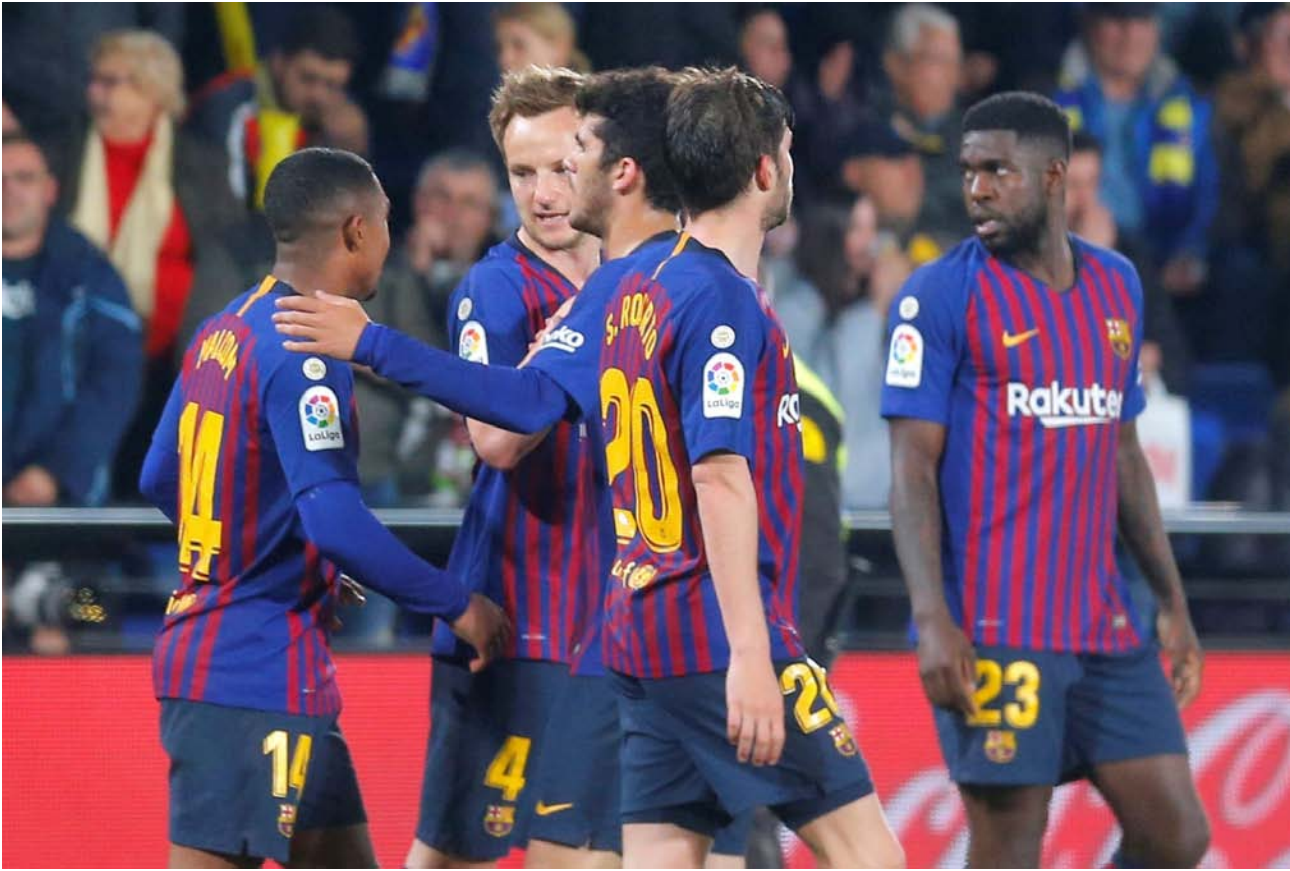
فرحة لاعبي برشلونة بعد تسجيلهم للهدف الرابع في مرمى فياريال

وقال رويج في تصريحات بعد نهاية المباراة، إن ناديه يمتلك أفضل لاعبين ناشئين في إسبانيا، لكن فرقاً كبرى مثل برشلونة، وأتلتيكو مدريد، وأتلتيك بلباو، «يسرقونهم»، على حد تعبيره. وعقب انتهاء المباراة التي كان فياريال فائزاً فيها (2-4) حتى الدقيقة 89، قبل أن يتمكن الضيوف من إدراك التعادل الدقيق الأخير، ندد رئيس «الفواصات الصفراء» بسلوك الأندية المذكورة تجاه لاعبيه من فريق الناشئين فياريال، كما أشاد رويج بأداء فريقه الذي أكد أنه قدم «مباراة عظيمة». وأثبت أنه فريق جيد، معتبراً أنه في حين حصد البلاجرانا نقطة التعادل، خسر فياريال نقطتين.. وقال «يجب الاستمرار... تتقوى ثماني مباريات في الليجا، وإذا لعبنا بنفس هذا المستوى... يمكننا أن نقادد اللاعب دائماً برؤوس مرفوعة».