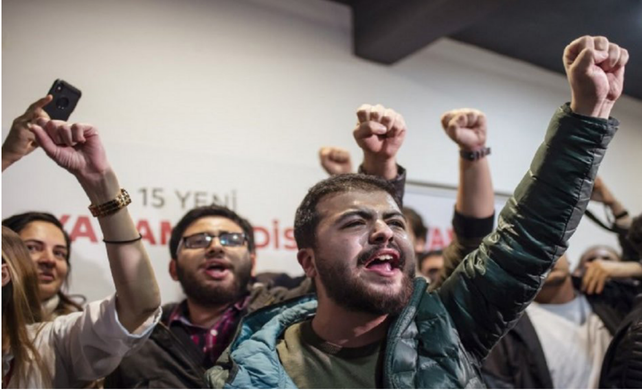
جانب من تفاعل الأتراك مع الانتخابات

تركيا. لكن (وزارة الدفاع) تتخذ تدابير احترازية لحماية الاستثمارات المشتركة في التكنولوجيا الحساسة». وأكد البناتاغون أنه بدأ بالبحث عن مصارير ثانية لإنتاج قطع «أس-35» تصنع في تركيا الآن. وأعرب مسؤولون أميركيون عن قلقهم من أن تعامل أنقرة عسكريا مع الحلف الأطلسي وموسكو. قد يمكن الأخيرة من الحصول على معلومات متعلقة بمنظومة «أس-35». قد تدفعها إلى تطوير رفة منظومة «أس-400» ضد الطائرات الغربية.