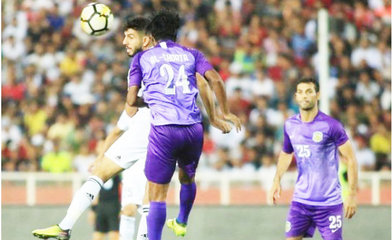
لقاء سابق للزوراء امام الشرطة

وشدد الحضور على وجوب ان تكون ادارتي نادبي الشرطة والزوراء مسؤولة عن جمهورهما الذي