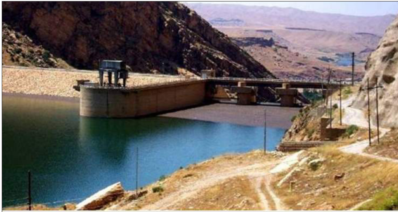
سد درينديخان «ارشيف»

لإنشاء سدود جديدة وترميم السدود السابقة، لافتا الى ان ارتفاع مناسيب المياه وهطول الأمطار خلال الموسم الخالي كان بالامكان خزنها وتوفير نسب كبيرة من المياه لتوليد الطاقة الكهربائية والزراعية والسري في الاقليم. وأشار الى انه كان بإمكان إنشاء عدد آخر من السدود في الاقليم والعراق على حد سواء، ان يضمن للاقليم موارد مالية هائلة نظرا لامكانية توظيف الخبرين من المياه لآغراض السياحة والزراعة وتوليد الطاقة الكهربائية وتربية الاسماك، بخلافه فان قضية توفير المياه ستكون مشكلة كبيرة في العراق واقليم كردستان، اذا ما لم يتم التعاطي مهسا وفقا لخطط وبرامج مدروسة مستقبلية.