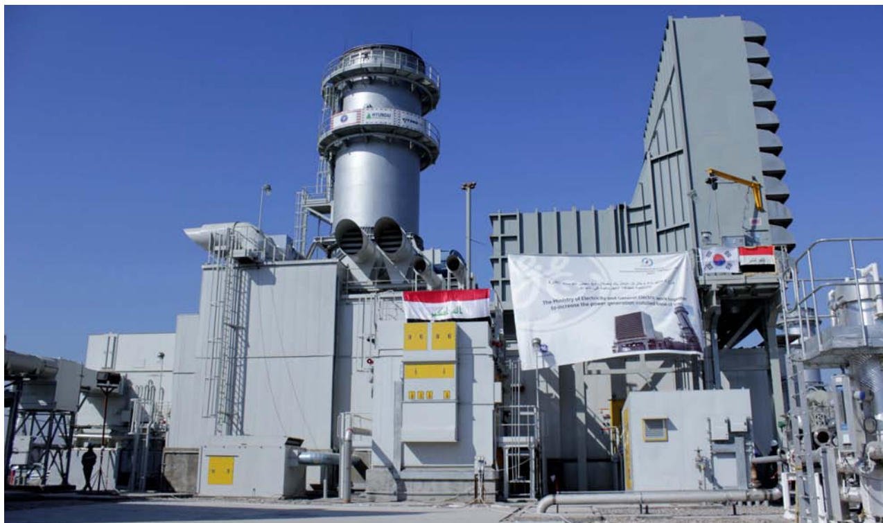
محطة لتوليد الطاقة في العراق