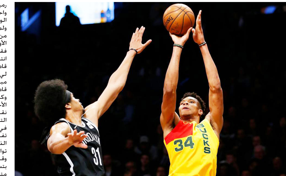
جانج من المباراة

وكان أنتيتوكومبو إلى بعض الوقت للدخول في أجواء المباراة، ولم يسجل سوى بعد مرور أكثر من خمس دقائق على بداية الربع الأول، وقال بهذا الشأن «أحاول فقط استعادة الإيقاع. كنت أحاول انتظار أن تأتي المباراة إلي. زملائي قاموا بعمل جيد لتمير الكرات لي»، وتابع «أريد أن أشارك في كل مباراة، الراحة ليست مفردة في قاموسي».