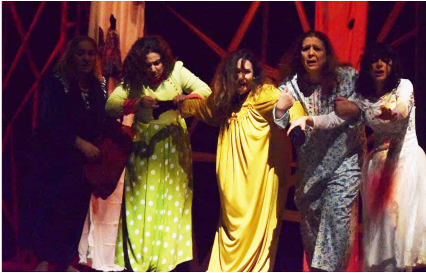
مسرحية سبانيا بغداد

نحن في فرقة بنابيع المسرحية العراقية في السويد. برغم اننا نعيش في ظروف المنفى الا اننا نطمح ان نساهم مع زملائنا في الداخل من اجل تقديم ما يليق بمسرحنا العراقي والذي كان دوره تنويريا في حقبة من تاريخية. ويهده المناسبة نقدم أولى التحيات الى زملائنا المسرحيين في كل مكان بمناسبة يوم المسرح العالمي.