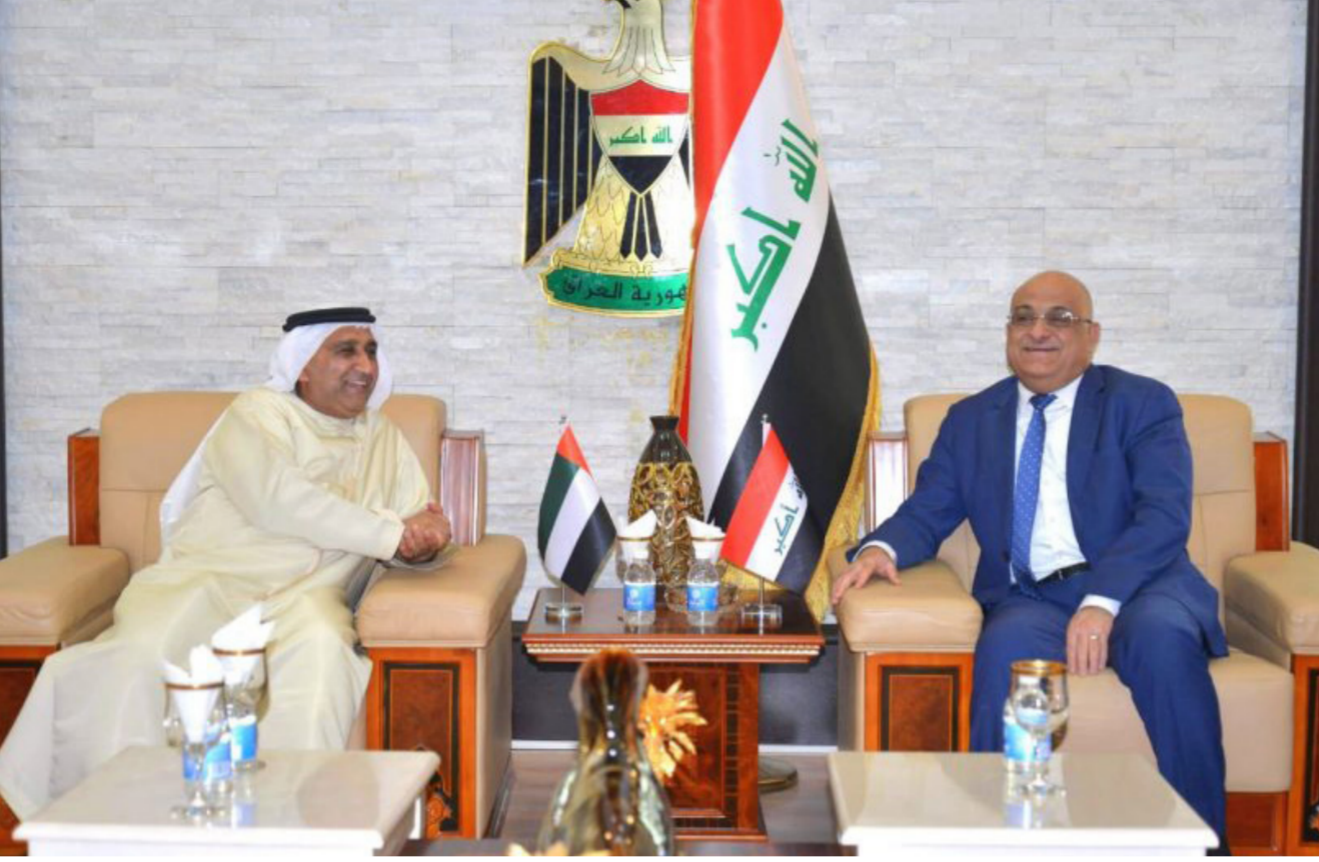
وزير التجارة يضيف سفير الامارات

بما يحقق مصلحة البلدين الصديقين وتعزيز اواصر التعاون الاقتصادي والتجاري لما يمثله العراق من سوق واعد للمنتجات والسلع الاندونوسية . ونقل العلووي تعازي الحكومة الاندونوسية للحكومة العراقية بحادثة العبارة في مدينة الموصل كما نقل خبات رئيس جمهورية اندونيسيا للعراق حكومة وشعباً متمنياً للعراق حكومة جديدة بالنجاح لاعادة العراق الى سابق عهده وبناء علاقات وطيدة مع بلدان العالم .