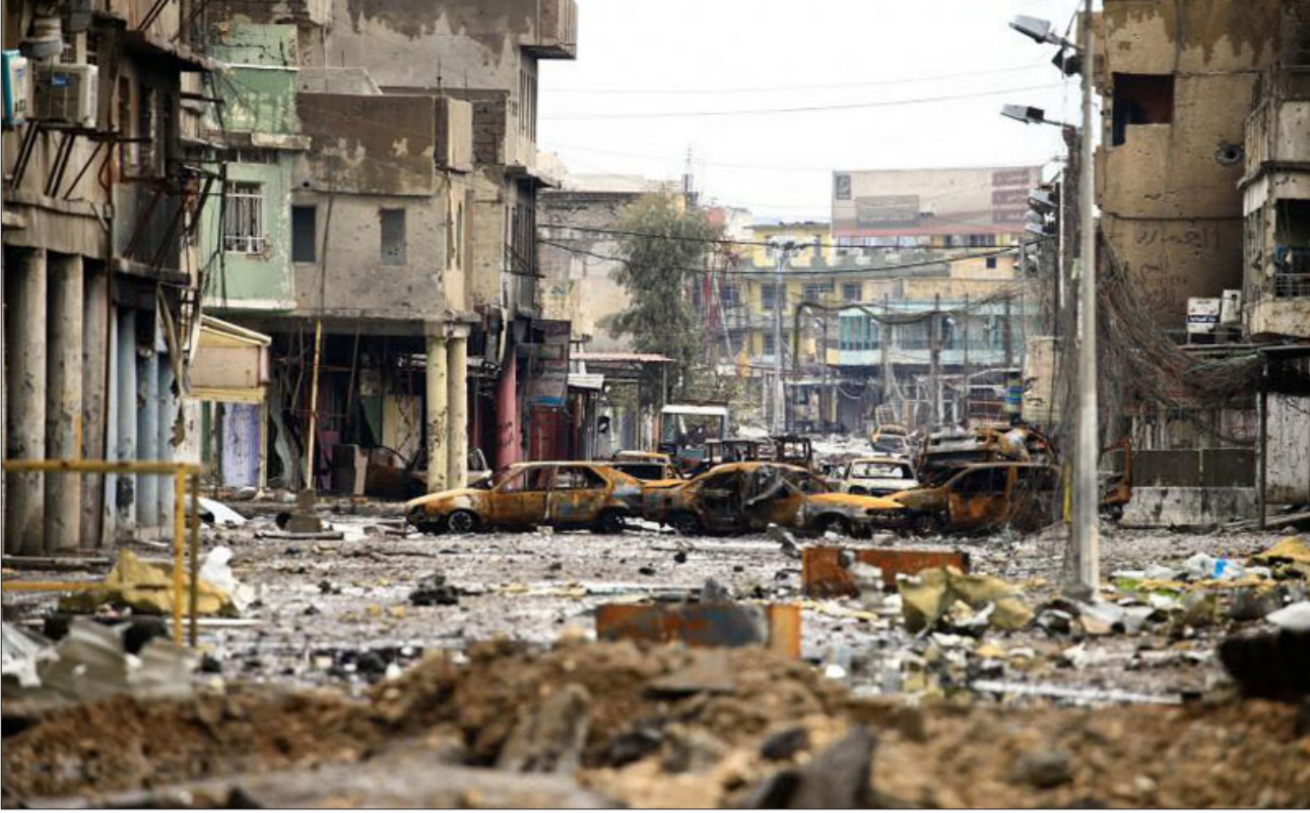
آثار الدمار الذي خلفه داعش الاهابي

حيث تتوفر فرصاً تجارية متنامية في البلد. وقد كشفت احصاءات التجارة الحالية عن تكثيف التعاون الاقتصادي بين كل من برلين وبغداد إذ وصل حجم الاستثمارات الألمانية في العراق عام 2018 إلى 1.7 مليار يورو. كما بلغ حجم التجارة الثنائية في العام 2017 أكثر من 1,6 مليار يورو. وتمتلك السوق العراقية إمكانات كبيرة للاقتصاد الألماني إذ وضعت الحكومة مشاريع طموحة وقابلة للحياة بحلول عام 2022.