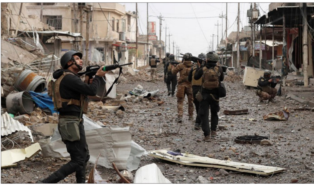
خبر الموصل "أرشيف"