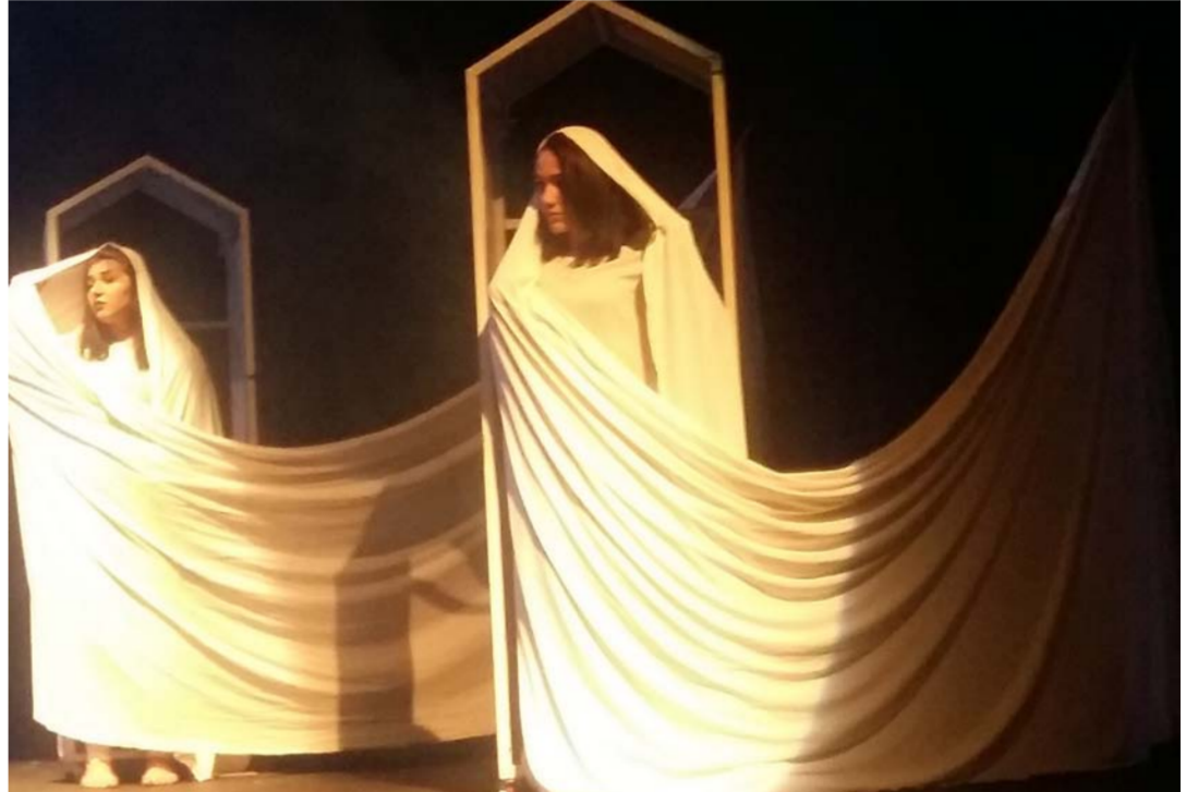
مسرحية نساء في الجحيم

للاسف تراجع المسرح العراقي منذ فترة طويلة لم نعد نشهد اعمالا كبيرة لمخرجين كبار كما كان وقاسم محمد وجعفر السعدي وبردري حسون فريد، ليس لنا فرقة مسرحية خاصة تنافس فرقة الدولة والتفوق عليها في عروضها المسرحية كفرق الفني الحديث والتشعبي واليوم، فقط أود أن أعتب واتشير الي انني ولمرتين ففشت في تقديم مسرحية الارامل للفرقة الوطنية للتمثيل، المرة الاولى اعتب الغاربية فيها على وزارة الثقافة عام 2013 واسجل عتي على ارامي