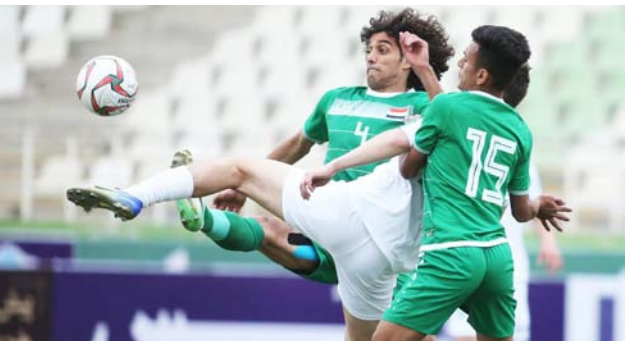
من لقاء الأولمبي وتركمانستان