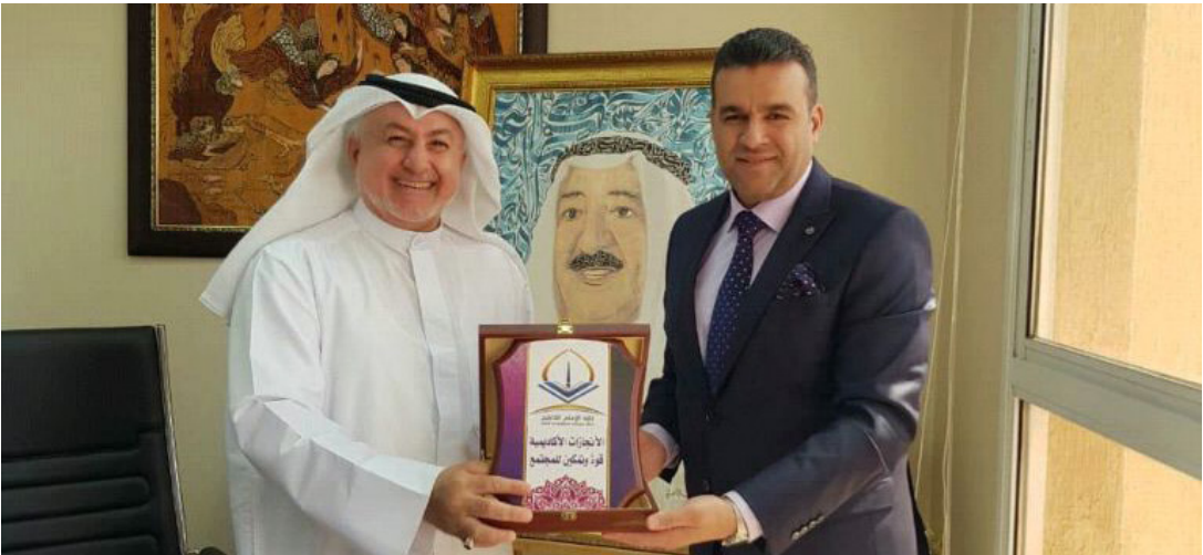
الخاباني في ضيافة المصف

من جهته اعرب الدكتور المصف عن سعادته بالزيارة وصفها بالمهمة في ظل التقدم الكبير الذي تشهده العلاقات الثنائية بين الدولتين. وعقد فهد الزيارة بالبادرة الطبية التي تعبر عن إصالة العراق عموما