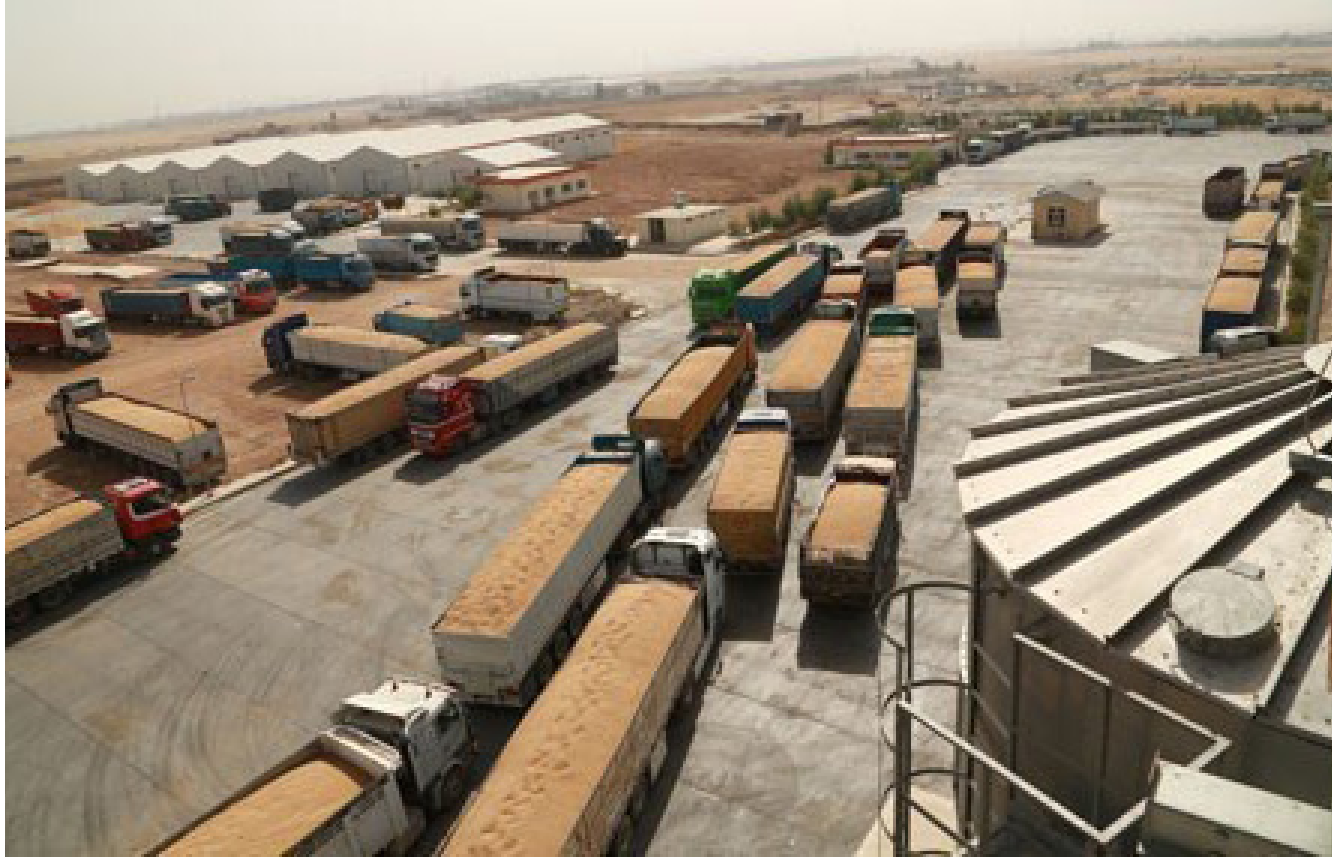
اثناء تسليم الحنطة

المبلغ بطريقة التفسير . لافنا الى فتح منافذ جديدة للتسويق اضافة الى التعاقد مع مؤسسات الدولة والقطاع الخاص والحصول على نتائج جيدة في هذا المجال من خلال الانفتاح على الموانئ ذات العلاقة . وان الطاقة الانتاجية للفنر تصل الى (20) الف صومنة بالساعة الواحدة او اكثر وبالمكان تشغيل الاقران بوجبات عمل متواصلة لتحقيق الطاقات التي تلبى حاجة الجهات المسوقة .