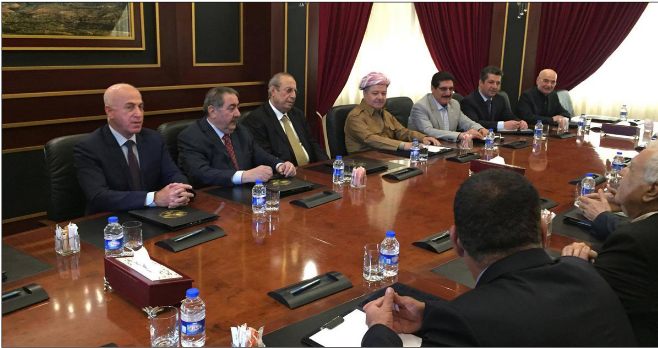
جانب من الاجتماعات بين الحزبين "ارشيف"

الى اعادة تفعيل منصب رئيس الاقليم دون موافقة الاتحاد. سيقضي على اي امل بالتوصل الى اتفاق بين الجانبين.