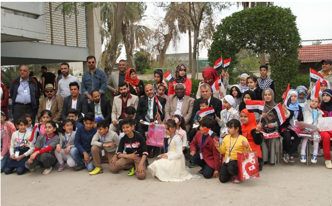
مشروع بسملة طفل

وأظهر الأطفال المشاركون في المشروع قابليتهم الابداعية برسم لوحة كبيرة مشتركة تمثل البراءة والنقاء بأشراف النشاط المدرسي في مديرية تربية البصرة الذين سجلوا شكرهم وتقديرهم للجامعة ولمركزها الثقافي، ولكل من عمل على انجاح هذا المشروع المميز.