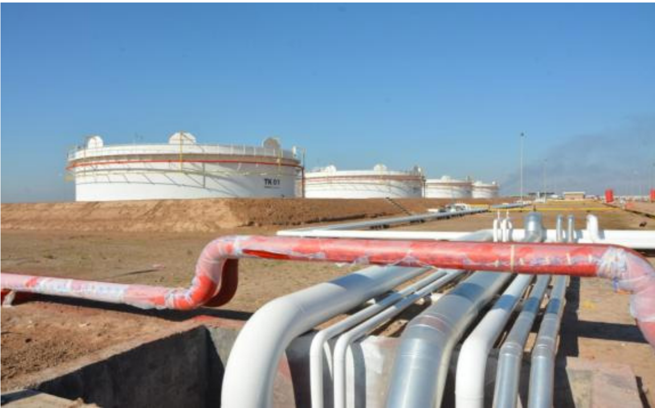
أحد المنشآت النفطية