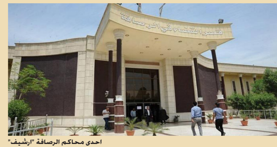
احدى محاكم الرصافة