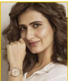
فاطمة سانا شيخ

ومن جديد ظهر بيندكبت سيسخ في المياه الجمد بأحد أنهار لندن، مرتدياً الألف الأحمر التي ترمز لحملة Comic Relief التي تساعد الأطفال المرضى، ويسمح بيندكبت لعدسات المصورين للإبطال الحارقين.