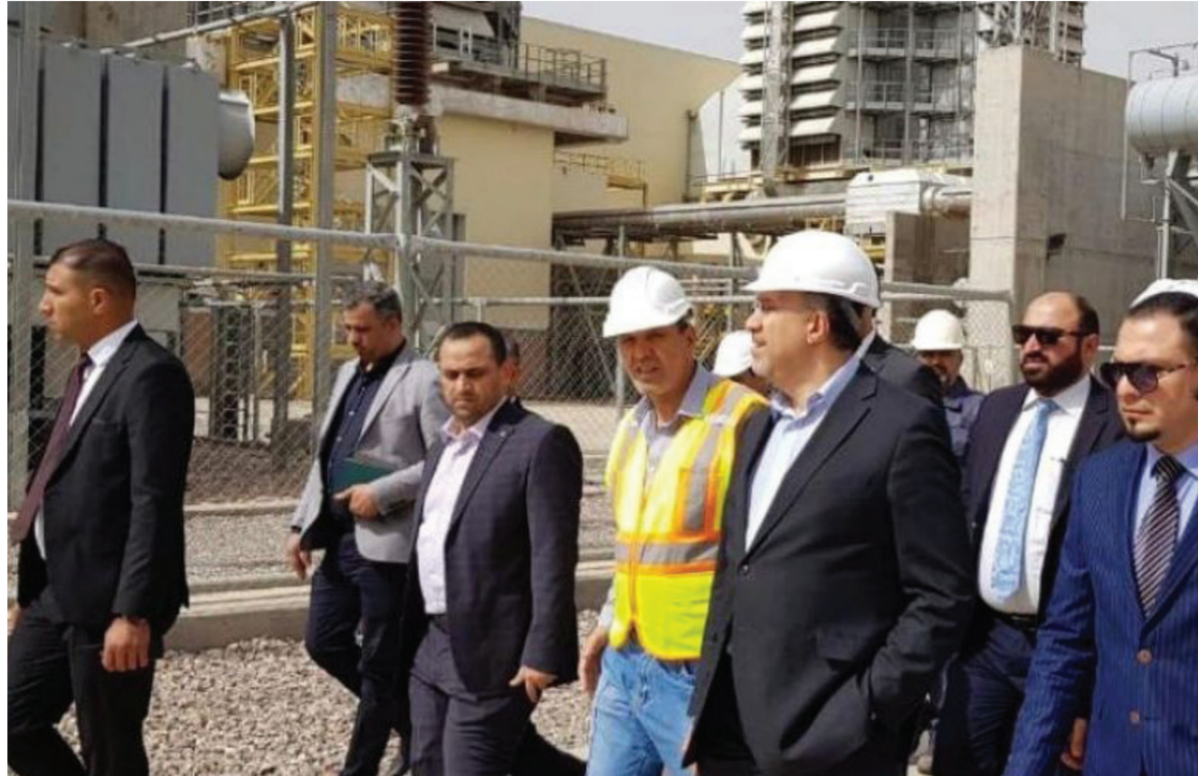
جولات تفقدية لمحطات تجهيز كهرباء

أكد وزير الكهرباء على اكمال جدول الصيانات في الوقت المحدد، حاثاً العاملين في محطة التاجي الغازية على بذل قصارى جهودهم للارتقاء بخدمة المواطنين لهذا العام