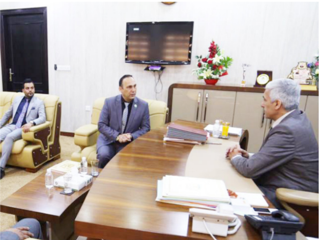
لقاء الوزير واتحاد الدرجات النارية

الدولية المفتوحة في العراق وفي العاصمة بغداد، والتي سيشترك فيها اكثر من 18 منتخباً وبنوايق 100 دراج من مختلف دول العالم ولعابتي (الموتوكروس والدراك ريسيت) والتي تعد تطوراً ملفتاً لرياضة الحركات في العراق. لا سيما هي أولى من نوعها تقام في بلدنا الحبيب العراق مع هذه المشاركة الواسعة التي سيتواحد فيها.