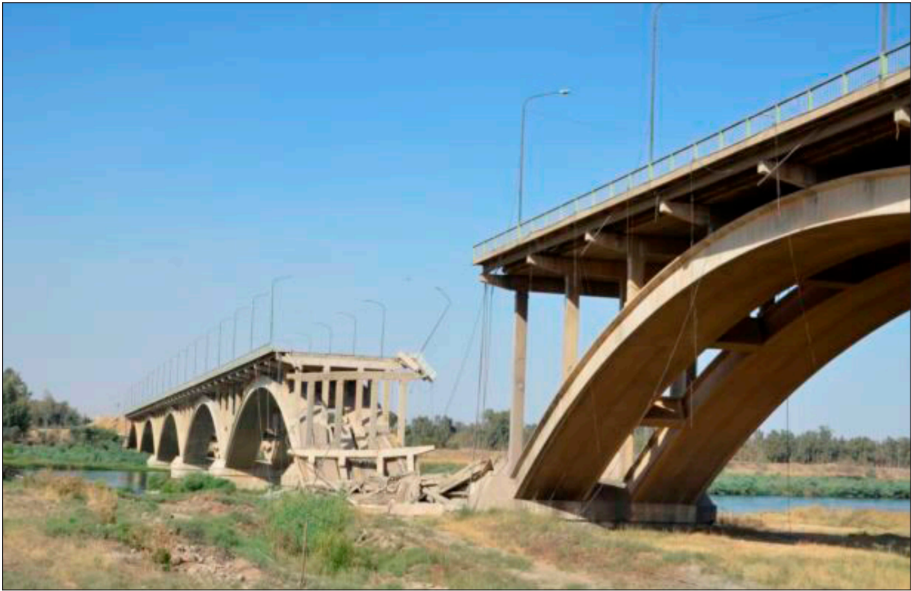
احد جسور نينوى "ارشيف"

بسبب الحفر والطمسات التي لا تحصى فيها، ومضى بالقول «بدو انه ليس هنالك رقابة حقيقية عند تنفيذ هذه المشاريع التي تمس مصالح المواطن قبل ان تعكس جانباً من الوجه الحضاري لأكبر ثاني مدينة عراقية، وعليه نطالب بحاسبة اي مقاول يثبت فشله ومحاسبة المهندس والمسؤول الذي ساند ذلك المقاول الفاشل. لأن من يستند على مقاول فاشل يعني انه اخذ المقسوم منه، والمواطن المسكين يدفع الضريبة، وهذه جريمة اخرى.» على وفق قوله.