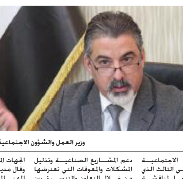
وزير العمل والشؤون الاجتماعية الدكتور باسم عبد الزمان