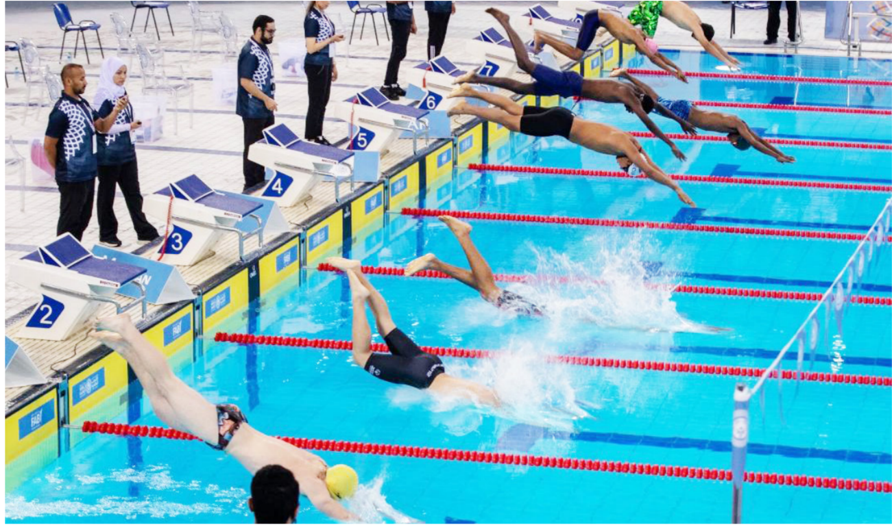
جانب من منافسات السباحة في البطولة

ومنها بطولة التحدي التي اجريت على ساحة الاحتفالات الكبرى في العاصمة بغداد وكانت ناجحة على الاضعدة والمستويات كافة. وشهد العبيدي على دعمه المستمر والمتواصل لرياضة الدراجات النارية، حتى تصل الى المتغيرات الرجوة في خلق قاعدة رياضية رصينة لها في بلاد النهرين، تكون قادرة على المنافسة في البطولات الخارجية ورفع اسم العراق عالياً في المحافل العالمية. وأكد العبيدي على دعمه لا محدود للأخاد العراقي للعبة في تنظيم بطولة السلام