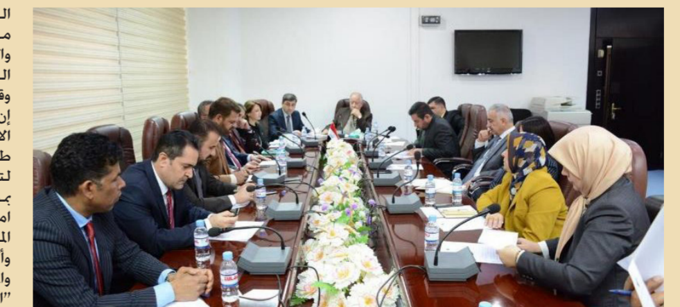
لجنة العلاقات النيابية "ارشيف"

وعلى صعيد ذي صلة، طالب النائب ندى شاكر جودت من ائتلاف النصر برئاسة رئيس الوزراء السابق حيدر العبادي، بالتصدي لرؤوس الفساد