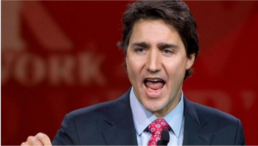
رئيس وزراء كندا جاستن ترودو

الصباح الجديد - متابعة: أظهرت استطلاعات الرأي تراجع شعبية رئيس الوزراء الكندي جاستن ترودو. بعد الأزمة المتعلقة بشركة المقاولات الكندية إس إن سبي لافالين. والتي استقال على إثرها ثلاثة من أبرز معاونيه. وبحسب هيئة الإذاعة الكندية. أظهرت استطلاعات الرأي التي أجريت بعد الأزمة تساوي الأصوات بين الحزبين الليبرالي المحافظ في الانتخابات المقررة في أكتوبر/تشرين الأول الماضي. بل ترجح المزيد من التراجع في فرض الحزب الليبرالي.