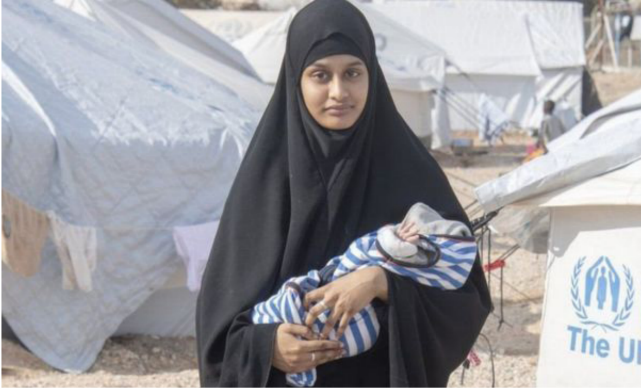
رضيع شميمية بيغوم يرحح بريطانيا

الداخلية في حكومة الظل المعارضة في بريطانيا. إجراءات الداخلية عبر تفريسة على حسابها على تويتر. قائلة: «أنا ضد القانون الدولي عندما يسمح بترك شخص بدون جنسية. والأنا مات طفل بريء نتيجة لتجريد امرأة بريطانية من جنسيتها. إنه أمر قاس وغير إنساني». وقالت كريستي ماكنيل. رئيسة قسم السياسات والدعم والحملات بمنظمة «سيف تحليدين» (انقذوا الأطفال) الخيرية: «جميع أطفال تنظيم الدولة ضحايا الصراع ولا بد أن يعاملوا كذلك». وأضافت: «كان من الممكن تفادي وفاة هذا الطفل وغيره من الأطفال. ولابد أن تتحمل بريطانيا وغيرها من الدول التي ينتمي إليها آباء وأمهات هؤلاء الأطفال مسؤولية انتهاكها مواطنيها الموجودين في شمال شرق سوريا»