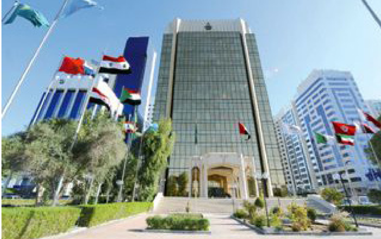
صندوق النقد العربي

عن 33 مليار دولار على مدى المتوسط. لتلبية احتياجات القدرة الإنتاجية الإضافية التي تصل قيمتها إلى 16 غيغاواط. وتبذل الدولة جهوداً جارية في تنويع مصادر الطاقة، حيث تقدر ابيكوب بأن نحو 10 غيغاواط من القدرة الإنتاجية للطاقة قيد التنفيذ، بما في ذلك 5.6 غيغاواط من الطاقة الشمسية أولويات دولة الإمارات، ومن المتوقع أن تمثل 25 في المئة من مصادر توليد الطاقة في الدولة، وذلك مع اكتمال تشغيل مجمع الطاقة الشمسية الذي تصل قدرته الإنتاجية إلى 5 غيغاواط وتبلغ قيمته 13.7 مليار دولار.