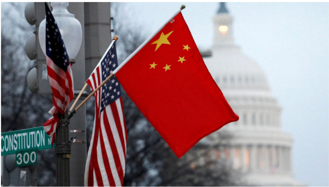
المحادثات الاميركية الصينية.. الامل بالمستقبل

وقال نائب وزير التجارة الصيني، وانغ شيويين في مؤتمر صحافي على هامش المؤتمر الشعبي الوطني الصيني «عندما تسأل عن أفق المشاورات الاقتصادية والتجارية