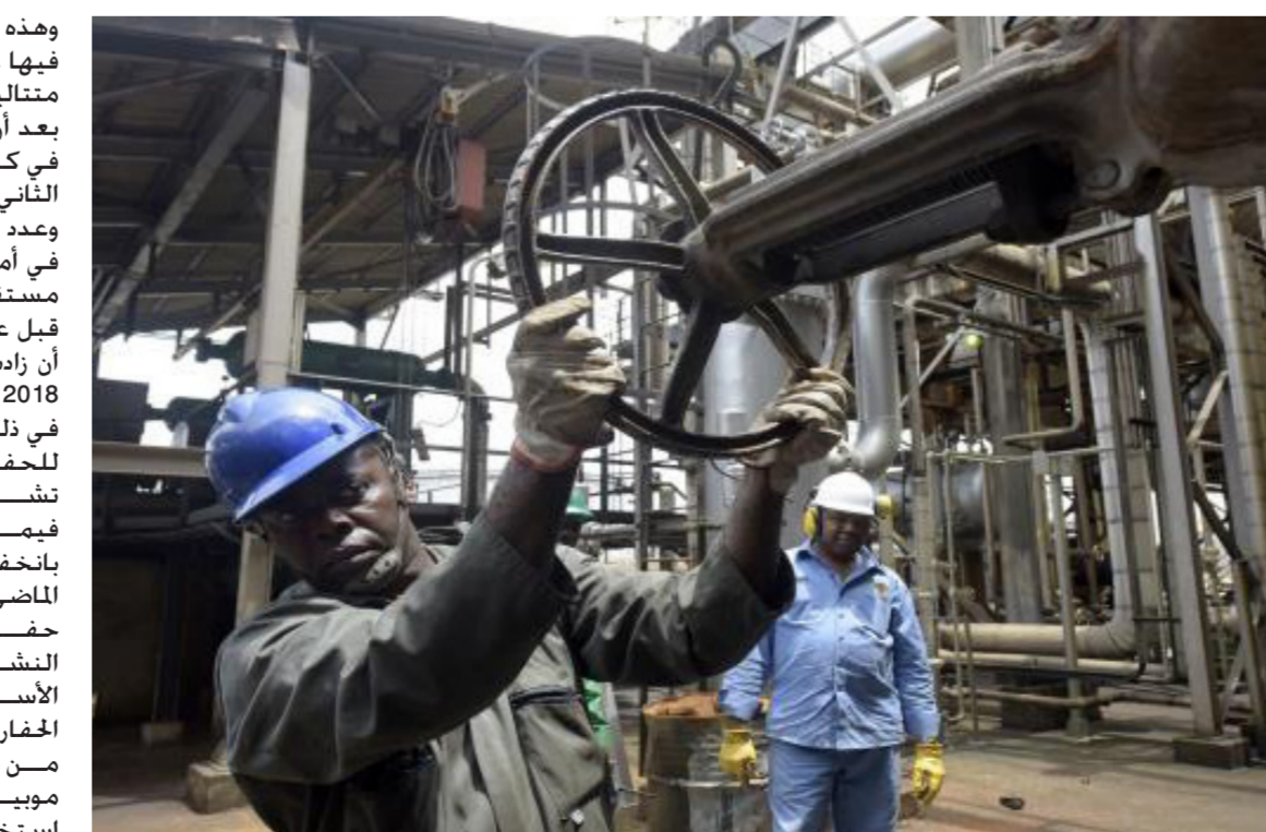
منشأة نفطية "أرشيف"

وهذه هي المرة الأولى التي ينخفض فيها عدد الحفارات لثلاثة أشهر متتالية منذ تشرين الأول 2017. بعد أن تراجع بمقدار حفارين اثنين في كانون الأول و23 حفاراً في كانون الثاني. وعدد الحفارات النفطية النشطة في أميركا، وهو مؤشر أولي للإنتاج مستقبلاً، ما زال أعلى من مستواه قبل عام عندما بلغ 799 حفاراً بعد أن زادت شركات الطاقة الإنتاج في 2018 للاستفادة من أسعار أعلى في ذلك العام. لكن يبعث شركات للحفر قالت إنها تخطط لوقف تشغيل حفارات نفطية في 2019 فيما يرجع جزئياً إلى توقعات بانخفاض أسعار الخام عن العام الماضي. ووفقاً ليكر هيزن، بلغ عدد حفارات النفط والغاز الطبيعي النشطة في الولايات المتحدة هذا الأسبوع 1047. وتنتج معظم الحفارات النفط والغاز كليهما. من جانب آخر، انفتحت إكسون موبيل ومايكروسوفت على استخدام التكنولوجيا السحابية في العمليات الصخرية لشركة