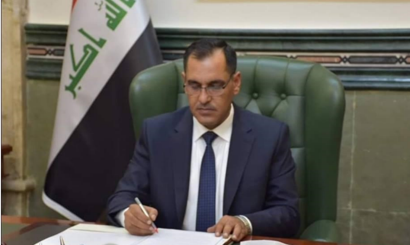
وزير الصناعة والمعادن الدكتور صالح عبدالله الجبوري

الجوار ودول العالم الأخرى لإقامة علاقات اقتصادية على أساس المصلحة المشتركة والمنفعة المتبادلة وعلى جميع الصعد والقطاعات. ولتفت الجبوري خلال رده على سؤال عن إمكانية الشركات الأمريكية للمنافسة إلى أن العراق لم يلمس أي جدية من قبل الشركات الأمريكية والغربية في عقد اتفاقات وعقود شراكة واستثمار على