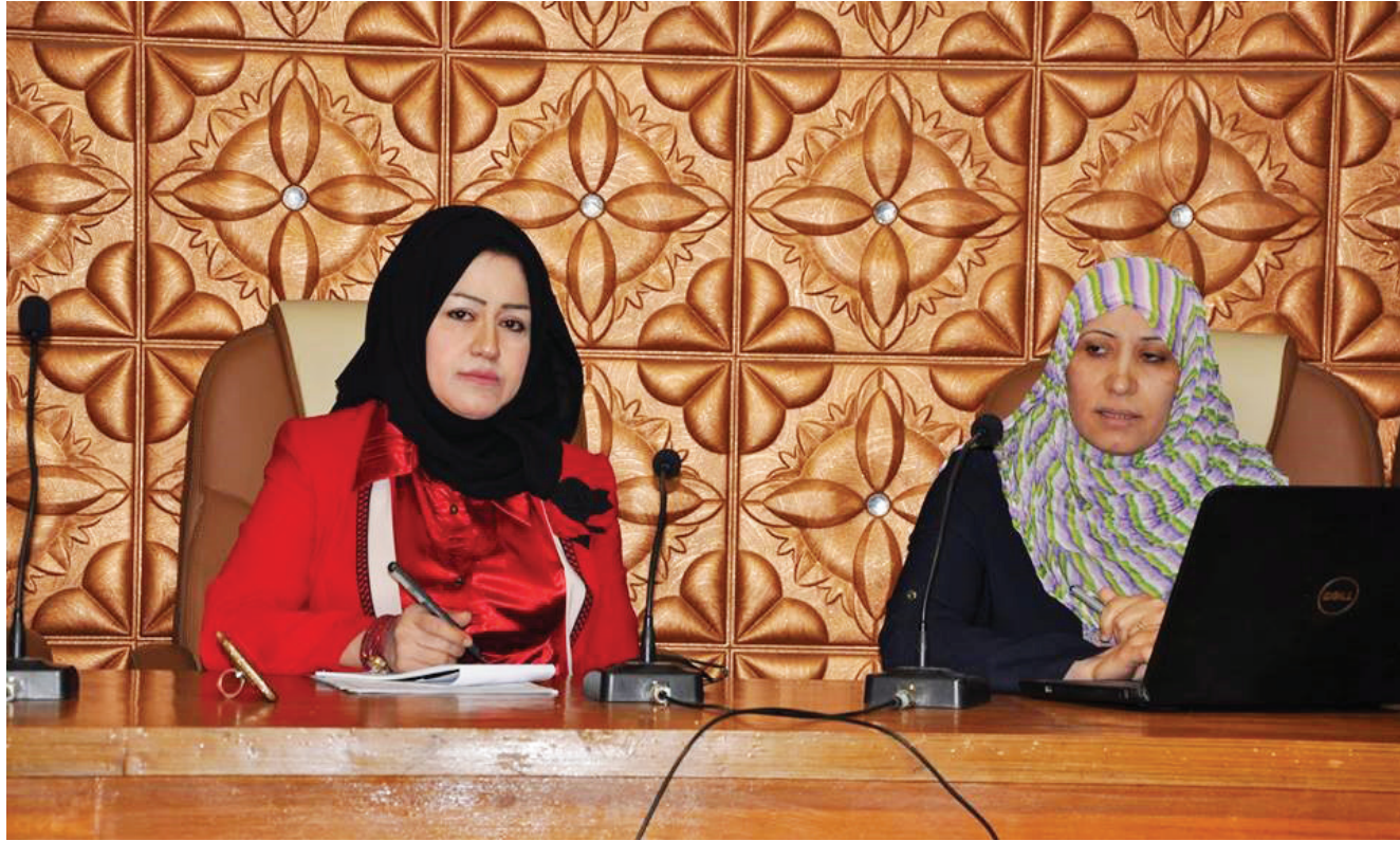
جانب من ندوة دور التربة البيئية في الحد من المشكلات البيئية في العراق