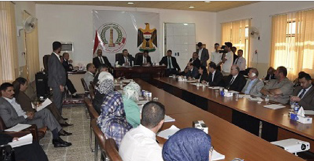
اجتماع مجلس محافظة نينوى

او اقتصادية وغيرها ولن نقبل بهذا الامر نهائيا". وتابع بالقول "الشق الثاني الذي تكلمنا وتكلم فيه دائما. واليوم ايضا طلبنا من اخواننا في مجلس المحافظة الذين هم ضاغطين. لكننا نطلب منهم مفاخة اكثر بخصوص ميزانية محافظة نينوى للعام 2019 التي لا ترتقي إلى الاحتياجات الموجودة في محافظة نينوى المنكوبة التي من المفترض ان يكون له دور كبير واقع حيوي يقول انه ينبغي ان تكون حصة نينوى 11% من الميزانية بينما حصتها حاليا نحو 1%".