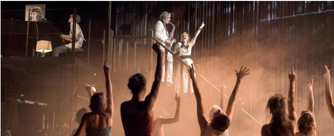
مشهد من العرض المسرحي "سيلفيا"

إلى ورشة عمل ضخمة. فالديكورات تتحرك باستمرار للانتقال من فضاء إلى آخر في حياة بلاث. ومع هذا التحريك تتحرك الكاميرات التي تصور المشاهد بنقل مباشر على المشائفة التي في المنتصف. وإذا كان من مخاطر المشائفات في العروض المسرحية أنها تستحيل أحياناً إلى استسهال يخلو من المعنى. إلا أن المشائفة في العرض لم تكن كذلك. بل إن حضورها كان أساسياً لإتمام المعنى. فالكاميرات كانت تقدم كلورات من حياة سيلفيا بلاث. لقطة مقربة تتجاوز اللقطة العامة المأخوذة عن بلاث. ناهيك عن