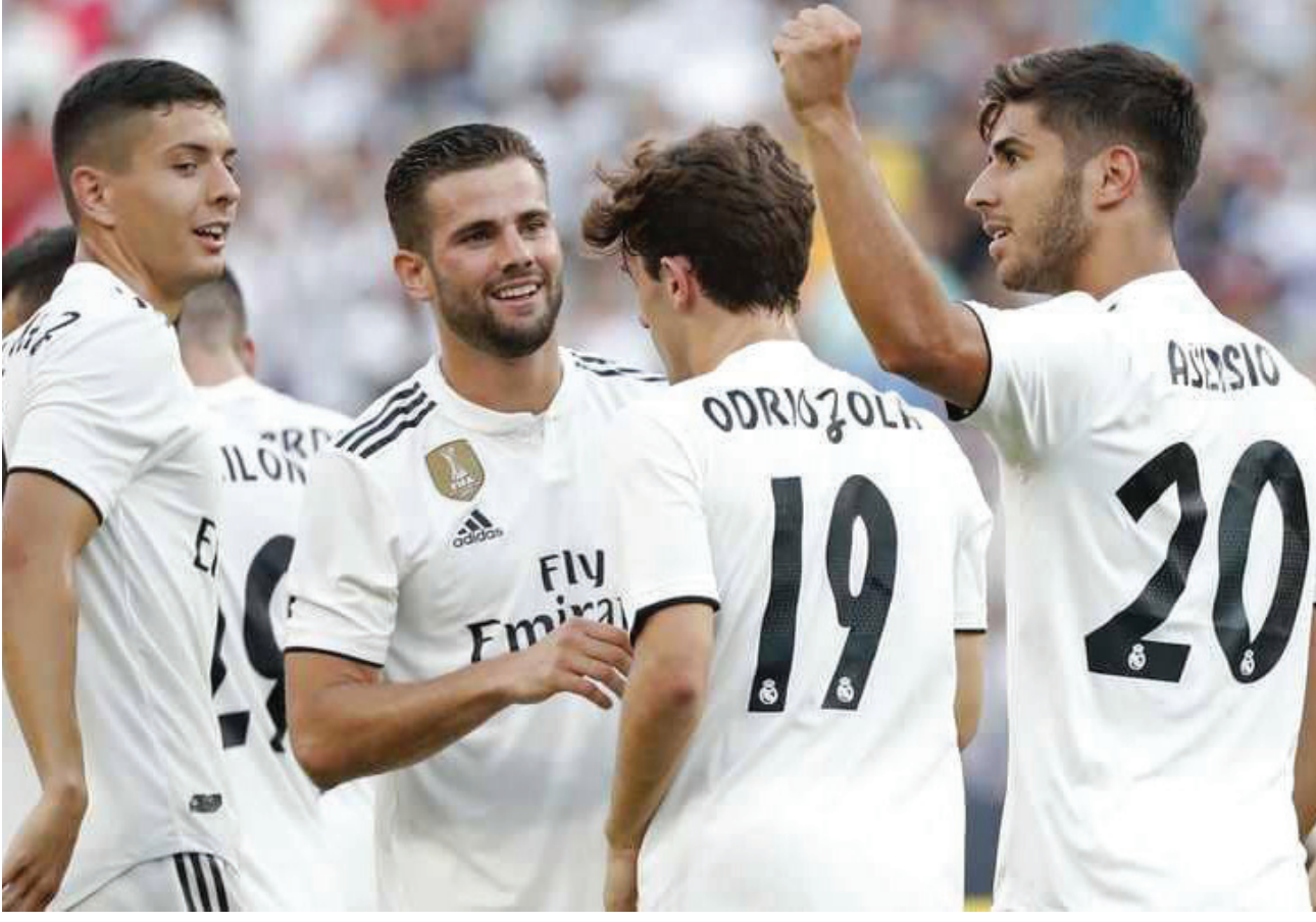
لاعبو ريال مدريد

المحلي لغريمه اتليكو مدريد وبرشلونة ليحل هو خلفهما في المركز الثالث.