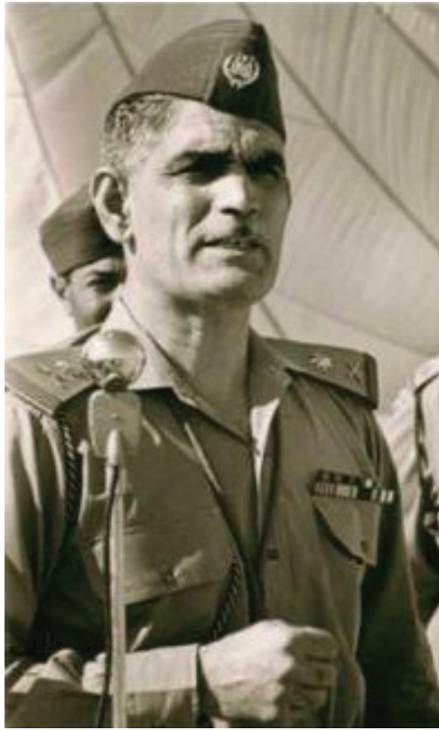
عبد الكرم قاسم