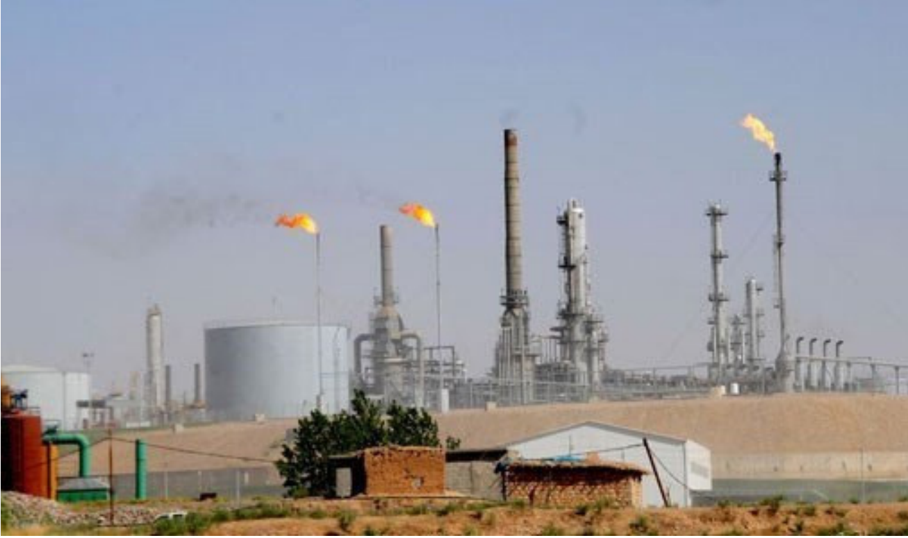
أحد الحقول النفطية في الاقليم

والإقليم». وكانت هيئة الجمارك العراقية قد عقدت إجتماعات مشتركة خلال الأسبوعين الماضيين مع وفد جمارك إقليم كردستان. وأضاف: «إن وفد الهيئة العامة للجمارك العراقية سيبقي في إقليم كردستان حين استكمال كتابة التعرفة الجمركية الجديدة للمحافظات العراقية والبيانات.