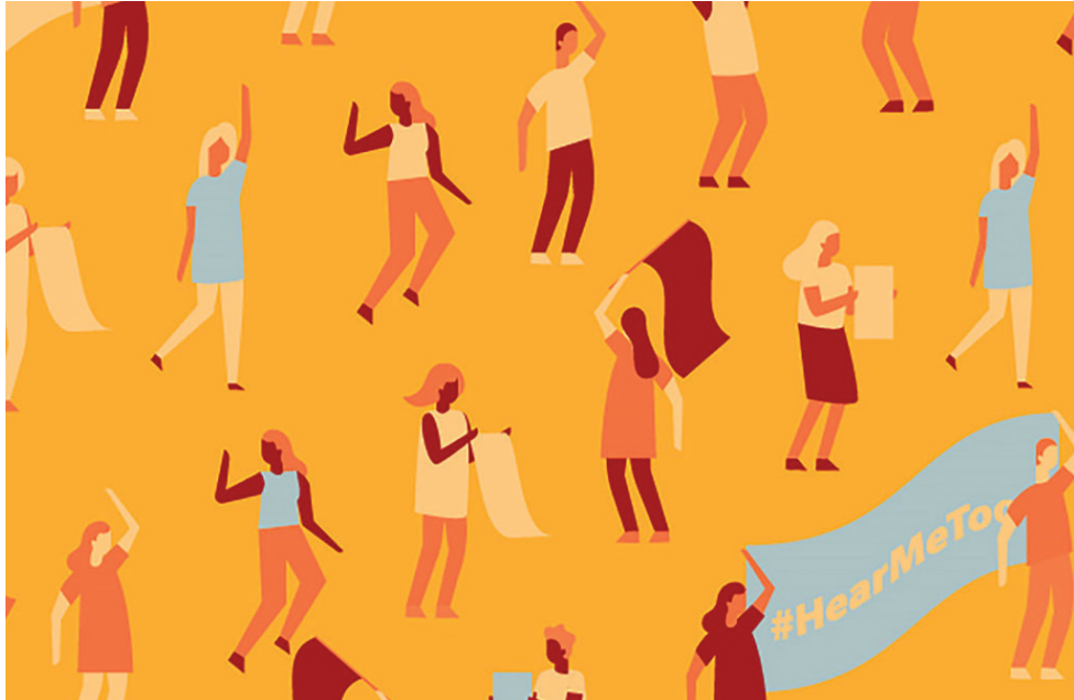
ملصق شعار حملة العام للقضاء على العنف ضد المرأة

الجمعات وصول المرأة إلى الموارد المالية والانتماء، فإنها تعوق قدرة المرأة على ترك الأوضاع السيئة.»