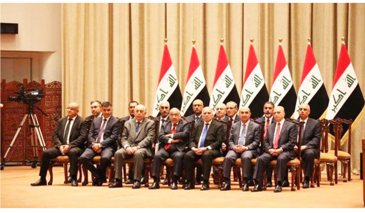
اعضاء حكومة عبد المهدي

بغداد - وعد الشمري: حذرت كتلة الإصلاح والإعمار، أمس الثلاثاء، من مصير حكومة عادل عبد المهدي مع استمرار ضغوط جهات سياسية للحصول على وزارات. داعية للإسراع في حسم الحقائق الشاغرة، ورأت أن الحديث عن بيع المناصب وصل لمرحلة ينبغي الوقوف عنده ومعالجته بنحو عاجل. وقال النائب عن قائمة سائرون رائد فهمي، إن "الاتفاق حصل بان تشكيل الحكومة على وفق منح الإصلاح السياسي والاقتصادي وينظم إليها وزراء مستقلون". وأضاف فهمي، في حديث إلى "الصباح الجديد"، أن "ذلك الاتفاق أدى إلى تنازل العديد من الكتل السياسية عن استحقاقها في مقدمتها سائرون والحكمة والنصر وبدور". وأشار إلى أن "كتلتي الإصلاح والبناء تفاهموا على تمرير الوجبة الأولى من الوزراء عدد كبير منهم من المستقلين برغم ملاحظتنا على آخرين بان لديهم انتماءات سياسية". إلى أن "وصولنا