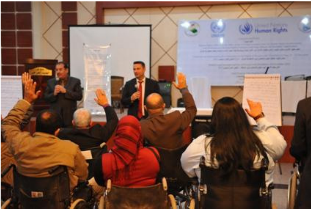
جانب من الورش المقامة المتخصصة بحقوق الأشخاص ذوي الإعاقة

بغداد - الصباح الجديد: أعلنت الشركة العامة للاسمنت العراقية إحدى شركات وزارة الصناعة والمعادن عن عزمها تعميم جريسة استنظام معمل اسمنت كربلاء على بقية معامل الشركة كونها أثبتت فاعلية وجأحا كبيرا.