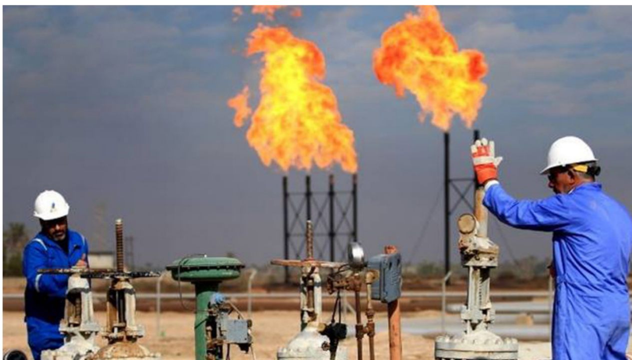
منشأة نفطية جنوبية

شركة تسويق النفط العراقية (سومو)، وبلغت كمية الصادرات من النفط الخام (111 مليوناً و61 ألفاً و618) برميل (مائة واحد وعشرون مليوناً وستون ألفاً وستمئة وثمان عشرة برميل، 8 تصفيات ص