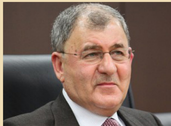
عبد اللطيف رشيد

بغداد - الصباح الجديد: قالت القيادية في الآحاد الوطني الكردستاني ريزان شيخ دليز، أمس الثلاثاء، إن رئيس العراق المقبل يجب أن يرسخ مبدأ هبة الدولة وجعلها في مصاف الدول المتقدمة من خلال تمهين شبكة علاقاته الإقليمية والدولية، مشيرة إلى أن هبة الدولة ومنع التدخلات الخارجية أهم التحديات التي ستواجه رئيس الجمهورية القادم. وقالت شيخ دليز في بيان تلقت الصباح الجديد نسخة منه، إن "العراق بأهم الحاجة إلى رئيس جمهورية يحافظ على حدوده وترتبه ومائه وسمائنه ويحمي