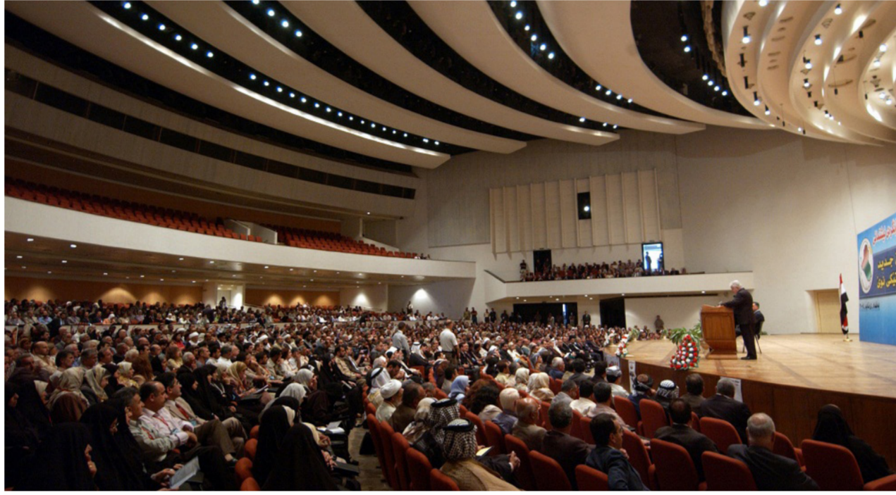
مجلس النواب "ارشيف"

الجمهورية الذي يقوم بدوره الأعضاء سناً لانتخاب رئيس للمجلس ونائبه. بعدها ينتقل مجلس النواب لاختيار رئيس الجمهورية الذي يقوم بدوره الأعضاء سناً لانتخاب رئيس للمجلس ونائبه. بعدها ينتقل مجلس النواب لاختيار رئيس