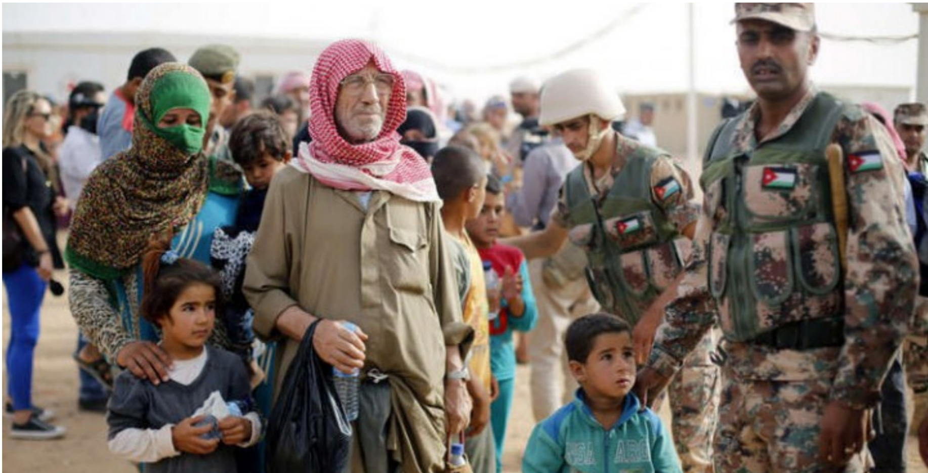
لاجئون سوريون في الاردن