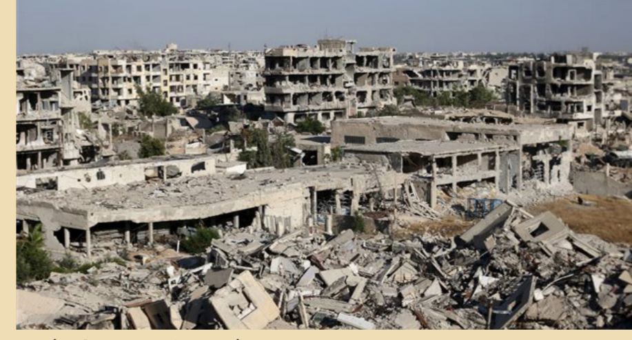
اثار الدمار في مدن سورية "ارشيف"

العسكرية ضد إسرائيل ومنصة لإبراز القوة في بلاد الشرق من جهة أخرى". ولفت التقرير في هذا السياق إلى أن إسرائيل نفذت منذ عام 2013 أكثر من 130 ضربة في سوريا ضد "شحنات من الأسلحة الموجهة لحزب الله". وإلى توسيعها مثل هذه الهجمات منذ أواخر عام 2017 لتشمل "المنشآت العسكرية الإيرانية في سوريا". وحذر الخبيران من إمكانية "اندلاع حرب على جبهات متعددة. وفي أماكن بعيدة. وتدور على الأرض وفي الجو وفي البحر وفي مجال المعلومات والنطاق السببراني. من قبل مقاتلين من حزب الله وإيران