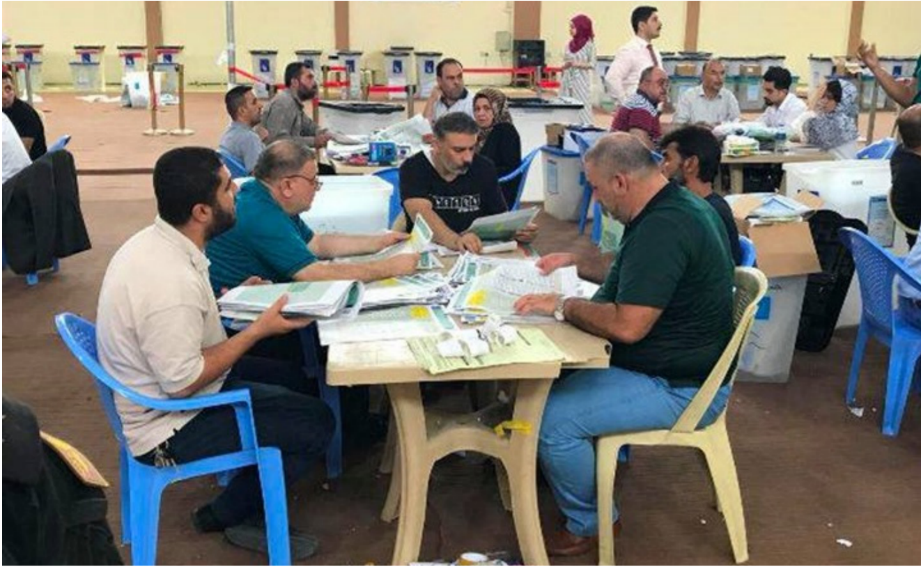
عملية العد والفرز البريدي

الاحزاب والقوى الكردستانية للذهاب الى بغداد. الا ان احزاب المعارضة كانت ترفض هذا الطرح وتتهم الحزبين بالسرقة والتلاعب بنتائج الانتخابات. واذاف كارواني تمنى ان تتمكن من جمع الاطراف كافة على طاولة حوار واحدة من دون احقاد او ضغائن للاتفاق على برنامج والية موحدة والاتفاق مع حزبي السلطة على برنامج وطني موحد للمشاركة في العملية السياسية في العراق تكون اساس حوار جديد مع بغداد. واذاف ان شروطنا في هذا المشروع ستكون التمسك بالحقوق الدستورية لشعب كردستان وعدم المسالمة عليها لقاء الحصول على مناصب امتيازات لبعض الاحزاب في بغداد.