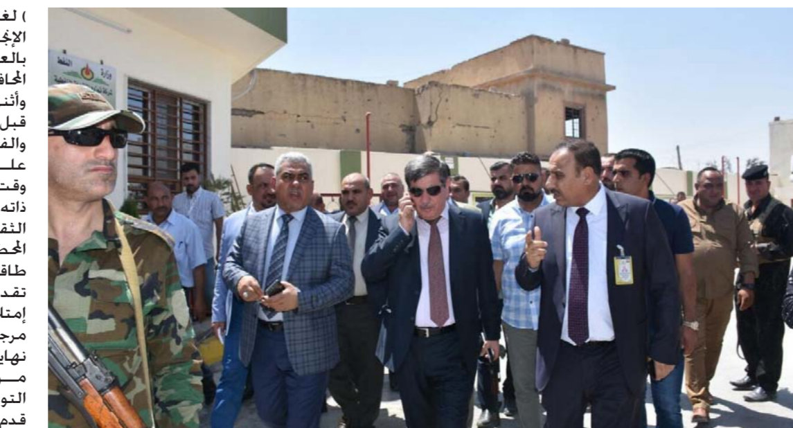
جانب من الجولة التفقدية

( لغرض الإطلاع على نسب الإجاز والحث على الإسراع بالعمل لإعادتها لخدمة أهالي المحافظة. وأثنى الوكيل لى الجهود المبذولة من قبل ملاكات فرع نيوى الهندسية والفنية في العمل دون الإعتداع على المستثمرين الخرجيين وفي وقت قياسي . مشيدا في الوقت ذاته بنسبة إجاز محطة تعبئة الطاقة خزنية عالية لمنتج البنزين تقدر بـ(٥٤٠) ألف لتر إضافة الى إمتلاكها ٢٨ مضخة و٥٦ ذراعا مرجحا إن إجازها سيكون في نهاية العام الحالي. من جانبه أكد مدير عام شركة التوزيع على ان النابعة جري على قدم وساق مع فرع نيوى لإجاز المنافذ التوزيعية التي تشهد