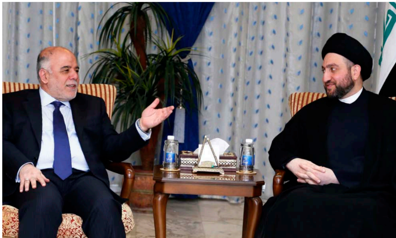
لقاء سابق بين الحكيم والعبادي "رشيد"

بغداد - الصباح الجديد: أكد رئيس مجلس الوزراء جعفر العبادي، اليوم الاثنين، ان التزام الحكومة العراقية بشأن موضوع ايران هو عدم التعامل بعملية الدولار وليس الالتزام بالعقوبات الامريكية. وأضاف في المؤتمر أيضا "علينا ان نجلس مع الدول المجاورة للتفاهم حول مشكلة المياه". مبينا ان مجلس الوزراء وافق على حزمة جديدة من القرارات لاقامة المشاريع وتوفير الخدمات في 11 محافظة. وقال العبادي خلال مؤتمره الاسبوعي، وتابعه الصباح الجديد ان "موقف الحكومة العراقية ثابت برفض الاعتداء على دول الجوار انطلاقاً من اراضيها". مؤكدا ان "التزام الحكومة العراقية بشأن موضوع