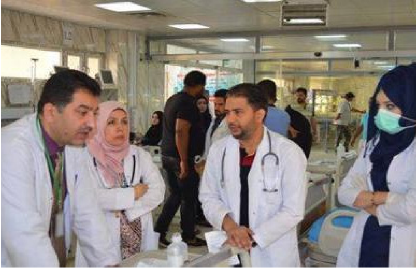
الخدمات الوقائية للحالات الطارئة

ونصب العباب اطفال جديدة لإستقبال العائلات خلال أيام العيد . وأضاف أن « الأمانة هيأت أيضاً حدائق شارع أبي نؤاس وكورنيش الأعظمية ومرافق متنزه الزوراء لإستقبال المواطنين طوال أيام العيد الى جانب المرافق الترفيهية الأخرى التابعة لقطاع الاستمرار