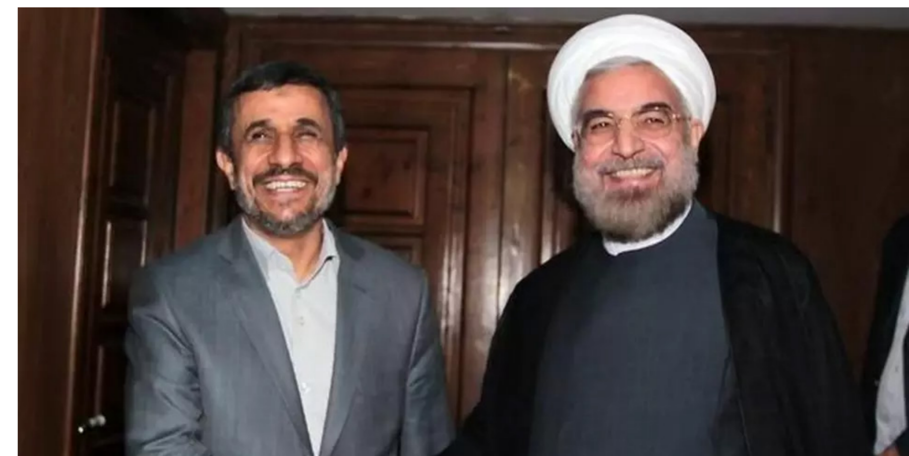
أحمدى نجاد وروحاني حين كانت جمعتهما «الالفة»

عن «المستقبل للإبحاث والدراسات المتقدمة».