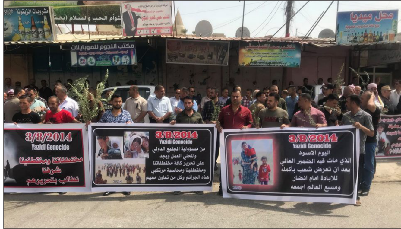
جانب من التظاهرات