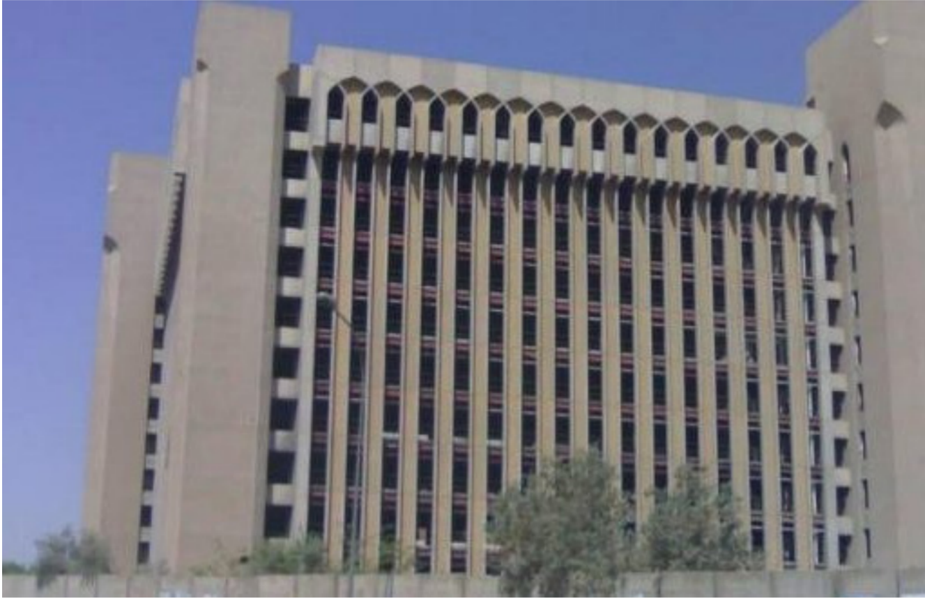
وزارة التعليم العالي

مؤيدة بكتاب من مديريات التربية في بغداد والمحافظات وبتصديق من وزارة التربية. على صعيد متصل ناقشت وزارة التعليم العالي والبحث العلمي معالجة حالات الطلبة النازحين من المحافظات التي حررتها القوات الأمنية من عصابات داعش. وإعادة تأهيل الجامعات الحرة واستكمال احتياجات المؤسسات التعليمية عبر توفير المستلزمات التدريسية في جامعات المحافظات الحرة.