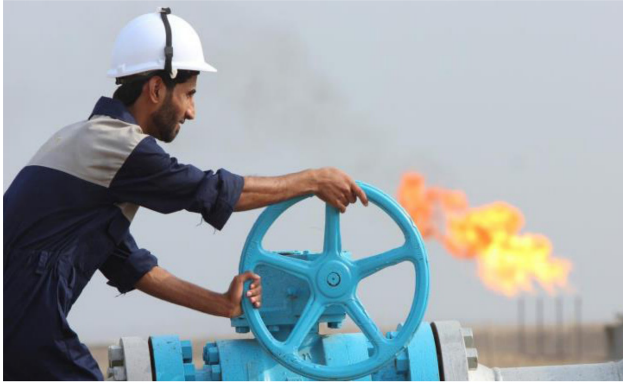
جانب من الحقول النفطية جنوبي البلاد "ارشيف"

109 ملايين و847 ألفا و268 برميلا بإيرادات بلغت سبعة مليارات و597 مليوناً و348 ألف دولاراً. وأوضح أن معدل سعر البرميل الواحد بلغ 69,163 دولاراً. وفي كانون الثاني الماضي بلغت الصادرات 108,190,068 مليون برميل يومياً بإيرادات بلغت 6,772,229,348.14 ملايين دولار. في حين بلغت صادرات شباط 95,940,404 مليون برميل يومياً بإيرادات بلغت 5,762,174,290.40 ملايين دولار. أما صادرات آذار فقد بلغت 107,050,000 مليون برميل يومياً بإيرادات 6,435,210,449 ملايين دولار. وفي شهر نيسان الماضي تراجعت الصادرات الى 100,197,197 مليون برميل يومياً بإيرادات بلغت 6,501,695,449 مليون دولار. في حين ارتفعت صادرات شهر أيار الى 108,175,920 مليون برميل يومياً بإيرادات بلغت 7,550,777,495 ملايين دولار.