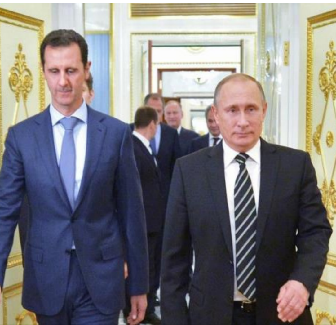
الرئيس الروسي بوتين والرئيس السوري بشار الأسد

تدرك موسكو أن قوات الأسد في الوقت الحالي ضعيفة جداً بحيث لا تستطيع أن تدبر بشكل مستقل جهات الصراع الواسعة، فإن وجود أكثر من ٢٤ ألف ميليشيا أجنبية موالية لإيران، يعتبر ضرورياً لتعزير