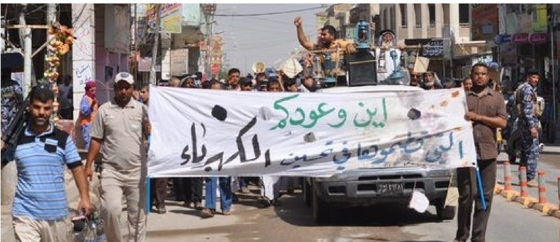
احتجاجات للمطالبة بتحسين التيار الكهربائي في بغداد

5- التعاون الدولي، حيث منح المجلس الرئاسي لحكومة الوفاق الوطني الليبية، في 24 يوليو 2018، إتّسا للشركة العامة للكهرباء، بالتعاون مع شركة «جنرال إلكتريك» الأمريكية عن طريق التكليف المباشر، وذلك للإشراف على أعمال الفك وتركيب والخدمات الفنية اللازمة، وتوريد المعدات الخاصة المطلوبة لجميع أعمال الصيانة والتطوير للمحطات الغازية لمحطات الإنتاج العاملة بشبكة الكهرباء بقيمة إجمالية قدرها أكثر من 33 مليون يورو.