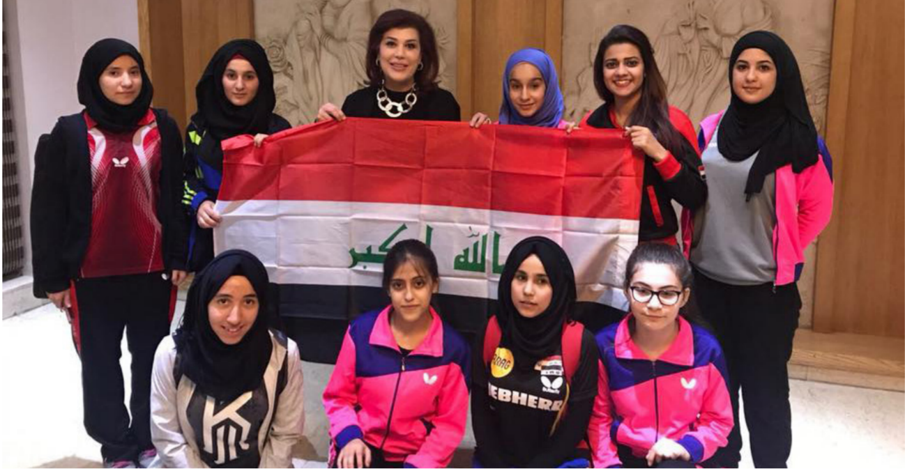
سفيرة العراق تتوسط وفد لاعبات كرة الطاولة