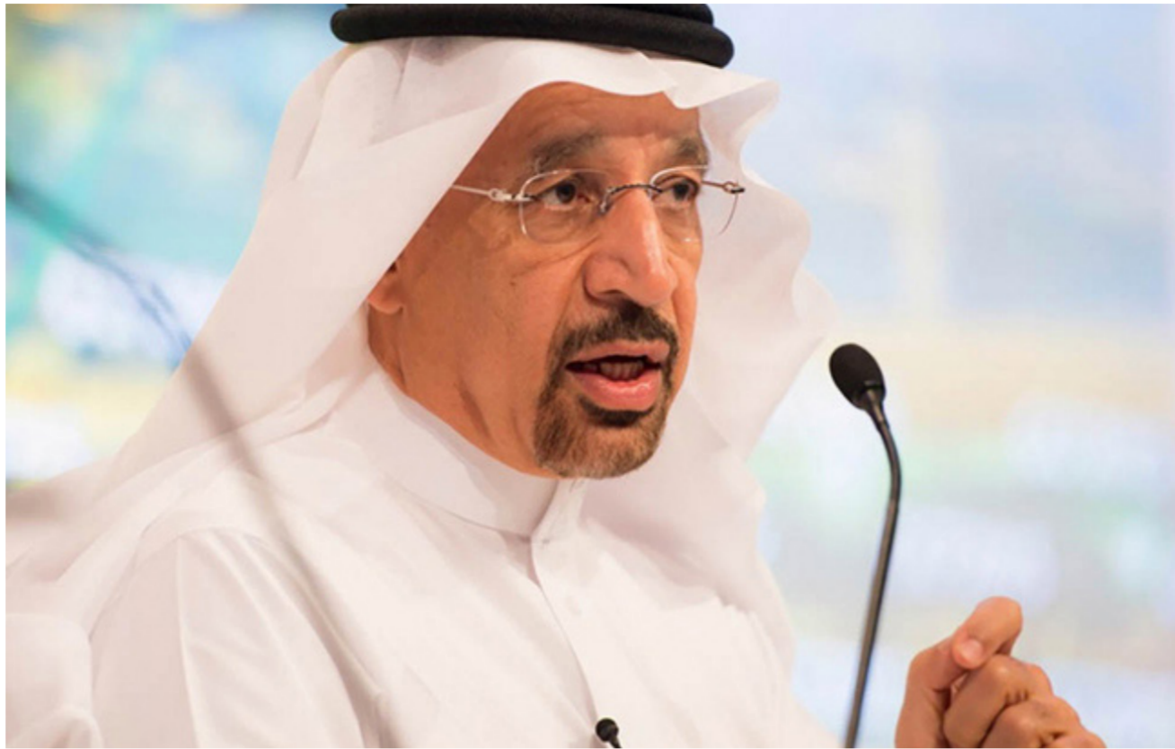
وزير الطاقة خالد الفالح

وتعد الصين أكبر مستورد للنفط الإيراني. ووفقاً لبيانات «بلومبرغ» تمثل الصين وجهة نحو 35% من صادرات النفط الإيراني.