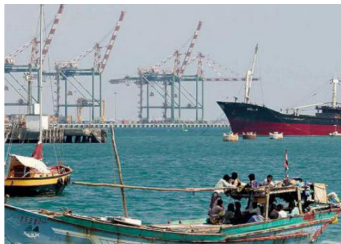
جانب من الموانئ الهندية

الذين توقعوا تراجعها. فقد تطلعت الدول الأوروبية لإمدادات الغاز المسال من الشرق الأوسط والولايات المتحدة، كبديل رئيس عن الغاز الروسي، إذ قال أحد