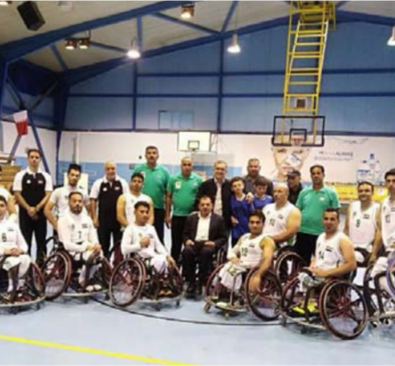
منتخب سلة الكراسي

لغزة البطولة المهمة. وأشار إلى منتخبنا شرع بالاستعداد الذاتي منذ ثلاثة أشهر أي بعد بطولة غرب آسيا التي احتكر لقبها للموسم الثاني على التوالي مسجداً بما يبذله اللاعبون من جهود في ظل الظروف الصعبة، واستمرارهم بالتدريبات اليومية لمدة خمسة أيام في الأسبوع وفق المنهج الذي وضعه المدرب الأجنبي خاكي بالنسبة مع الأخاد، مثنياً جهود اللاعبين وأصحابهم على بذل الجهود لبلوغ غايتهم ومواكبة الدول الآسيوية في المنافسات فكان تقبلهم ما بين قاعة وزارة الشباب للمدارس التخصصية ونادي وسام الحد وفق منهج مدربهم الأجنبي. وأكد رشك أن طموح المنتخب يبقى