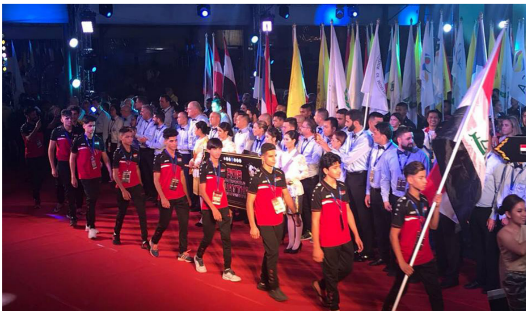
وفدنا في افتتاح البطولة