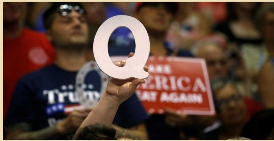
شعار النصير الغامض لترامب

منذيات على "الإنترنت المظلم". أجزاء أو "فتات" معلومات في