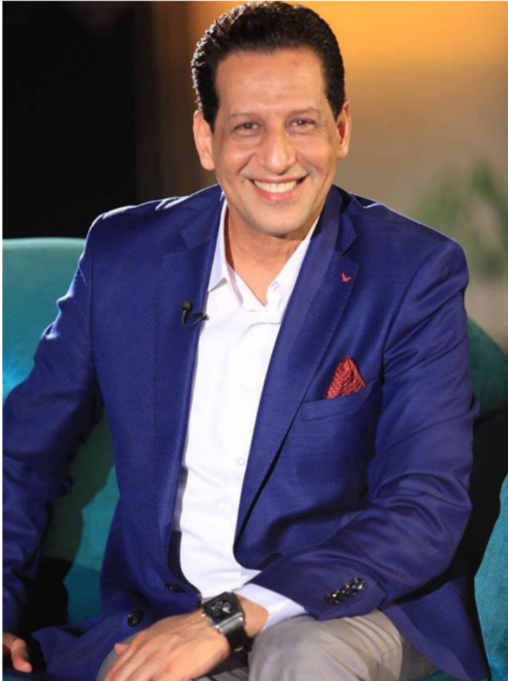
الفنان الكوميدي علي جابر