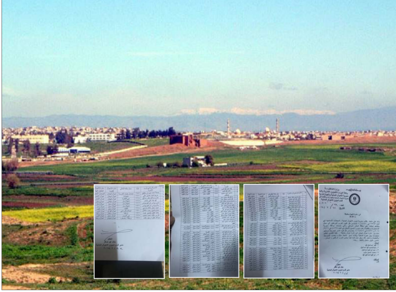
جانب من سهل نينوى "ارشيف"