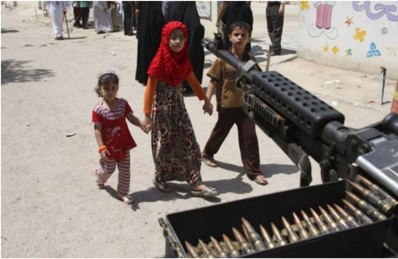
الطفولة في ظل النزاعات المسلحة

للاطفال في صفوفها بعد عددا مؤسسه رسمية والاتفاق على توجيه كتاب رسمي الى تشكيات الحشد كافة للإبلاغ عن مثل تلك الحالات ان وجدت. وستقوم الوزارات والجهات ذات العلاقة بتقديم خططها للعمل على تنفيذ هذه الادعاءات تمهيدا لاعداد خطة شاملة يتم تنفيذها خلال سنة اشهر لرفع اسم العراق من قائمة الدول المتهمه بتجنيد الاطفال خلال النزاعات المسلحة.