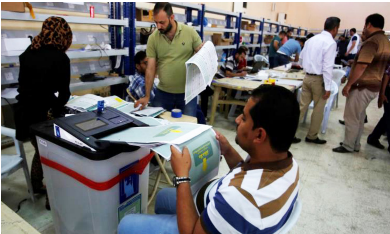
جانب من عمليات العد والفرز اليدوي "ارشيف"

في محافظات وسط وجنوب العراق". النتائج كانت مطابقة لاسيما