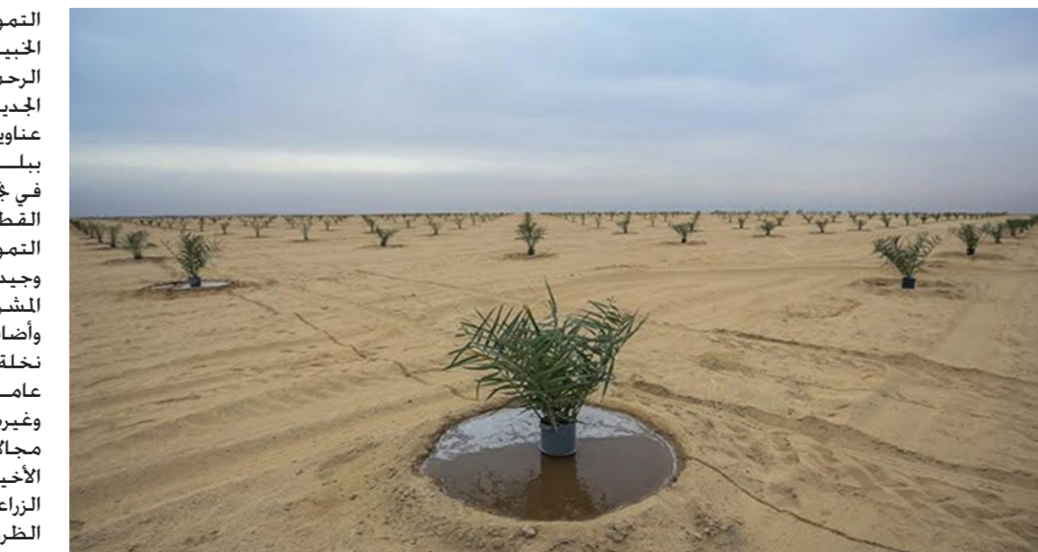
زراعة النخيل في العراق

خطوة أخرى في مدينة كربلاء اذ تمت زراعة مليون نخلة بين العتبة العباسية والحسنية المندسة وبين النخيل وتمت زراعة مساحات كبيرة بالنخيل خصوصا «البرحي». وتعد اشجار النخيل الشريان الزراعي الرئيس للاقتصاد العراقي نظرا لما يقوم به العراق من تصدير منتجات التمور إلى العراق في الفترة الأخيرة أصبح العراق مستورداً للتمور على الرغم من توفر العوامل التي يمكن أن يجعله مجدداً مصدراً للتمور إلى العالم. وتشير الإحصائيات الدولية إلى ان عدد النخيل في العراق خلال ثمانينات القرن الماضي كان تجاوز الـ 35 مليون نخلة إلا ان وزارة الزراعة فقد أعلنت ان عدد النخيل في العراق تقدر بـ 21 الى 23 مليون نخلة ما يعني ان العراق قد خسّر نحو أكثر من 14 مليون نخلة.