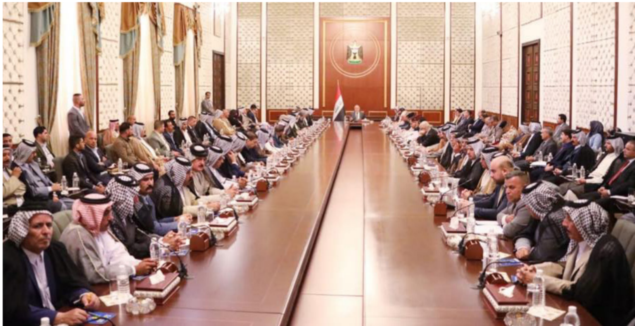
حيدر العبادي يلتقي وفدا من اهالي الديوانية

أورد أيضا في احد البيانات التي تلققتها "الصباح الجديد" إن "مجلس الوزراء وجه وزارة المالية بتمويل مشاريع تأهيل الماء العاملة، وتنفيذ 52 مدرسة في البصرة، وإنجاز اعمال محطة تعزير شط الرمينة". واضاف المكتب، أن "قرار المجلس نص على تخصيص وتمويل النفقات الجارية بمبلغ 3 مليارات دينار من احتياطي الطوارئ لعام 2018 التي محافظة البصرة لتغطية تكاليف تأهيل مشاريع الماء العاملة حاليا، وفقا للأحكام العليا بتنفيذ الموازنة، وتخصيص مبلغ 3 مليارات دينار أخرى من احتياطي الطوارئ لمشروع ماء ام قصر المدرج ضمن برنامج تنمية الأقاليم لعام 2018". وبين المكتب، أن "القرار نص، أيضا، على قيام وزارة المالية بتخصيص وتمويل مبلغ 9 مليارات دينار من احتياطي الطوارئ لإكمال تنفيذ 52 مقولة مدرسة خلال ثلاثة أشهر".