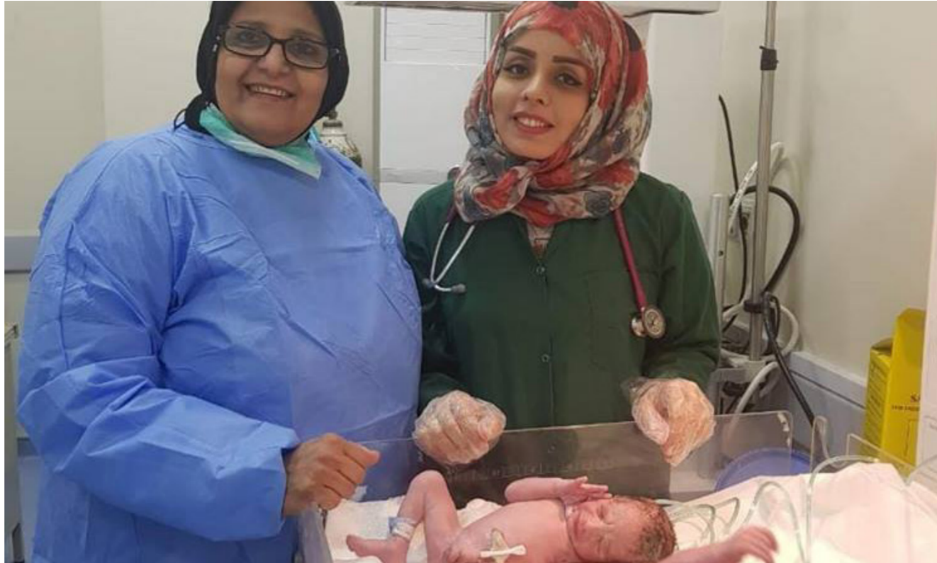
الملك الطبي المشرف على عملية الأجاب