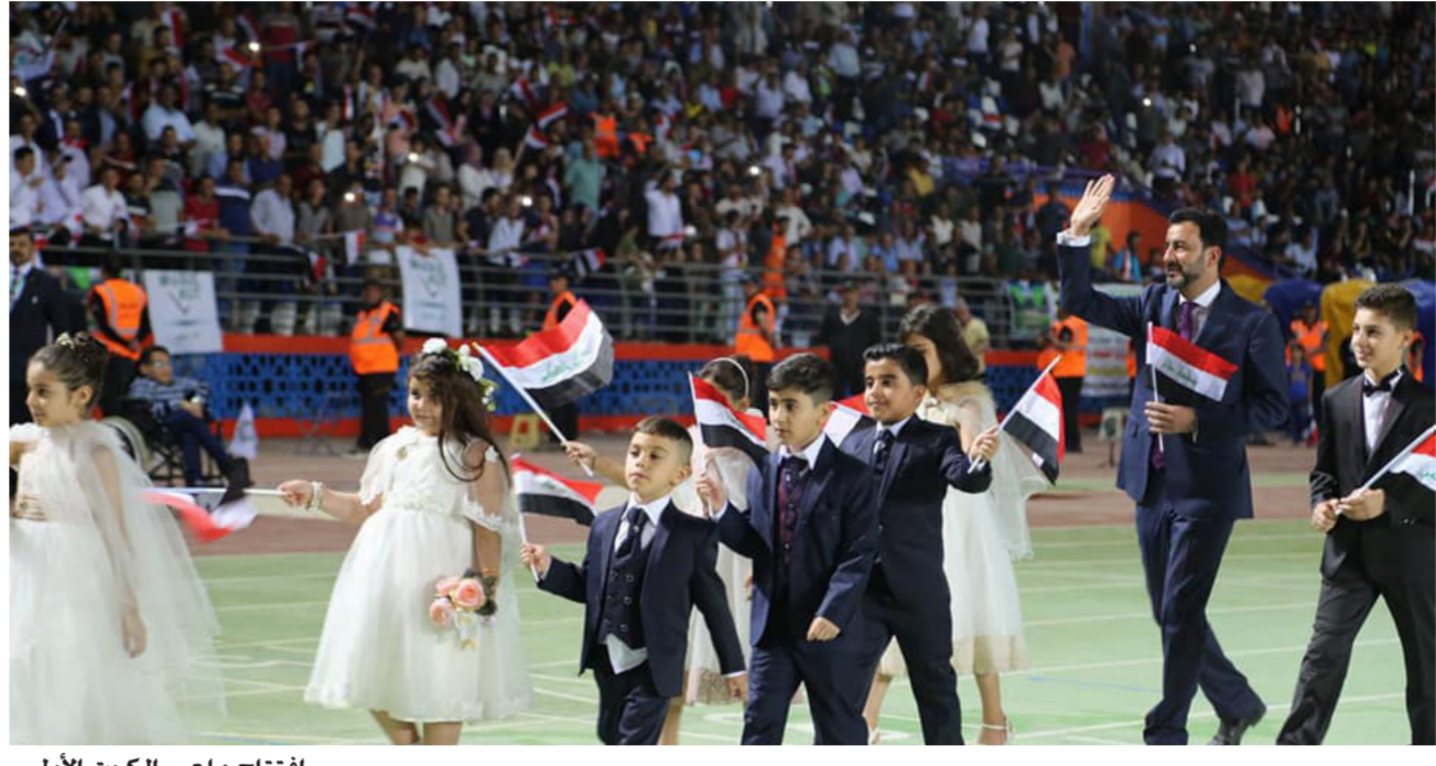
افتتاح ملعب الكوت الاولبي

ثم قدم المايكروفون لاحدى بنات شهداء واسط لتأذن بافتتاح ملعب الكوت الاولبي لتنتقل