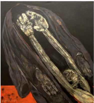
لوحة للفنان عمران يونس

استرجاع بيته الشائع: " ... فؤادي في غشام من نبال. فصرت إذا أصابتنني سهام تكسرت النصال على النصال". يقع زمان العرض ما بين السادس والعشرين من حزيران/ يونيو، والثالث من آب/ أغسطس 2018. فإنتي ذكر موقع ولادته في الحسكة شمال سورية عام 1971. يقيم محترفه في دمشق منذ تخرجه من كلية فنون جامعة دمشق عام 1988. هو المعرض الثاني في نفس الصالة، الأول كان عام 2014. بدأ عرضه في الدوحة إلى جانب فنانين معروفين من أمثال ضياء العزراوي ومنى حاطوم ويوسف نبيل. من الجدير بالذكر أن بيروقراطية وزارة الداخلية الفرنسية