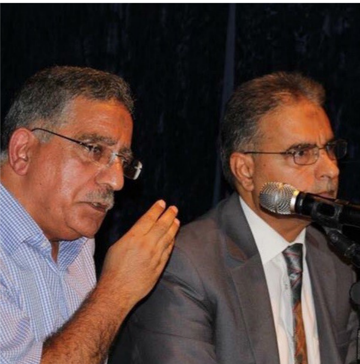
جانب من الاحتفاء

هاكوب ! سترارك ! سيروان تومان ساعة سيورين مكتبة الجميع محمود عبد الوهاب سينما الوطني الرشيد اطلس الحمراء الكرنك