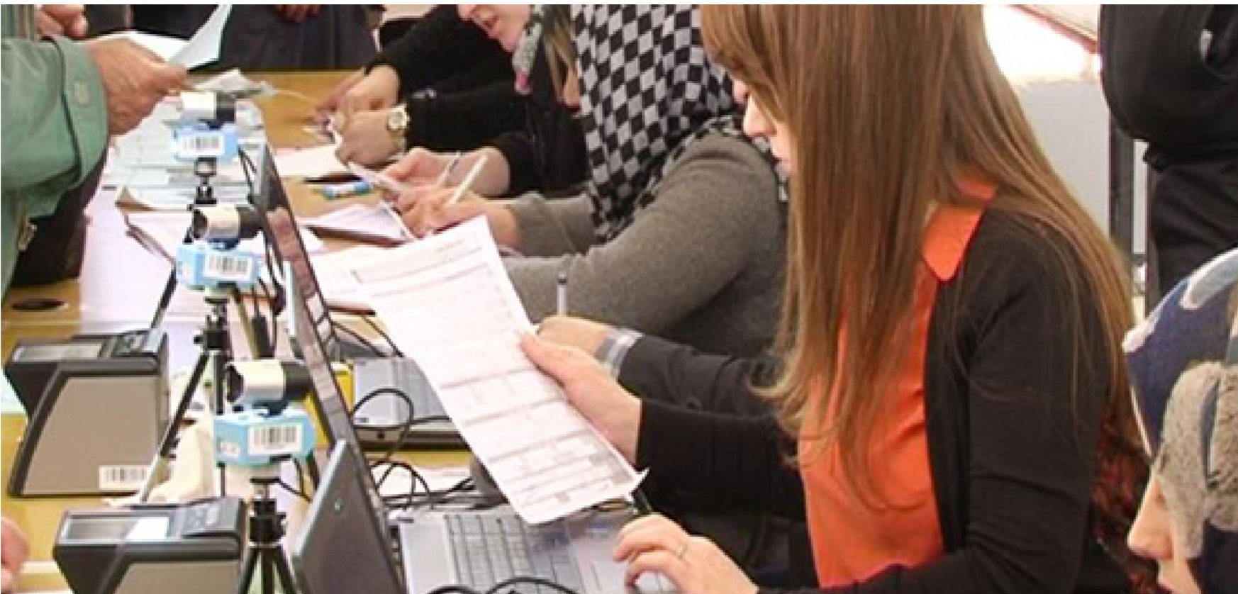
جانب من إحدى الدوائر الحكومية

682 ألف موظف. وإثمه من الضروري على حكومة إقليم كردستان الحد من التفاوت في موازنة تعويضات الموظفين؛ لأن موظفي الإقليم يمثلون نحو 24% من القطاع العام العراقي. في حين أن نصيبهم الحالي من الموازنة الاتحادية على أساس النسبة السكانية للعراق عموماً يصل إلى أقل من 13%. ويشير التخفيض الحاصل في أعداد الوظائف على مستوى الدولة في القطاع العام إلى أن الرواتب الحكومية لعام 2018تشكل نسبة 33.4% من إجمالي الموازنة الاتحادية للعام الحالي مقارنة بالعام الماضي إذ كانت بنسبة 35.5%. وعلى الرغم من الانخفاض الملحوظ بالنسبة، لكن هذا الرقم ما يزال مرتفعاً للغاية.