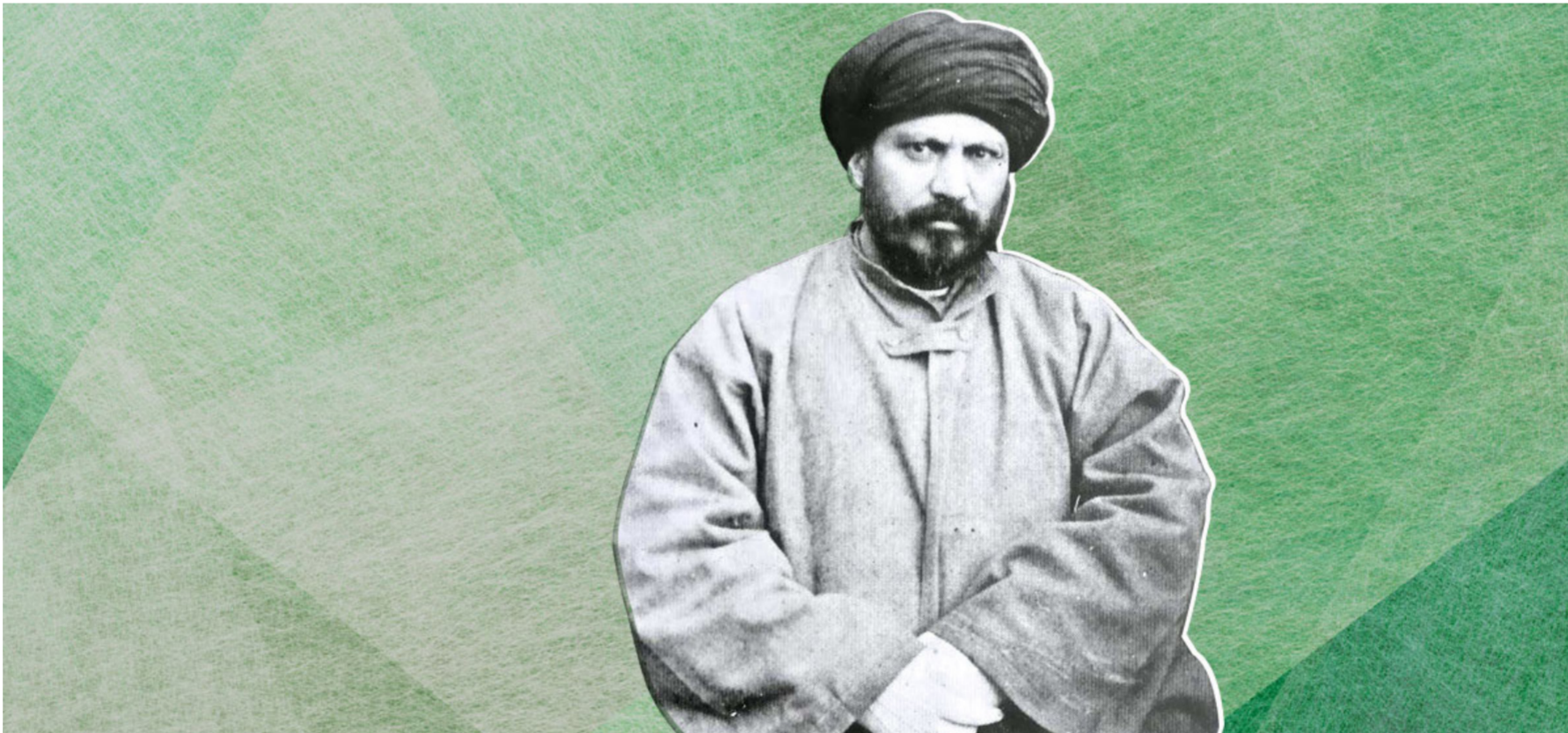
جمال الدين الأفغاني

كانت تنطلق -في حالتي الرفض أو القبول على حد سواء- من اعتبار الغرب وما حققه من نتائج حضارية ناجحة، مقياساً لما ينبغي أن نقيس به أحوالنا. فهل يبدو ذلك معياراً سليماً من جميع الوجوه؛ وهل هناك قوانين عامة واحدة تحكم تطور جميع المجتمعات، دون الحاجة للتمعن فيما يمكن أن يكون منشأها وعمادها بين البشر وما يمكن أن يكون مختلفاً وخاصاً! إن أفكاراً مثل «الأمية» وبالمثل «الإنسانية والعولة» العابرة لجميع أشكال الحدود قد لا تبدو سليمة دائماً، إذ يمكن أن تصطدم تلك الأفكار بروحية «النطاقات الحضارية المتعددة» التي تصنع تمايزاً محموداً بين أبناء العمورة، فتتشكل المتباينة تبايناً بئساء يعرض بعضها بعضاً.