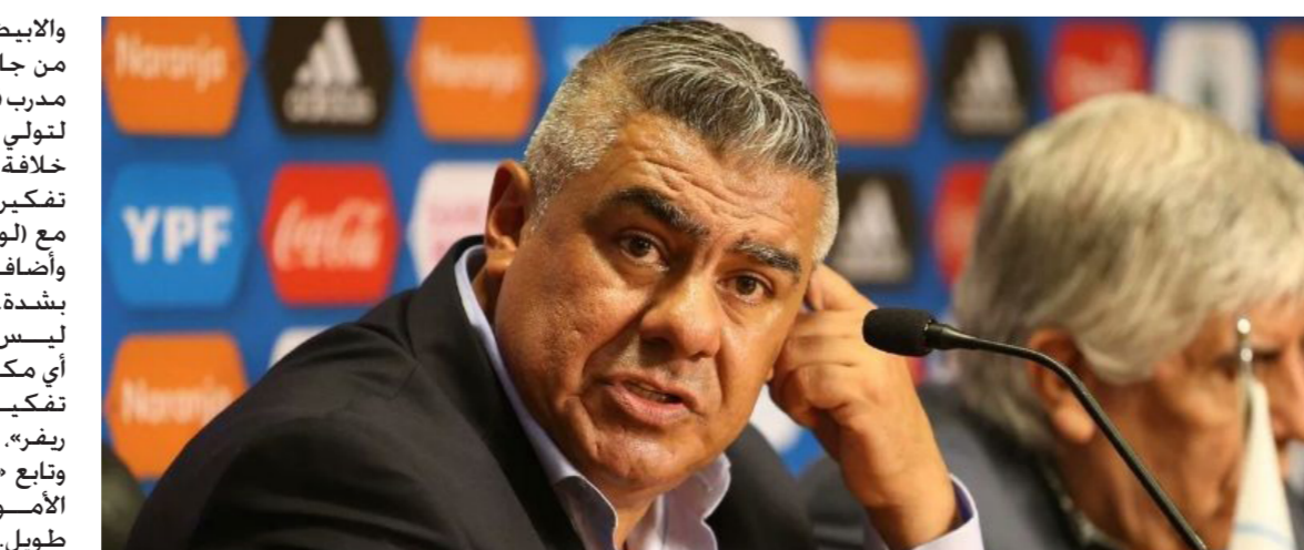
رئيس الاتحاد الأرجنتيني كلاوديو تابيا

والأبيض سوى 15 مباراة. من جانب آخر قال مارسيلو جاياردو مدرب فريق ريفرليت وأحد المرشحين لتولي تدريب منتخب الأرجنتين. إن خلافة خورخي سامباولي لا تشغل تفكيره مشيراً إلى أنه يملك عقداً مع (لوس ميوناريس). وأضاف جاياردو «احترم تعاقدي بشدة. الشائعات تظل شائعات. ليس لدي الكثير لقوله. لم أتلق أي مكاملة الأمر لا ينبغي حيزاً من تفكيري اليوم. أركز فحسب مع ريفر». وذلك خلال مؤتمر صحفي. وتابع «أظهر المونديال أننا كنا ننفذ الأمور على نحو سيء منذ وقت طويل. حان وقت التعلم والتوقف عن النظر إلى الجانب الآخر والبدء في