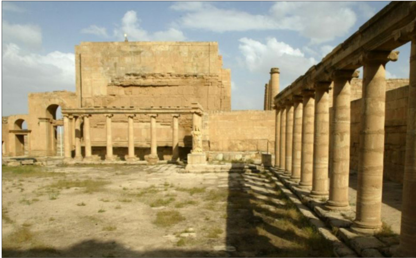
جانب من آثار نينوى

أبريل الماضي في بغداد وقعت اليونسكو والإمارات العربية المتحدة 2014 و2017، حيث تم تدمير الآثار والمواقع التاريخية بشكل منهجي في العراق. وأشار إرنستو أوتوني-راميريز، المدير العام المساعد للثقافة في اليونسكو، إلى أن المجتمع الدولي يتحمل مسؤولية العدم الذي لحق بالآثار العراقية في أعقاب إعمار العراق وإنعاشه. وأن مؤشرات الدعم الأولية إيجابية بالفعل". وفي شهر