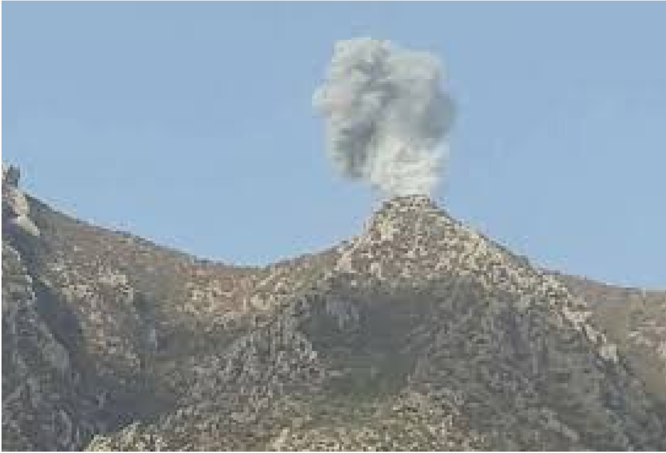
قصف تركي لقرى حدودية مع إقليم كردستان