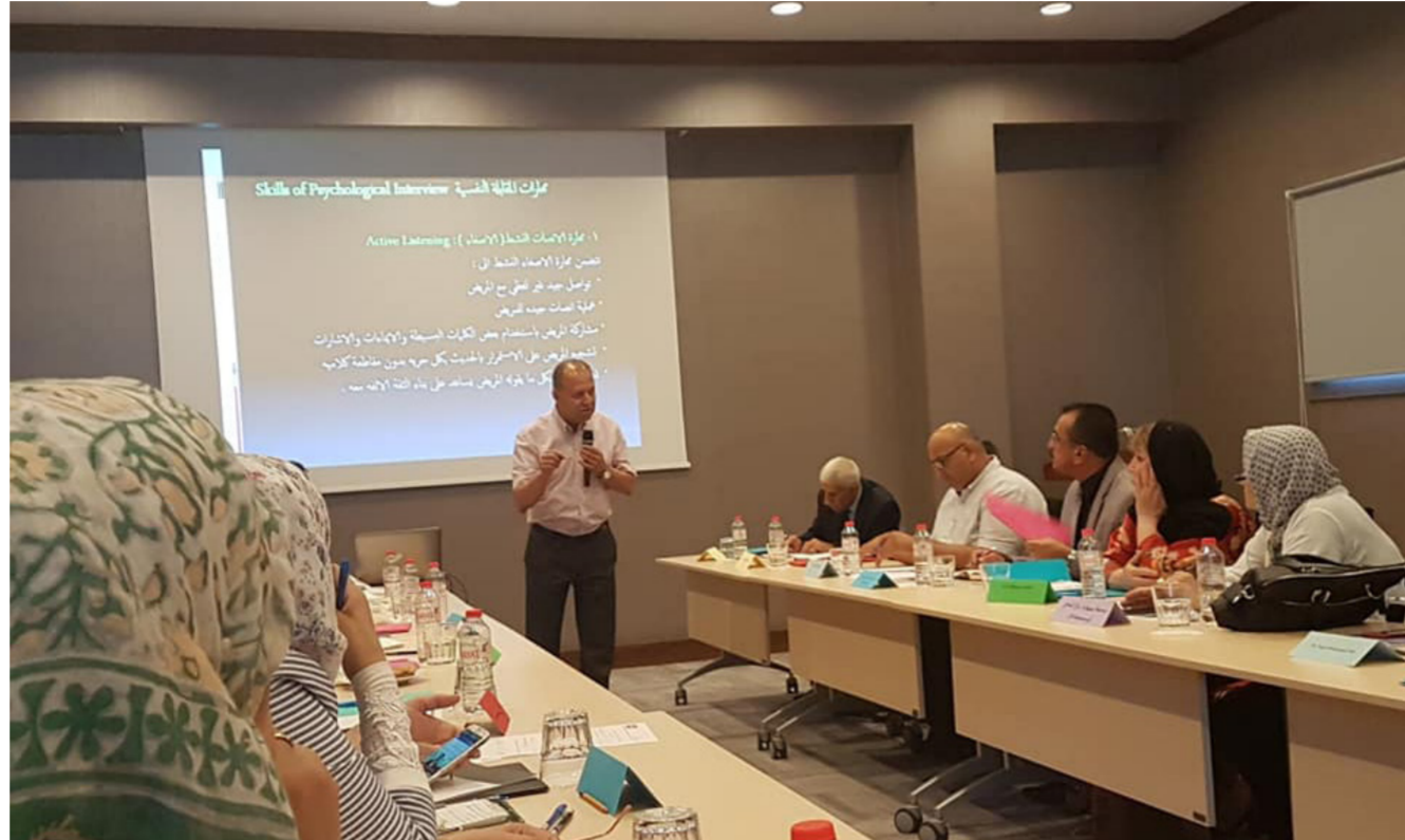
جانب من مشاركة التدريسيات في الدورة التدريبية في مدينة اسطنبول التركية

إن الهدف من المشاركة في الدورة هو تعليم وتدريبات التدريسيات في المركز على المهارات العلاجية الحديثة وزيادة الخبرات في مجال الإرشاد والعلاج النفسي