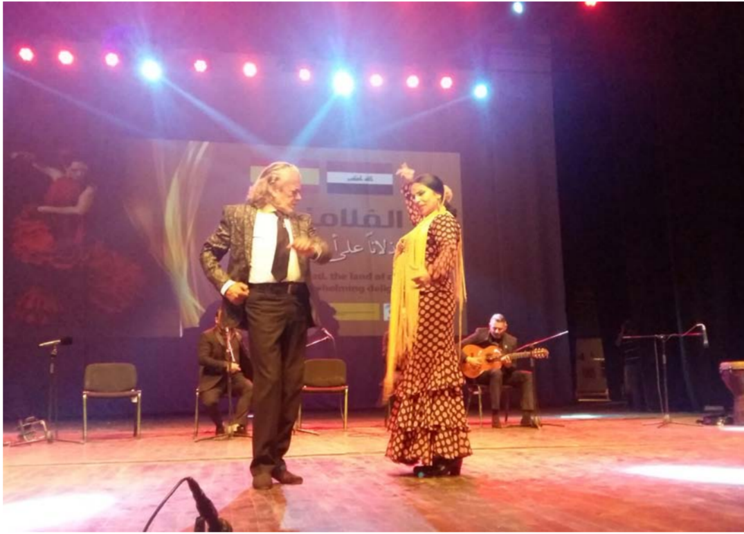
جانب من الحفل الفني

وأضاف: "لدي مشاهدات كثيرة لفن الفلامنكو من خلال مشاركتنا في المهرجانات العالمية. وبعد طقسنا ورقصا غجريا يعتمد على النقر بالأرجل. مستوحى من مصارعة الثيران التي تشتهر بها اسبانيا. أفرحنى تفاعل الجمهور الغفير. وهو جمهور راق يحب الحياة. هذه الخطوات مهمة جدا. وتساعد على تواصل العلاقات بين الشعوب. وتتمنى مشاهدة فعاليات لدول اخرى عربية وعالية تعكس ثقافة ورفي شعوب هذه الدول".