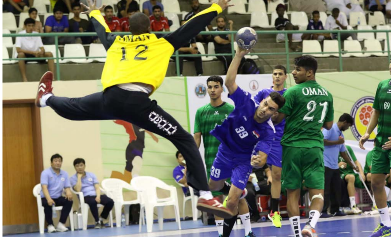
جانب من المباراة

وفي شوط المباراة الثاني وبعد التغييرات التي أحدثها المدرب خالد عدنان قدم منتخبنا الشبابي مستوى مغايراً عن ما قدمه في الشوط الأول وأخذ زمام المبادرة وتكمن من معادلة النتيجة في الدقائق الخمس الأولى وبعد ثلاث دقائق وسع الفرق إلى ثلاث أهداف 20 مقابل 17 وكان اللعب الجماعي وإنهاء الهجمات بصورة صحيحة السمة الأبرز للفريق في هذا