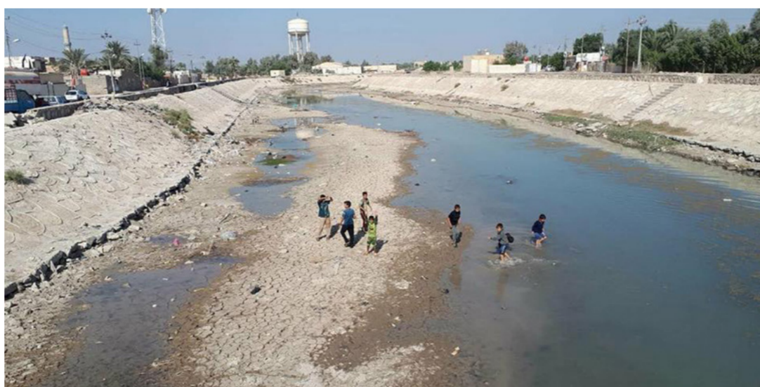
المياه بسبب الأحداث الأخيرة التي تشهدها المحافظات الجنوبية . على صعيد متصل أكد الوكيل الفني للوزارة الدكتور مهدي

وأشار الوزير الى منع الفلاحين من زراعة الرز والذرة الصفراء والذخن وتنزيل الخنطة والشعير والخضروات الى النصف بسبب شحة المياه . مؤكداً على زيادة الإطلاقات المائية من سددي حديثة والموصل الى المحافظات الأخرى من أجل انتهاء معاناة الاهالي لكنه سيؤثر على الخطة الزراعية الشتوية للموسم المقبل . ودعا الوزير الحكومة التركية الى خديد جزء من البليغ الذي تبرعت به في مؤتمر الكويت الى تقنات الري بالطرق الحديثة الذي يعود بالفائدة الاقتصادية للعراق. وأوضح السفير الضيف انه سينقل معاناة شحة المياه الى الحكومة التركية للنظر فيها وإيجاد الحلول المناسبة التي لا تؤثر على البلدين الصديقين . مشيراً الى تقديم طلب للحكومة التركية لتاجيل خزن