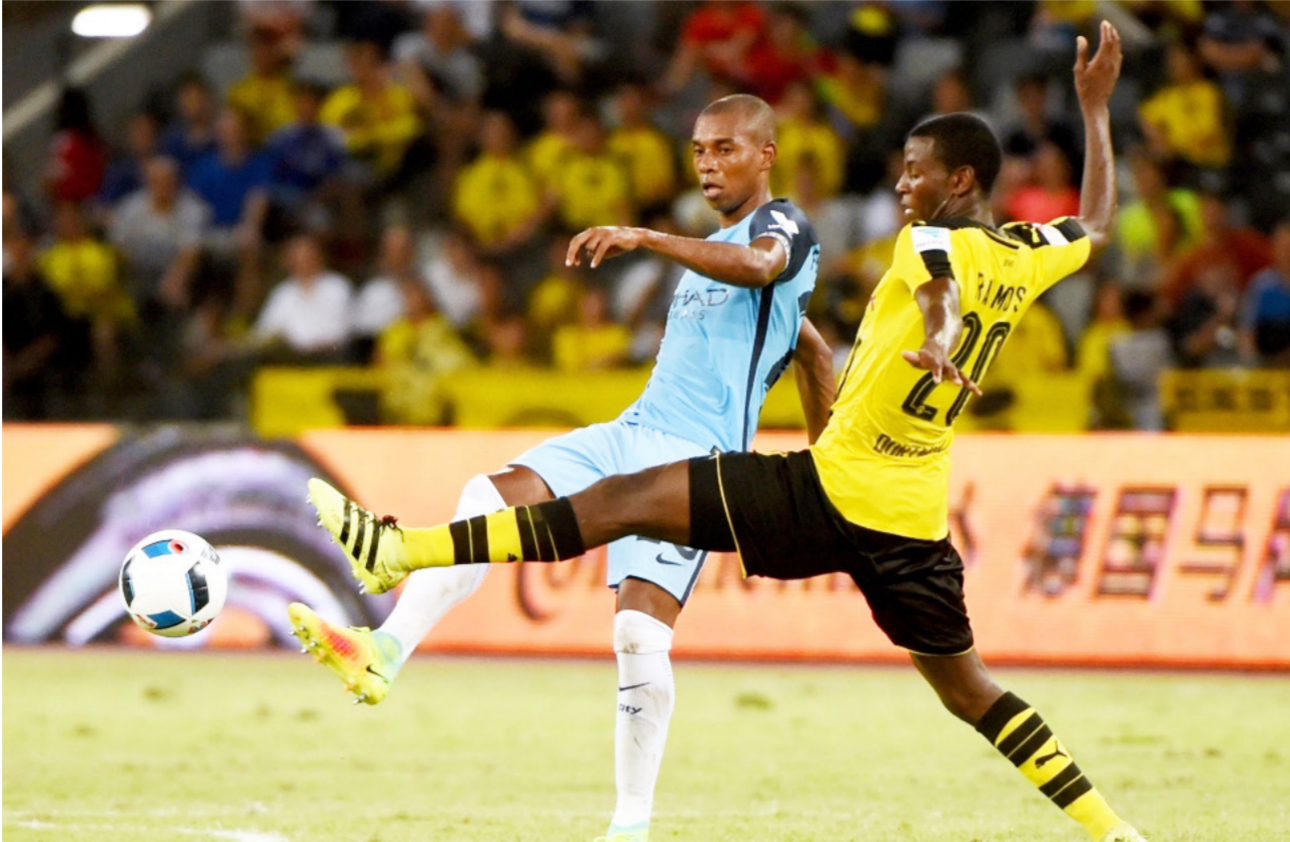
صراع على الكرة في مباراة دورتموند ومانشستر سيتي

أما ألمانيا فتشارك بفريقي (بايرن ميونخ وبيوروسيا دورتموند). وكذلك فرنسا (باريس سان جيرمان ولبون)، بينما يمثل البرتغال فريق واحد فقط هو بنفيكا.